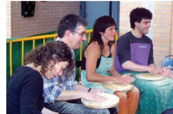
Taldea, sagardoaren osagarri bikaina.