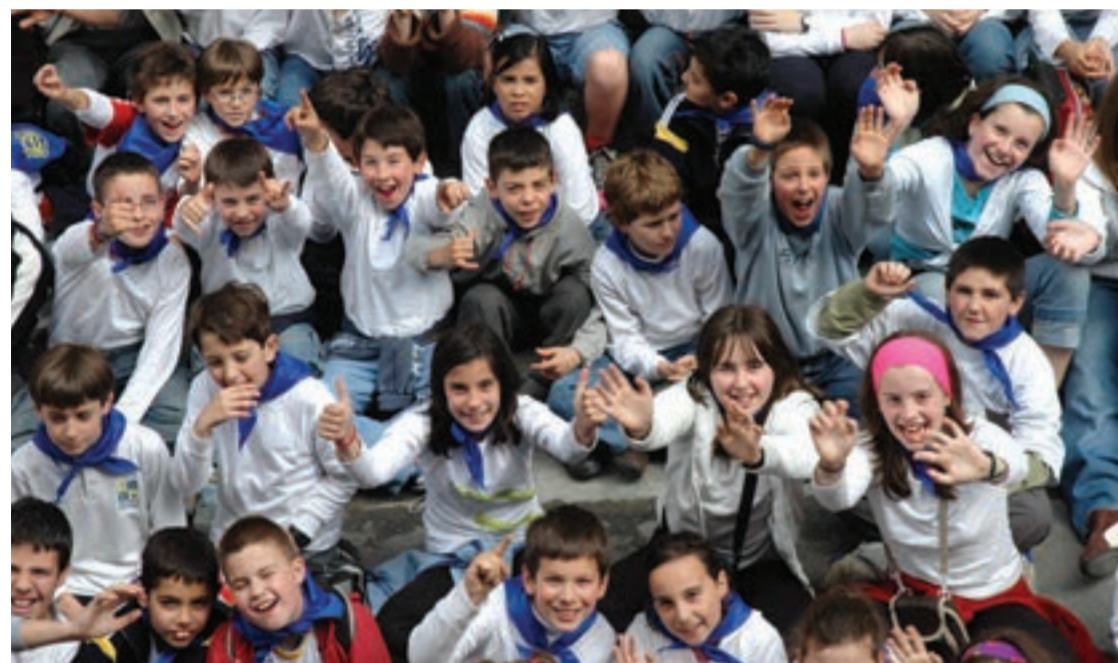
Haurrak jala noiz hasiko zain zeude Zumean.