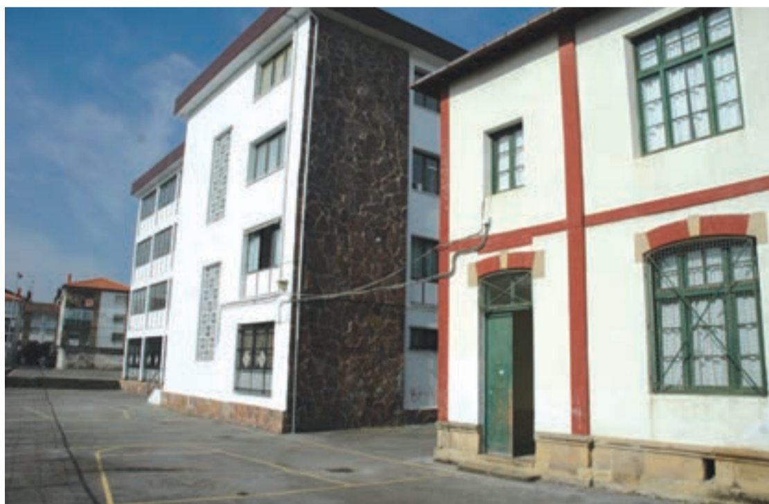
Egape ikastolaren aspaldiko eskakizuna da eraikin berria.

Horren haritik, Mariasek gogoratzen duenez, "pilota Udalaren teilatuan dago". Hain zuzen, proiektua errealitate bilakatzeke, lehenik, Udalak lursailak erosi behar ditu. Gero, Eusko Jaurlaritzari ikastola be-