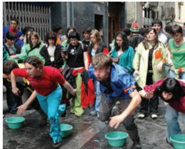
Koadrilen egunean egoera xebebreak aurki daitezke.