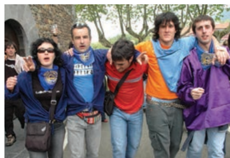
Jai giro ederrean igaro zuten arratsaldeko koadrilen eguneko partaideak.