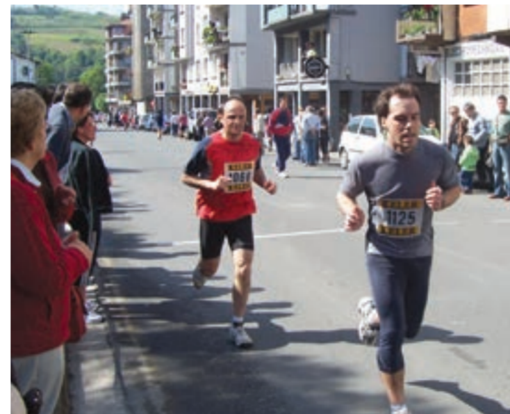
Emakume gutxi aurtengo krosean.