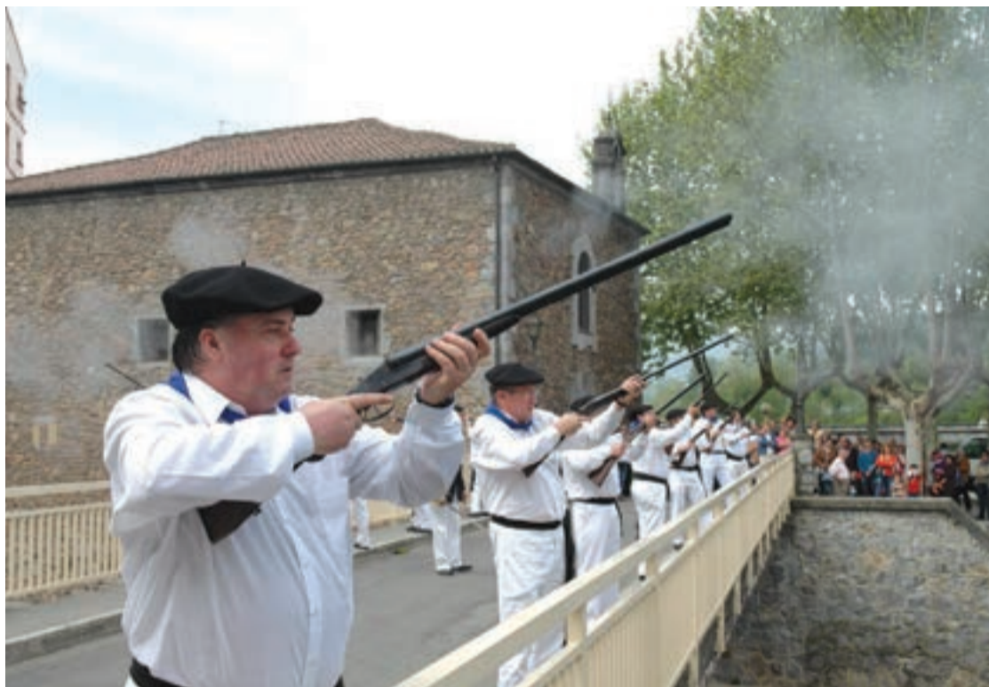
Ikurriaren jaitsiera, pailazoen emanaldia, perkusio kalejira eta sardin jatea Santakruzetako azken egunean.

Estrainekoz egin den kantu kalejirak partaide kopuru txukuna bildu zuen. Sagardo dastaketan edota goitibehera jaitsieran ere ehunka herritar bildu zen. Gauez, taberna inguruan jende gutxiago sumatu dela esaten zuten gremiokideek. Parrandan aritu zirenak, bederen, goizalderarte ibili ziren ostiraletik igandera. Koadrilen egunean giro polita sortu zen, maiatzaren lehenera asko eta asko nekeak jota iritsi baziren ere.