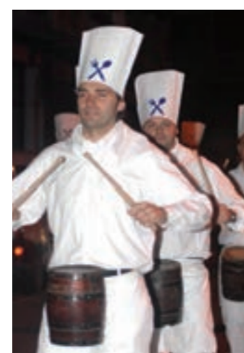
Danborrada, tradizio handikoa herrian.