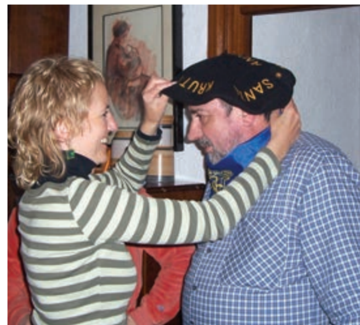
Hunkiturik agertu zen aurtengo pregollaria.