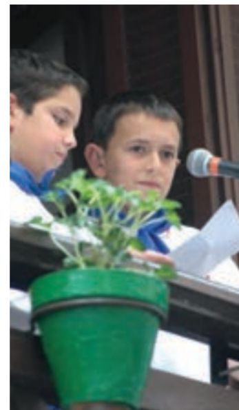
Santakruzak iragartzeko unea.