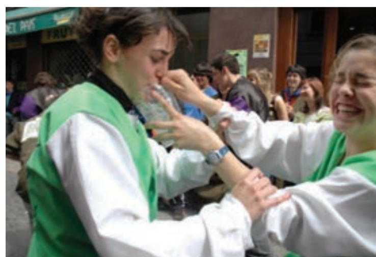
Irri eta jolasa, jaiak irauten duen bitartean.