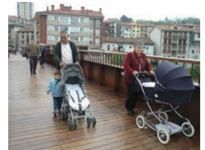
Apirilaren 28ko batzarraldiaren ostean ireki zen oinezkoentzat.

Sorabilla-Errotagain auzoko bizilagunak izan ziren berriro ere batzarraldiko protagonista. Batzarraldia amaituta hartu zuten hitza auzoko bizilagunek. Denbora luzea daramate auzo eta herrigunea banatzen dituen errepidean oinezkoentzako pasabide egoki bat eskatuz eta erantzun baten bila hurbildu ziren udaletxera. Eztabaida luze baten ondoren, akordio batera iritsi ziren: Foru Aldun-