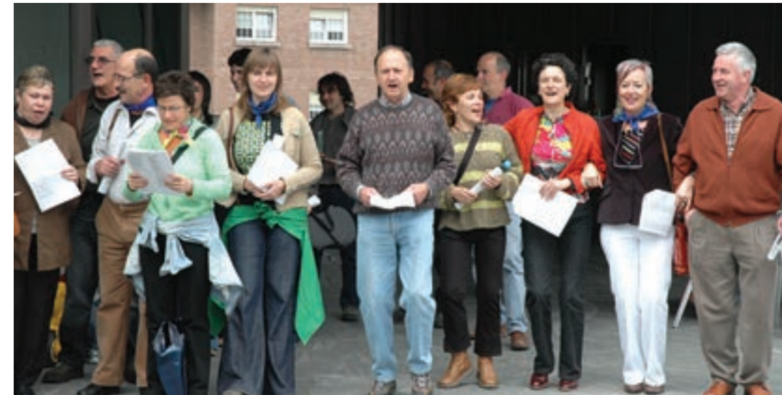
Kantu kalejira, ekimen berria Santakruzetzan. Txalotzeko modukoa, datorren urtean ere bai!