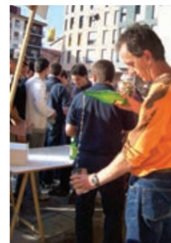
Sagardo dastaketan Urnieta garaila.