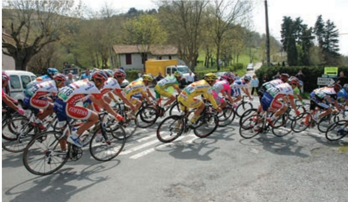
Abiadura bizian igaro ziren profesional mailako txirrindulariak.

Hala ere, etapa bertatik igarotzeak ez zuen ikusmin handirik piztu. Ikusi zutenek telebista bidez jarraituko zuten lasterketa. Hain zuzen, telebistan ikuskizuna patxadaz jarrai daiteke baina bide ertzezera aterata, begiak itxi eta ireki orduko igarotzen dira txirrindulariak. Xoxoka gainean bezala, ziztu bizian. Argazki kameraren objektiboen begirada zorrotze-