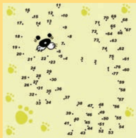
Kolorezta itzazu atal puntudunak eta marrazki bitxia azalduko da.