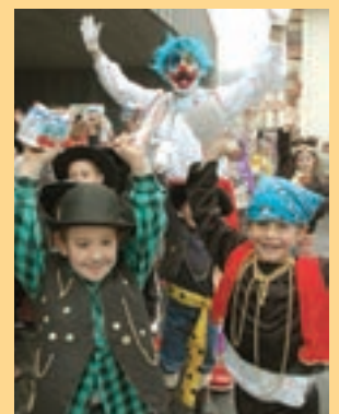
Giro ederra sortu zen kanpoaldean.