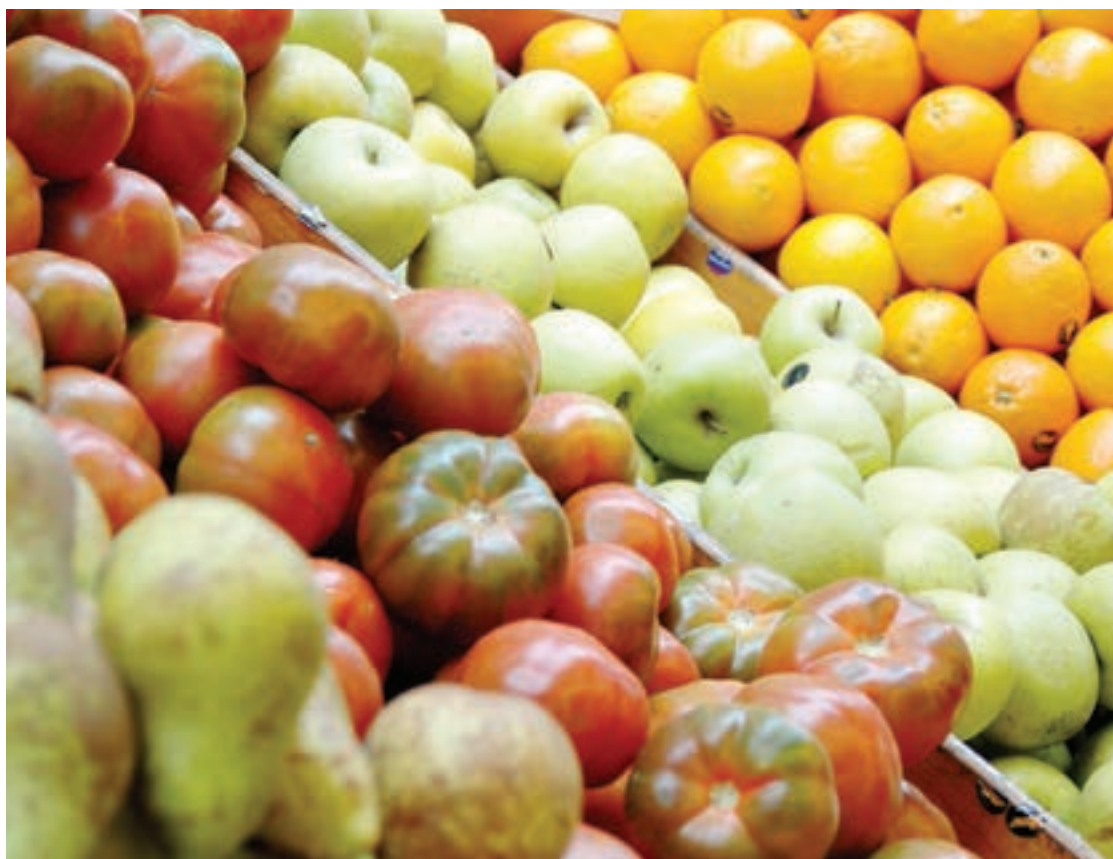
Fruta eta berdura dendetan egunero-egunero zaharra kendu eta berria jartzen dute aukeran.

Garaian garaiko produktua nahi izaten du jendeak, eta ahal bada bertakoa. Negu garaian gehien erosten direnak dira laranjak, platanok, azel-