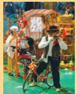
Haurrak ere taulagainean.