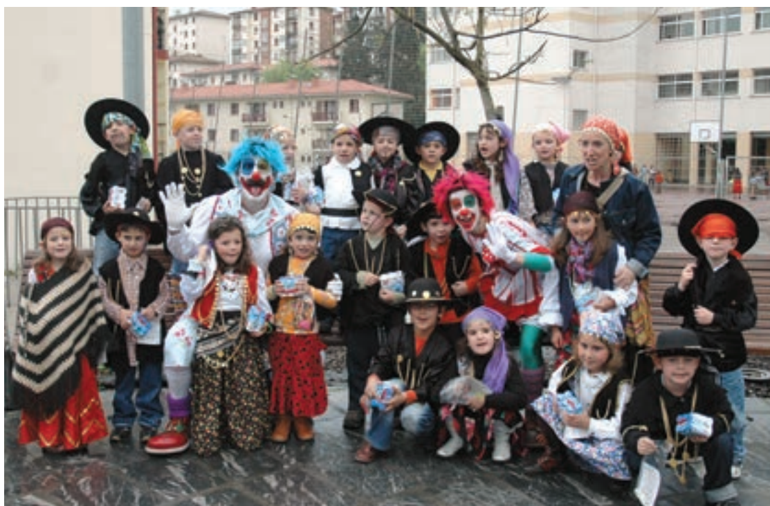
Egape ikastolako haurrak lagun egin zituzten Pirritx eta Porrotx pailazoen. DVD-a udazkenean argitaratuko da.

Arratsaldean, Andoingo Aita Larramendi ikastolatik eta La Salle-Berrozpe ikastetxetik etorritako bostehun haur hurbildu ziren Basterora. Giro ederra sortu zen bazkalosteko