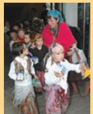
La Salleko ikasleak.