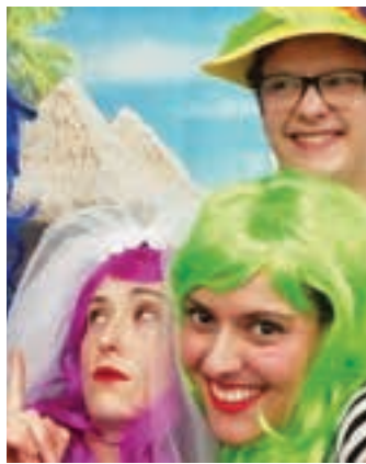
Aktore taldea. EGAPEXOU

Osoigo izeneko plataforma digitala Zarautzen sortu zen, eta dagoeneko Espainia osoko erakundeetako ordezkari zuzendutako ekimenak bideratzen dituzte. Besteak beste, minbiaren prebentzioaren harira, galdera bana igorri die Catalunya edota Madrileko erkidegoetako ordezkari.