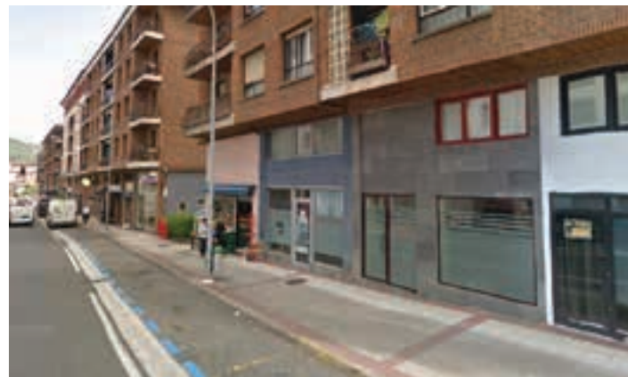
Idiazabal kalea.