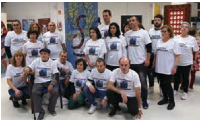
Nieblatarrak, iazko abenduan ateratako argazkian.