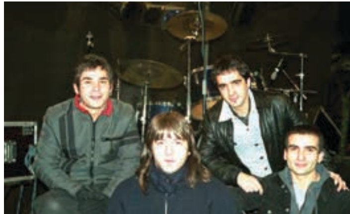
Lorelei taldea, artxiboko irudian. CORREO