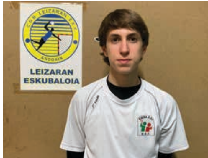
Egaña andoaindarra, euskal selekzioko elastikoarekin. AIURRI

Espainiako selekzio autonomikoek leku bat aukeratzeko dute talde guztiak elkartzeko, eta, bertan, taldeen artean zozketa bidez nork noren aurka jokatuko duen aukeratzeko da. Talde horien artean Espainiako Kopa