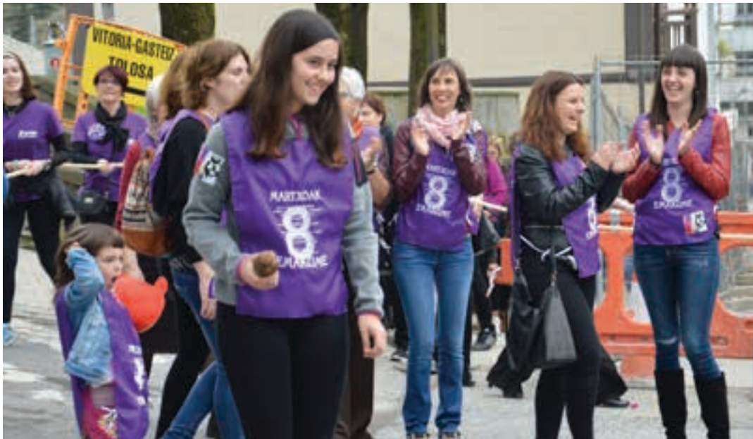
lazo edizioko kalejira, Andoaingo kaleetan barrena.

Alor ezberdinetan nabarmendu diren herriko emakumeak eta elkarteak omentzeko "Martxoak 8 emakume" egitasmoa berrabiarazi nahi du Andoaingo Udaleko Berdintasun sailak. Bilera irekia antolatu dute Urigainen, ostegunean 18:00tan hasita