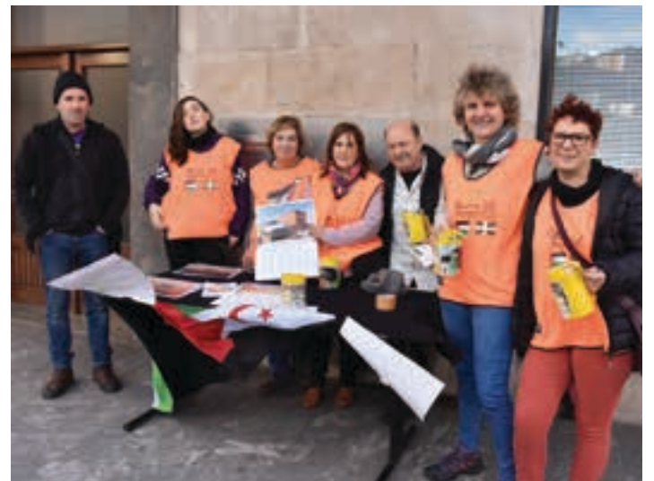
Hurria-Sahara elkarteko kideak, aurtengo kanpainan. AIURRI

Sahara herrialdeko gaztakaren jatorria gogorarazi du Koordinakundeak, historian atzera eginez: "1975ean Madrilgo gobernuak Marokoren eta Mauritaniaren artean banatu zuen Mendebaldeko Sahara. Urte bereko urrian, Marokok "Martxa berdea" izeneko jarri zuen abian. Horrelaxe hasi zen, Maroko eta Mauritaniaren aldetiko inbasio militarra eta, horren ondorioz, saharar herritar askoren ihesaldia, marokoar hegazkinek jaurtitako napalm eta fosforo zuriaren pean. Egoera horretan, Fronte Polisarioak aurre egin zion Marokor okupazioari eta herritarren ihesaldia antolatzeaz gain, errefuxiatuak