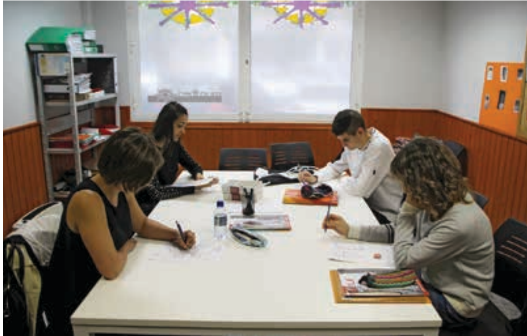
Euskaltegiatako ikasleak, apunte artean, ikasturte amaierako azterketarako prestatzen. BURUNTZALDEKO UDALAK

Eskolez gain, beste alderdi praktikoagoa ere eskaintzen