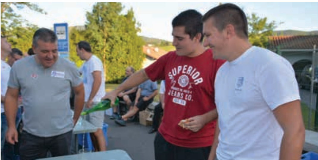
Sagardo dastaketan, batzuk zerbitzen, besteak dastatzen. AIURRI