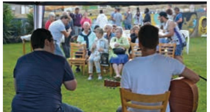
Sorabillako Harrera Etxeak ate irekien jai ospatu zuen larunbatean.