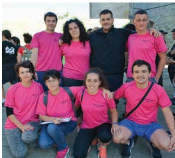
Buruntza taldeak bigarren urtez lortu du ligako txapelketa. AIURRI