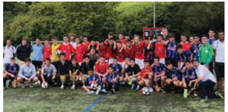
Ostadar eta Hernani taldeak gonbidatu zituzten aurtengo Ricard-Begristain memorialera. Larunbat goizean jokatu zen, eta arratsaldean Urnieta KE-k denboraldi berriaren aurkezpen ekitaldia egin zuen. UKE