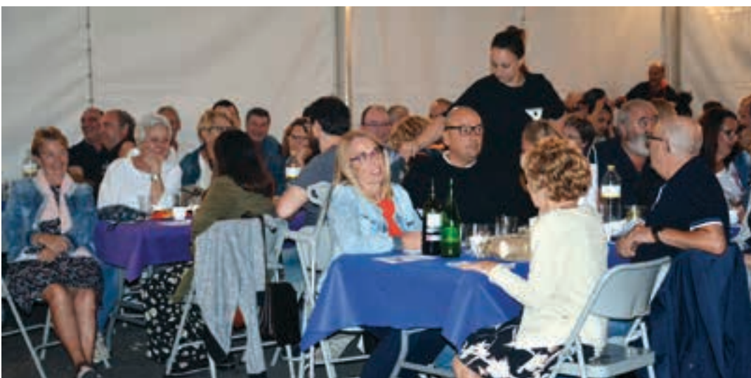
Zikiri jatea beti izaten da arrakastatsua Sorabillan. AIURRI