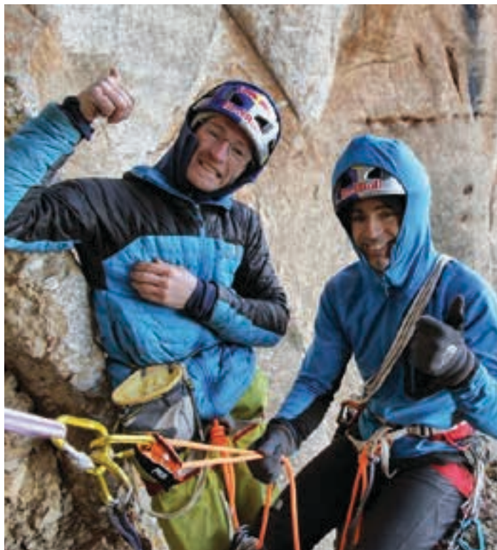
Puntako kirolariekin egoteko aukera paregabea izango da Urnietan. FILMUT.COM

Mallorca, egun urteko hilabete gehienak Mallorcan pasatzen dituztelako. Uharte hartan eskalatzen hasi, eta eskualde aberatsa zela jabetu ziren bi anaiak. Bikotea ere badute, eta Euskal Herrira udan bakarrik etortzen dira, Mallorca beroak eta turista oldeek hartzen dutenean. Andeak eta Himalaia, euren mendi ibilbidean gehien ibili diren mendikateak direlako. Ez alferrik, egin dituzten azken igoera berriak Andeetan egin dituzte, Peruko Cordillera Blan- can, hain zuzen ere.