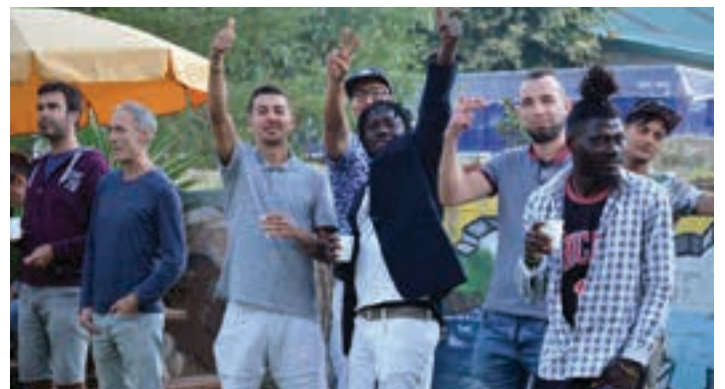
Harrera etxera hurbildu ziren hainbat lagun, jaiaz gozatzeko.