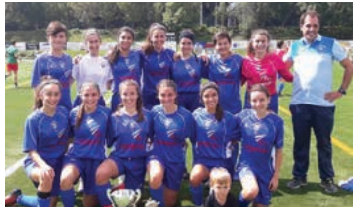
Larramendi txapelketan Euskaldunako neska eta mutilak garaile izan ziren. AIURI

Ikasturtea hastearekin batera, federatu mailako denboraldiari ere hasiera emango zaio. Asteburu honetan jokatuko dira partida asko, eta horietako batzuk Andoainen eta Urnietan. Mailari dagokionez, Euskaldunako mutilen lehen taldea eta Urnietako nesken lehen taldea maila berrian arituko dira. Eta biak ala biak etxean arituko dira, asteburu honetan. Denboraldi berriaren aurkezpen modura Larramendi txapelketa eta Ricard-Begristain memorialak jokatu ziren, aurreko asteburuan.