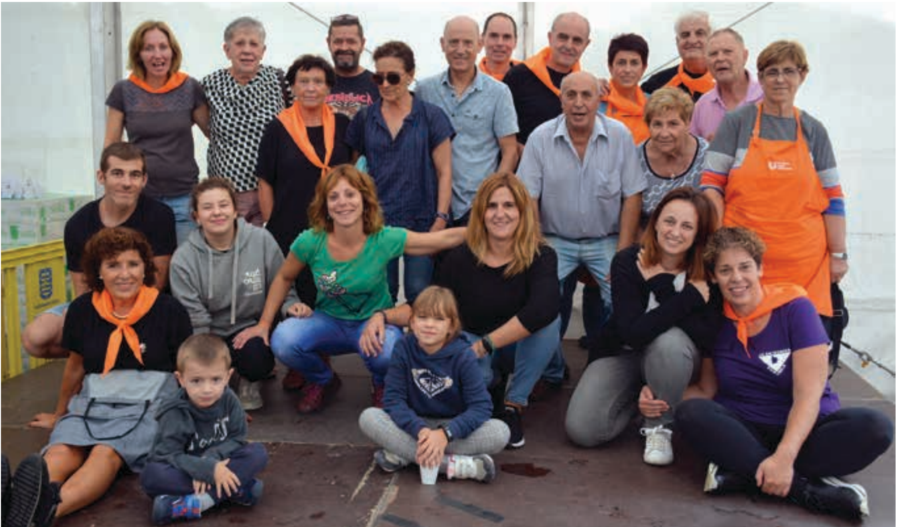
Sorabillako jaien antolakuntzan hainbat zereginetan aritu ziren zenbait herritar. AIURRI