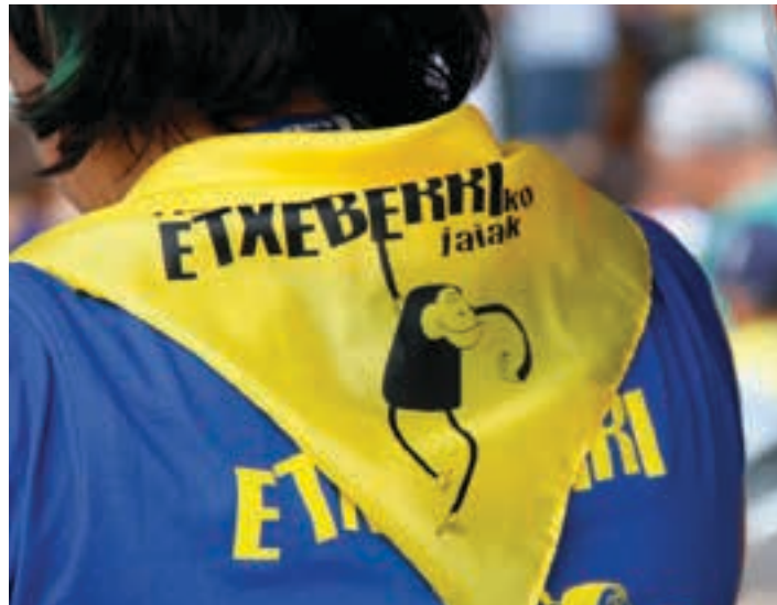
Ospakizunak ostiralean eta larunbatean izango dira. AIURRI

"47ak herrian". Busa eskualdetik: 15:30, Makaldegia. Andoain. 15:30, Matxo taberna. Urnieta.