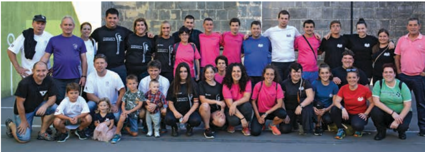
Urtean zehar auzoen arteko liga jokatu duten hainbat kirolari argazkirako bildu ziren finalaren amaieran, Sorabillako frontoian.