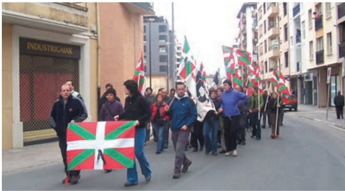
Zumea plazatik manifestazioa irten zen goizaldean. Ertzaintzarekin tira-birak izan ziren.

Arratsaldera bitarte, bederen, aparteko istilu edo iskanbilarik ez zen izan eskualdeko bi herritan.