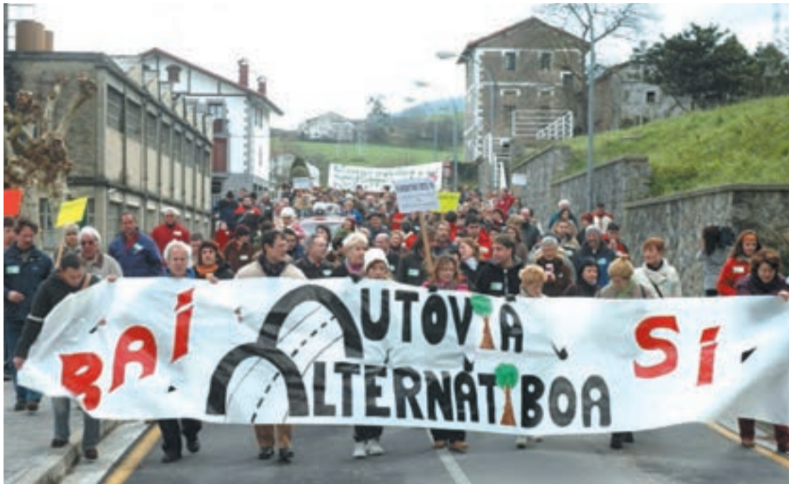
Urrietako kaleetan barrena manifestazioa egin zen aurreko igandean.