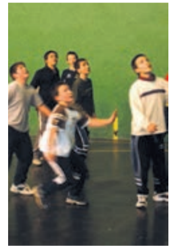
Urnietako pilotari gazteak.

U rnietako pilotalekuan aste guztian zehar izaten da mugimendua. Kategoria ezberdinetako pilotarien entrenamenduak izaten dira arratsalde eta iluntzetan. Guztira berrogeita zazpi haur eta gazte ari dira pilotan Urnietan. Gaztetxoek pilota eskolan aritzen dira, pilotaz gozatzeko eta ikasteko helburuarekin.