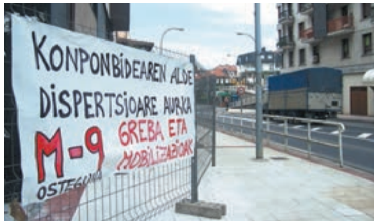
Idiazabal kalea Urnietan. Merkatalgune gehienak itxita eta enpresa asko zabalik.