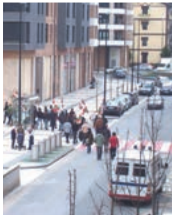
Ertzaintzak jarraipen estua egin zuen.