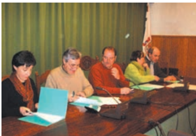
Ikastetxeko ordezkariak eta Urnietako alkatea, sinadura ekitaldian.

A urreko urteetan egin bezala, Urnietako Udalak Eskola-Kirola hitzarmena sinatu zuen herriko ikastetxe guztietako ordezkariekin. Hitzarmenaren sinadura ekitaldira Egape Ikastolako, Salesiar ikastetxeko eta