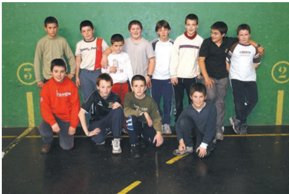
Pilota eskolako gazteenak aste honetan ateratako irudian.

"Hamairu urte betetzen dituztenean hasten dira lehiatzen. Momentu horretan pilota eskolatik UKEra pasatzen dira, txapelketa ezberdinetan parte hartzeko federatuta egon behar dutelako. UKEn hogeita zortzi pilotari ditugu orain, infantil, kadete, jubenil eta senior mailatan banatuta. Esan beharra dago senior mailako pilotariak palaz aritzen direla eta tartean, lau neska dabilzala, gomazko paletan. Gainera-