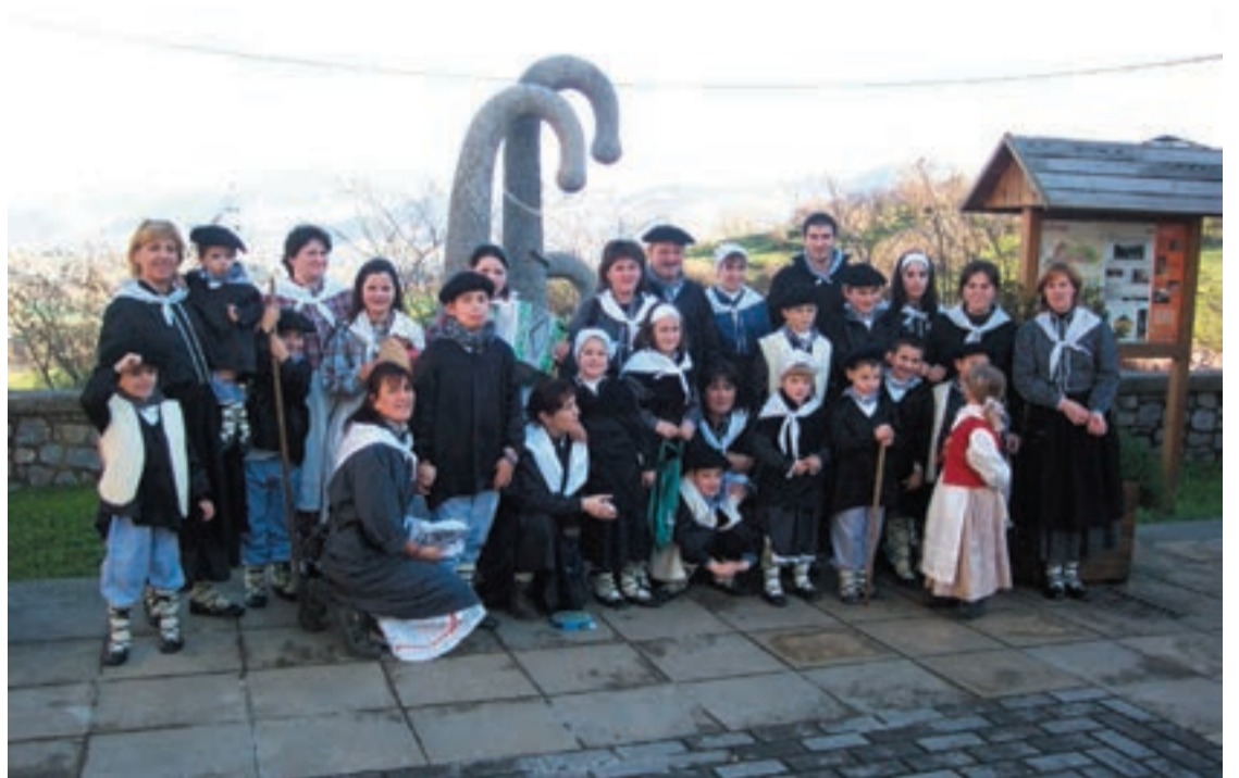
Geroz eta haur gehiago dago Larraulen. Eguberri hauetan ere kantari irtengo dira abenduaren hogeita lauan.

Manifestaldia. Aiztondo bailara giza eskubide guztien alde lemapean manifestazio isila egingo da Zizurkilgo Joxe Arregi plaza-tik Amasa-Villabonako Errebote plazara, arratsaldeko 19:00etan. Aduna, Zizurkil, Larraul, Amasa-Villabona eta Alkizako Udalen babesarekin