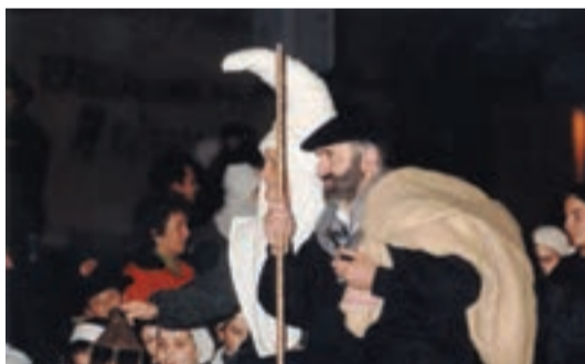
Amasa-Villabonan, Olentzaroren etorrera.

Haurrak kantari ibiliko dira goiz guztian zehar, kalez kale eta baserriz baserri