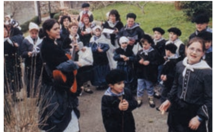
Adunan ere Olentzaro noiz etorriko zain daude haur eta gaztetxoak.

Errege magoek herria zehar- katuko dute kalejiran . 19:00