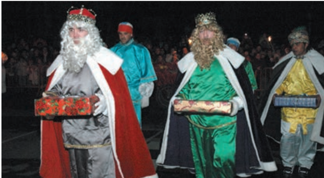
Asteasun arrakastarik handiena izan ohi du Errege Kabalgatak.