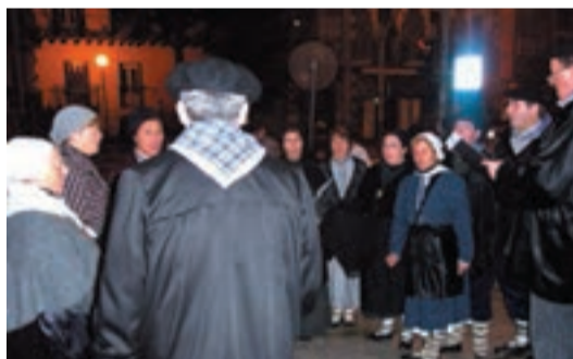
Eresagrikoak aurten ere kantari irtengo dira.