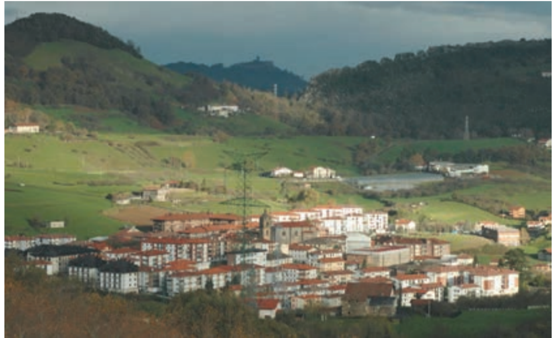
Herriko lau auzoetako baserriak aurki daitezke liburuan.

Urrietako baserrien eta etxeen argazkiak biltzen dituen liburua aurkeztuko da. Urrietako etxe eta baserriak 2005 izenburupean, herriko lau auzoetako baserriak aurki daitezke liburuan: Ergoien, Lategi, Goiburu eta Oztaran.