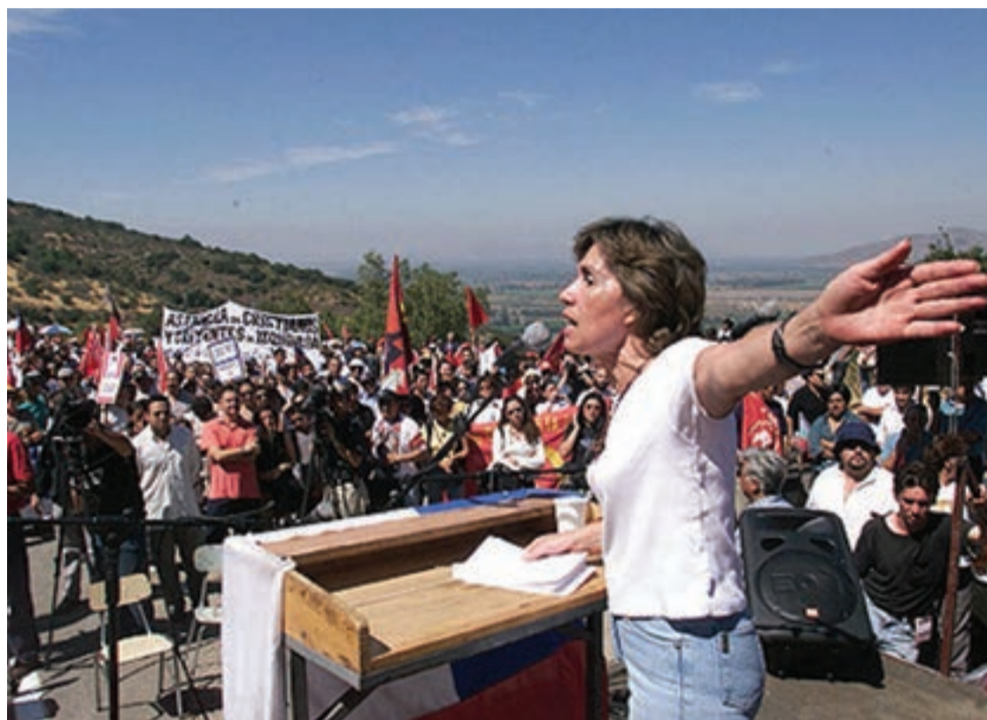
Txileko gizartea hauteskondeei begira dago azken aldi honetan.

Bidean, Joaquín Lavín ultrakontserbadorea (botoen %23'22) eta ezkerreko Juntos Podemos Más koalizioko hautagaia Tomás Hirsch (botoen %5'4) geratu dira. Lavínek iragarri du eskuin aldeko Alianzak bat egingo duela eta bigarren itzulian Piñeraren alde egingo duela lana. Ikusteko dago aliantza horrek Bachelet aurrea hartuko ote dion. Ikusteko dagoen bezala ezkerreko botoak Bacheletengana joango ote diren. Batuketak egitea ez baita hain ximplea, ez eskuintean ez ezkerrean.