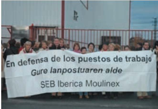
Elkarretaratzeak egiten dituzte langileek enpresaren aurrealdean.

Urrietako Moulinex enpresako langileak hainbat protesta ekitaldi burutzen ari dira azken egunetan. Gaur egungo egoerari lan irtenbide berria ematea eskatzen dute. Guztira 176 langile hartzen ditu bere baitan Moulinex lantegiak eta azken lan erregulazio planaren ondorioz horietako 76ren kanporaketa aurreikusten da. Integración de Servicios Navarros (ISN) taldeak erosi du Moulinex eta erosketa horren haritik etorri da lan erregulazio plan berria.