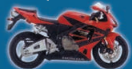
Honda CBR 600RR

Ubilluts auzoa, Pol. 56-Pº12 • 20140 Andoain Tel.: 943 591 413 / Faxa: 943 590 456