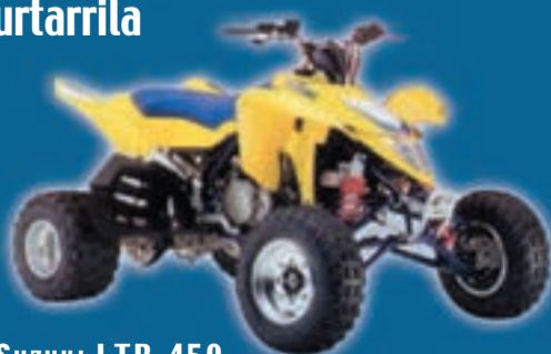
SUZUKI LTR 450