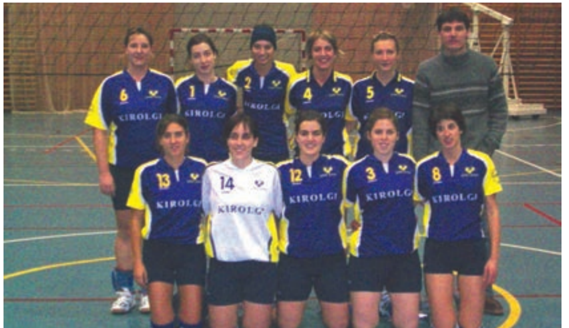
Seniorrak Kataluniako eta Aragoeko aurkariak izango dituzte abenduaren 28an jokatu den txapelketan.

Urtero bezala, Emakumezkoen Eguberrietako Txapelketa Berezia antolatu du Leitzaran Bolei Taldeak . Udaleko Kirol Sailaren babesarekin, aurtentzen Kantabriako, Kataluniako eta Aragoeko taldeak gonbidatu dituzte. Boleia maite dutenentzat edota bolea gertutik ezagutu nahi dutenentzat aparteko aukera izango da abenduaren 28an Allurralde kiroldegian.