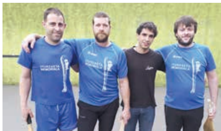
Matxete-Pakete eta Jaure-Txuri. AIURRI