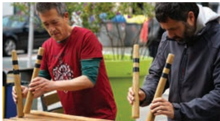
Maizorri Txalapartako kideak, jaietako emanaldian. Godoi eta Olló AIURRI