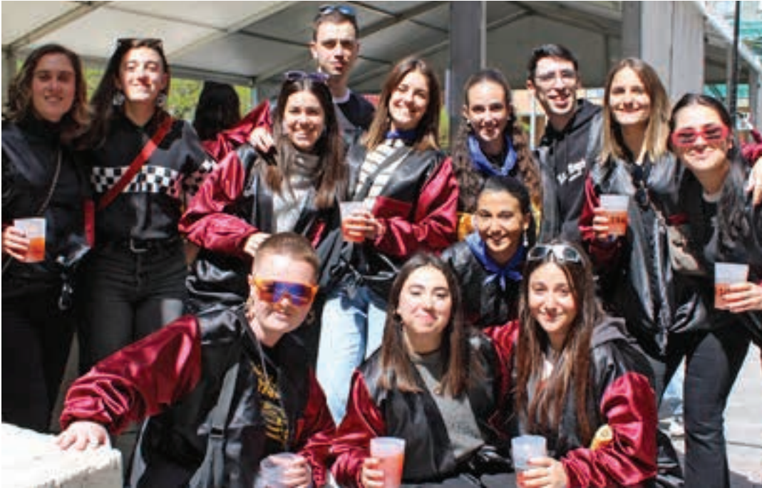
Eguzkipean ziren bazkalostean. DJ saio ibiltarian, ordea, denbora-tarte batean ederki busti ziren. AIURRI