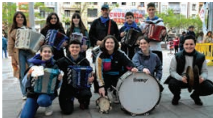
Udal musika eskolako musikariak, Zumea plazan. AIURRI