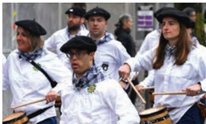
Bekoplazatik abiatu zen Herri Danborrada, hilaren lehenean.