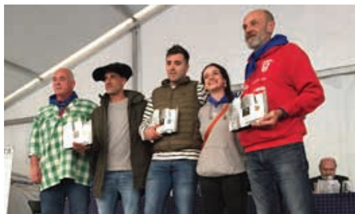
Sari-banaketa ekitaldia. AIURRI

JAI BATZORDEAREN INKESTA: Parte hartzeko, QR-an sartu.