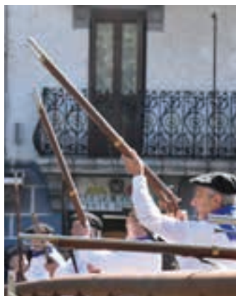
Eskopeteroen saioa, hilaren 3an. AIURRI

Ezpata dantzari hasiera eman zioten, eta, ondoren, ikurrinaren jaitsiera, meza, eskopeteroen emanaldia eta brokel dantza eskaini zuten. Herritar askok interes handiz jarraitzen duten ekitaldia da. Ordu horretan zubia eta Espigoia jaiaren erdigune bilakatu ziren. Meza amaituta, txorixo egosia eta txakolia eskaintzen ditu Jai Batzordeak. Lanez lepo izaten dira gosea eta egarria berdintzeko gogoz diren guztien eskaerak bete arte. Eguraldi bikaina izan zen.