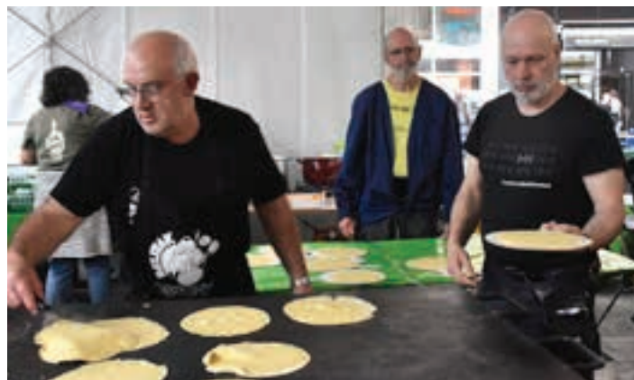
Taloa, sagardoaren osagarri bikaina. AIURRI