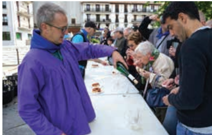
Txalokin-dastaketa Santa Krutz egunean, elizatzxoaren kanpoaldean. AIURRI