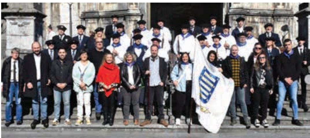
Udal Korporazioa, txistulariak eta eskopetariak Goikoplazan, banderaren jaitsierari hasiera eman aurretik.