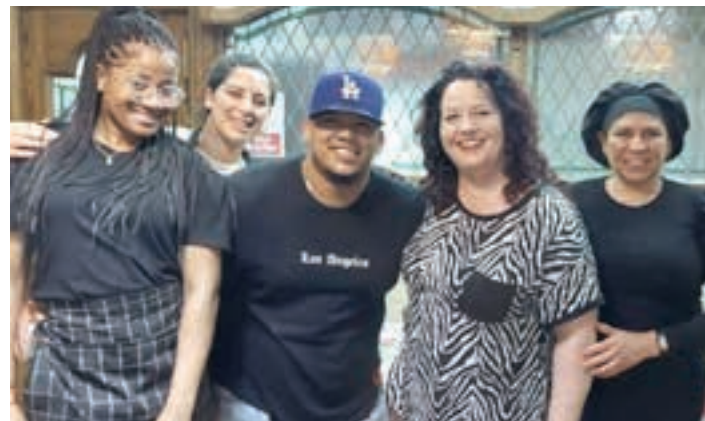
Hiru tabernako lantaldea, saridun zirela jakin berritan. AIURRI