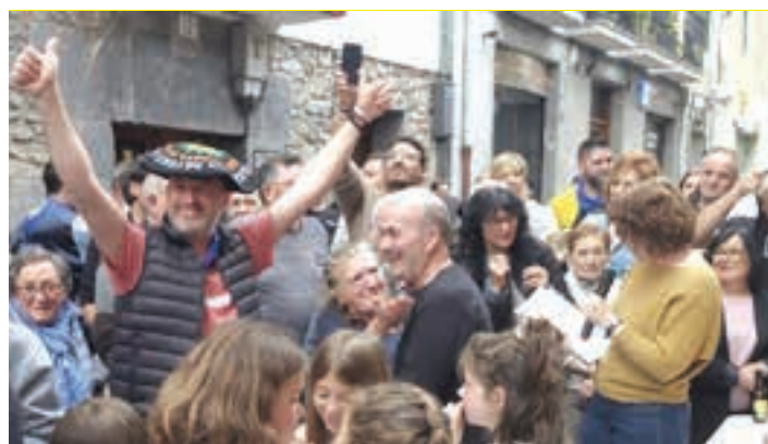
Martinezek eta Jirolek saridun izan zirela jakin zuten unea. AIURRI