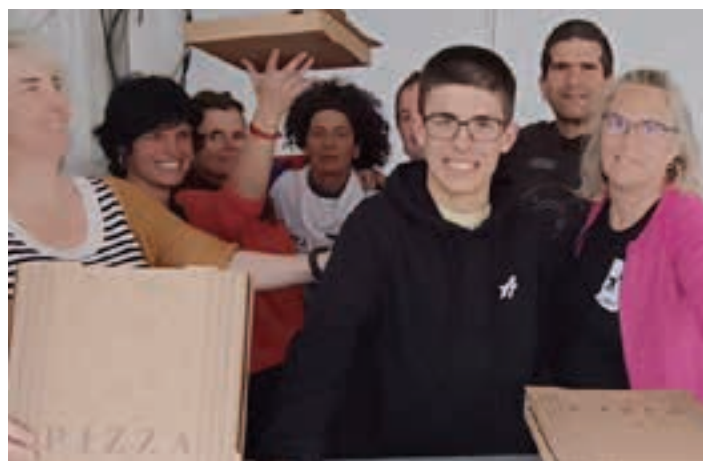
Pizzak eta kroketak aurtengo eskaintza berria txosnagunean. AIURRI