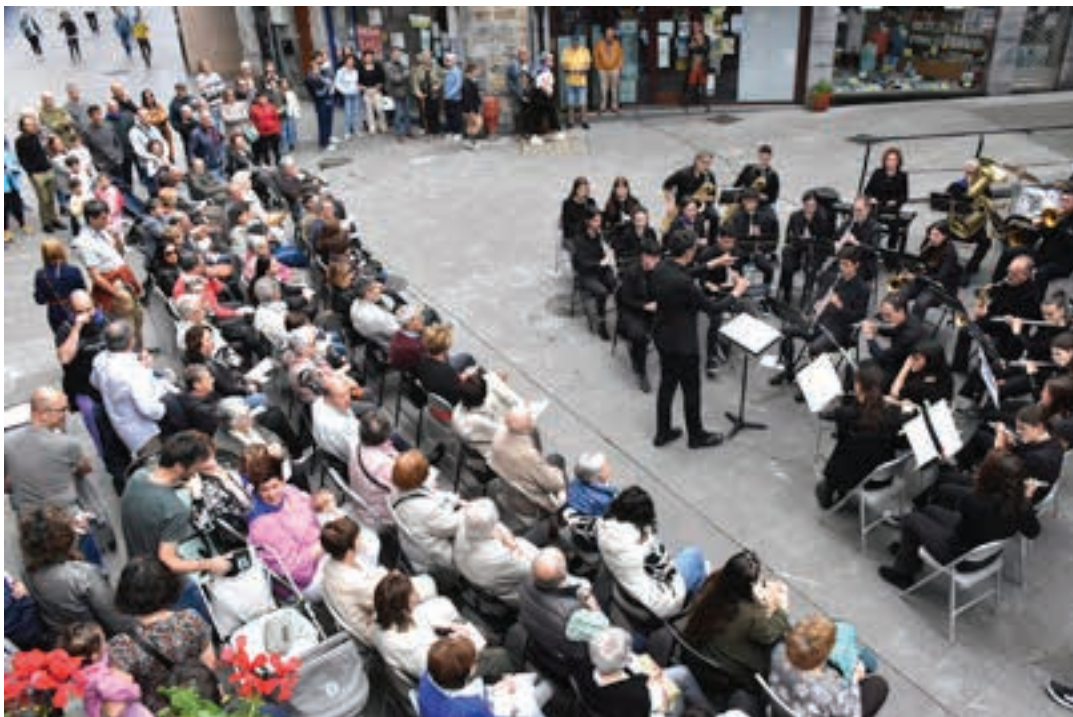
Udal Musika Eskolako Bandak emanaldia egin zuen Kale Nagusian, ZASA parean. AIURRI