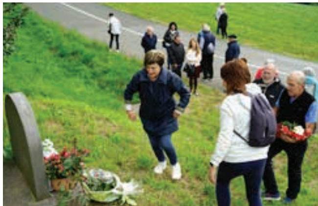
Senideak eta lagunak hurbildu ziren Azkonobieta ondoko zelaian dagoen oroitarria, loreak uztera.

Senideak eta lagunak, gertukoak zirenak, arratsaldeko seirak pasatxo zirenean elkartu ziren Azkonobieta baserriaren ondoan dagoen oroitarrian. Xoxokarako bidean da, eta hara hurbildu ziren lore-eskaintza egitera. Santa Krutz jaietan, haren gertuko eta lagunak omenaldi-ekitaldia egin zioten jaietan, eta maiatzaren 6an, 45. urteurrenean lore-eskaintza egin zuten.