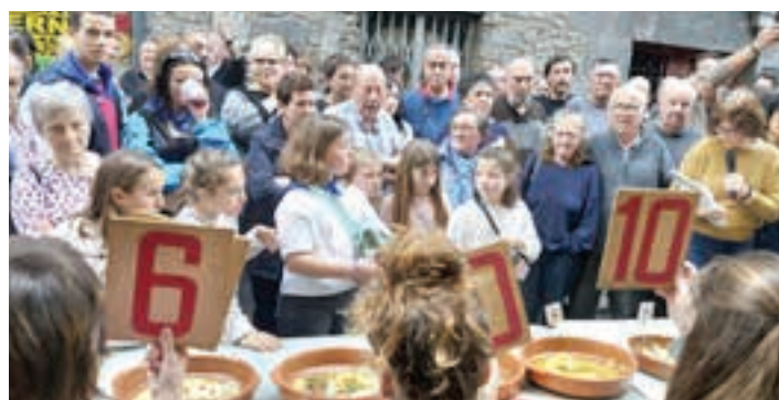
Epaimahaikideak lanean, eta ikuslegoa eta partaideak adi-adi begira.