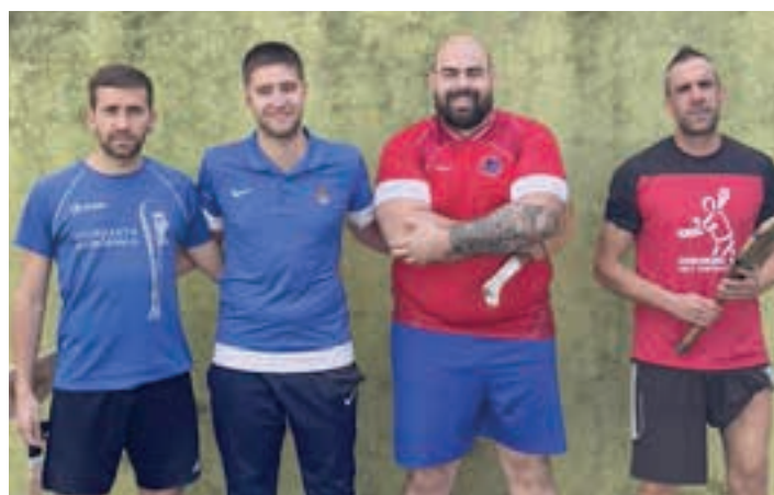
Ipintza-Gazta eta Potti-Urko. AIURRI