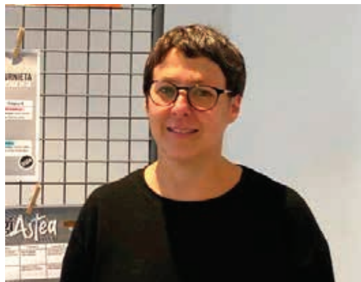
Braceras, Elkartearen Etxean, AEK euskaltegian.

Zilegi Astea antolatu du herriko AEK-k, maiatzaren 13tik 16ra bitarte, urnietar guztiei begira. Doakoa da, baina beharrezkoa da alde zuretik izena ematea