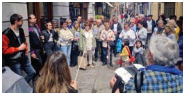
Bertsolariak eta Kantujira taldeko kideak, elkarrekin.

Aiurrik jarraipen berezia egin die jaiei, webgunean kanal berezia sortuz. Hauek eta askoz gehiago ikusgai daude.