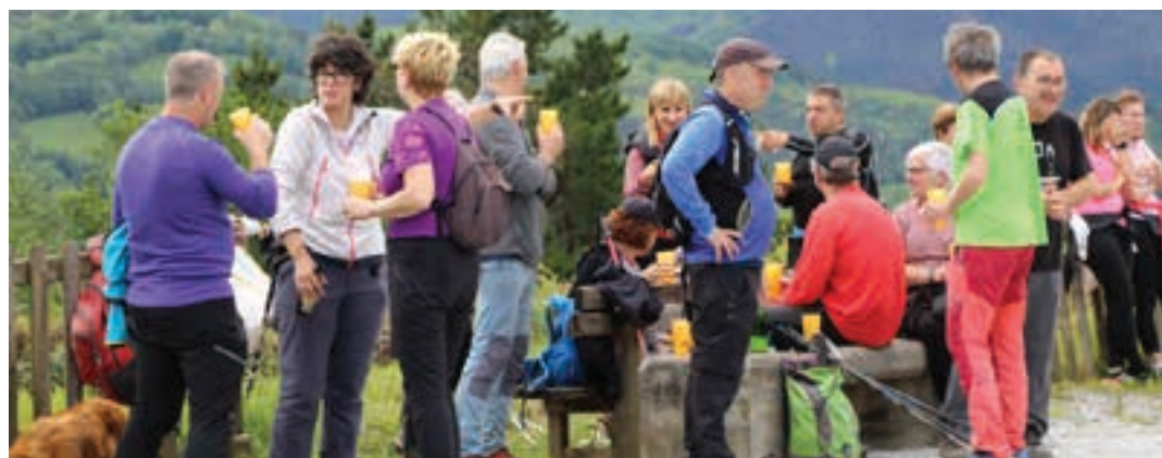
Igandean, Lasarte-Oriako Ttakun elkarteak eta Udalak antolatuta, bigarren erromeria egin zuten. TXINTXARRI