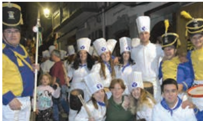
Elkartearen aurrealdean egin ohi du lehen saioa Santa Krutz Peña danborradak. AIURRI