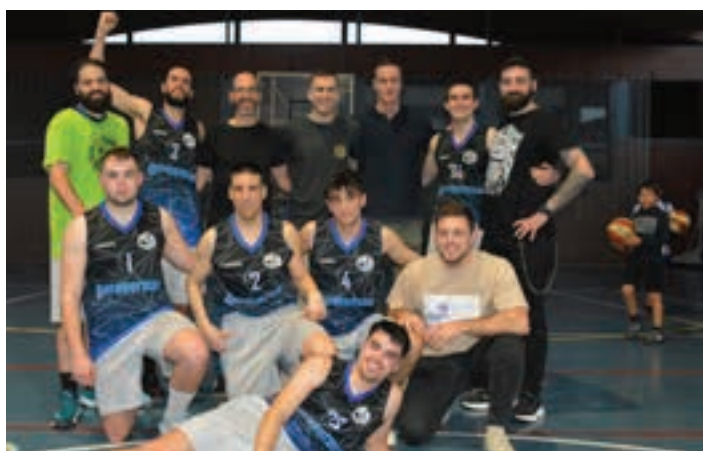
Taldekieak, partida amaitu ostean.

Gauzak horrela, festa galanta piztu zen Allurralden, 60-58ko azken emaitzaren ostean. Bandako kideek harmailetatik kanxara jauzi egin, eta jokalariekin bat egin zuten. Horra irudi politak, betirako geratuko direnak, kirolarien eta zaletuen artean sor daitekeen komplizitatea islatzen dutenak, eta hori, nahiz eta ez izan futbola, eta nahiz eta hirugarren mailako talde xume bat egon tarteko. Ospakizuna Aiurri.eus gunean ikus daiteke, bideoan.