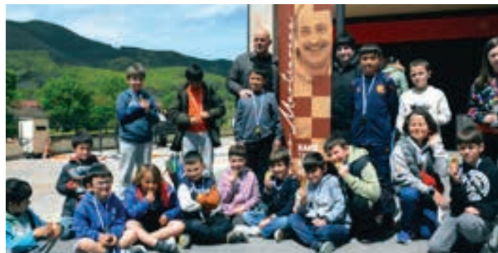
Xake jokalariek gazteak, Martiarenaren omenezko txapelketan. AIURRI