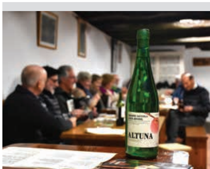
Aiurrik eta Kantazaunek kantu-afaria antolatatu zuen Altunan, urtarrilean. AIURRI

Ikaragarria da, bai. Arratsalde batean pasa nintzen Hernani barrutik, eta ez sinestekoa da ze jendetza ibiltzen den. Sagardotegira etortzeko toki onetakoa bihurtzen ari da Urnieta, gero jende ia guztia Hernanira joaten delako parranda egitera. Gurera eta herriko beste sagardotegira etortzen direnek sosak uzten dituzte herrian, izan atariko poteoan, edo ondorengo kafe eta edariekin, eta horrek balioa ematen dio herriari.