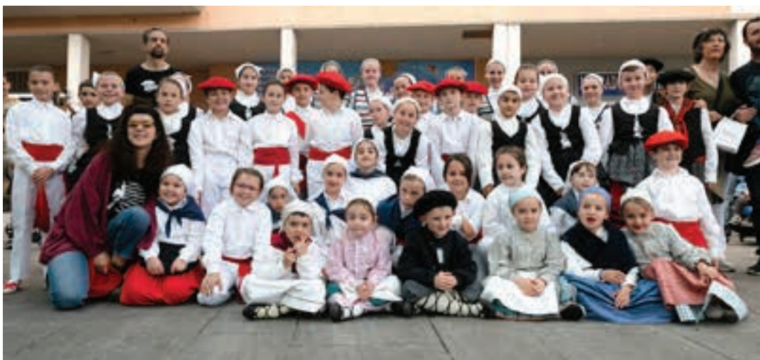
Urki dantza taldeak emanaldia eskaini zuen igande goizean.