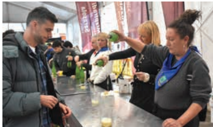
Gaztañagako sagardoa banatu zuten postua. AIURRI