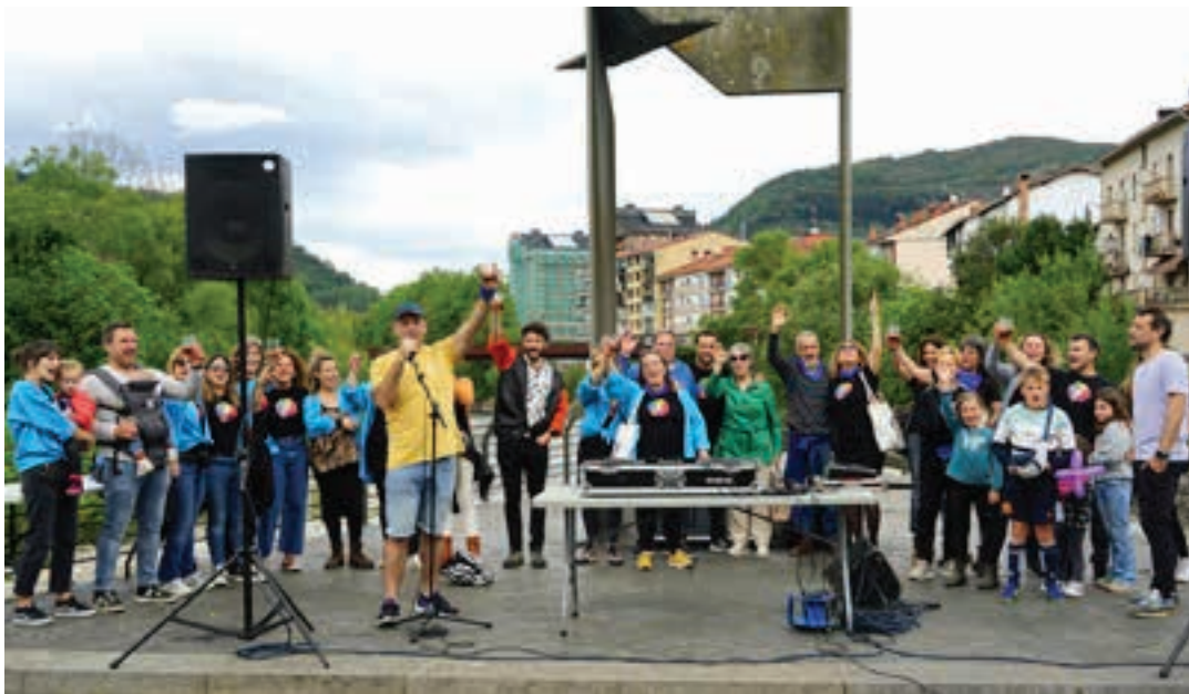
Aitziber Ugartemendiaren alde topa egin zuten, igandean. Bermouth musikatuan izan zen, DJ Ezeikielen saioaren aurretik. AIURRI