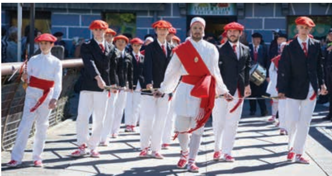
Urki dantza taldeko kideak, Santa Krutz eguneko ezpata-dantzan. AIURRI