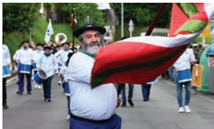
Kaleberrian gora aritu ondoren, Kale Nagusian behera ibili ziren. AIURRI