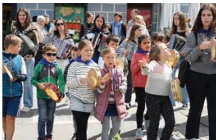
Andoaingo trikitilarien kalejira, jaietan.