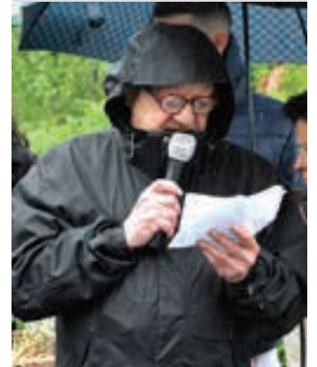
Idatzia irakurri zuten. AIURRI

Adiskide batek Espigoian bertan honako adierazpen hau egin zuen: "Bi ibai hauen elkargunean, atzo izandako amets baten berri eman nahi nikek. Bertan, mutil kuadrilla bat azaltzen dek ikastolatik plazarantz. Poltsikotik pilota bat atera eta hasten dituk jolasean udaletxe azpiko frontisean, txokotan eta binaka.