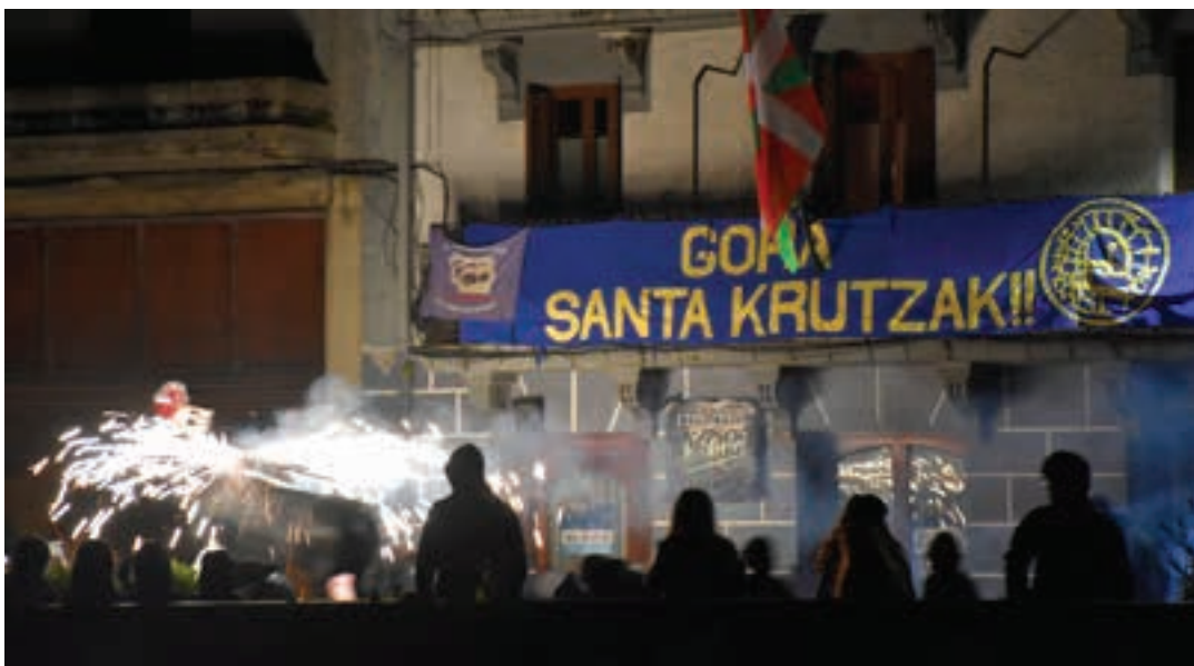
Zezen-suzkoa Zubiaurre etxearen parean. Jendetza elkartu zen astearte gauetz. Gutxixeago, igandean. AIURRI