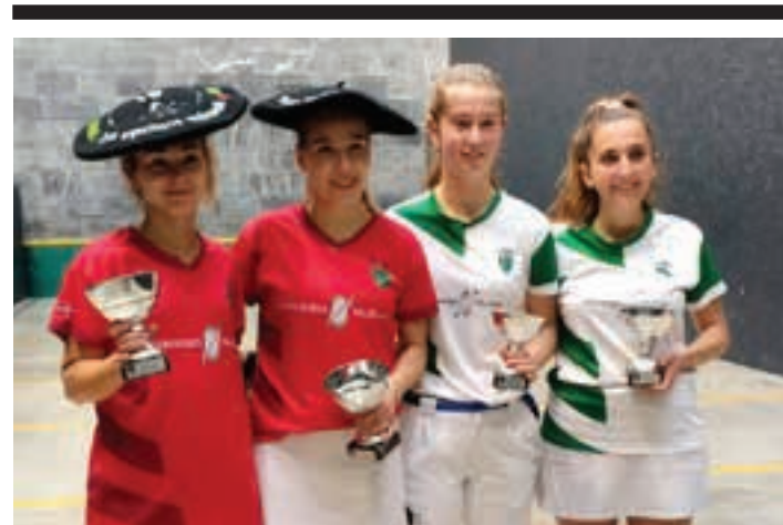
GIPUZKOAKO EUSKAL PILOTA FEDERAZIOA