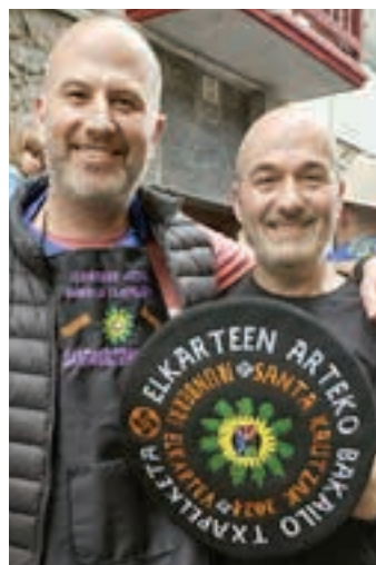
1. Hogar Extremeño. AIURRI