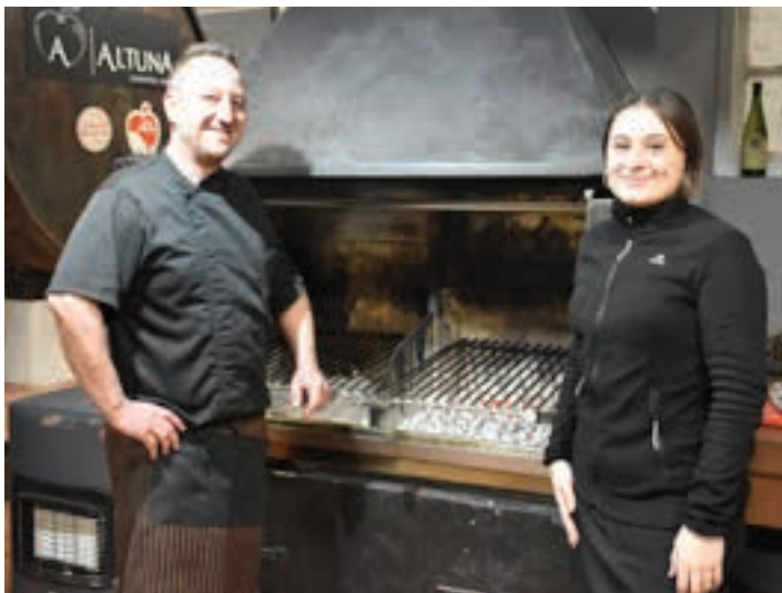
Altuna sagardotegiko langileak.

roak, sagardoa, jana barra-barra, baina hiru hilabete baino ez dira. Zenbat sagardo edaten du batez beste bezero bakoitzak? Litro bat? Litro eta erdi? Ba egin kontuak. Botila salmenta urte osokoa da, baita txotx garaikoa ere. Zenbat sagardo litro ekoitzi dituzu aurten?