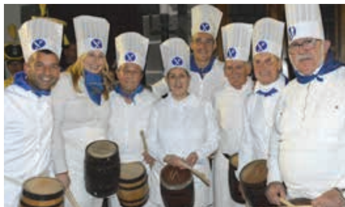
Santa Krutz Peña elkarteko hainbat lagun, afaldu berritan. AIURRI