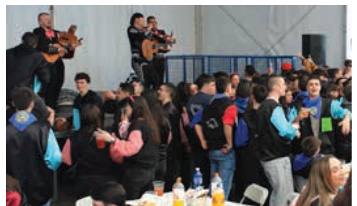
Mariatxiak, Kuadrilla Eguneko bazkalosteko sorpresa.