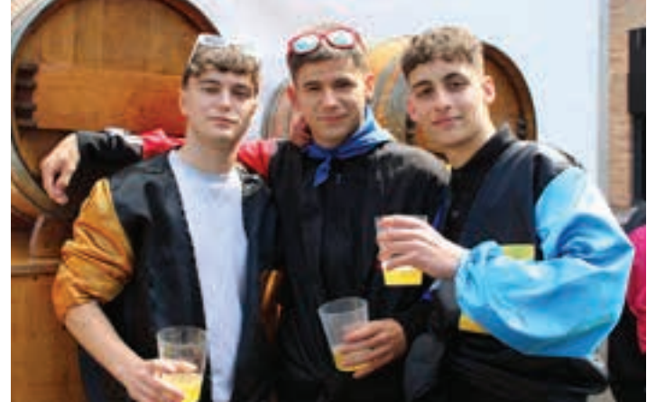
Karparen bazter batean jarri zuten sagardo-kupela. AIURRI