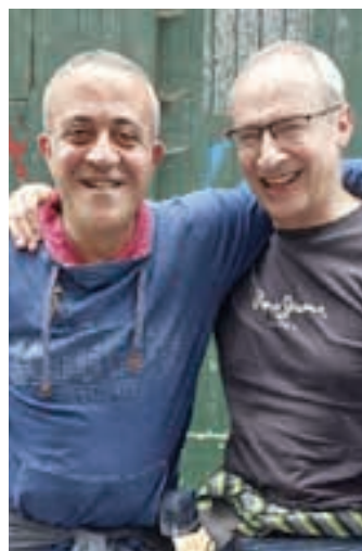
3. Batzokia. AIURRI