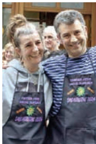
2. Irunberri. AIURRI