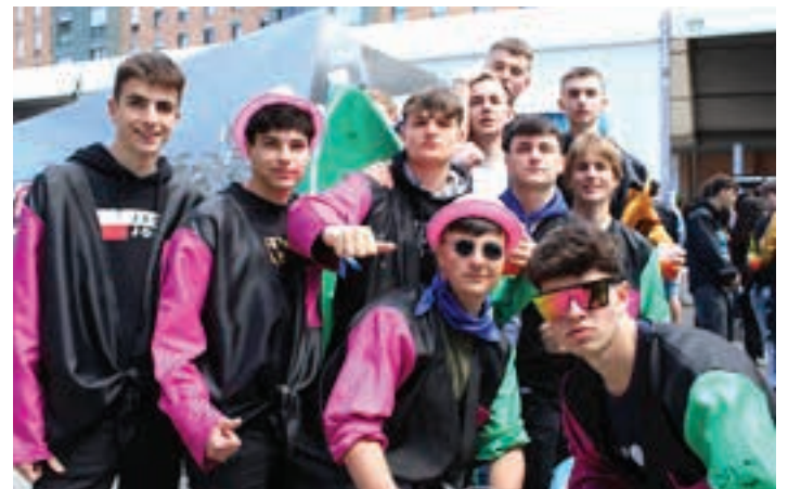
Ehunka gazteren topagune bilakatu zen kuadrillen bazkaria. AIURRI