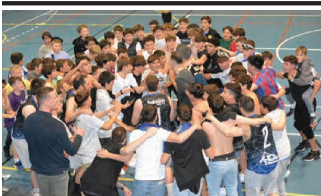
Zaletu ugari ditu Zurrut taldeak, Andoainen. Bereziki, gaztetxoan artean. AIURRI