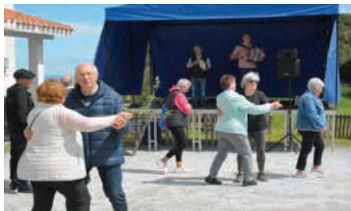
Dantzan aritzeko aukera izan zen, Santa Krutz egunean.