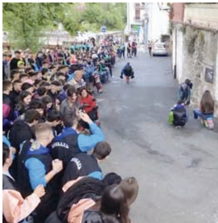
Triziberak Bekoplazatik Kale Nagusirantz egiten den jaitsiera ikusgarria da.

Asteartea jai egun bezpera izanik, gautxorientzat gau aproposa izan zen. Eta antzekoa izan zen ostiral eta larunbat gauean. Aurtengo jaietan, beraz, parranda egiteko hiru gau zeuden aukeran. Osteguna, lan eguna izanik ere, herriko gazteentzat ospakizunetan murgiltzeko lhirugarren eguna izan zen. Kuadrileen arteko jolasetan parte-hartze handia izan zen, eta bazkarian bostehun lagun inguru elkartu zen Zumea plazan. Sorpresa iragarritako zegoen, arratsaldeko hiruretarako eta ezustekoa handia izan zen. Mariatxi laukotea agertu zen, lehenik, mahaien artera. Lehen pieza eskaini ostean, taulagainera igo ziren Mexiko aldeko kantu ezagunenak eskaintzeko. Jendea kantuan eta dantzan jarri zuten, lehen doinuak eskaini eta berehala.