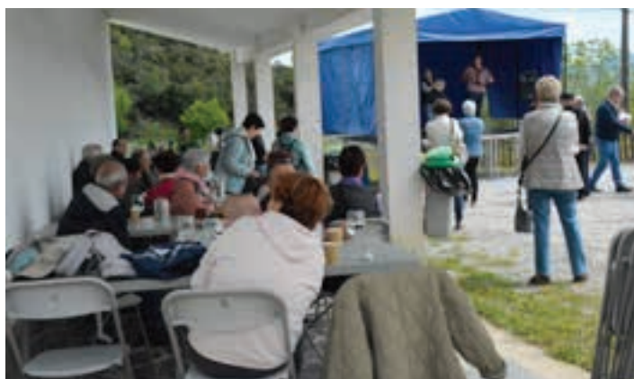
Hamaiketakoak eskaini zieten bertaratutakoak. AIURRI