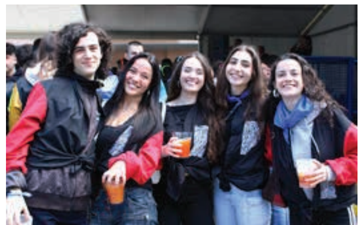
Lagunartean egoteko egun aproposa da Kuadrilla Eguna.