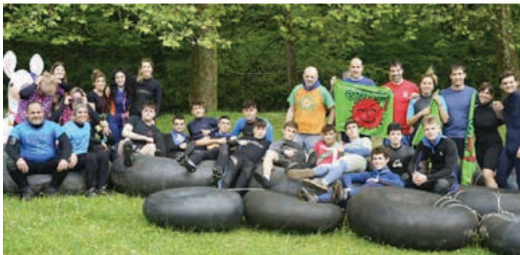
Erreka jaitsierako partaideak, abiatu aurretik. AIURRI