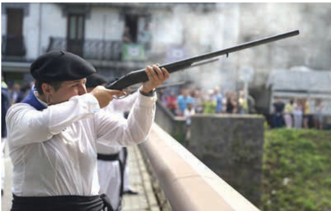
Eskopetariak Andoainen egun bakarlean ikus daitezke. Santa Krutz egunean, zehazki. AIURRI

Ikurrinaren jaitsiera, eskopeteroen irteera, dantzarien emanaldia, txakoli dastaketa... eguraldi beroko Santa Krutz egunaren lehen hitzorduak izan ziren. Jaiak hasi bezalaxe amaitu baitira aurtengoak, parte-hartze handiarekin