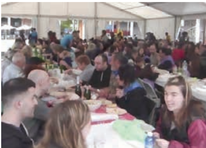
Auzo bazkariko kideek karpa bete zuten.