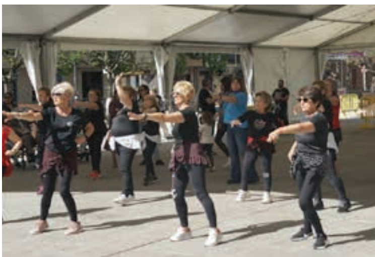
Fit Gypsy Dance emanaldia Zumea plazan, astelehen arratsaldean. AIURRI