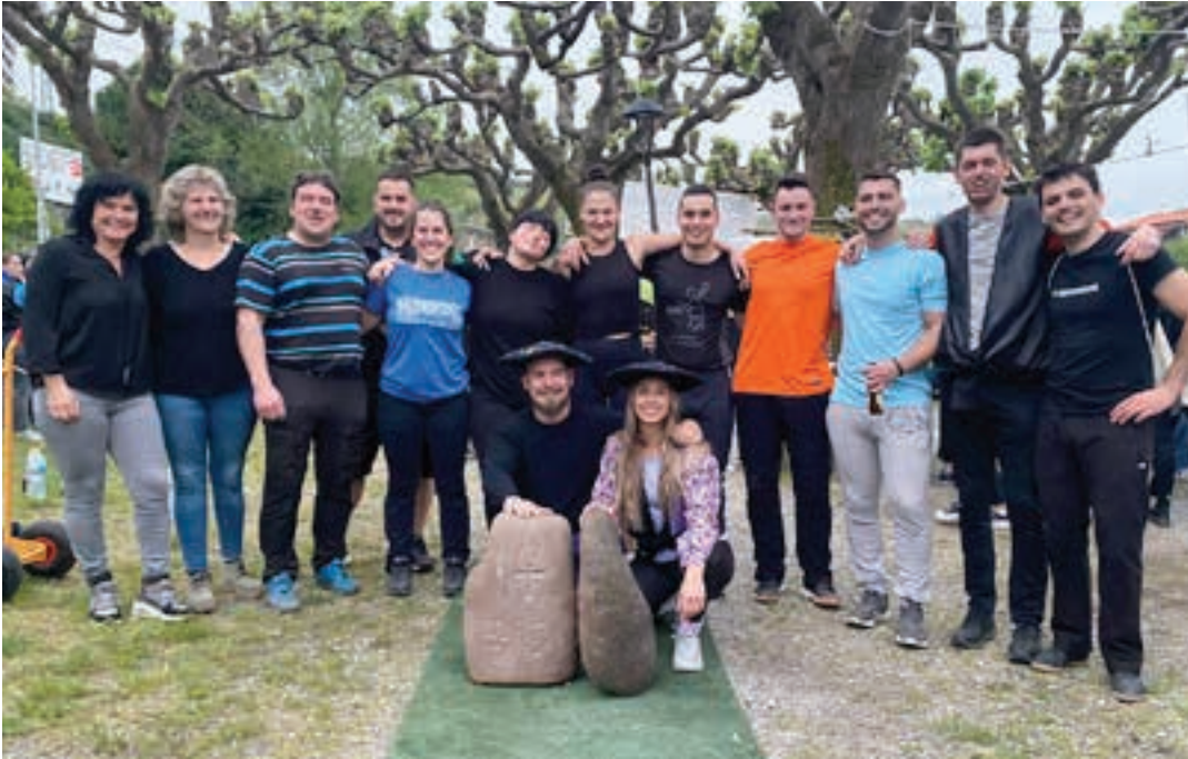
Antolatzaileak eta partaideak elkarrekin, aurtengo jaietan.