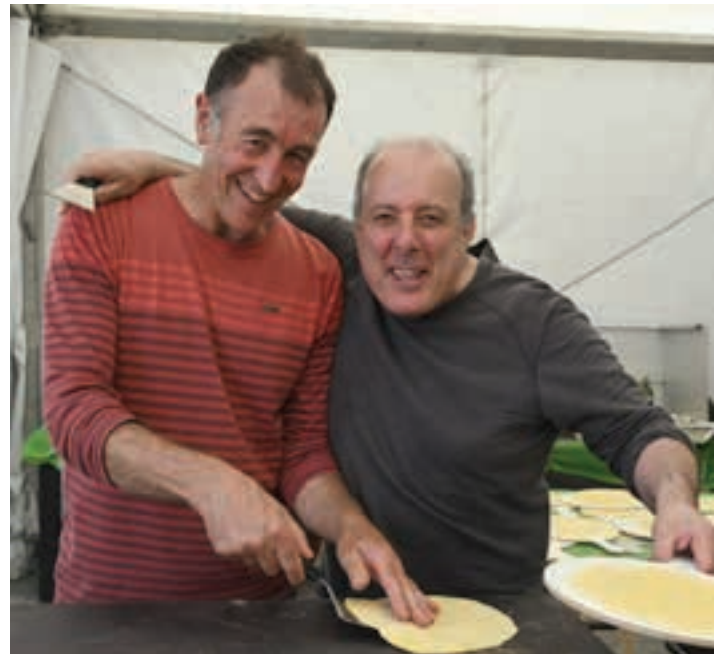
Ehunka talo eskaini zituzten, eguerdian hasi eta iluntzera bitarte. AIURRI