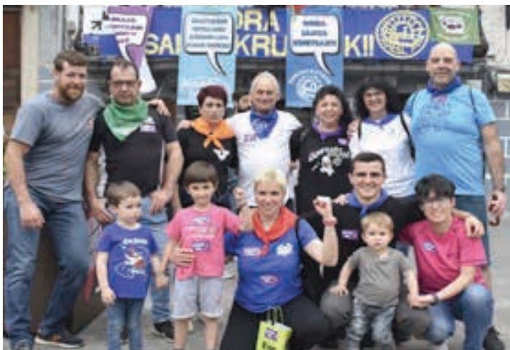
Auzoetako jai batzordeen eskutik iritsi zen aurtengo pregoia. AIURRI