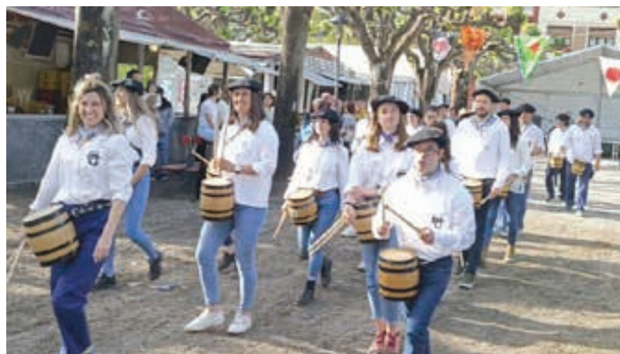
Bekoplazan saioa eskaini eta gero, Kaleberrirantz abiatu zen Herri Danborrada. AIURRI