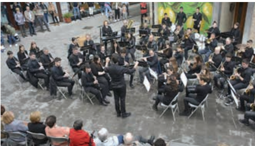
Udal Musika Eskolako Bandak 80. hamarkadako doinuak eskaini zituen. Bideo-sorta Aurrerri.eus gunean. AIURRI