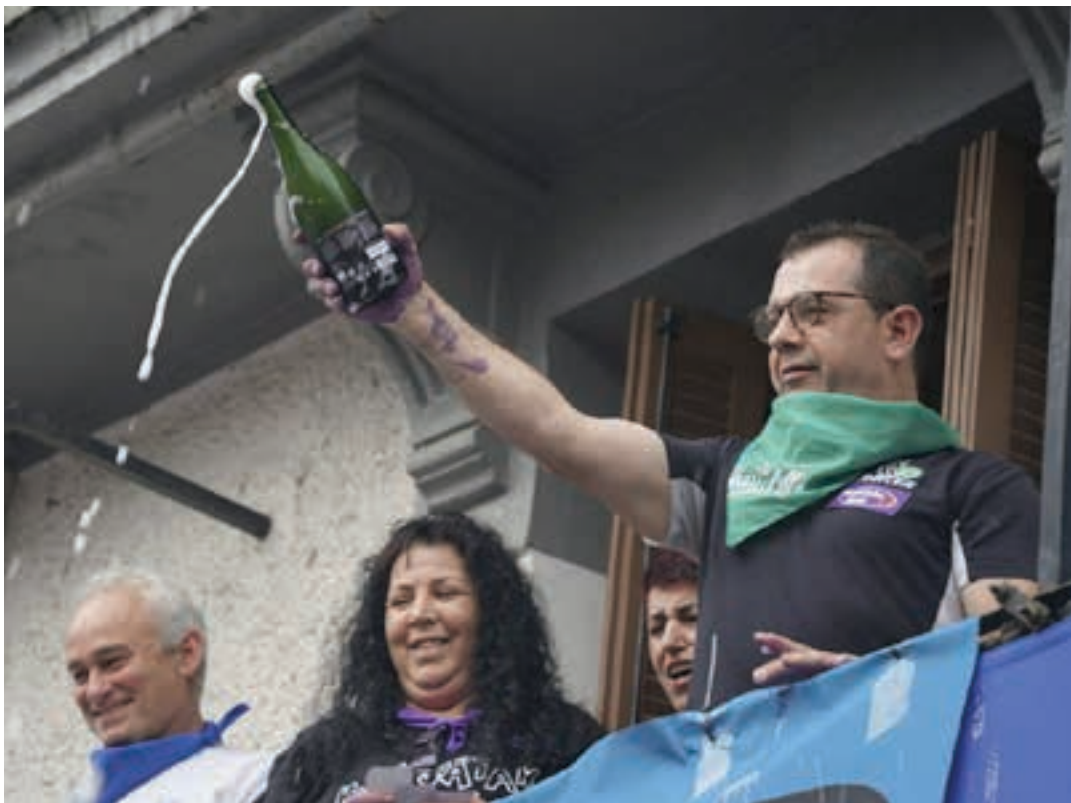
Txanpaina jaien hasierako ekitaldian. AIURRI