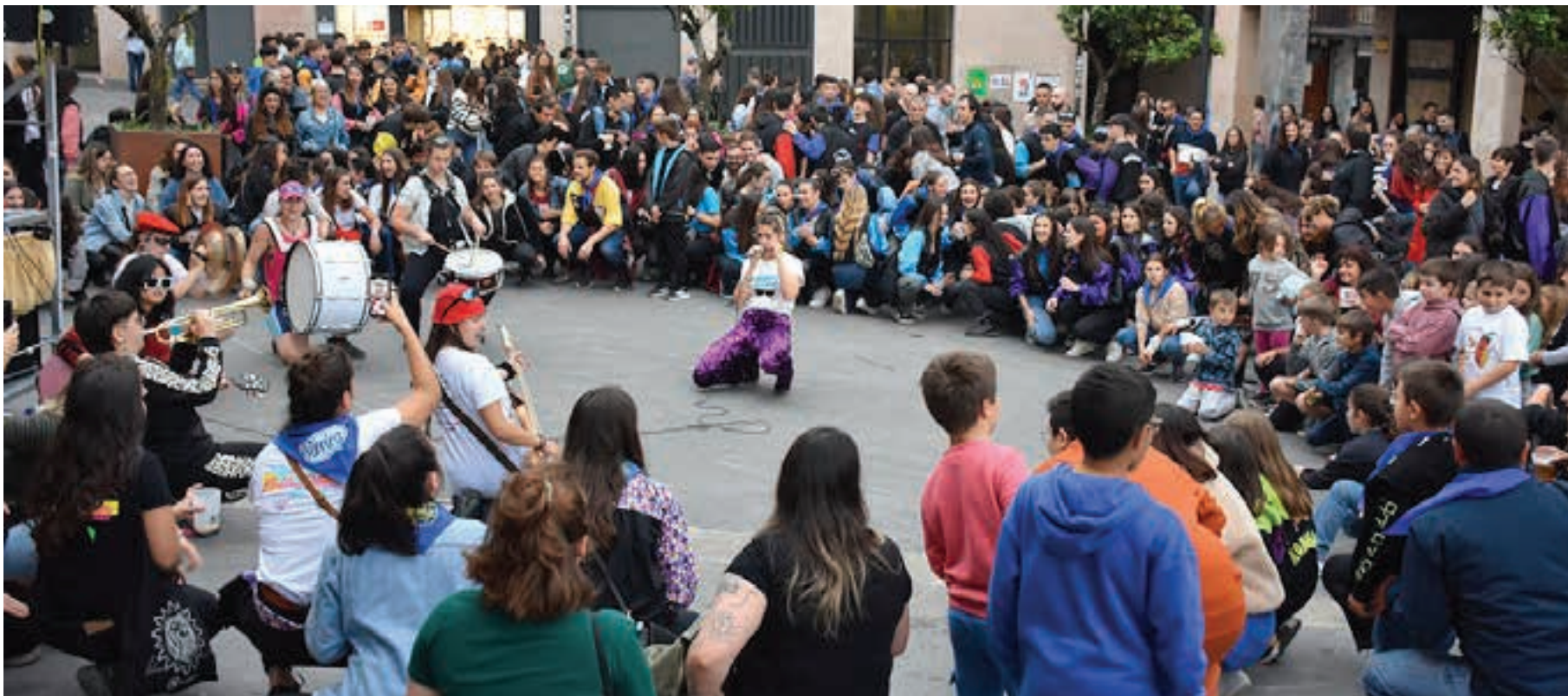
Elektropottotte taldeko kideek musikazaleak eta festazaleak elkartu zituzten. AIURRI