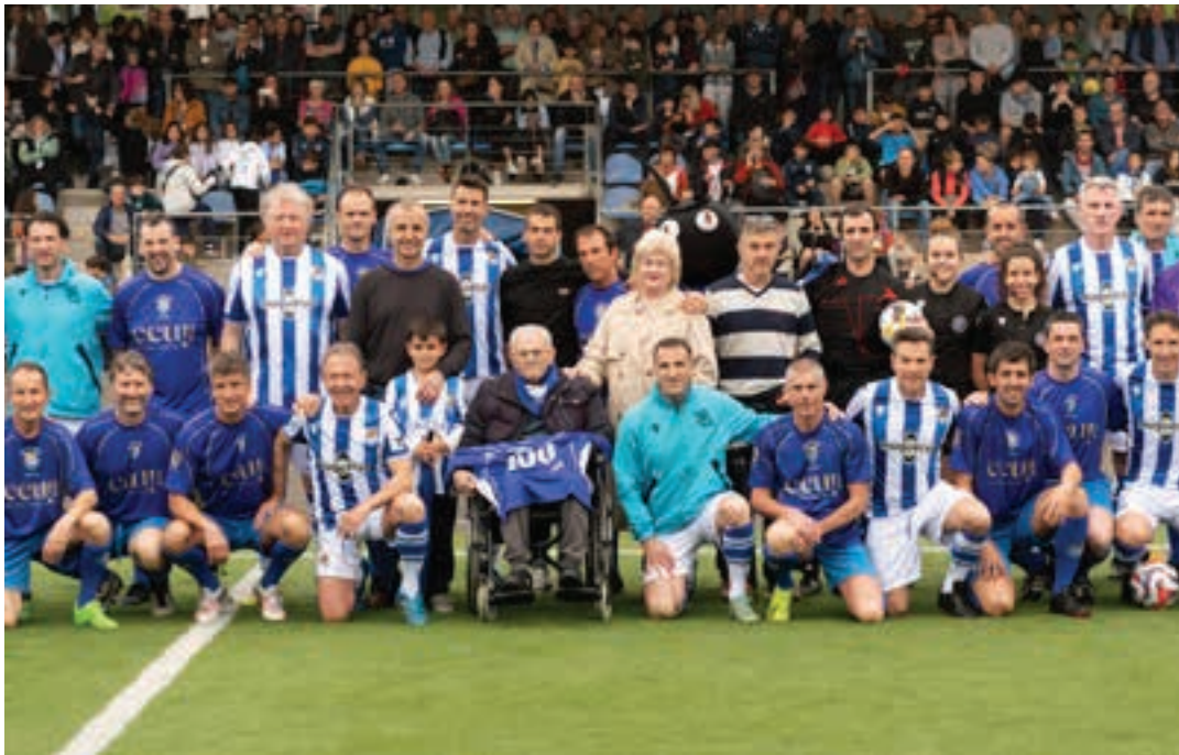
Jendetza elkartu zen Ubitarte zelaian. AIURRI