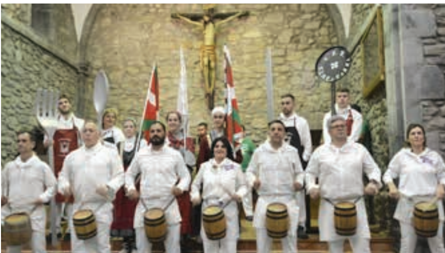
Zumeatarra elkarteko kideak Santa Krutz elizaren barrualdean eskainitako saio txoan. AIURRI