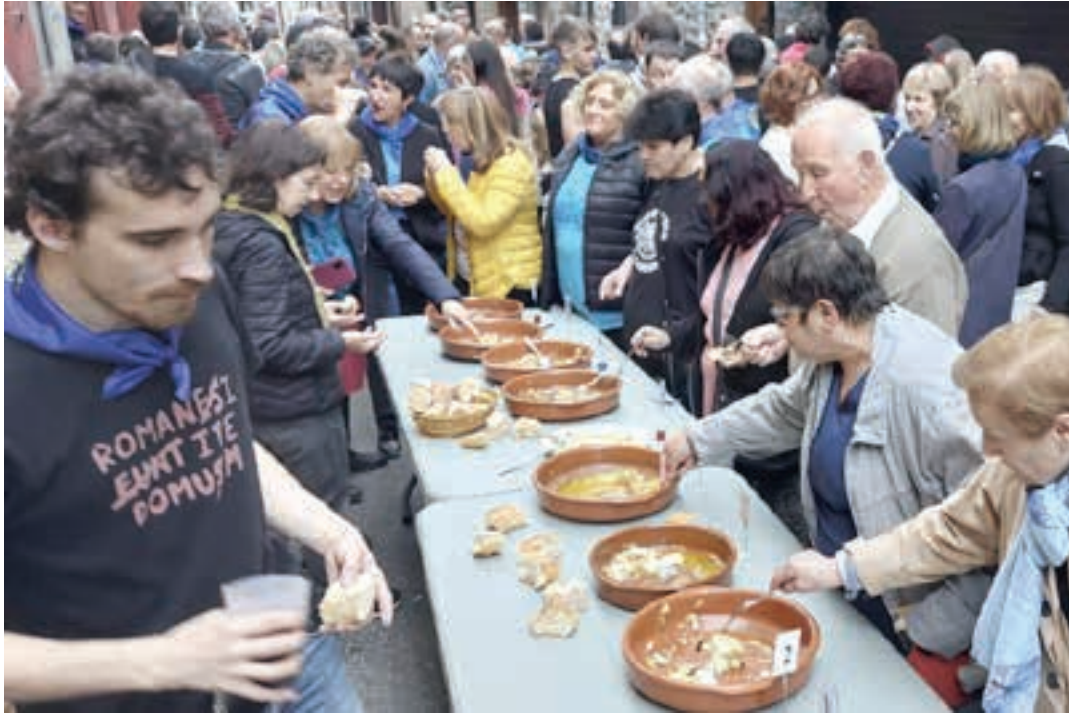
Lehiaketaren ostean ikusleek bakailaoaz gozatzeko aukera dute.