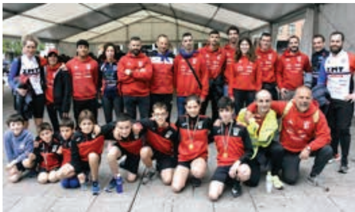
Antolatzaileak eta lasterketa bikaina egin zuten partaide gazteak, elkarrekin. AIURRI