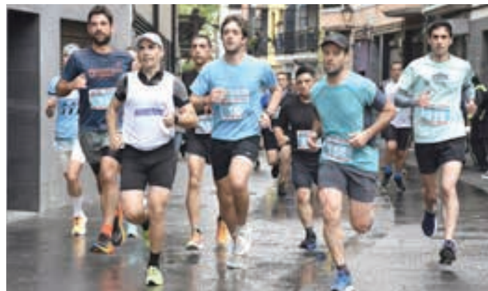
Sarasola erbi lanetan, 4:30 minutu/kilometroko erritmoan. AIURRI