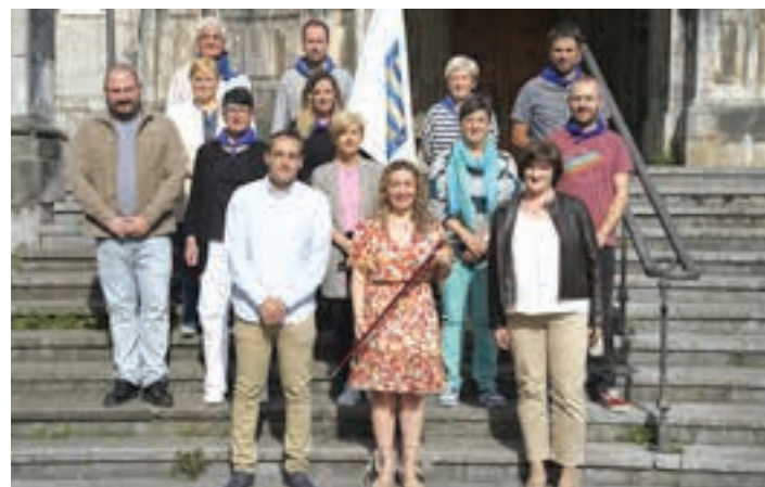
Udal Korporazioa, jaitsierari hasiera eman aurretik. AIURRI