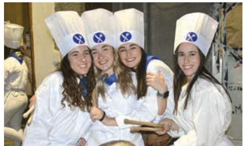
Peña Santa Krutz elkarteko danborradan adin guztietako partaideak elkartu ziren.