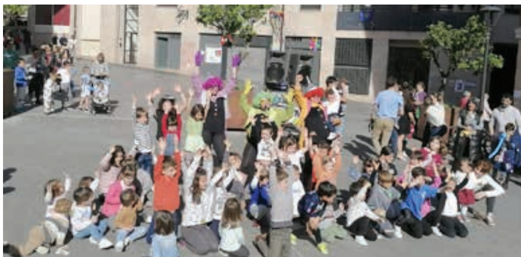
Txorotxaragang Zumea plazan batu zituen haurrak Juanita Alkain plazaraino eraman zituen. AIURRI