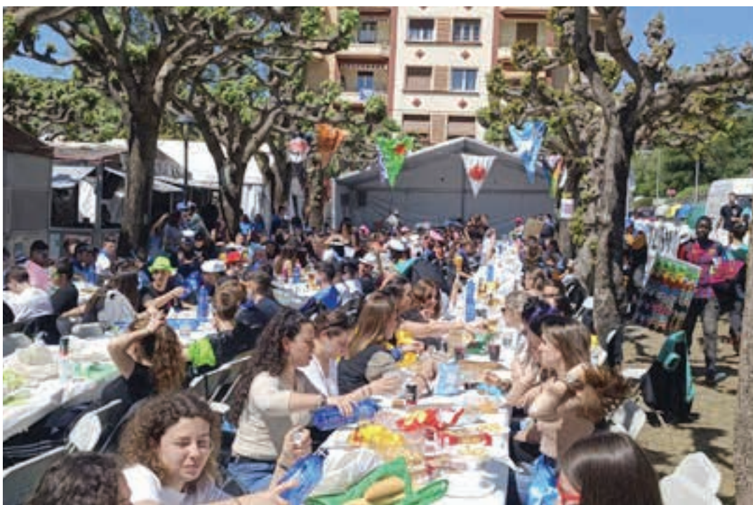
Eguzkipean jendetza elkartu zen, Bekoplazan.