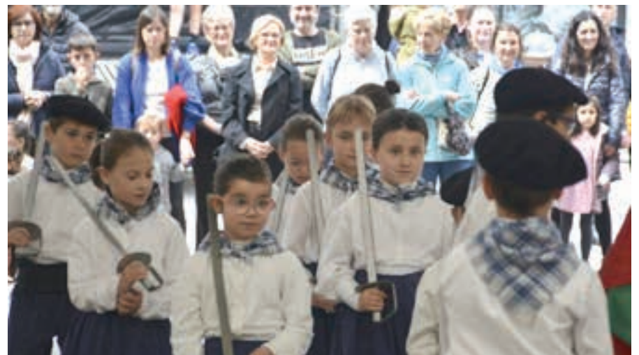
Urki dantza taldeko gaztetxoek emanaldi eskaini zuten, igande goizean.