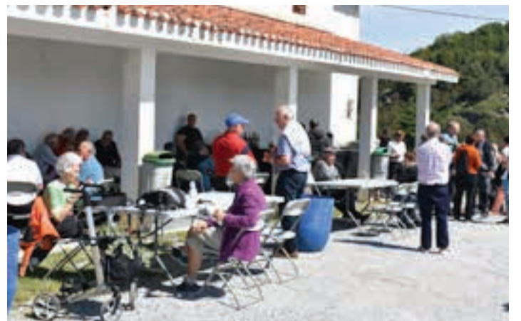
Meza eta gero, ermitaren kanpoaldean egoteko giro ederra zegoen. AIURRI