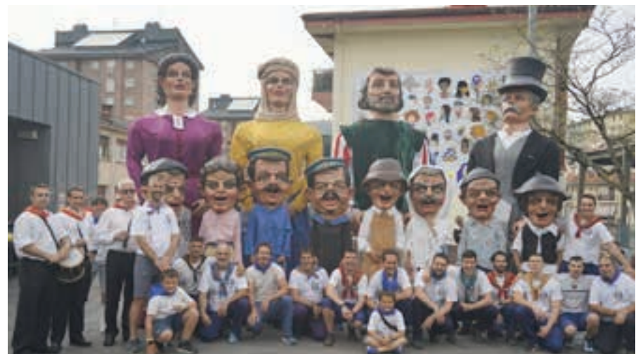
Lebiton konpartsa, dultzaineroekin batera, Bastero plazan. AIURRI