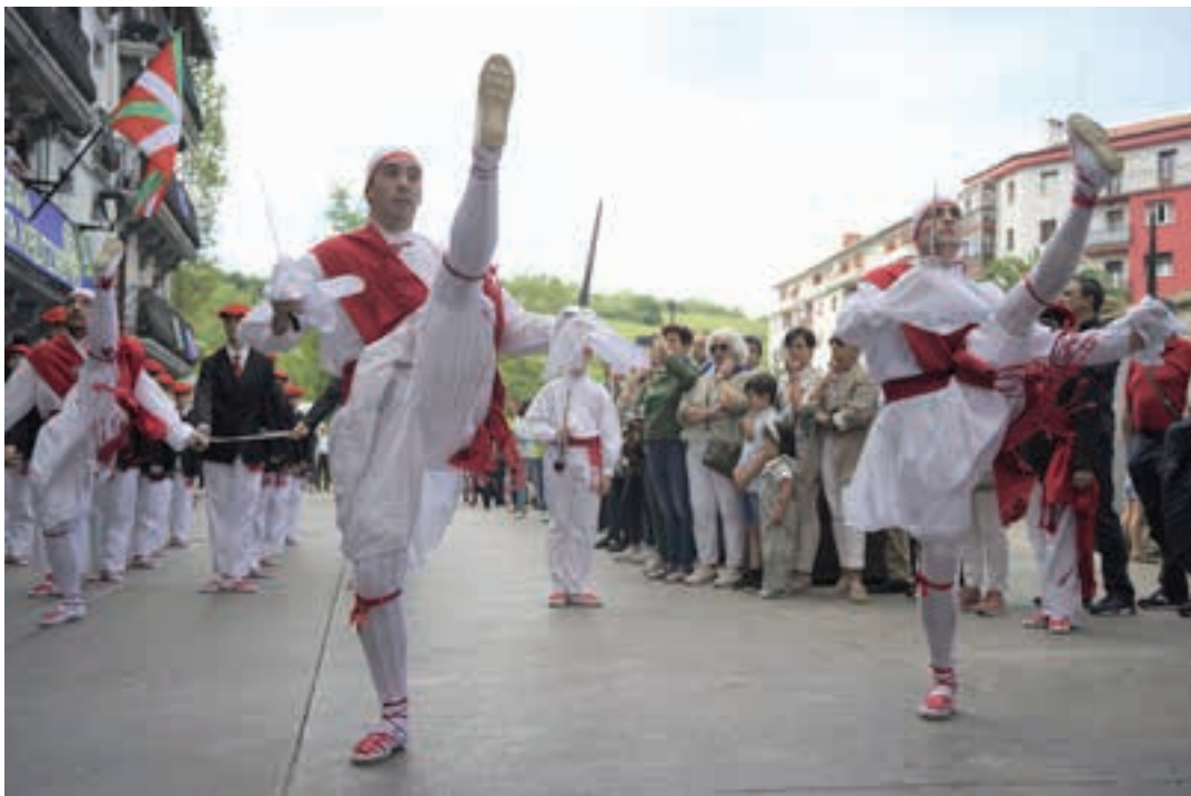
Urki dantza taldeko kideak, Udal Korporazioa Zubiaurre etxe parera iritsi zenean.