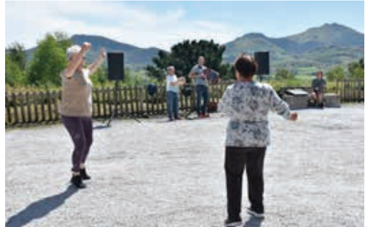
Dantzariak mezaren osteko erromerian. AIURRI