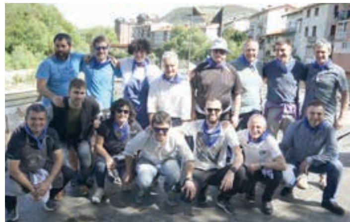
Txakolin dastaketan lanean aritu ziren auzotarrak. AIURRI