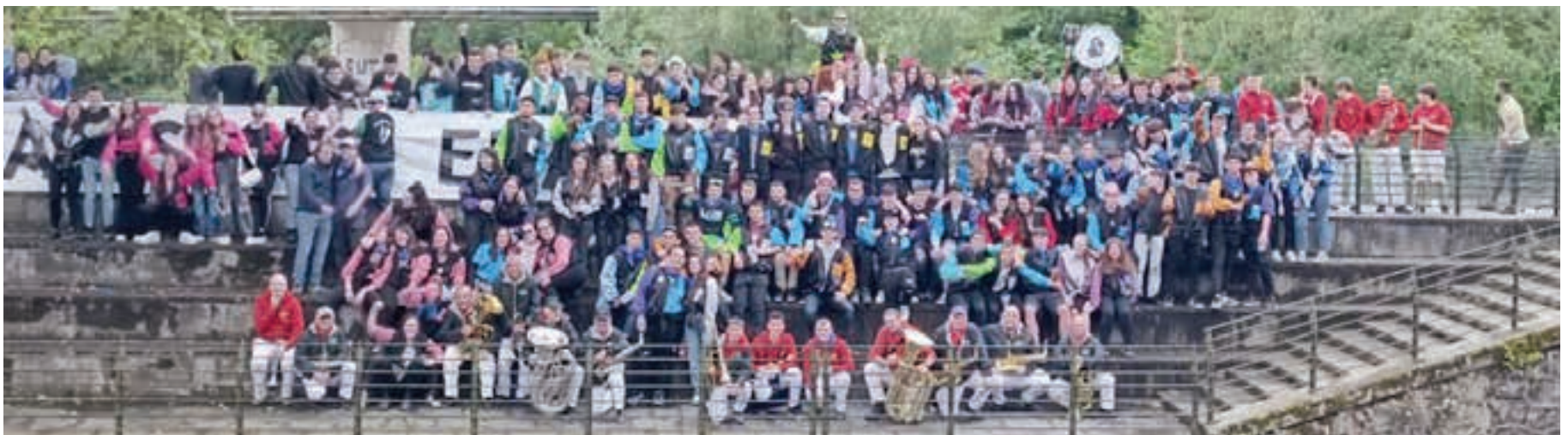
Gora Kaletxiki txarangak alaitu zuen igande goiza. Dozenaka lagun elkartu zen Espigoian, egitarauan errotuz doan gautxorien argazkia ateratzeko. AIURRI