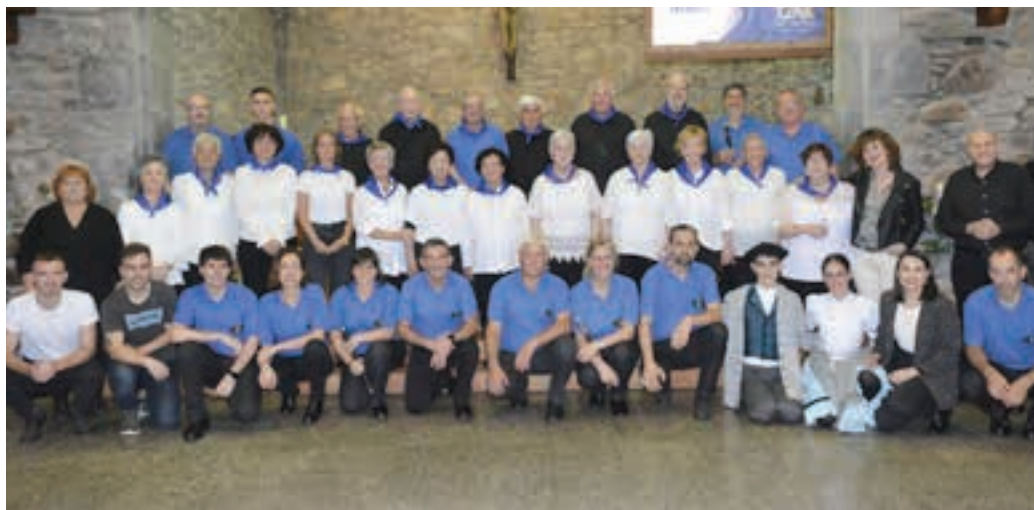
Santa Krutz jaien hasierako kontzertuan parte hartu zuten eragileak, taldeko argazkian.