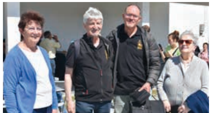
Egafiak eta Jauregik Azkorteko ermitako elizkizunean saioa eskaintzen dute.