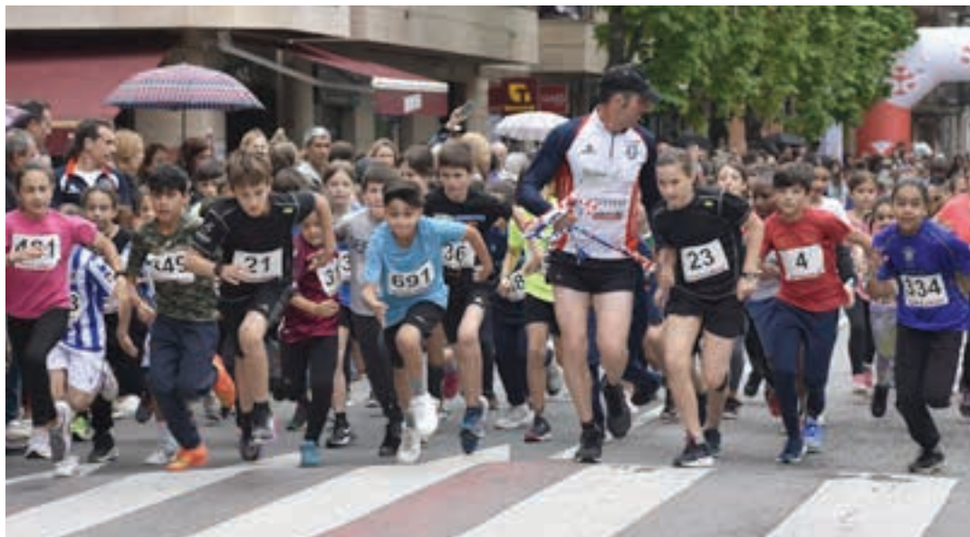
Haur lasterketa helduena amaitu orduko abiatu zen. Mailaka abiatuta, dozenaka gaztetxok parte hartu zuen. AIURRI