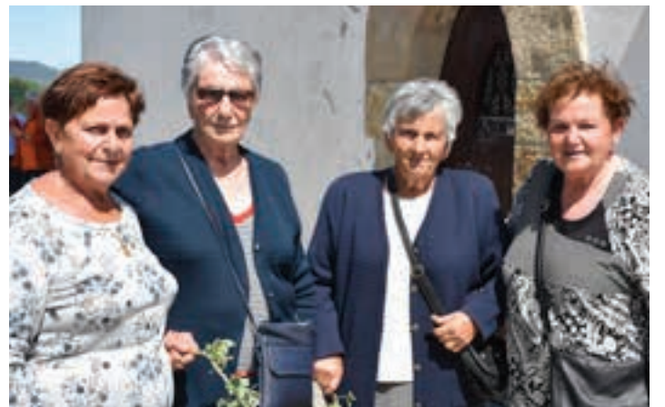
Santa Krutz egunean Azkorteko ermitan urtero berritzen den ohituretako bat da elorria bedeinkatzearena.

Borobil joan zen eguna, eta bide beretik joatea espero dute antolatzaileek maiatzaren 7ko hitzordua. Gainera, aurten 50 urte betetzen ditu Azkorteko ermitak, 1973. urteko maiatzaren 3an eraiki baitzen, harrobi bat ustiatu ondoren eraitsitako antzinako ermita homonimoaren ordezkotza gisa. Hori horrela, datorren igande honetan zer ospatua izango da ermitan: 11:00etako mezak emango dio irekiera egitarauari. Ondoren, 12:00tan, herri-kirolen txanda izango da eta erromeria doinuek emango diote jarraipena eguerdiari. Bien bitartean, salda, txorizoa, odolkia eta edaria egongo da tabernan.