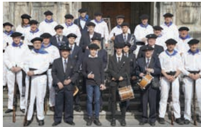
Eskopeteroak eta txistulariak, Goikoplazan.