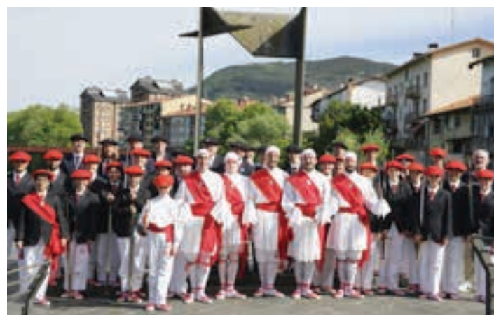
Urki dantza taldeko kideak, Espigoian. AIURRI