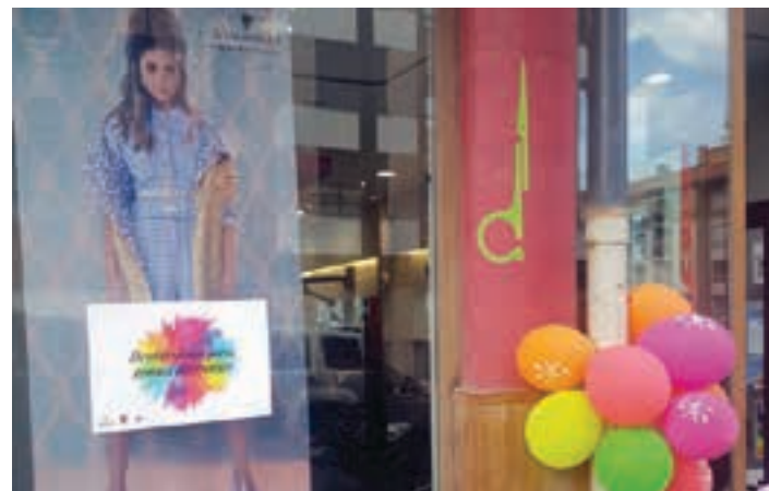
Adats ileapaindegia, Belabi kalean.