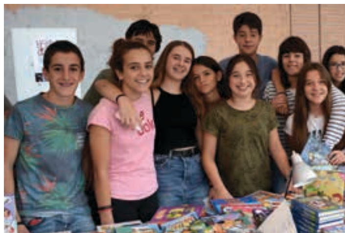
Hamabosgarren ediziora iritsi da bigarren eskuko produktuen azoka. AIURRI