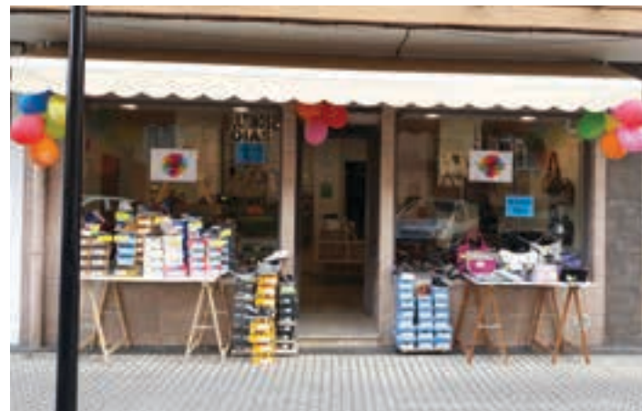
Xare oinetakoak, Elizondo plazan. AIURRI