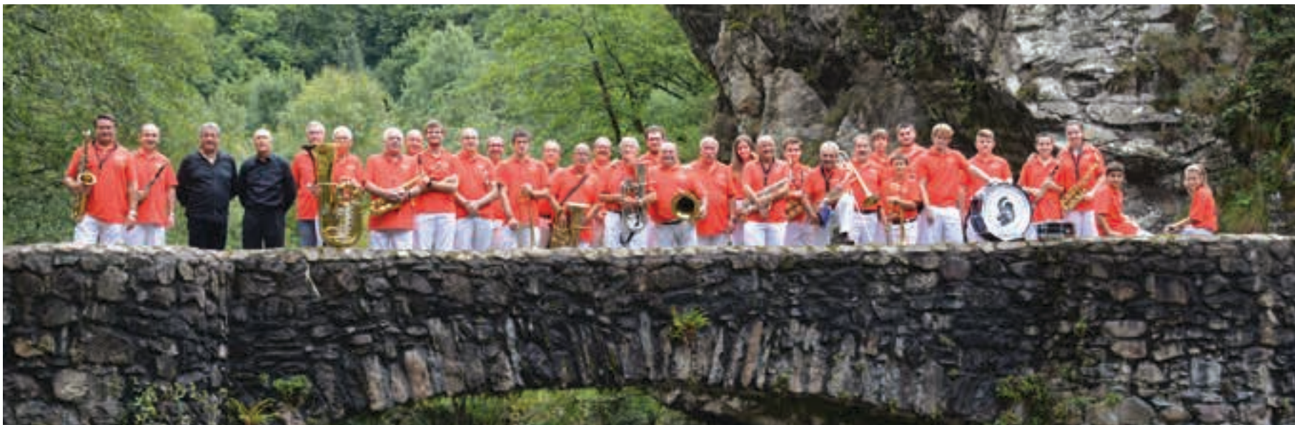
Emanaldia eskaini zuten musikariek taldeko argazkia atera zuten Unanibian bertan.