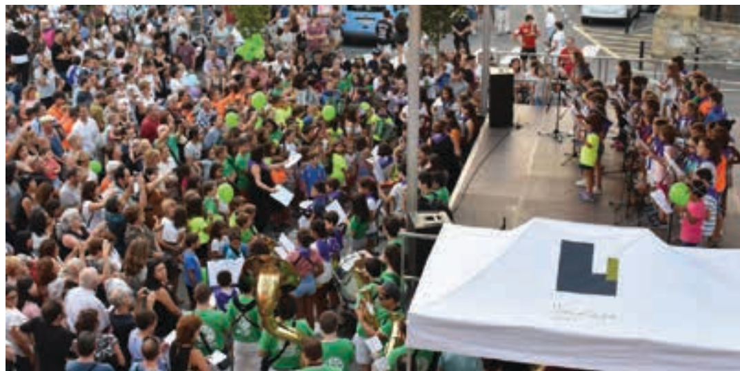
Ostegunean, iluntze aldera, plaza jendez beteko da Mielari ongietorria emateko. AIURRI

12:00 Kuadrilen kalejiraren irteera Pasai txarangarekin, Plazido Muxika plazatik.