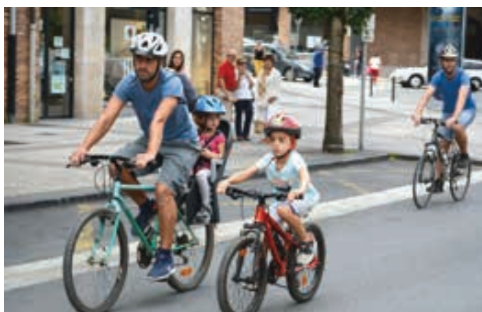
Txirrindulariak Trentxiki aldera abiatu ondoren Zumea plazara hurbildu ziren. AIURRI