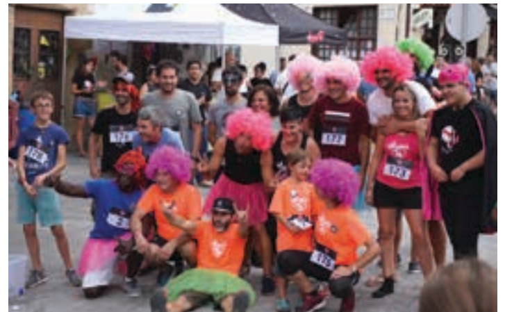
Helduek ere arratsalde bikaina igaro zuten. AIURRI