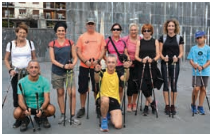
Nordic Walking taldeko kideek ere "Mugitu Andoain" ekimenarekin bat egin zuten. AIURRI