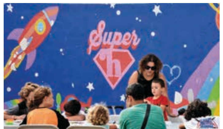
Goizean haur margo lehiaketa antolatu zuten.