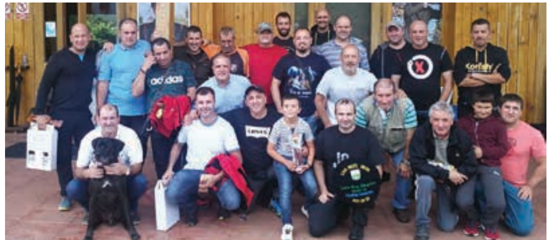
SANTA KRUZ ELKARTEA

Uztailen egin zuten aurkezpen ekitaldia, eta bertan adierazi zuten, hilean behin Urnietako kaleak euskal kantuz girotu nahi dituzte. Irailekoak Sanmielekin bat egingo du. Kantu kalejira 19:00tan abiatuko da, San Juan plazatik.