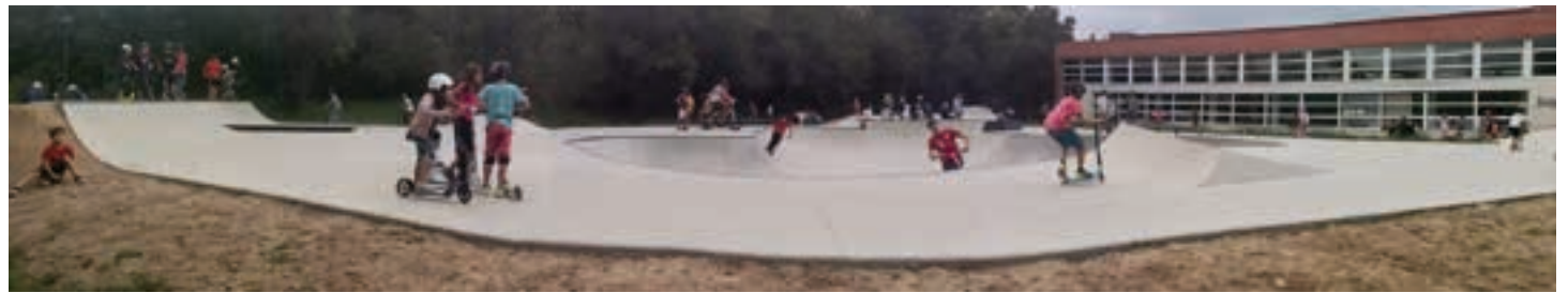
ANDOAINGO UDALA GOBERNU TALDEA. 2019KO IRAILAREN 20AN:

Andoaingo Udalaren iritiz skatepark berriak, ezarri ondoreneko lehen aste hauetan, herritarren aldetik harrera ona izan du. Gipuzkoa mailan erreferente den instalazio berri bat dugu Andoainen, eta arrakasta hori behin-behinekoa izan ez dadila, eta denboran zehar iraun dezala espero dugu.