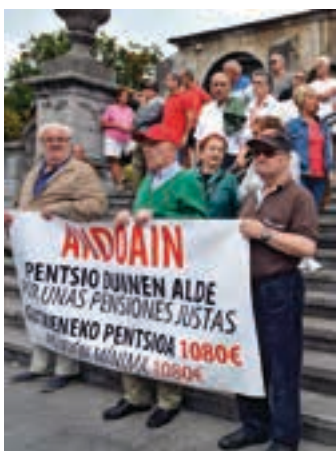
Asteleneheneko bilkura. AIURRI