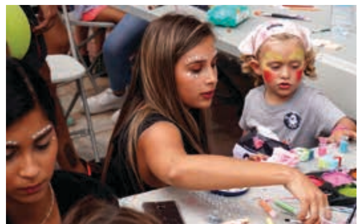
Tailerrak, txokolatea... aspertzeko tarterik ez zen izan arratsalde osoan. AIURRI

artean, hurrek mendi lasterketa txikiak gozatu ahal izan zuten. Ospakizun ederra, zeinean ikerkuntzarako 5000 euro bildu zuten.