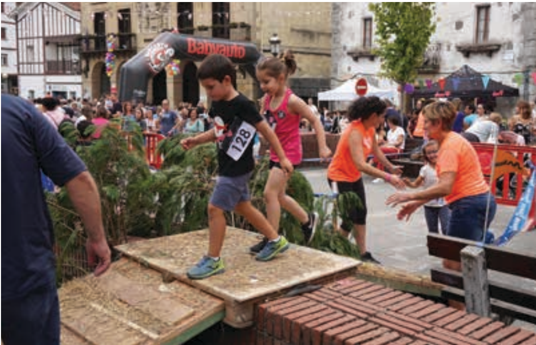
Urnietako mendi lasterketa txikia beti bezain ikusgarria da. AIURRI