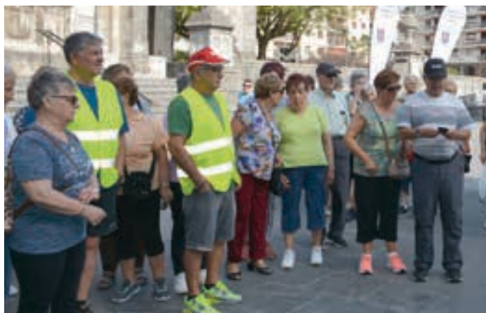
"Ibili Andoain" asteazkenean abiatu zen, baina larunbatean ez zuten hutsik egin. AIURRI