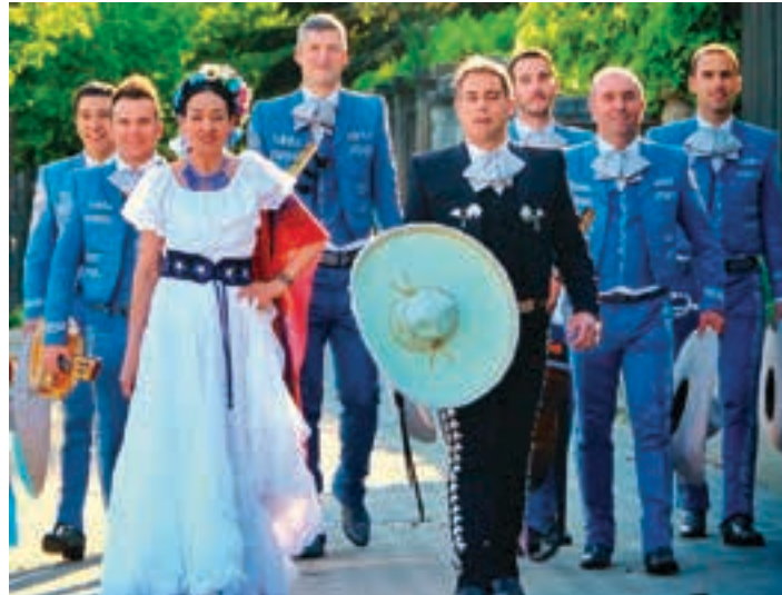
Mariachi Zacatecas taldea igande iluntzean zuzenean arituko da, plazan.