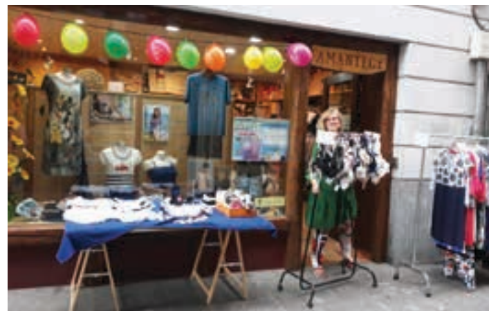
Amantegi, Kale Nagusian. AIURRI