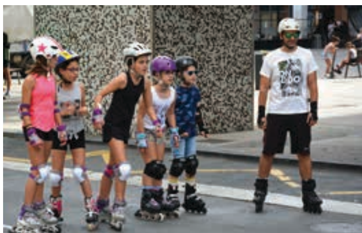
Patinaia Zumea kaleaz jabetu zen, larunbat goizean. AIURRI

Aurrerantzean, jarduera fisikorekin hitzordua izango dute. Asteazkenean, Goikoplazan.