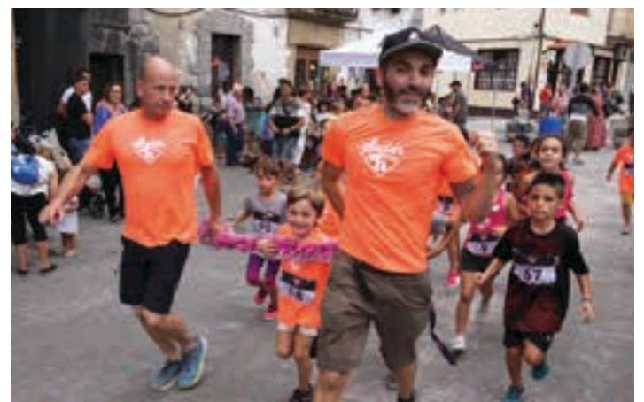
Haurren lasterketa txikiaren irteera.