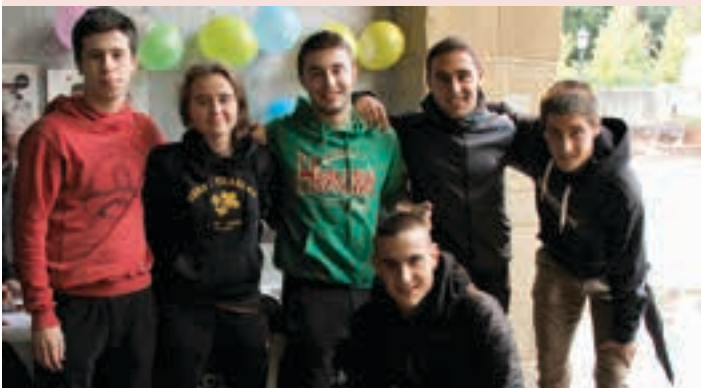
Gazte koadrilak Euskaraldian izena eman zuen, igande arratsaldean. AIURRI