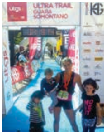
Jauregi, helmuga zeharkatu eta gero.

FUTBOLA Urnietarrak lehen minutuak jokatu ditu Herbehereetako bigarren mailan. FC Den Bosch taldea une honetan sailkapenaren erdialdean kokaturik dago. Taldearen webgunean dagoeneko urnietarra ageri da, klubeko elastikoa jantzita. Bi partidatan jokatu du, nazioartean lehen minutuak pilotuz. Ea zor-tea aldeko duen.