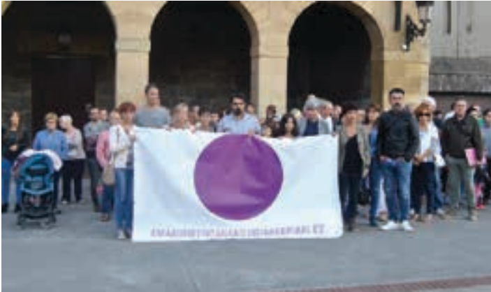
Joan zen urriaren 2an gertatu zen eraso salatzen bilkura isila egin zuten. UDALA