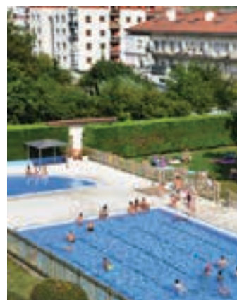
Udal igerilekua. AIURRI

Iraila amaierako plenoan, Udalak 347.000 euroko kreditu aldaketa onartu zuen, datorren udari begira hainbat hobekuntza egin ahal izateko. Udalak ohar bidez adierazi duenez, "diru kantitate hori Udalaren gerakinetik atera da eta 2018ko aurrekontuaren barruan txertatu da".