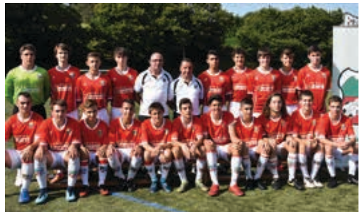
Urrietako jubenil mailako taldea.