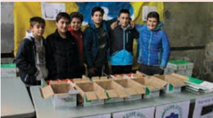
Ikasle gazteek parte-hartze zuzena izan zuten, ikasbidaia helburu. AIURRI