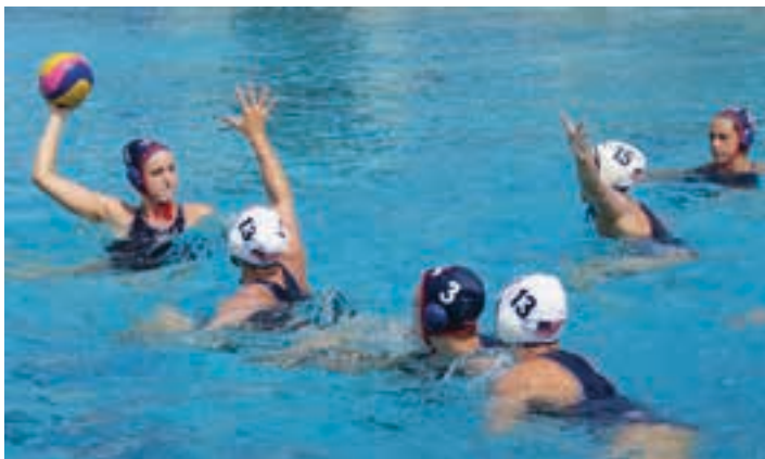
Buruntzaldea IKT taldeak urpoloan aritzeko aukera eskaintzen du.