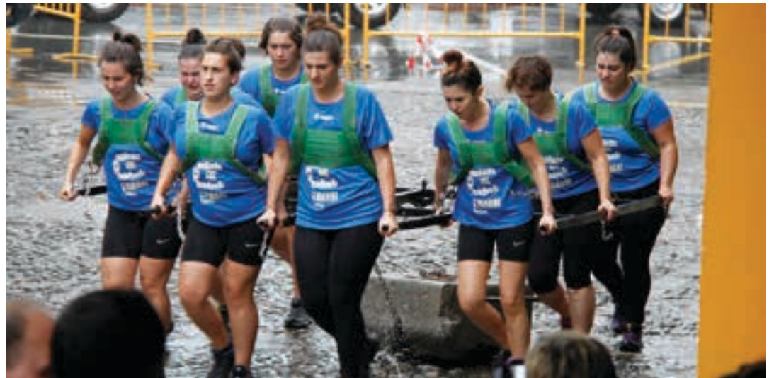
Astigarragako Emarri taldeak erakustaldia eskaini zuen Urnietako probalekuan.

Aterkipean ez zegoena babes bila aritu zen Urnietan, igande arratsaldean. Euria gogotik egin zuen egun osoan zehar, eta hala ere herri kirol erakustaldia eta sagardo dastaketa bere horretan egin ziren