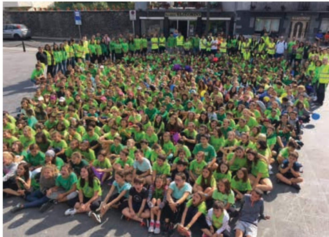
Gipuzkoa osoko Izartxo aisialdi taldeko kideak Andoainen elkartu ziren larunbatean, bi urtean behin egiten duten topaketan. AIURRI