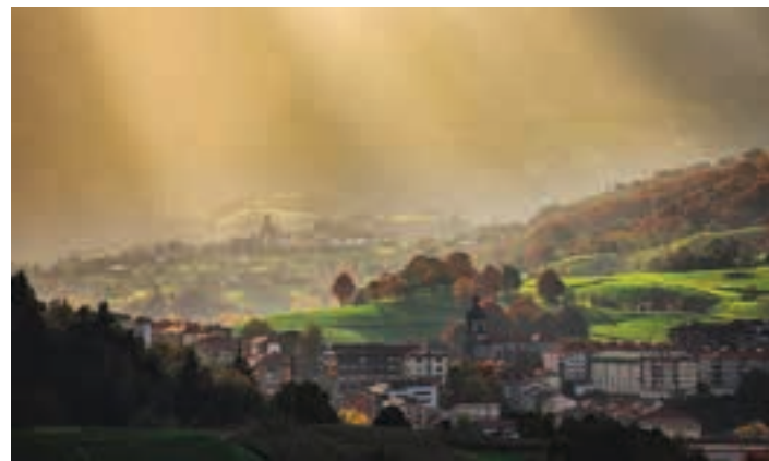
2018ko urriari dagokion argazkia, Udal egutegian. ANDER MOREA

ogia. Jendarte osoaren arazo larria. Oraindik, neurri handi batean, ezkutuan mantentzen da, justifikatu eta tapatu egiten da. Ez da inola ere, ordea, esparru pribatuari dagokion arazo bat. Arazo kolektiboa da, guztiona, eta guztion ardurua da indarkeria matxistari aurre egitea, emakume eta gizonena, herritar, elkarte zein erakundeena. • Hori dela eta, eraso salatzen, hamabost minutuko elkarretaratzea deitzen dugu asteazkenerako, urriaren 10erako, arratsaldeko 18:30etan, udaletxearen aurrean. Eraso sexistarik ez!"