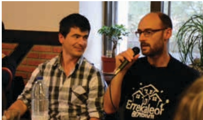
Irazu eta Arzallusen hainbat bertso aiurri.eus gunean ikusgai daude. AIURRI

Egia esan horko belar eta lili, nahiz ta pasako ziren hamaika famili, sega eskutan ez det inoiz erabili.