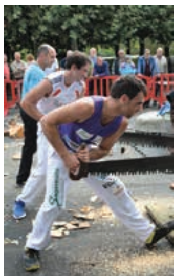
Trontzan ere aritu ziren. AIURRI

Bi segalari eta bi aizkolariek elkarren aurka arituko direnez, ez dago faborito argirik. Ikusmina, nolahi ere, handia izango da. Eguraldiaren laguntzarekin, kirol proba bikaina izatea espero da.