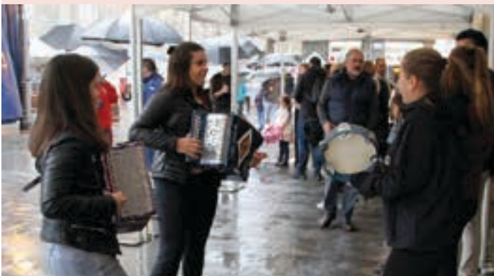
Trikiti doinuekin euriaren soinu hotsak gainditu zituzten. AIURRI