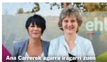
Ana Carrerek agurra iragarri zuen