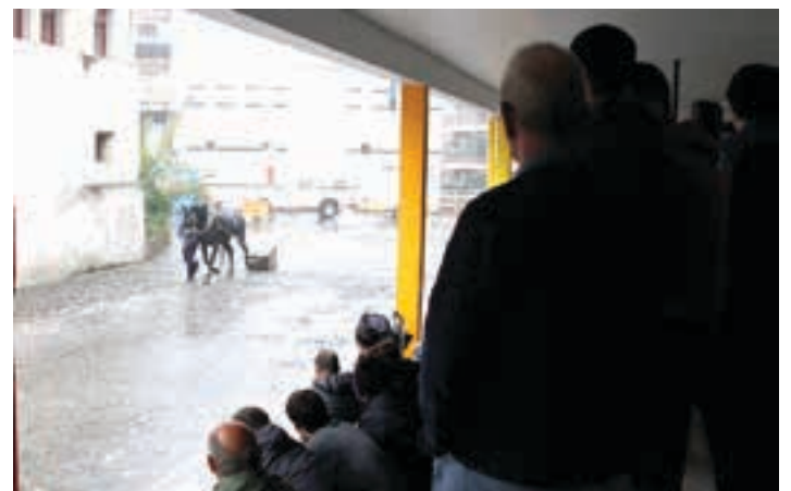
Herri kirol erakustaldiak, ohi bezala, zaletu asko erakartzen ditu. AIURRI

Tartean, indarrak hartzeko, txekor jate solidarioa eta sagardo dastaketa izan ziren. Toki berean, Euskaraldian izena emateko aukera ere egon zen.