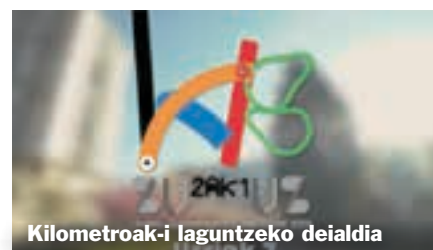
Kilometroak-i laguntzeko deialdia