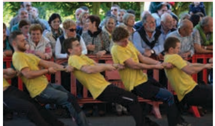
Gazteen arteko giza proba ostiral arratsaldean izango da. AIURRI

Xoxokako jaien jarraipena Aiurri.eus webgunean egin ahal izango da, hurrengo egunetan.