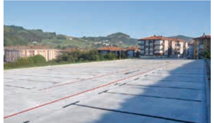
Andoaindik iritsita, Denda Berritik gora eskuin aldera dago aparkaleku berria. UDALA