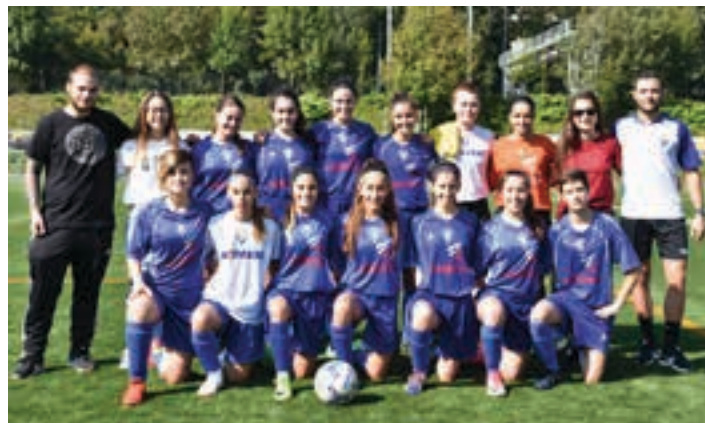
Euskaldunako senior mailako neskek.