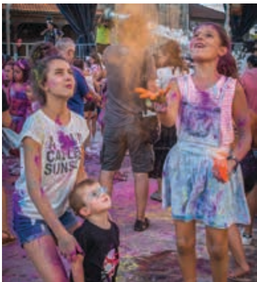
Kolore eta apar festa San Juan plazan.

Egoera zailean diren haurren alde aurpeirik onena ateratzen maisu bilakatu dira Super H elkarteko kideak. Jolasa, umorea eta kirolaren bitartez arratsalde bikaina igaro zuten San Juan plazara hurbildu zirenek. Elkartasun festa ederra izan zen