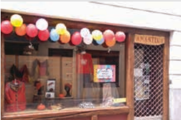
Puxika ugari zintzilikatu zituzten Amantegin. AIURRI

Eragina Salkin merkatarien elkarteko kanpainak eragin handia izan du, baita elkarteko kide ez direnen artean ere. Denek batera ikusgarritasun handia lortu dute.