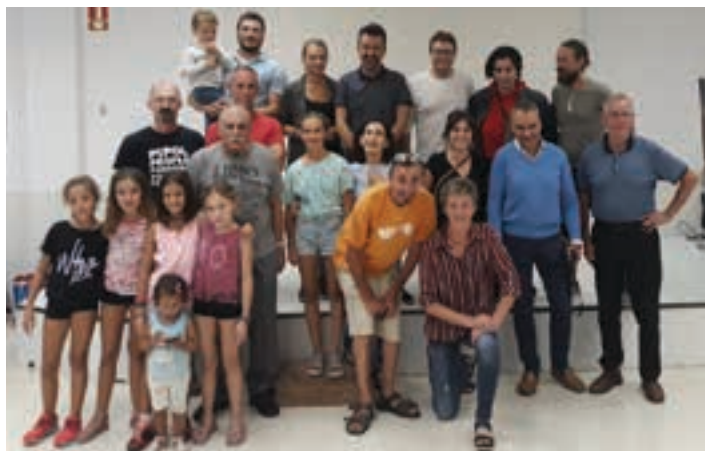
Igande iluntzean irabazleen berri eman zuten. Lekaio kultur etxean. UDALA