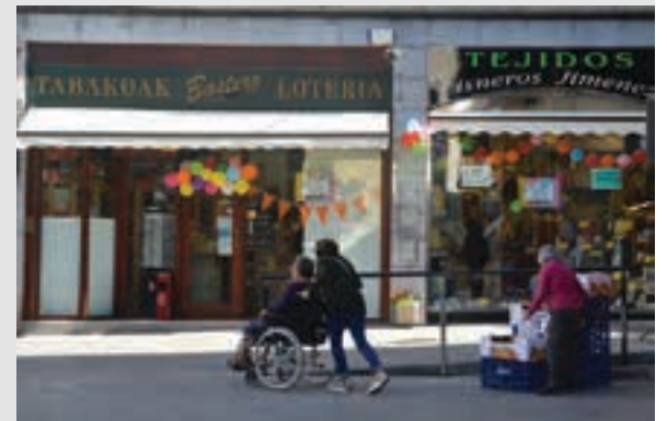
Bastero eta Cisneros kolorez eta mezuz beterik. AIURRI

Indar biderkatzailea Kanpaina dendari solte batzuk egitetik askoren artean egitera alde dago. Elkarrekin arituz lor dezaketen indarra askoz ere handiagoa da.