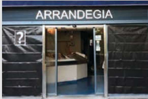
Denda zabalik ala itxita dago?, herrikide askoren kezka. AIURRI

Galdera ikurra Urrutitik, beltzarekin batera, galdera ikurra nabarmentzen zen erosleen eta oinezkoen begietara. Kanpaina ikusgarria egitea lortu dute.