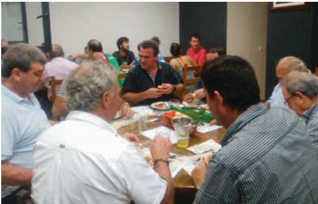
Batzokiko mahai guztiak bete ziren, joan zen larunbateko finalurrekoan. AIURRI