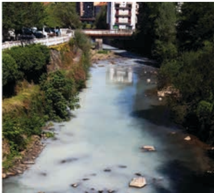
Irailaren 15eko isurketaren argazkietakoa.

URAKo ikuskaria eta Udaltzainen arteko lanak emaitza onak eman ditu oraingoan. Isurketaren jatorria topatu dute. Konponketa lanak egiten ari