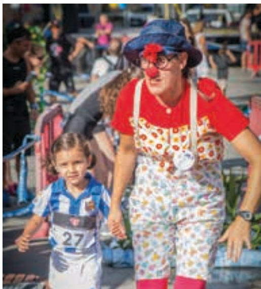
Umorea ez zen falta izan Super H festan.