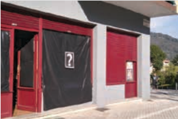
Stop liburudenda, kanpainaren hasieran. AIURRI

Galdera ikurra Urrutitik, beltzarekin batera, galdera ikurra nabarmentzen zen erosleen eta oinezkoen begietara. Kanpaina ikusgarria egitea lortu dute.