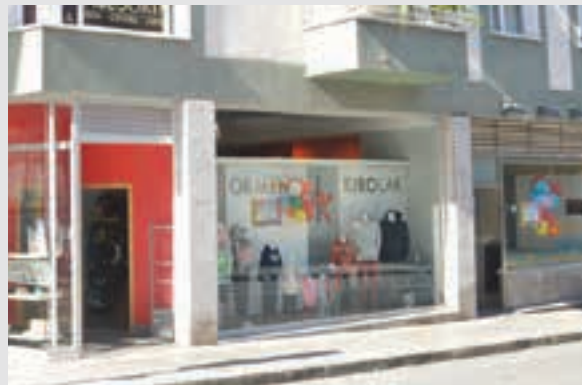
Xixori, Ormendi eta Bitoria kolorez beterik ziren.

Koloreak Lehen egunetako iluntasuna alde batera utzi, eta astelehenean kolorez bete zituzten Andoaingo erakuslehoak.