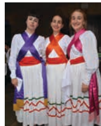
Dantza jaien amaieran. AIURRI

Antza denez, Urnietako kanporaketan puntuazioak altuak izan ziren. Bertan dastatutako lau sagardotegi izango baitira Usurbilgo finalean, Goizuetako kanporaketatik 3, Beasaingotik beste 3, eta Oñatikotik 2. Finalako 12 sagardotegiak zeintzuk diren ez da jakingo datorren larunbateko afaria bukatu arte. Orduan emango dute aditzera nortzuk izan diren hiru lehengoak puntuazio ordenean, eta gainontzeko finalistak ordean alfabetikoan.