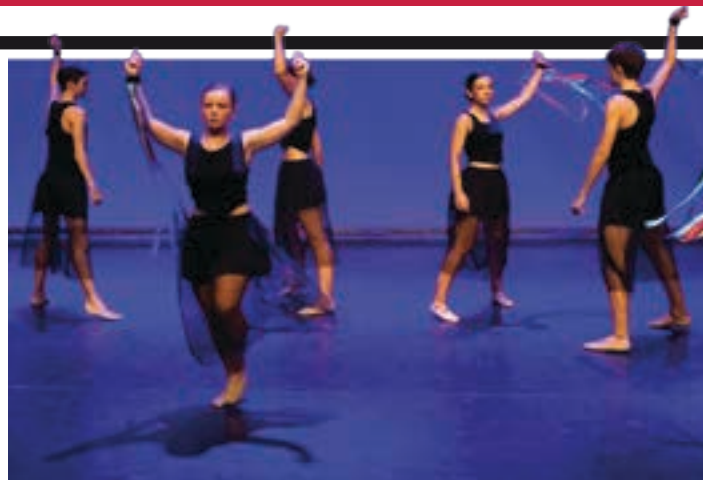
Koloredantz ikuskizuna larunbat arratsaldean Saroben. EGAPEDT