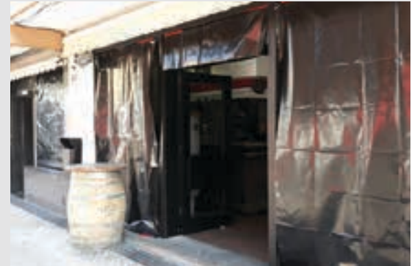
Kanpaina herrigune osora zabaldu da. AIURRI

Esaldiak "Ez dakigu zer daukagun galtzen dugun arte" edota "Nolako Andoain nahi duzu?" galderak ikusgai zeuden hainbat erakusleho eta dendatan.