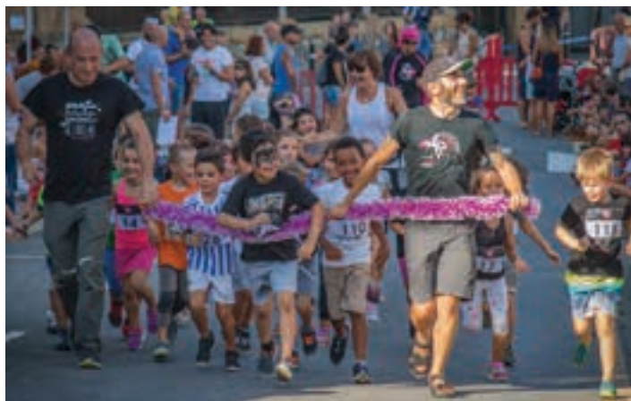
Adinaren arabera sailkatuta, lasterketa ezberdinak egin zituzten.

Goizean goizetik, orientazio proba medio, egun berezia zela nabari zitekeen Urnietan. Eta arratsaldean zehar giro on hori handituz joan zen. Jolas eta bestelako jardueren artean, 200 haur inguruk parte hartu zuten mendi lasterketa txikian. Giro onean egin zuten lasterketa, aurretik Super H super heroiak beroketa ariketa dibertigarriak egin baitzuten. Eta lasterketari ezusteko amaiera eman zioten gurasoek, eurek ere irribarrea ahoan ibilbide txikia osatu baitzuten.