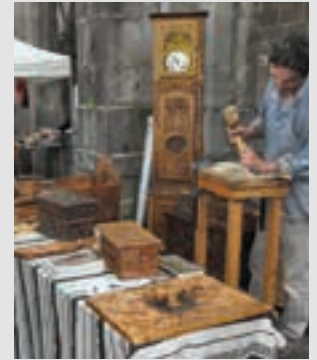
Egur taila Goikoplazan, artxiboko irudian. AIURRI

"Bide Berdeak batzen gaitu" izenburupean, Goikoplazan Plazaolako lehenengo artisau azoka antolatu dute Andoaingo Udalak eta Plazaola Partzuergo Turistikoak, bi bailaratako artisauen laguntzarekin. Ia hogeita artisau eta ekoizle hurbilduko dira, oso eskaintza zabalarekin: zapatak, zurezko tresnak, ezta, gazta, bitxiak, taloak, jantziak, ukenduak eta kremak, makramea, ehun naturalak, etab. Guztiak eskuz egindakoak dira, eta osagai naturalekin.