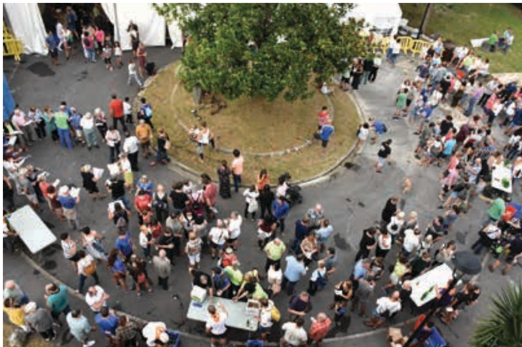
Eguraldia lagun, plazan egin ziren sagardo dastaketa eta kantu jira.

Jai Batzordeak jaien antolakuntza uzteko asmoa iragarri zuen zikiro afarian. Hamabost urte daramate lanean kide gehienek, eta nekea sentitzen dute jada