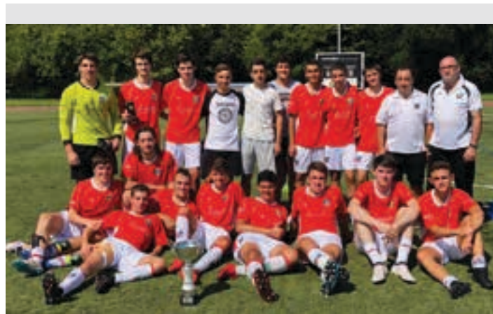
Urnietarrak garaile izan ziren aurtengo edizioan. UKE