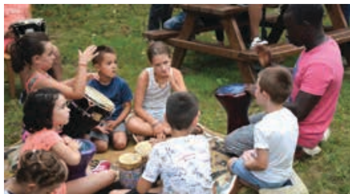
Ate Irekien jardunaldia egin zuten Sorabillan Caritasek duen harrera-etxean.