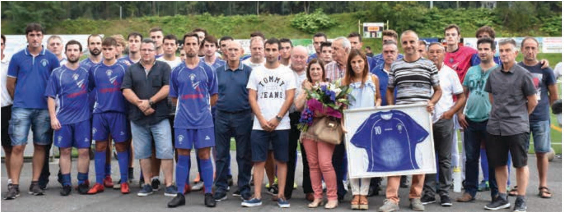
Senideek Euskalduna osatzen duten guztien omenaldia jaso zuten. Irudian jokalaria, zuzendaritzako kideak eta zuzendaritzako kide ohiak Huiziren senideekin batera. Txalo zaparrada jaso zuten. AIURRI