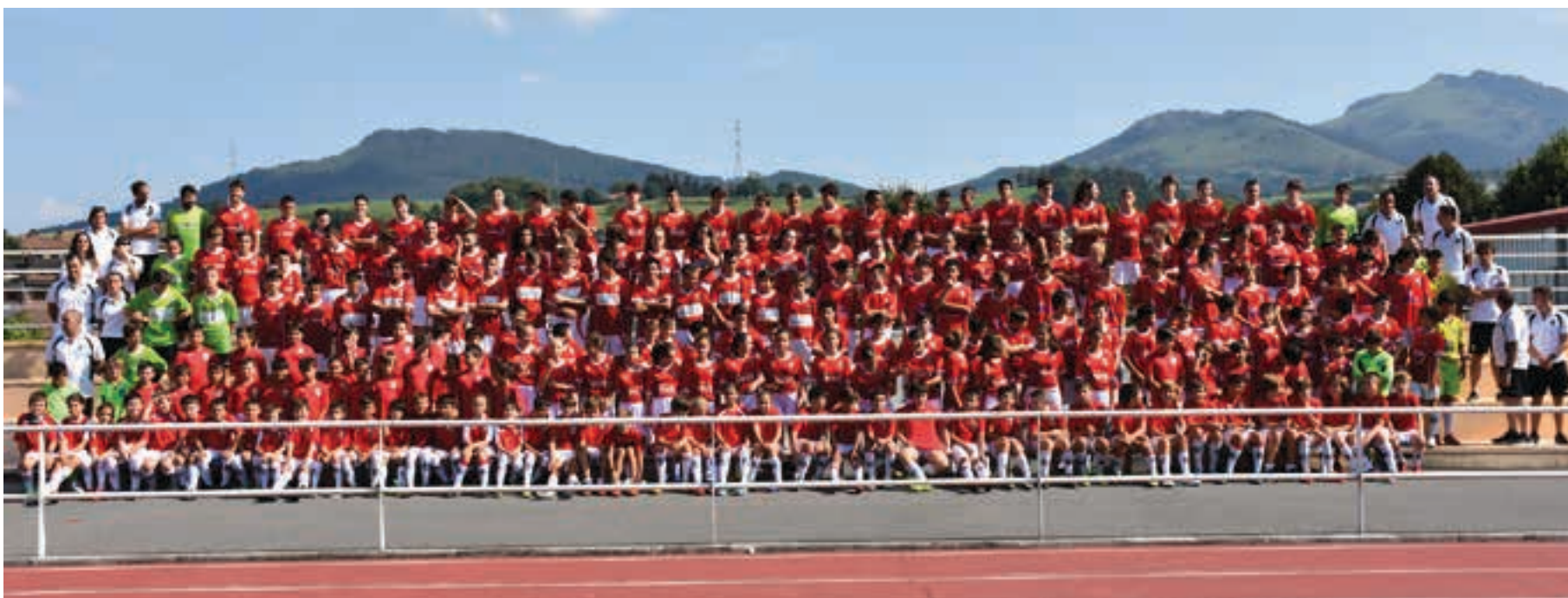
Urnietako futbol zelaiaren harmailetan atera zuten taldeko argazkia, eta ondoren, talde guztiak banan bana aurkeztu zituzten jokalariek banan bana aipatuz. AIURRI