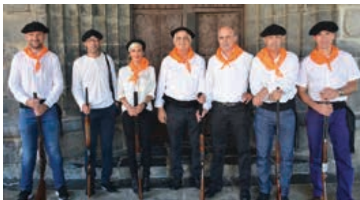
Eskopeteroak igande eguerdian auzoan barrena ibili ziren. AIURRI