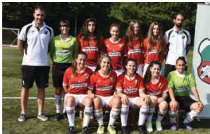
Senior mailako nesken taldea. Igandean lagunarteko partida du, Fanderian.

Denboraldiaren aurkezpen ekitaldian ez da emozioa inoiz falta izaten. Goizez jokatu zen Ricard-Begiristain memoriala, eta egun seinalatua zenez, euren senideei lore sorta bana eman zieten. Aitortza ekitaldia gozoa izan da aurten, Urnieta garaile izan baitzen.