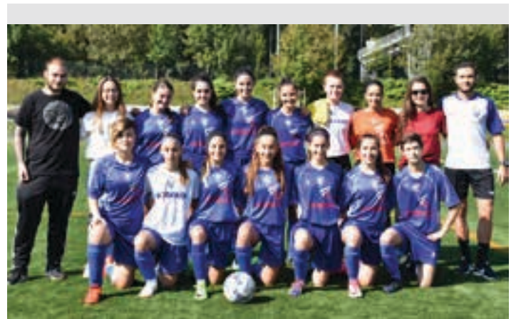
Nesken mailako lehen taldea, finalaren atarian ateratako argazkian.