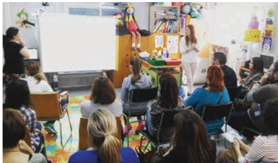
Guraso eskolak han eta hemen indartzen ari dira, gurasoen hezitzaile papera aberasteko asmoz. EXTRAESCOLARESGENIALES