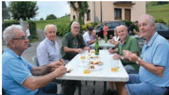
Igande goizean Ezkio-Itsasoko Kizkitza ermitako erromerian parte hartu ondoren, argazkiko koadrila Sorabillako sardin jatera hurbildu zen.