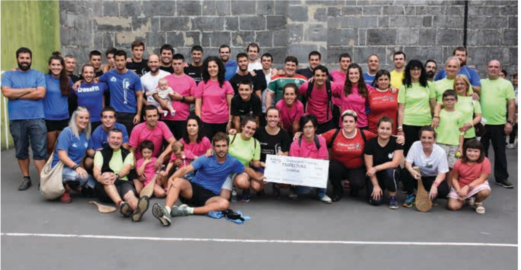
Sorabillako pilotalekuan azken sailkapenaren berri eman ostean, Buruntza taldeari irabazleari dagokion 500 euroko diru-saria eman zioten. Bukaeran partaide guztiek taldeko argazkia atera zuten.