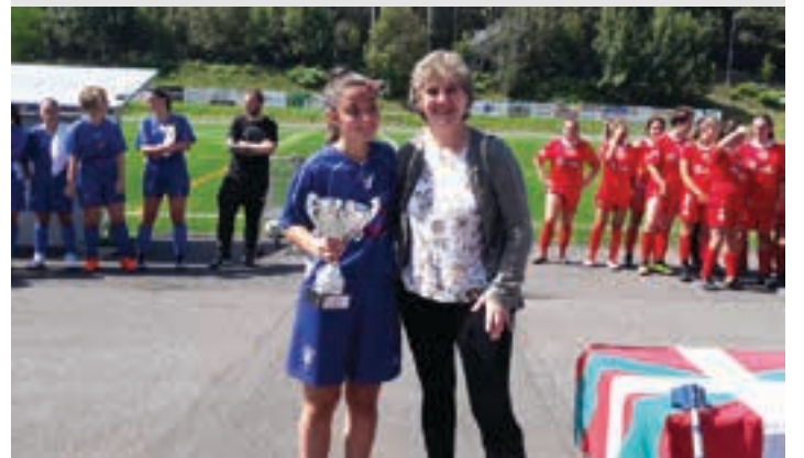
Carrere alkatearen eskutik jaso zuten Larramendi txapelketaren kopa. UDALA

Aurten, nesken eta mutilen mailako Larramendi txapelketa antolatu dute, berdintasunaren bidean urrats berria emanez. Goizean izan zen nesken arteko finala, Euskalduna eta Santo Tomas Lizeoaren artekoa. Historiarako geratuko da idatzita lehen edizioan etxeokoa nagusitu zirela, 5-1eko emaitzarekin.