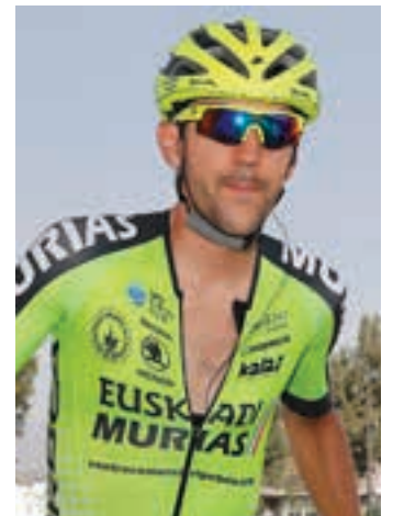
Iturria, Vueltan. EUSKADI-MURIAS