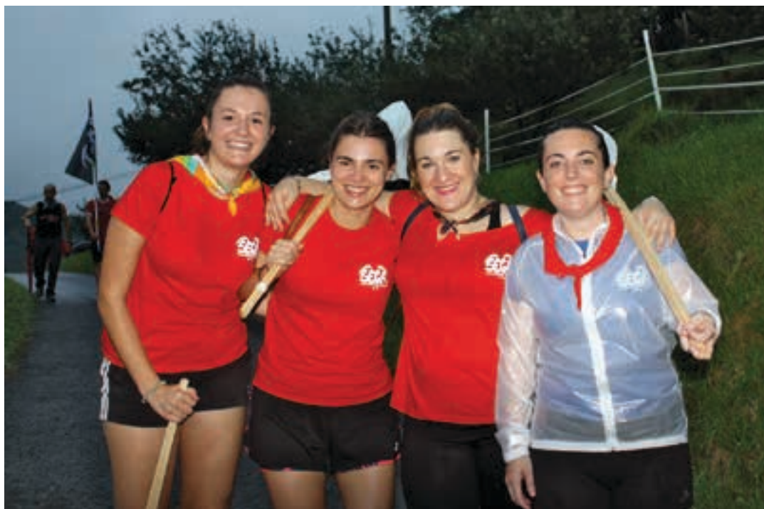
Lehen orduan euria egin arren, oilasko biltzaileek ez zuten umore ona galdu. SEGA

Primerako giroan igaro dira aurtengo San Esteban jaiak Goiburu auzoan: kirol saioak, musika emanaldiak, otorduak... eta, batik bat, jende parte hartzailea eta umore ona