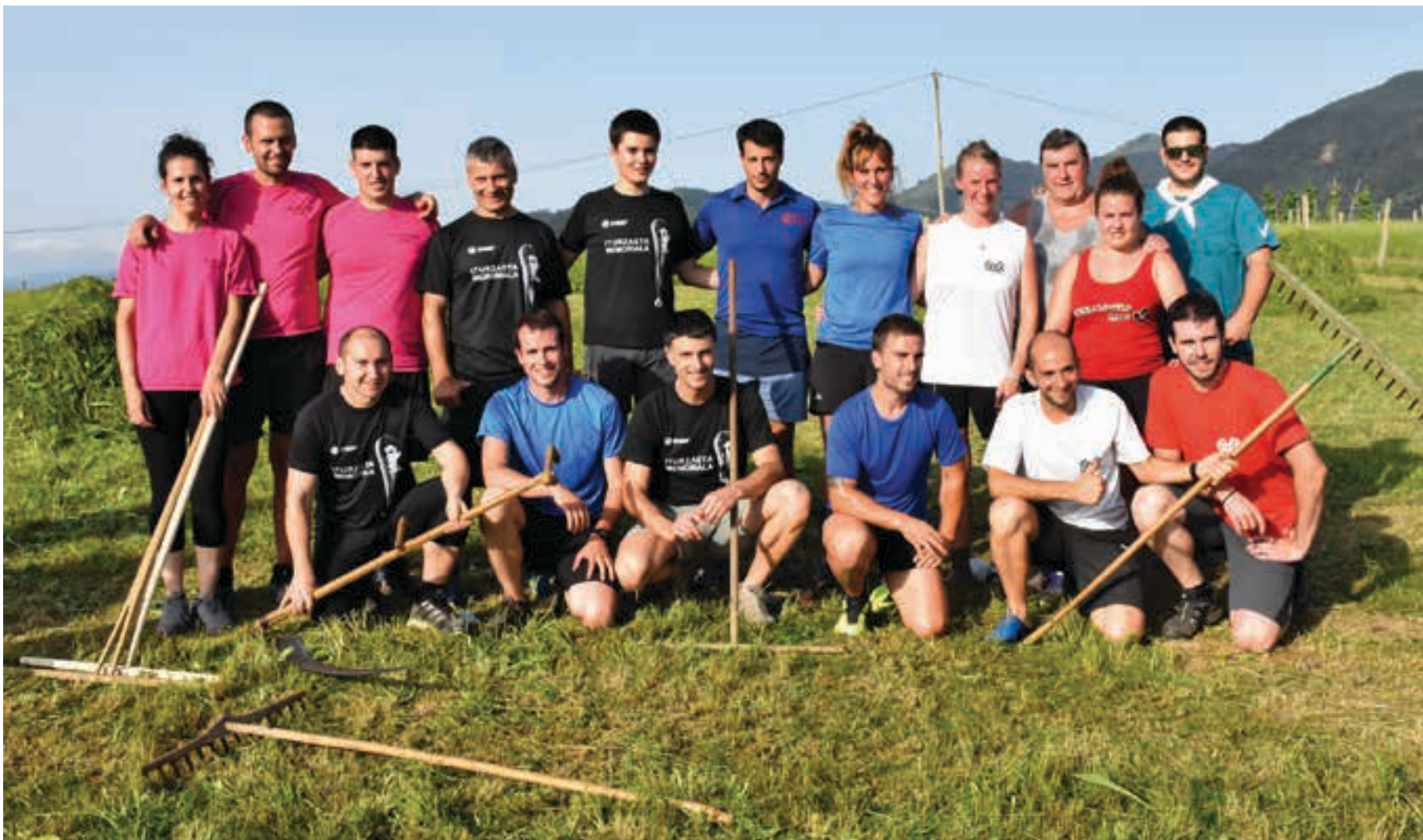
Abuztuaren 4an ikusmin handia piztu zuen sega desafioa egin zuten Goiburun. Argazkian lehian parte hartu zuten kide guztiak, behin saioa amaituta. AIURRI