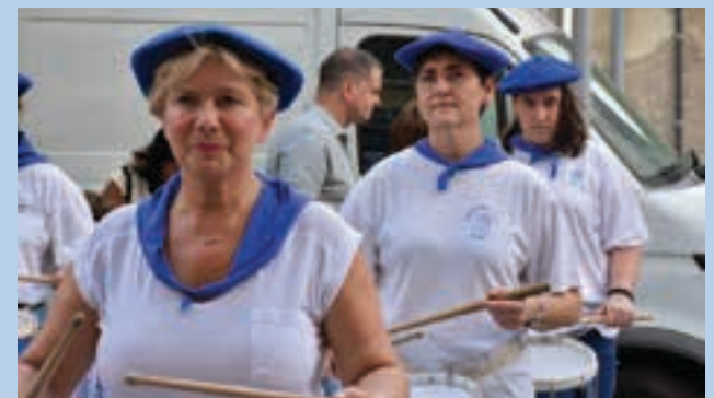
Gazte eta heldu, gizonezko eta emakumezko, talde polita osatu zuten.