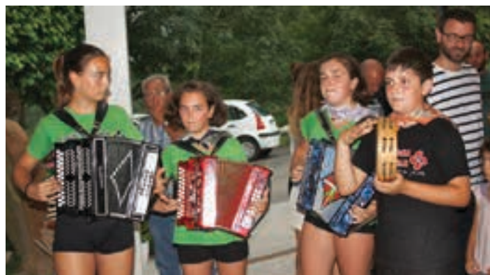
Trikitilari gazteak oilasko biltzean, eguerdian. SEGA