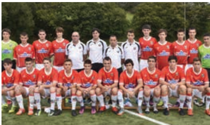
Jubenil mailako taldea, iazko aurkezpen ekitaldian.

FUTBOLA Irailaren 8an, 16:00etan hasita, Urnietako futbol taldeek denboraldi berriari ekingo diote. Ohi bezala, ekitaldi polita antolatzen dute futbol zelaian talde eta jokalariek guztiak banan-bana aurkeztuz. Aurtengoan bederatzi talde izango dituzte, horietatik hiru emakumezkoenak. Ricard-Begiristain memoria goizez jokatu da.