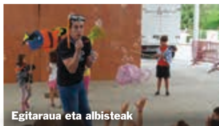
Egitaraua eta albisteak