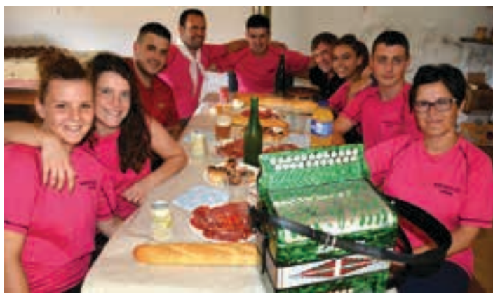
Harrera bikaina egin ohi diete oilasko biltzaileei auzoko etxe eta baserrietan. AIURRI