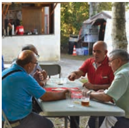
Mus txapelketa abuztuaren 3an, San Esteban egunean. AIURRI