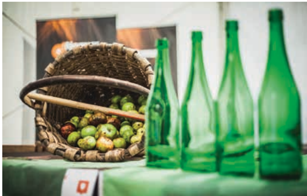
Urnieta azken finalurrekoa jokatuko da, irailaren 22an. Eta finala Usurbilen, datorren irailaren 29an. AIURRI

11:30 Ginkana. 13:30 Paella jatea. Bazkari herrikoien txartelak salgai irailaren 10era arte Biak eta Celtic's saltokietan. 16:00 Eskulanak. 17:00 Bingoa. 18:30 Karaokea. 20:00 Era askotako tortila lehia-keta. 21:30 Afari herrikoia. Bakoitzak berea eraman behar du. 22:30 Diskofesta DJ Katxorren eskutik.