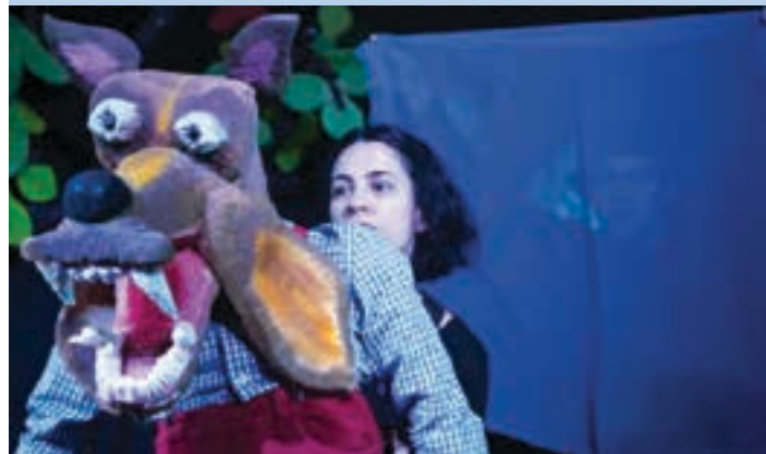
"Kalean otso, etxean uso" ikuskizuna larunbat arratsaldean. PATATA TROPICALA

Haur antzerki emanaldia larunbat arratsaldean Patata tropikala konpainiaren eskutik: "Azken uneko Notizia! Hiru txerri txerriak desagertu dira! Egunkarietan berria zabaldu da! Herri guztiak, Otsoa errudun dela esaten du..."