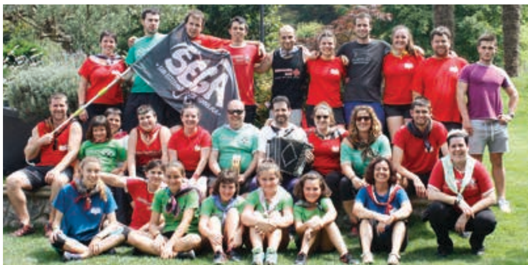
San Inazio egunez, uztailearen 31n, oilasko biltzean parte hartu zuen taldea Txertota jaietxean. SEGA

makina bat ikusle hurbildu ziren; Buruntza irten zen garaile, baina goiburuarrek ere erakustaldia eman zuten. Igandean, pala txapelketako finalera herrikide ugari hurbildu zen. Jaiak zapo- gozoa utzi du denen artean.