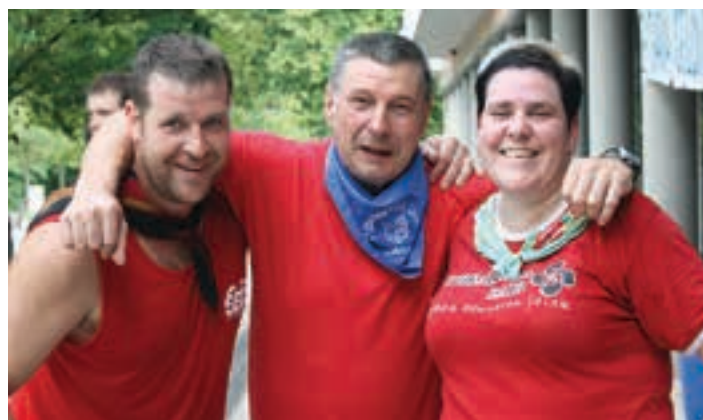
Goiburuarrek etxeberritarrei bisita egin zieten, haien egun handian. SEGA