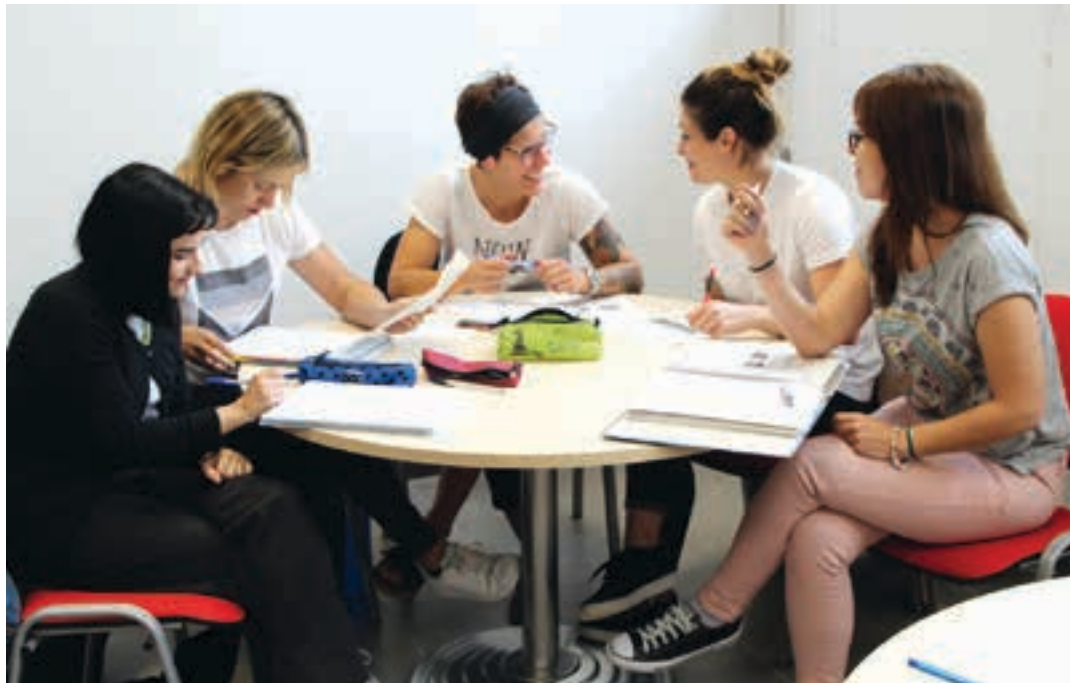
Euskaltegiako ikasleak, apunte artean, ikasturte amaierako azterketareako prestatzen. BURUNTZALDEKO UDALAK

Horrez gainera, HABE Helduen Alfabetatze eta Berreuskalduntzerako Erakundeak ere laguntzak ematen ditu. 2018. urtean 1.800.000 euro emango ditu, eskatzaileen artean banatzeko. Ondokoak dira baldintzak: batetik, 2017ko martxoaren 17tik 2018ko abuztuaren 31ra euskaltegi edo euskararen zentro ho-