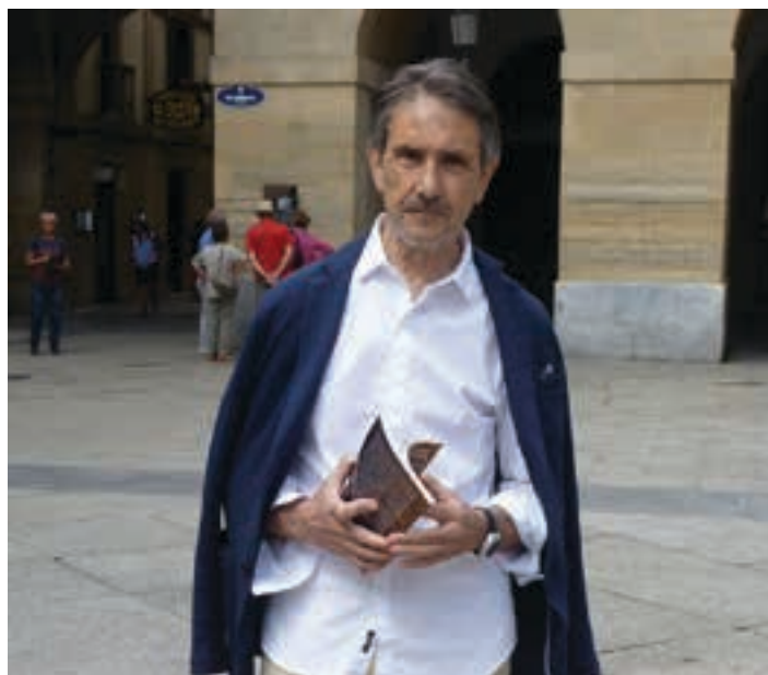
Ramon Saizarbitoria idazlea.

Elkarbizi taldeak hitzaldi-ikastaroaren aurkezpenarako oharra helarazi die hedabideei: Indarkeria politikoaren aroa ulertzeko eta memoria osatzeko orduan narrazio literarioak har dezakeen funtzioa aztertzea