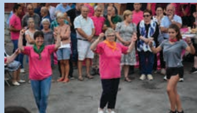
Auzotar eta andoaindar ugari hurbiltzen da ospakizunera.