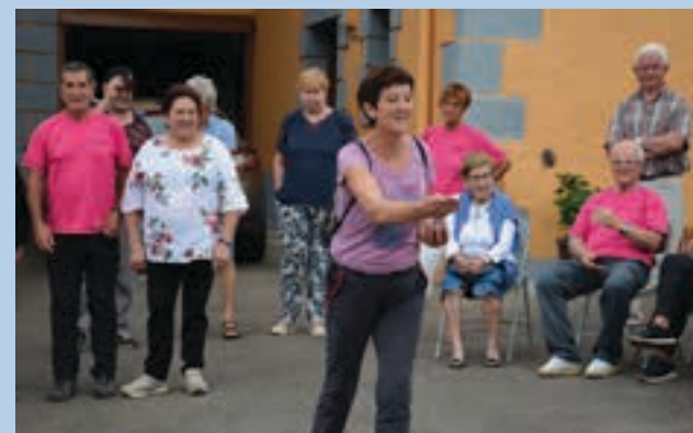
Toka txapelketa, eguneko osagarrietakoa. AIURRI