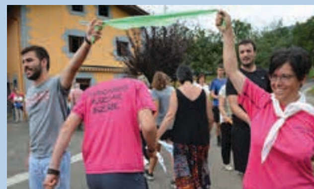
Meza, bertsoak, toka eta dantza izan ohi dira San Roke egunean. AIURRI