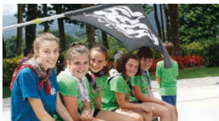
Gazteen kopurua ez zen batere eskasa izan. SEGA

Indarra hartzen ari da han eta hemen, tokian toki lantzen den garagardoa. Artisautza lan horretan murgilduta daude, esaterako, Olajaunako lagunak. Goiburun dastatzeko aukera izan zen.