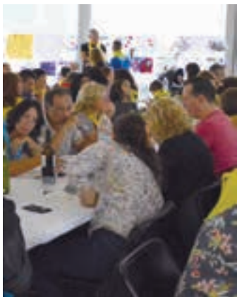
Auzo bazkaria, iazko jaietan. AIURRI