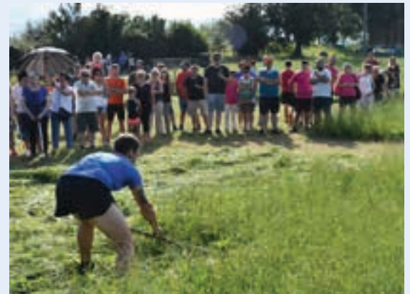
Ikuslegoa Lehian aritu diren bost auzuneetako partaideez gain, ikuslegoa ezinbestekoa izan da hauspoa emateko lehiari. Animoak gogotik eman dizkiete, lehiakide guztiei.