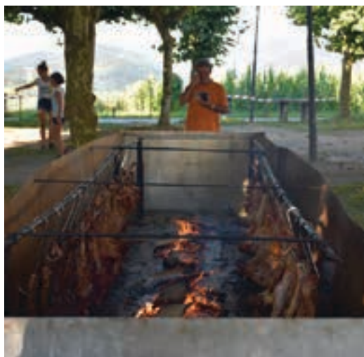
Zikiro jatea prestaketa luzea eskatzen duen otordua da. AIURRI