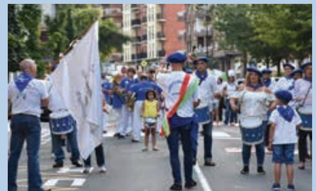
Auzoan barrena danborradan ibili eta gero, helduek afaria egin zuten. AIURRI