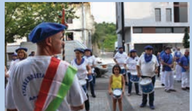
Aita Larramendi kaletik abiatu zen danborrada, Belabi aldera joateko.