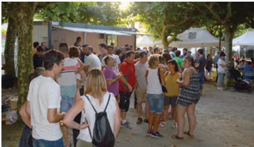
Larunbat arratsaldeko erromerira lagun ugari hurbildu ziren, sega desafioa amaitu eta gero. AIURRI