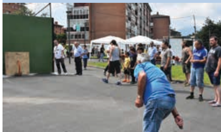
Adinean gora doazenek eta gaztegoek parte hartu zuten tokan. AIURRI

Marrazki lehiaketa Datorren urteko egitarauaren azaleko irudia igande eguerdiko lehiaketatik irten zen. Haurrak eta gazteak lehiaketa noiz hasiko zen zain ziren. 30 lagun inguru taulagainaren ondoan ipini zituzten mahaitan marrazten aritu ziren.