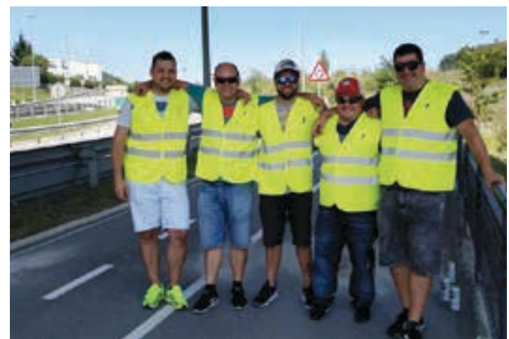
URNIETATIK DONOSTIA ALDERA Laguntzaileak, iaz, Andoain-Urnieta arteko mugan.