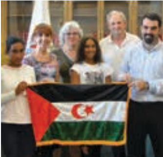
Udal ordezkariak Lamina gaztearekin.