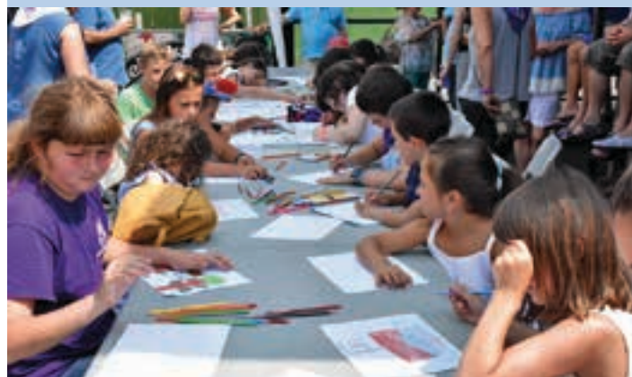
Igande eguerdian beroa handi samarra zenez, itzala bilatu zuten. AIURRI

Paella jana Jai batzordeak 80 plater eskaintzeko paella ontzia egin zuen, baina ez zen eurena bakarria izan. Lauzpabost taldek paella txikiago bana egin zuten, eguerdiko 12:00tan hasita. Argazkikoak izan ziren paella egiten lehenak.