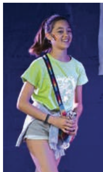
Play back-eko sari banaketa ekitaldia.