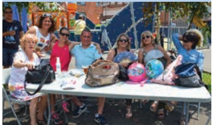
Bero egin du aurtengo jaietan. AIURRI

Haur jolasak Edozein auzoko edo herriko jaietan haurrei zuzendutako hitzorduak antolatzea ezinbestekoa da. Jai batzordeak, gainera, txikiei proposamen berriak eskaini dizkie aurtengo jaietan.