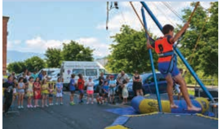
Gomaren bitartez hainbat metroko altuera har daiteke.

Haur jolasak Edozein auzoko edo herriko jaietan haurrei zuzendutako hitzorduak antolatzea ezinbestekoa da. Jai batzordeak, gainera, txikiei proposamen berriak eskaini dizkie aurtengo jaietan.