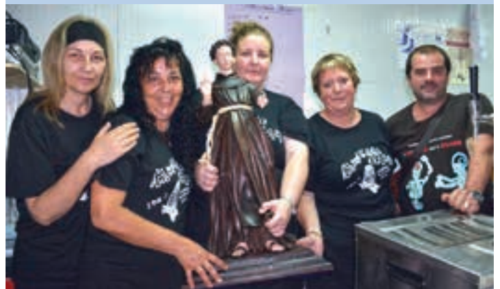
Txosna batzordean larunbatean aritu zen taldetxoa.

Itzalaren bila Sargori zen larunbat eguerdian, eta lanean ez ziren auzotarrak goxotasunaren bila aritu ziren. Itzala eta abanikoa freskagarrien osagarri bikainak bilakatu ziren. Bero egin zuen igande eguerdian ere. Ondorioz, antzeko irudiak errepikatu ziren.