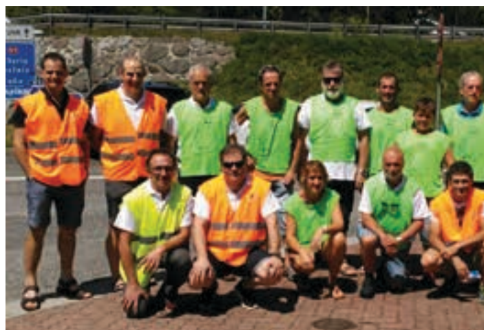
SORABILLATIK URNIETA ALDERA Herrigunea zeharkatuko du Donostiako Klasikoak.