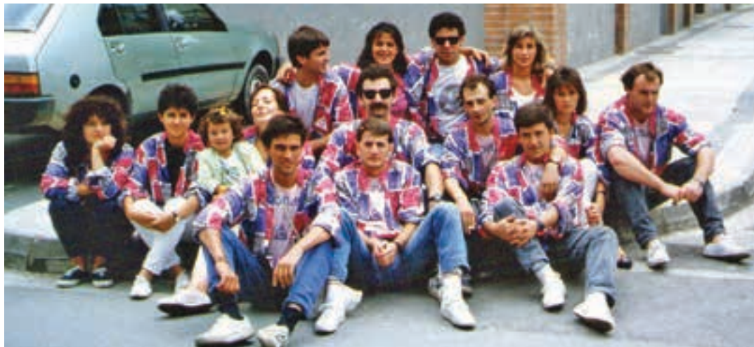
Carbonarios kuadrillako argazkia. CARBONARIOS

Uztailaren 28an ospatuko da kuadrila eguna Santio jaietan. Urtero bezala Etxeondon bazkaldu ostean, herritik zehar kalejira izango da Incansables txarangarekin