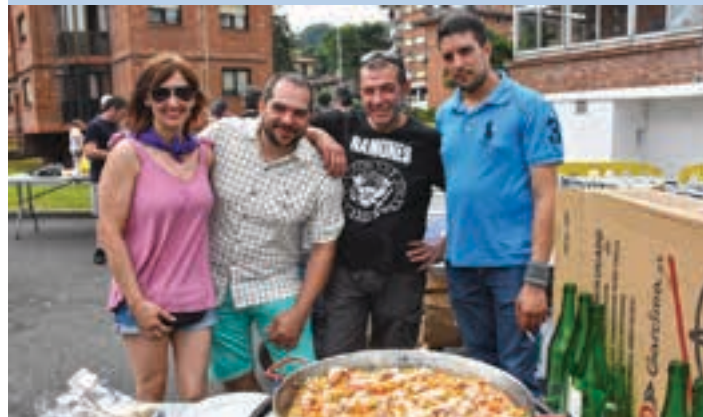
Paella osatzen lehenak izan ziren auzokideak. AIURRI

Paella jana Jai batzordeak 80 plater eskaintzeko paella ontzia egin zuen, baina ez zen eurena bakarria izan. Lauzpabost taldek paella txikiago bana egin zuten, eguerdiko 12:00tan hasita. Argazkikoak izan ziren paella egiten lehenak.