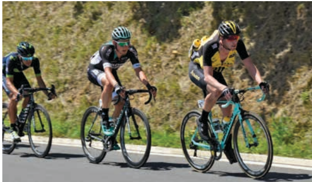
ADUNATIK BETERRI-BURUNTZA ALDERA DATOR Tropela Adunatik barrena Andoainera iristen, iazko Donostiako Klasikoan.