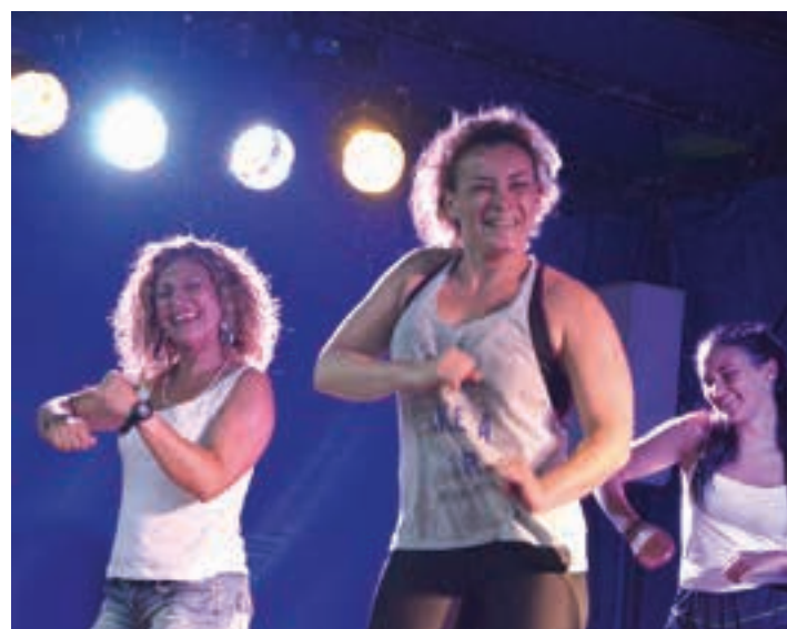
Zumba saio berria eskaini zuten igande arratsaldean, play-back saioarekin batera.