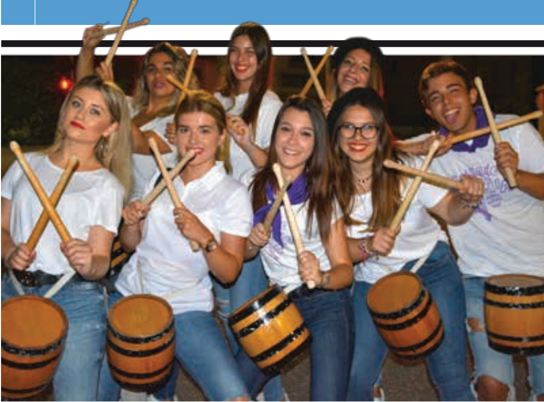
Karrikako gazte taldea, animoz beterik, larunbat gaueko danborradan. AIURRI