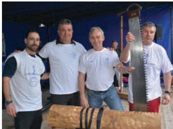
Lagunarteko giroan, auzoen arteko herri kirol saioak izango dira udako jaietan.

ANDOAIN Etxeberrietako jaiak 11:00 Haur tailerrak, patin jolasak. 13:00 Patata tortila lehiaketa. 16:00 Mus txapelketa. 18:00 Sagardo dastaketa. 23:00 "El rincón del desban" taldea. 11:00, Etxeberrieta .