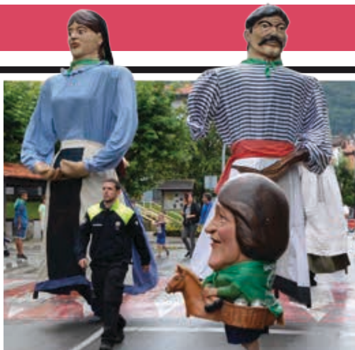
Buruhandi, ipotx eta erraldoien kalejira, Jeronimo dultzaina taldeak alaituta.

10:00 Toka txapelketa Salbadora Jubilatuen Etxearen eskutik, Olaederra kiroldegiaren ondoan. Euriarekin Bearzanan.