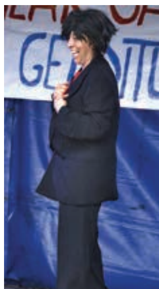
Gazteak eta helduak aritu ziren play-back lehiaketan. Gehientsuenak, hori bai, emakumezkoak. AIURRI