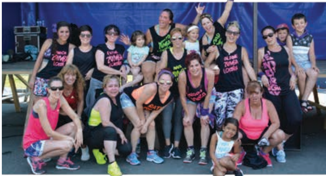
Zumbalokura taldeko kideak, larunbat arratsaldeko erakustaldiaren ondoren. AIURRI