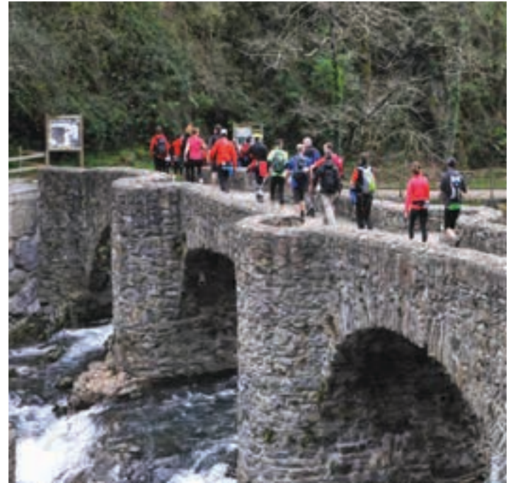
Aizkardi mendizaleen elkarteko kideak Leitzarango Unanibia zubian barrena.

Mendi irteerak erabakitzerako orduan, kontutan hartzen duten