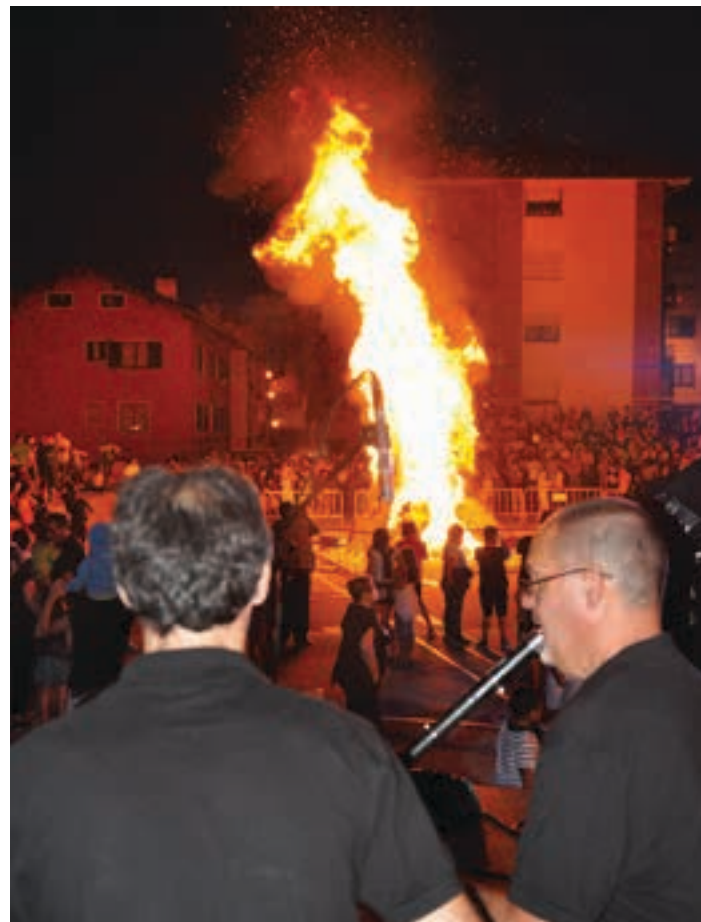
Antzerkia, perkusioa eta dantza emanaldia amaituta, Plazido Muxika plazan sua pizten dute txistulariek zuzeneko emanaldia eskaintzen duten bitartean. ALMU SALAS

Garrak abiada bizian indarra eta altuera hartzen ari diren bitartean, Txanbolin taldeko txistulariek musika egiten jarraituko dute.