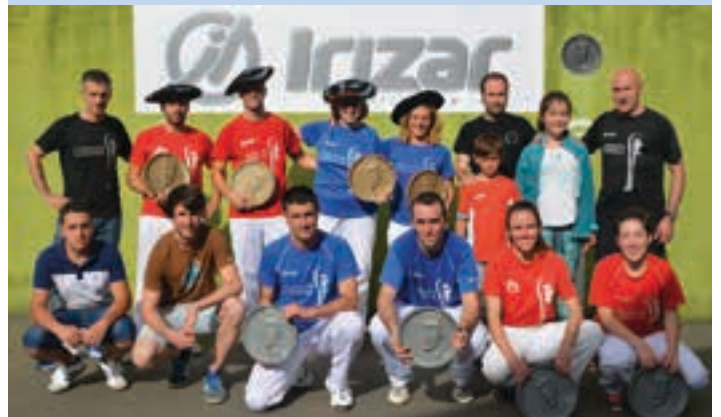
Iturzaeta pala txapelketako finalak jokatzen diren larunbatean.