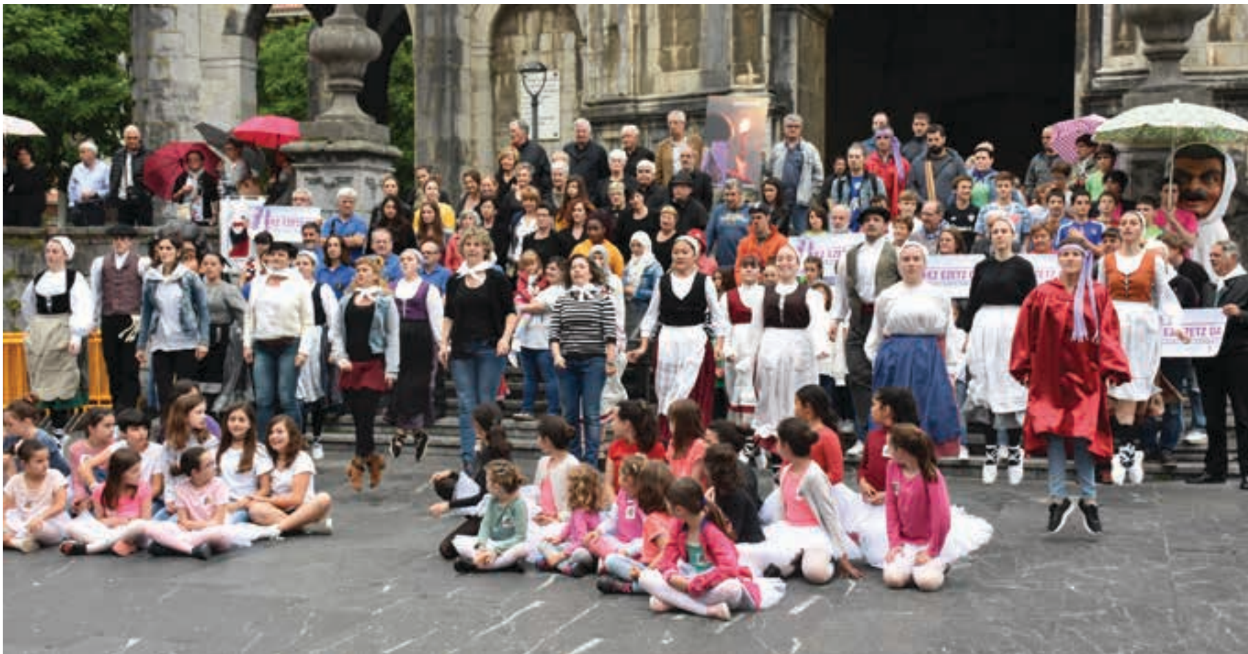
Jaietako ia protagonista guztiak elkartu ziren Goikoplazan, aurtengo Sanjuanak iragartzeko bideoaren grabaketarako. Argazkian Udal ordezkariek eta hainbat talde eragileetako ordezkariek ageri dira.