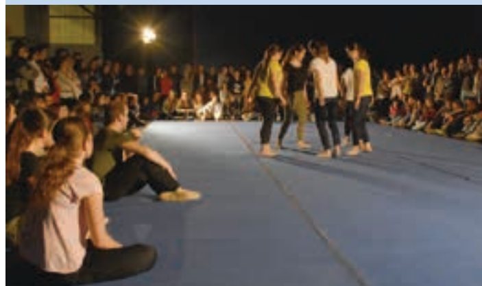
Dantzariak erdigunean jarrita, ikusleak albo guztietan zituzten. AIURRI

Jendetza San Juan plazan iragarrita zegoen emanaldia, baina euri kontuak direla eta Udal pilotalekuan egin behar izan zuten. Ikusleek sartzean, bi foko eta dantzarietako zoru urdina topatu zuten. Hura inguratuz dozenaka lagun elkartu ziren.