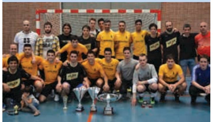
Tlalaka eta Keler taldeak, aurtengo finalistak. Tlalakak irabazi zuen.