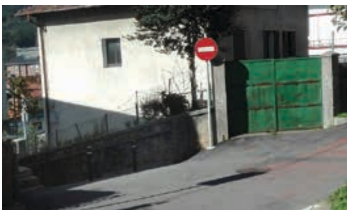
Aierbeko pasabidea zabalik izango da San Juan jaietan. AIURRI