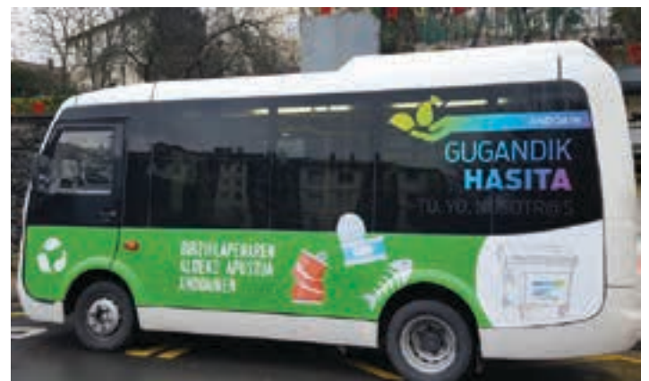
Hiribus zerbitzua 00:00 eta 03:30 artean ibiliko da hilaren 22an eta 23an.

Berdintasun saileko aurtengo lan ildo nagusietakoa eraso sexistei aurre egitea izan da. Andoaingo jai nagusietan ez ezik, kanpainari udako gainerako auzoko jaietan jarraipena eman nahi diote. Kaletxikitik hasita.