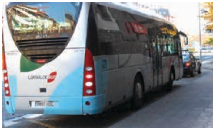
Asteasuko bus zerbitzua Villabona, Zizurkil, Irura, Anoeta eta Tolosara iritsiko da.

jatorriko taldea han eta hemen ari da 'Tenpluak erre' diskoa aurkezten. Bi taldeen estiloa ezagututa, kontzertu elektrikoa izango da. Gitarrak zorrozuta iritsiko dira talde biak.