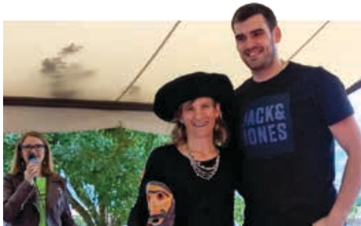
Ezkurdia pilotariaren eskutik jantzi zuen irabazleari dagokion txapela.