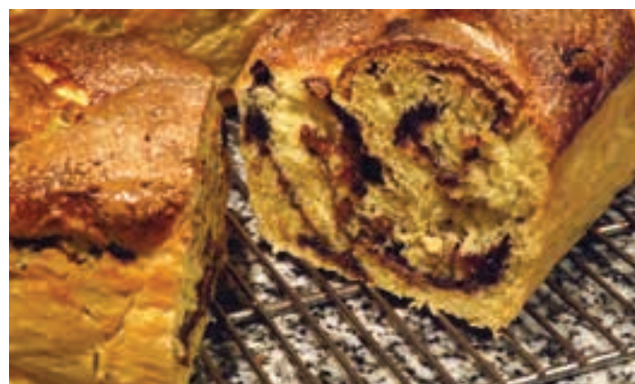
Errumania aldeko Cozonac jaki gozoa dastatu ahal izango da Andoainen.

Pintura, egur taila eta eskulanak tailerretako ikasleen lanak Urigainen izango dira ikusgai, ekainaren 22tik 28ra. Lan horiez gain, jaietako kartel lehiaketara aurkeztutako lanak ikusgai izango dira ere. Erakusketa zabalik izango da 18:00etatik 20:00etara. Ekainaren 23an arratsaldeko ordutegiari goizekoa gehitu behar zaio (10:30-13:30).