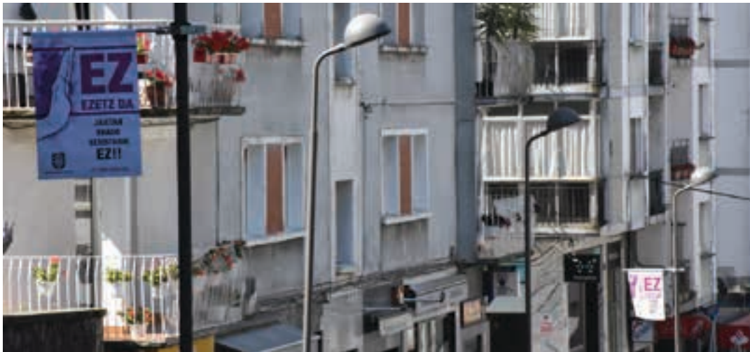
'Ez ezetz da' afitxak kalez kale eta farolatan ikus daitezke herrigunean.

Andoaingo Udaleko berdintasun sailak Santa Krutz jaietan abiatutako kanpaina herriko jai guztietara zabalduko du, Sanjuanetatik hasi eta Sorabillako jaietaraino