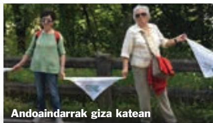
Andoaindarrak giza katean