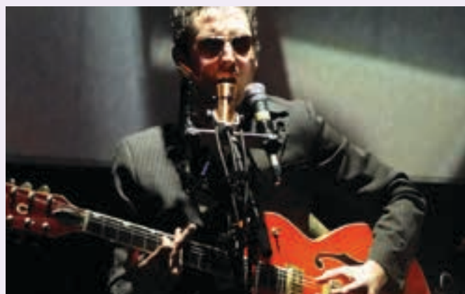
The Legendary Tigerman.

23:15 The Kill Devil Hills Australian sortutako akustiko eta country rock taldea da, eta dagoeneko bost disko aurkeztu dituzte. "In on Under near Water" azken diskoa aurkeztera datoz.