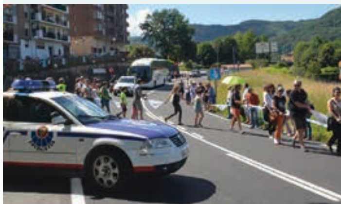
Andoain Udalteko eta Usurbilen Ertzaintza lan eta lan aritu ziren.

Ordezkaritza politikoa EH Bildu eta EAJ-PNVko ordezkariak zabala hurbildu zen giza katera. Zinegotzietatik gain, bi alderdietako kide eta militante ezagunak ikus zitezkeen ibilbidean zehar. Sare sozialetan denek ere parte hartze aktiboa izan zuten.