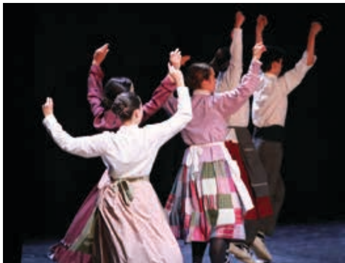
Gaztetxoak ikuskizun bikaina prestatzen ari dira. AIURRI

Helduek kale giroan egingo duten lehen ikuskizuna izango da hau. Ikasturte osoa daramate ekitaldirako prestatzen eta beraien artean urduritasun puntu bat nabari dela aitortu du Jauregik. Egingo dituzten dantza ezberdinen sorkuntzan dantzariak parte hartze zuzena izan dutela erantsi du, beti ere Edu Muruamendiarazen gidaritzapean.