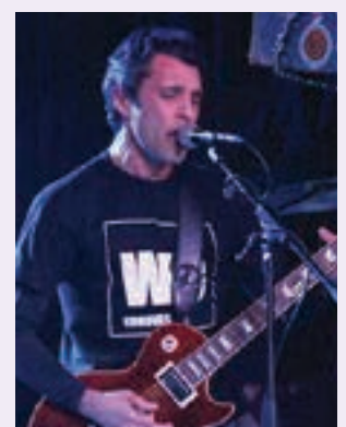
The WC Grooves.