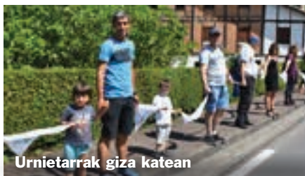
Urnietarrak giza katean