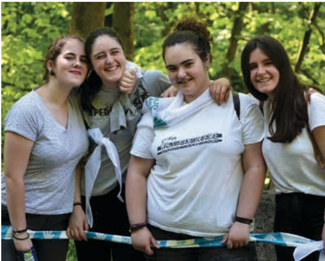
Parte-hartzaile askoren gogoia aurpegietan ikus zitekeen. Eskuz esku egin zen ekitaldia, baina baita irribarrea ahoan ere. AURRI