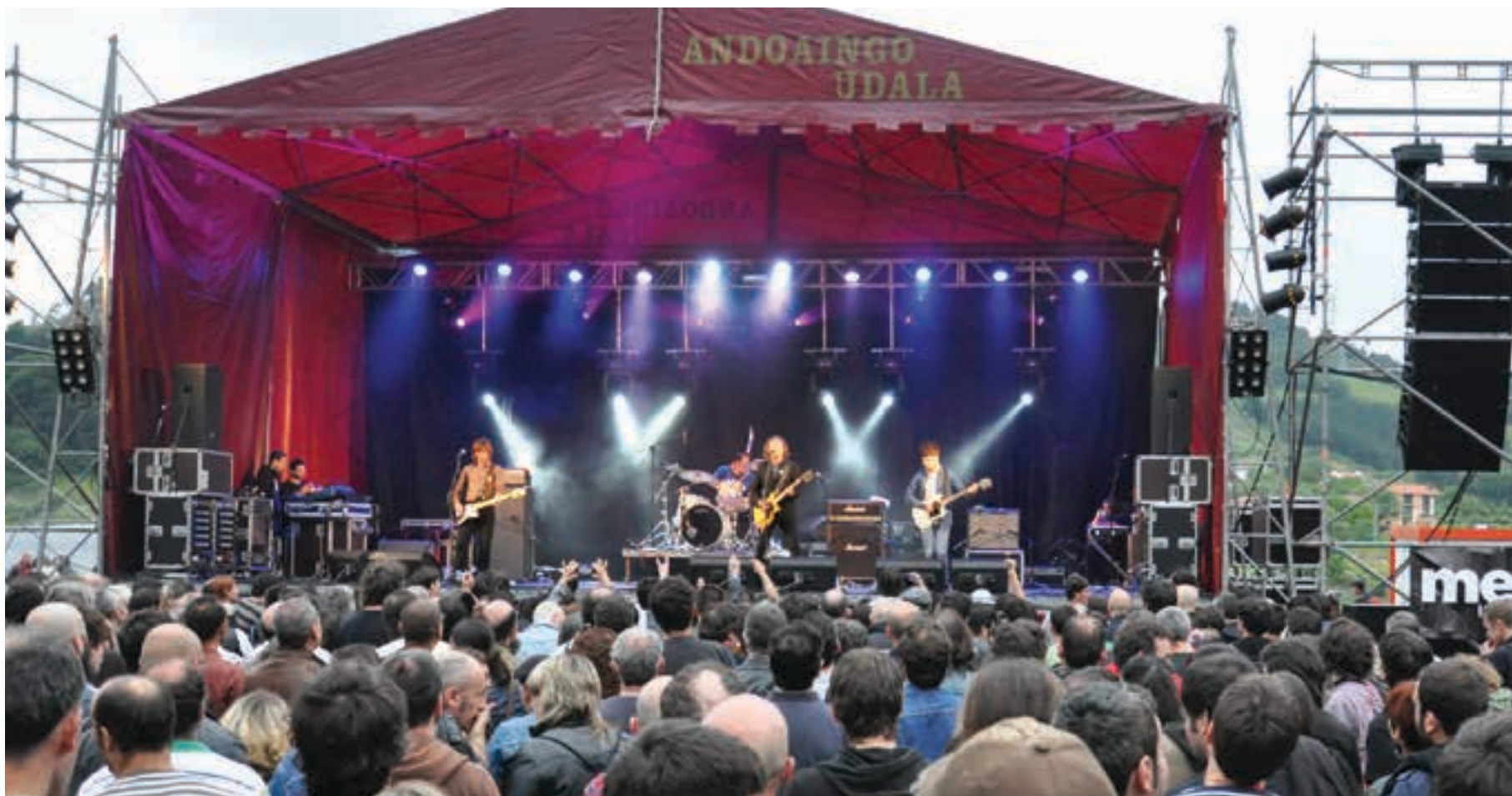
Nafarroa plazara ehunka rockzale hurbiltzen dira Andoaingo Rock jaialdian. Aurtengoa hamaikagarren edizioa izango da. Arratsaldeko 18:00tan abiatuko da aurtengo jaialdia. AIURRI