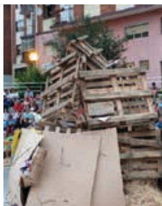
lazgo ekitaldia, Plazido Muxika plazan.

urteotan, ikuslegoaren gozamerako. Gutxi falta da aurtengo hitzordurako, aste bat baino ez. Gaueko hamarrak direnean, ekainaren 23an, dantza eta perkusio erritmoek hasiera eman gozateko diote gauari.