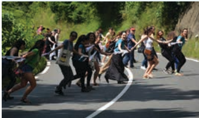
Ibilgailuak ez zebiltzala ikusita, partaideek olatua egiten zuten.

Ospakizuna Parte hartzeko gogoia bazegoela argi geratu zen igande eguerdian, andoaindarrek bete behar zuten giza katearen zatia ospakizun giroko hitzordu bilakatu baitzen. Herritik hamar autobus irten zen Usurbil-Aginaga aldera.