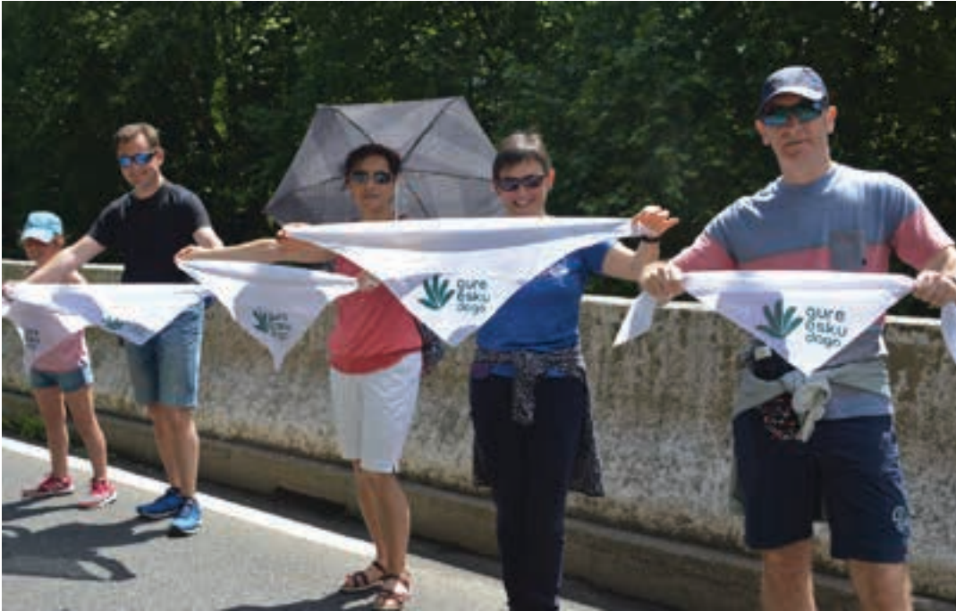
Giza kateak iraun bitartean eguraldi bikaina izan zen Usurbil aldean. Eguzkiak gogotik jo zuen eguerdi aldera.