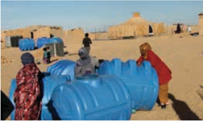
Ur zerbitzua bermatzeko plastikozko edukiontzia Sahara aldean.