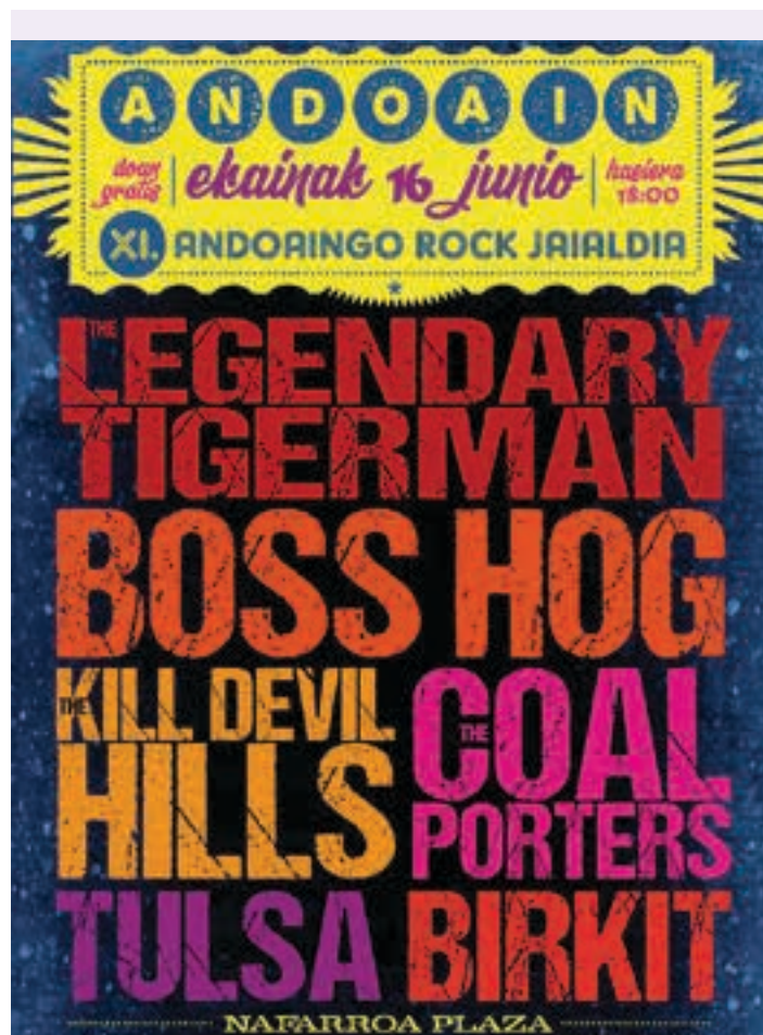
Aurtengo rock jaialdiaren kartela, bertako eta nazioarteko partaidetzarekin.

Ez da modan izango, zaletuei bost axola horrek. "It's only rock and roll but I like it" kantatzen duen rockeroa ez da inoiz hilko.