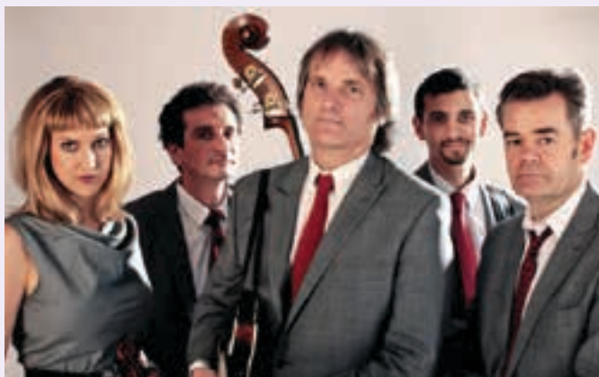
The Coal Porters.

12:00-12:45 Zumea plaza Rock&roll, blues eta country musika estiloak uztartzen ditu Gernikako musika taldeak.