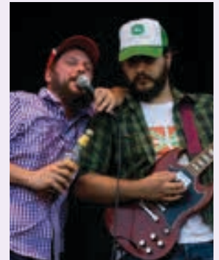
The Riff Tuckers.

12:00-12:45 Zumea plaza Rock&roll, blues eta country musika estiloak uztartzen ditu Gernikako musika taldeak.