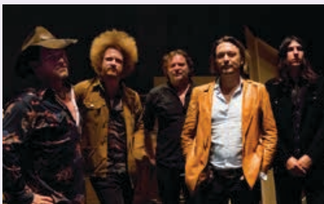
The Kill Devil Hills.

13:00-13:45 Bastero plaza Folk, country, bluegrass... musika estilo ezberdinak Donostiako musika taldean.