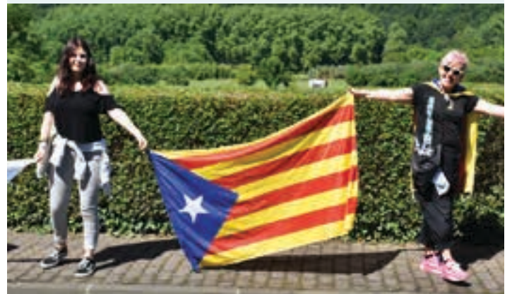
Aginagan ikus zitekeen estelada urnietarra zen. AIURRI

Ordezkaritza politikoa Urnietako EAJ-PNVko eta EH Bilduko udal ordezkariak zabalak igandeko giza katean parte hartu zuen, Gure Esku Dago ekimenarekin eta urnietar askoren borondatearekin bat eginez.