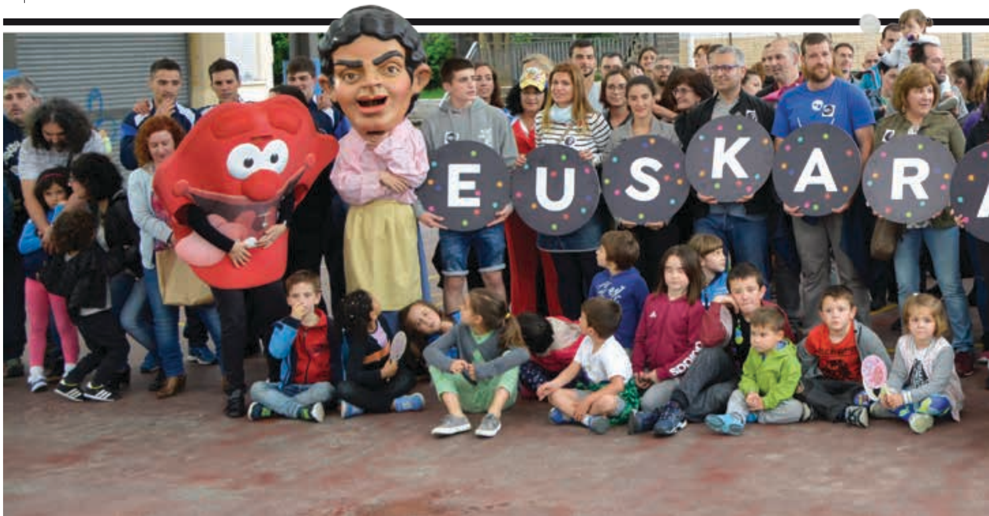
Andoainen, Udalarekin batera, ikastetxeak, kirol eta kultur elkarteak eta euskaltzaleak Euskaraldia antolatzeko lehen urratsak ematen hasi dira. AIURRI