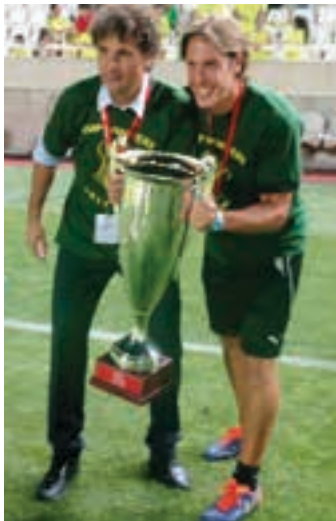
Idiákez eta Orozko, Zipreko koparekin.