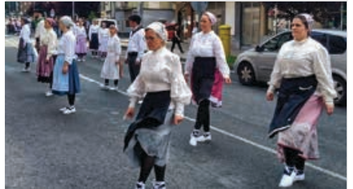
Helduenek ere dantza egiteko aukera baliatu zuten. J.ELUSTONDO