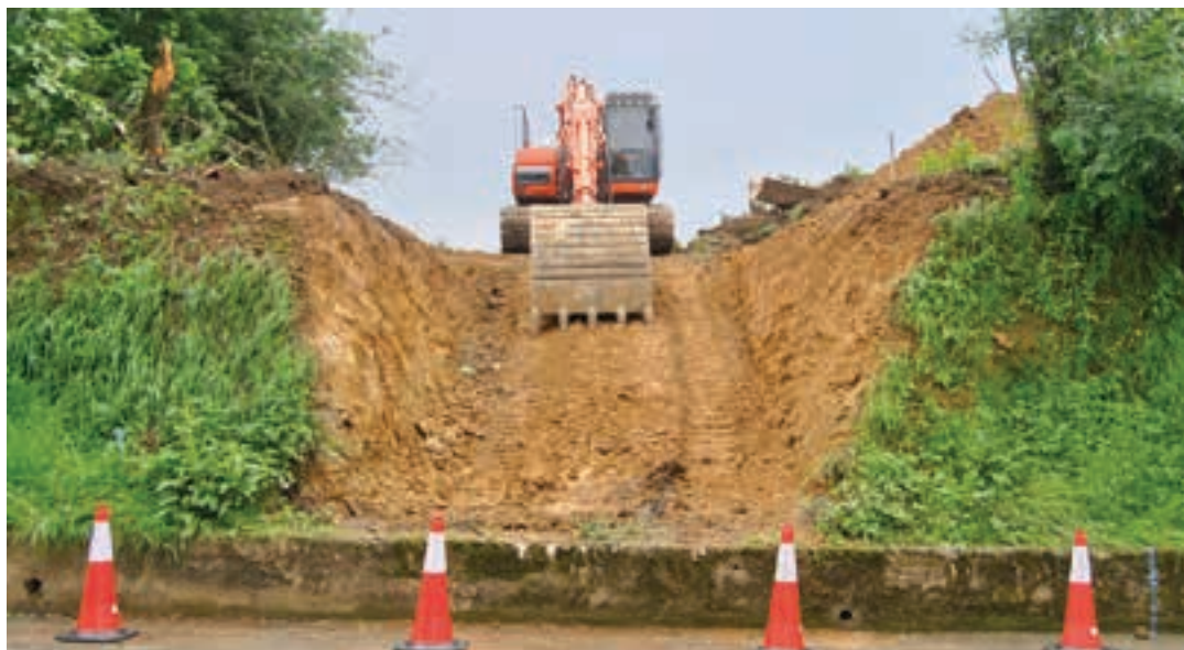
Txoritagainen 90 ibilgailurako aparkalekua prest eduki nahi dute, udazkenerako. UDALA