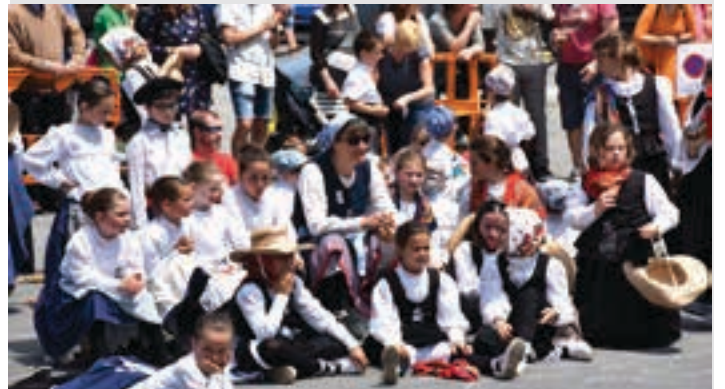
Urkiko txikiak, adi-adi taldekide nagusigoei begira Goikoplazan. AIURRI