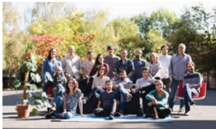
Iturola Elkarlan sorguneko kideak, taldeko argazkian. ITUROLA ELKARLAN SORGUNEA