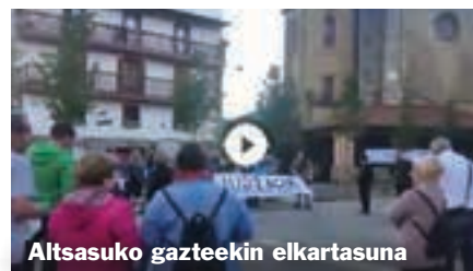
Altsasuko gazteekin elkartasuna