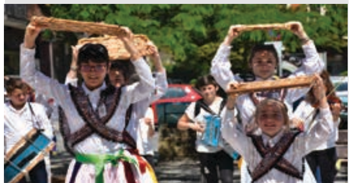
Iparraldeko dantzariak Sardinera dantzari ekinez, Zumea plazan. AIURRI