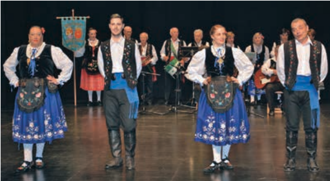
Extremadurako folklorea Iruñeko "Raices y brotes" taldeak eskaini zuen Bastero auditorioan. AJURRI