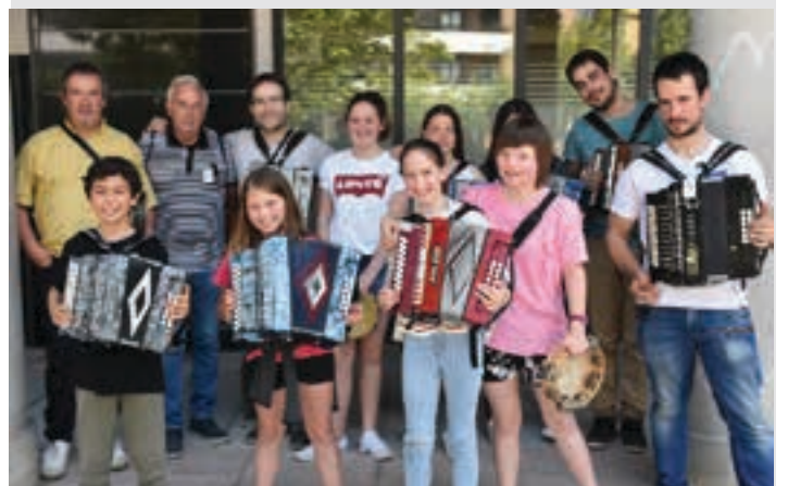
Zarautzeko trikitilariak. AIURRI