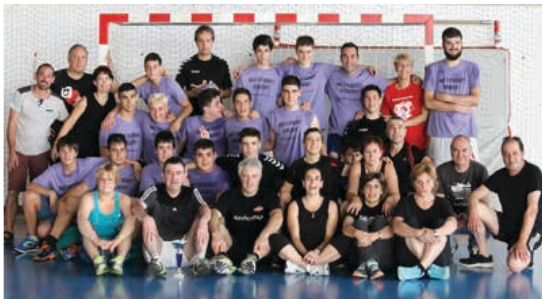
lazko ospakizunean, UKEko eskubaloi ataleko jokalarik, prestatzaile eta gurasoak. UKE

Bai, urtero elkartzen ditugu talde guztiak, baita guraso eta entrenatzaileak ere. Gainera afariaren aurretik, larunbat arratsaldean 16:30etan hasita, kiroldegian guraso, jokalarik eta entrenatzaileen arteko lagunarteko partidak jokatu ditugu.