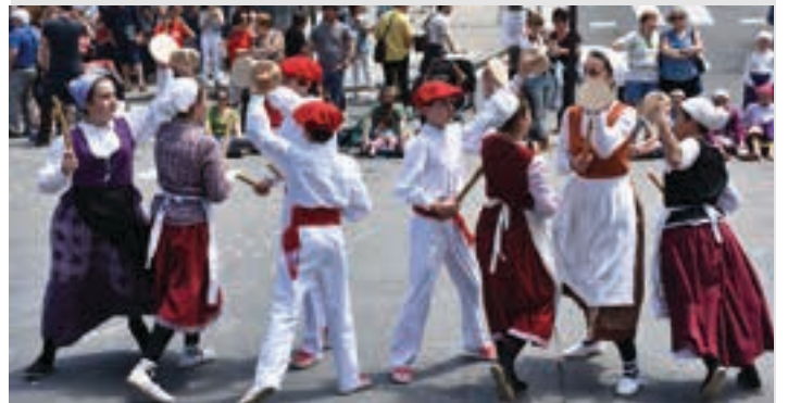
Urkiko gazteak Brokel dantza eskainiz. AIURRI