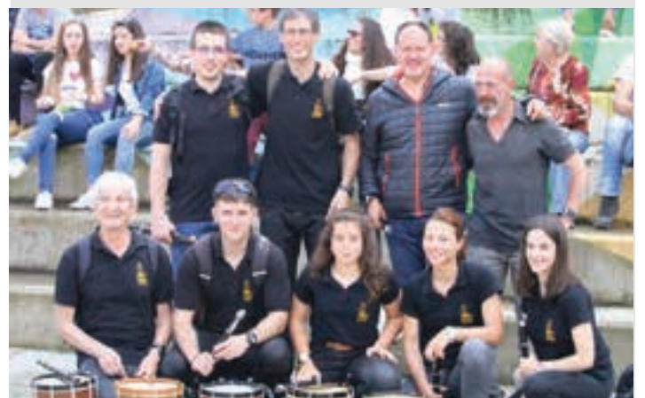
Txanbolin txistulari taldeko kideak, Plazido Muxika plazan. J.ELUSTONDO