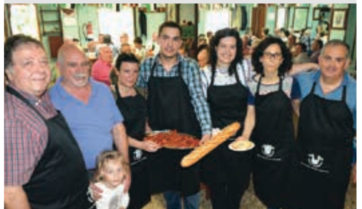
Hamaiketakoak egiten eta zerbitzatzen ibili zen taldea.