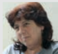
MERCE BRAU CORREOSEKO LANGILEA

"Hasieran zaila dela irudituko zaie baina erdaldunei pixkanaka hasteko esango nieke".