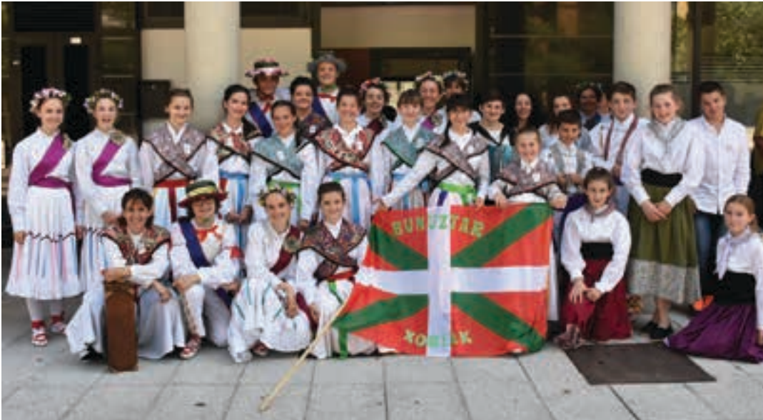
Arbona (Lapurdi) eta Oztibarreko (Nafarroa Beherea) dantzariak Kotoi elkartearen hamaitetakoa egin ostean. AIURRI