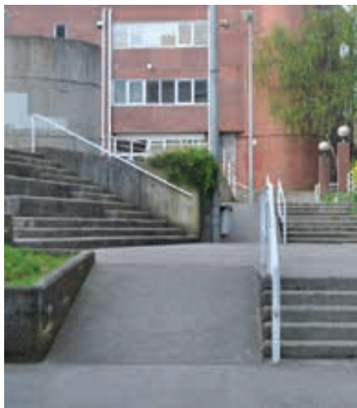
Eroskitik eta Denda Berri elkar lotzeko bidea arinduko dute.

Hori guztiaz gain, Urraka auzoan eraiki den igogailuaren bi alboetan baranda berriak ipini dituzte.