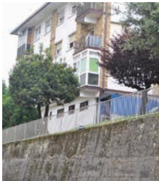
Urrakan, igogailuaren bi alboetako barandak berritu dituzte.