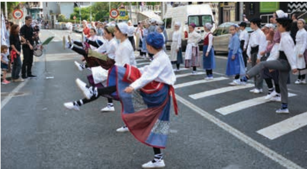
Urnieta dantzan aurtengo edizioan Idiazabal kalea trafikora itxi zuten, dantza saioei tarte eskaintzeko. AIURRI

zen, larunbatean. Jaialdia ez zen eguerdiko saiora mugatu, jaiak arratsaldean ere jarraipena izan zuelako. Arratsaldean Muramendiarazen saio gidatua eta Jaiki Hadi musika taldearen ikuskizuna izan ziren. Errero-riarekin amaitu zen eguna, Zubitxo plazan.