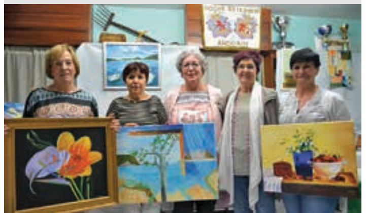
Erakusketan parte hartzen ari diren ikasleak, irakaslearekin batera.

Tradizioa Extremadurako pintxo eta ardo dastaketa egin zuten larunbat eguerdian, Hogar Extremeño elkartearen. Bolondres taldearen lanari esker, hamaiketakoak primerakoa izan zen.