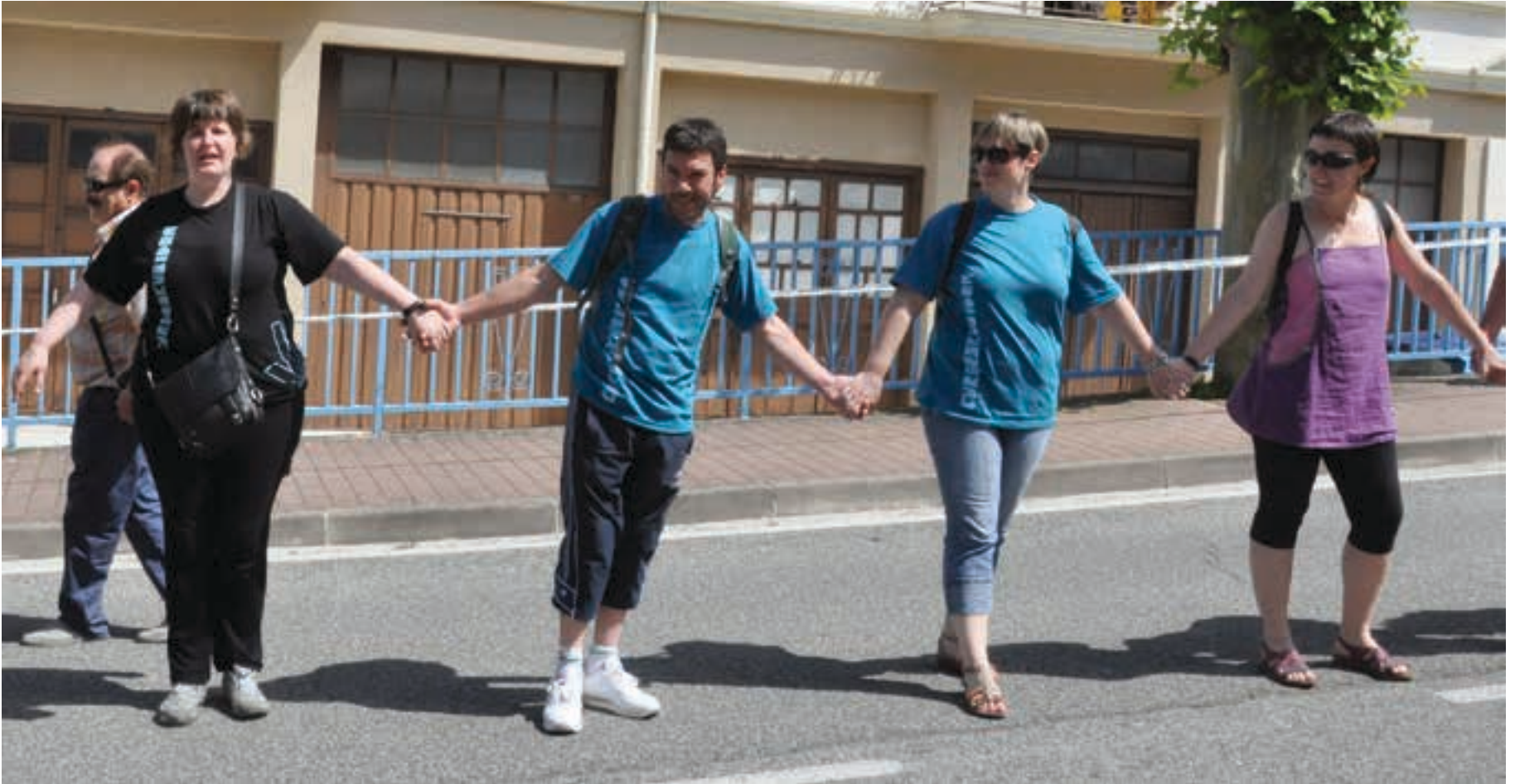
2014ko ekainean bezalaxe, oraingoan ere ehunka andoaindar eta urnietar abiatuko dira Usurbil-Aginaga aldera giza katean parte hartzera. AIURRI