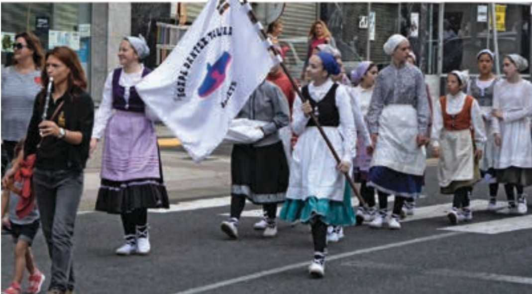
Txanbolin txistulari taldeko kideen atzetik, Egape dantza taldeko kideak. AIURRI