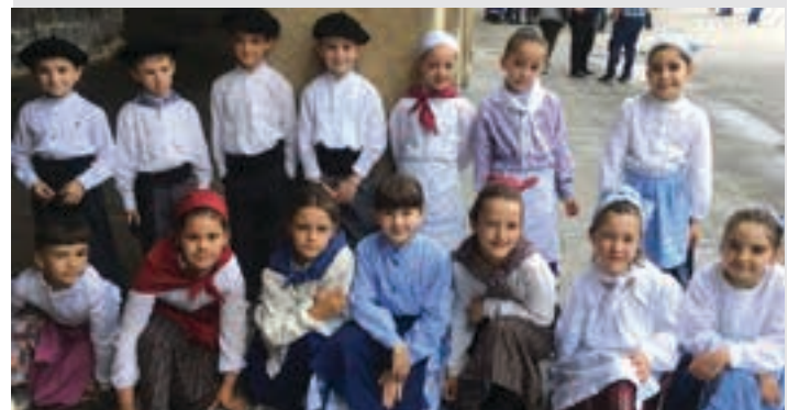
Txikitxoek San Juan plazan, emanaldia egin ostean. J.ELUSTONDO