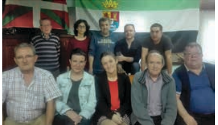
Astearte arratsaldean kultur lehiaketan parte hartu zuten hainbat kide.