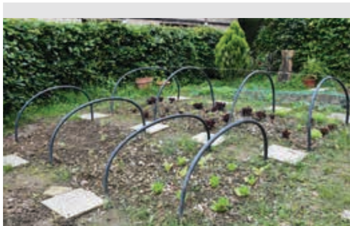
Maila ezberdinetako ikasleen artean zaindutako baratzea. AIURRI