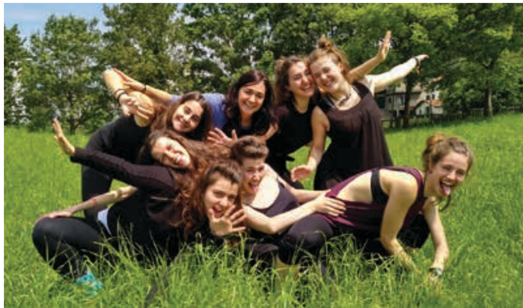
Haur, gazte eta heldu taula gainera igoko dira ikasturtean zehar landutakoa jendaurrean eskaintzeko. KATRAMILA