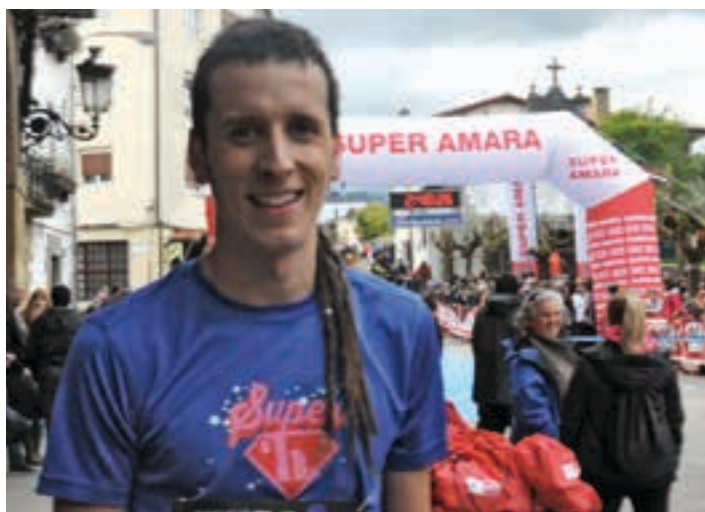
Xuban Ezeiza Urnietako mendi lasterketa egin zen azken edizioan. AIURRI

Hortxe eskarmentuak erakutsi duena: Sancti Spirituko aldapan, herriko lagunak oihuka ikusten dituztenean, patsada edukitzea. Eta Aizkorri-rira bidean sobera ez berotu. Urbiara sendo iritsi. Eta handik jaitsi, eta iritsi. Txukun. Zutik. Sendo. Hegan egiteko! Amets egiteko!