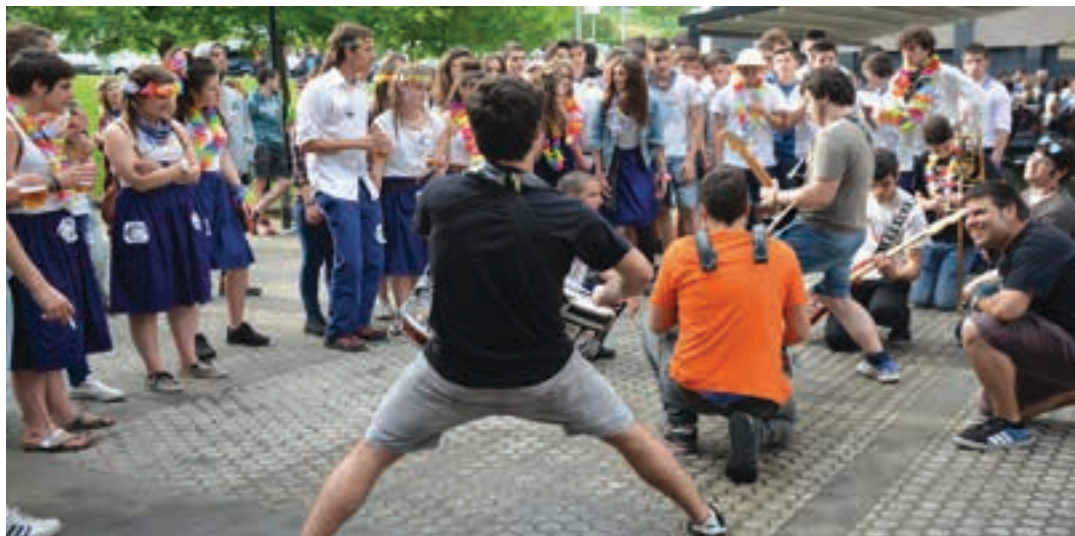
Matraka elektro-txaranga kaleak alaituko ditu ostiral gauean. Elektro txaranga ohikoa bilakatu da azken urteetan. AIURRI

Gazte afaria, herri bazkaria, zuzeneko musika emanaldiak..., festa ziurtatuta izango da Urnietan, asteburu osoan zehar. Ostiralean hasita, gainera, adin tarte guztiak kontutan hartu dituzten ekitaldiak burutuko dira aurtengo Gazte festetan