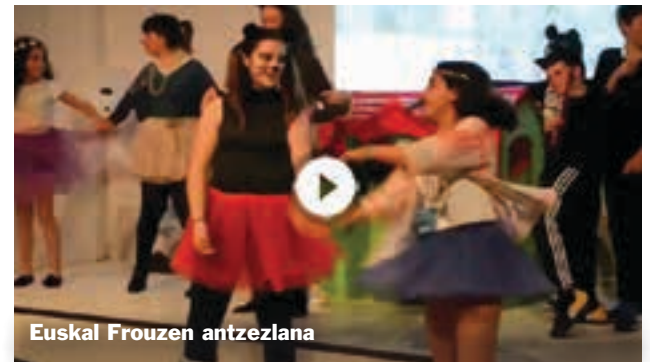
Euskal Frouzen antzezlan