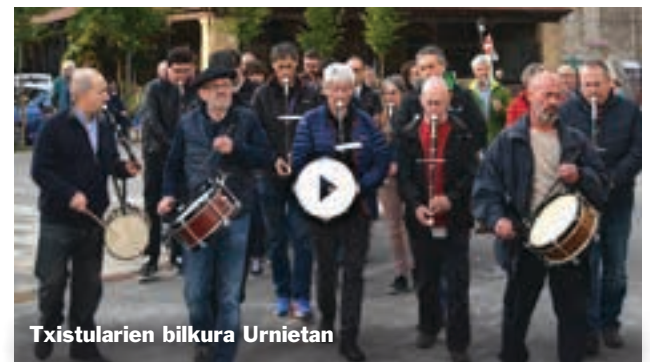
Txistularien bilkura Urnietan