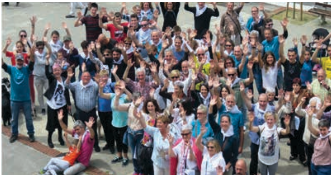
"Klik eguna"ren amaiera ekitaldia taldeko argazkia ateratzea izan zen. Irudian, ekimenarekin bat egin zuten herrikideak.

Urnietako Gure Esku Dago ekimena asteak daramatza sentsibilizazio lanetan, eta joan zen larunbatean, kultur eragile ezberdinen parte-hartzearekin "Klik eguna" antolatu zuten. Izena emateko garaia iritsi da, ezarritako helburuak lortu nahi badira