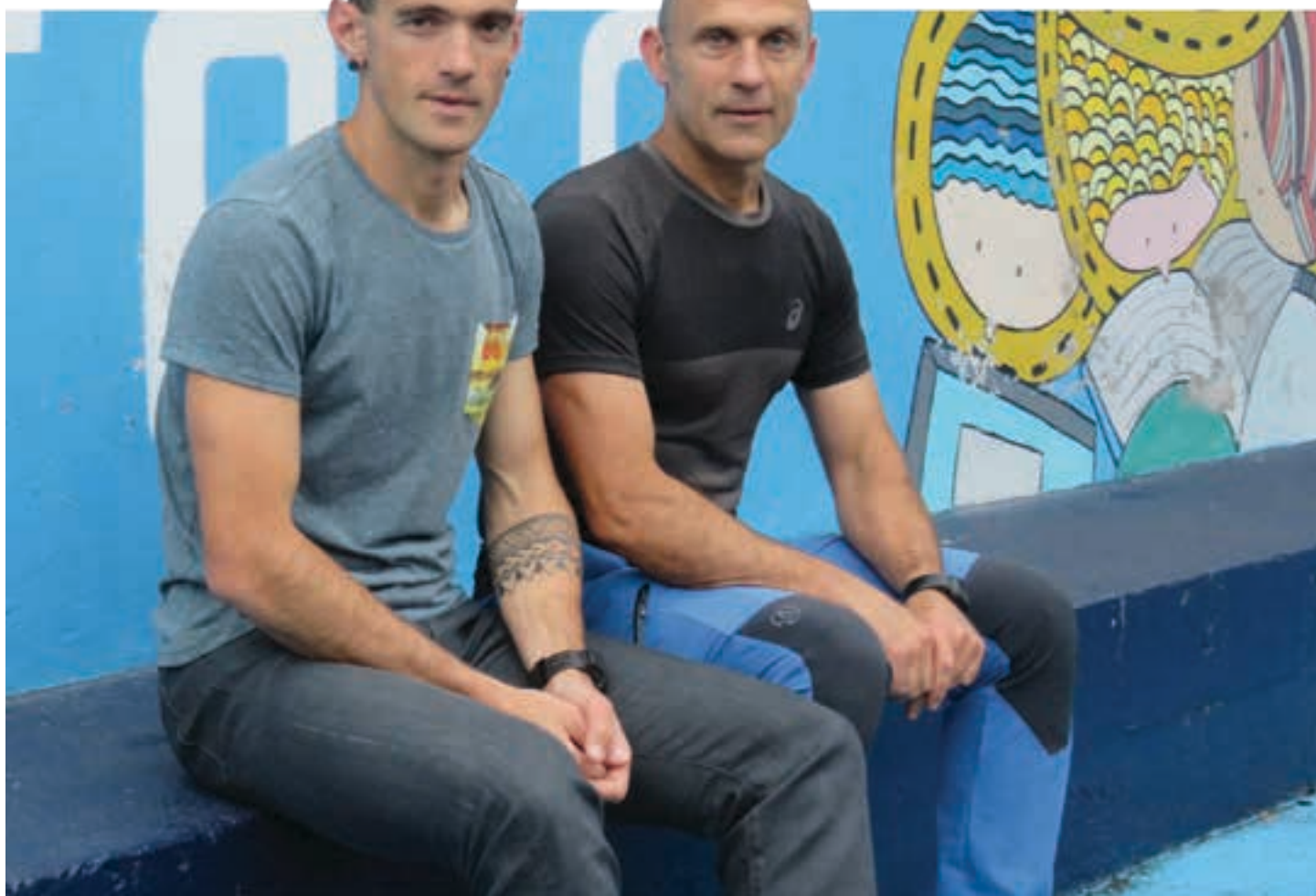
Legarretak eskarmentu sobera du, edizio guztietan parte hartu duelako. Almortza, aldiz, lehenbiziko aldiz irtengo da zozketan dortsala tokatu eta gero. AIURRI