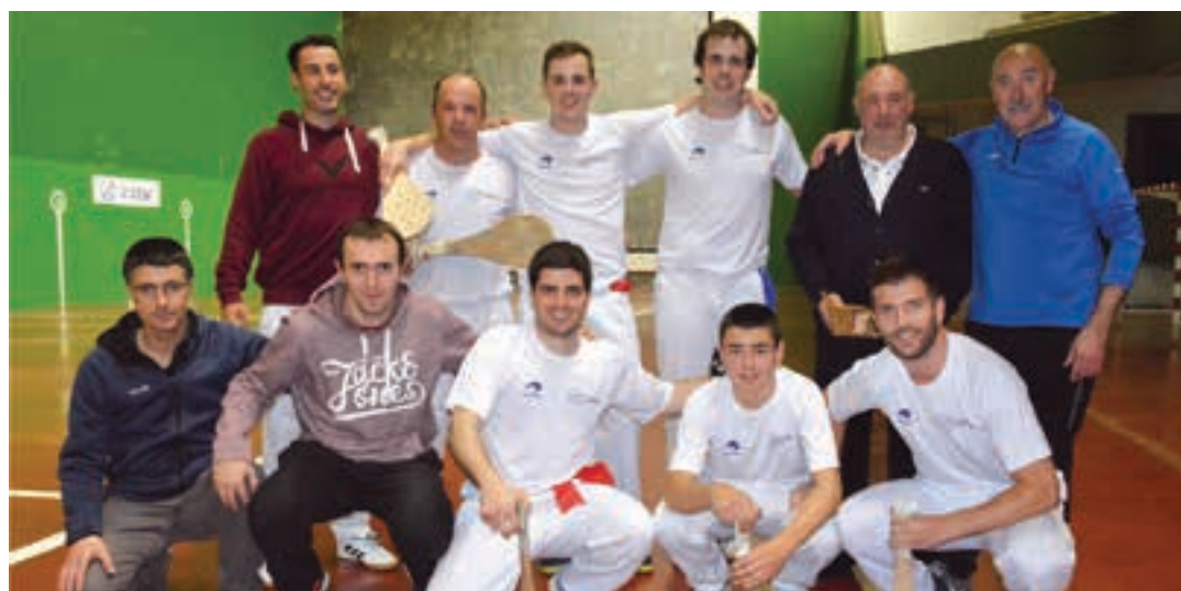
Pala taldeko kideak, joan zen ostiralean Arrate pilotalekuan, Zumaiakoekin batera.