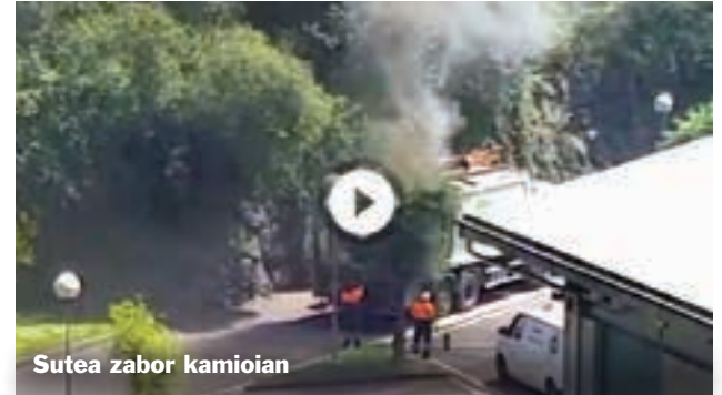
Sutea zabor kamioian