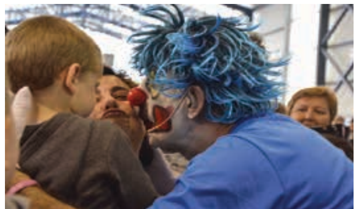
Pailazoaren emanaldia amaitzean, muxuak emateari ekiten diote.