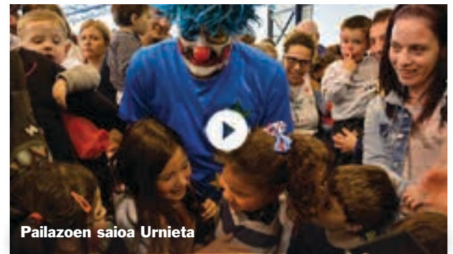
Pailazoaren saioa Urnieta