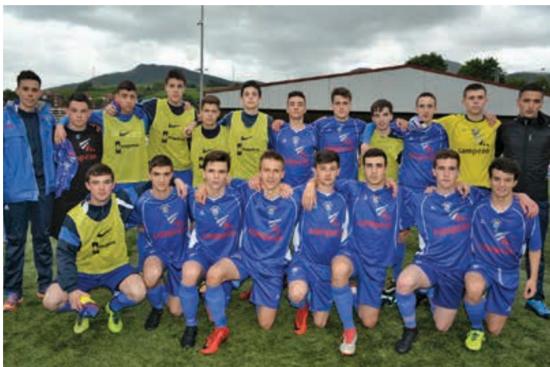
Jubenil mailakoek ondo ezagutzen dute Urnietako futbol zelaia. Ligaskako azken aurreko partida bertan jokatu zuten. EUSKALDUNA