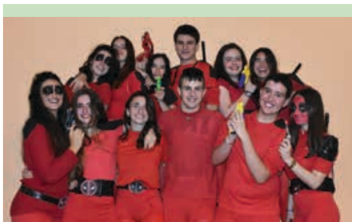
laz bezala, hainbat koadrila mozorrotuta ibiliko dira ostiral gauean. AIURRI

Lehenago Zumbaton eta Urnietan warrior ikuskizuna izango da San Juan plazan.