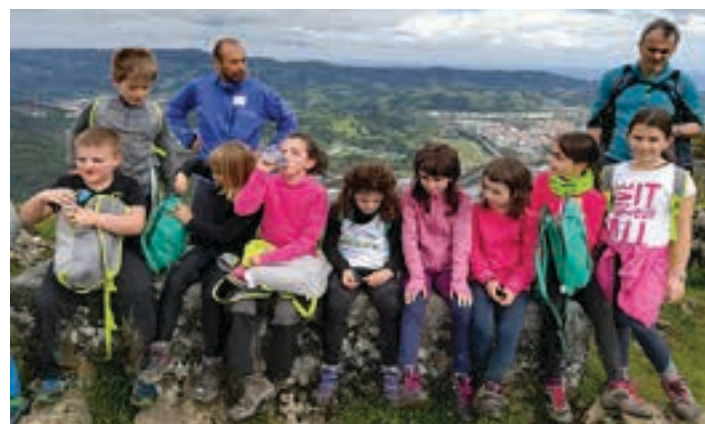
Gaztetxoek zeharkaldi luzeagoa egin zuten, tontorrera iritsi aurretik.