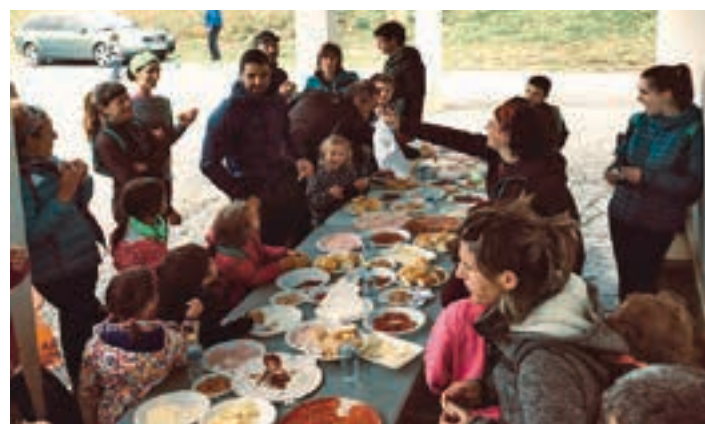
Hamaiketakoak gozatu zuten San Roke ermitaren arkupeetan.