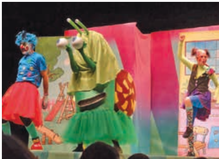
Pirritx, Porrotx eta Marimotots pailazoen batera hainbat pertsonaia igoko dira taula gainera. Baten bat bihurria, baina gehienak maitagarriak. AIURRI

Ikuskizuna Aiurri astekariak antolatu du, Urnietako Udalaren laguntzarekin.