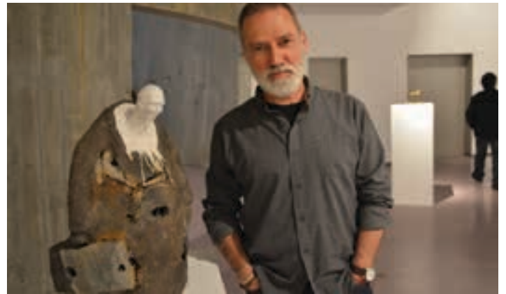
Letamendi Basteroko erakusketaren irekiera ekitaldian. AIURRI

Kaleaz eta arteaz gozatzeko egunak iristear dira, beraz.