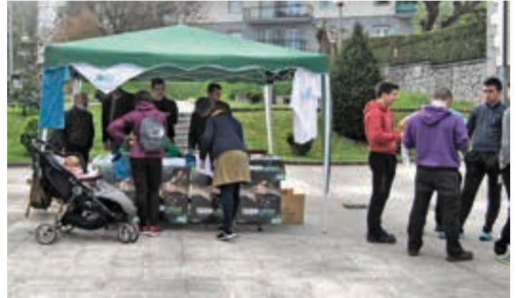
Sinadurak biltzeko karpa ipintzen ari dira Urnietan, larunbatero. GED

Diana, puzgarriak eta Txanbolinen emanaldia iragarrita daude, igande goizerako. Arratsaldean DJa eta haur tailerrak.