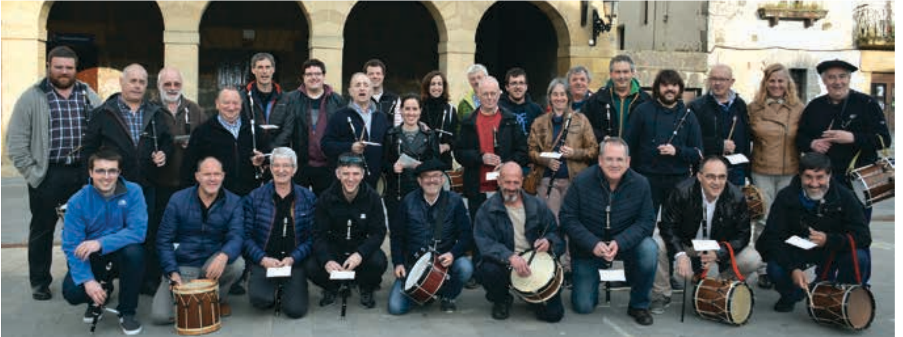
San Isidro egunean ekitaldi bikoitza izan zen iluntzean. Eskualdeko txistulariak kalejiran ibili ziren bitartean, Araoz abesbatzak emanaldia eskaini zuen elizan. Behean, goizeko meza osteko bertso saioa Lekaion. AIURRI