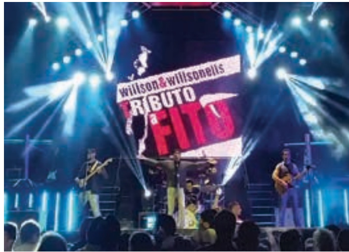
Wilsson & Wilsonetis taldeak Fito & Fitipaldis taldearen bertsoak egiten ditu.

19:30ean txupinazoa botako dute udaletxeko balkoitik. Gauean, berriz, afari tematikoa eta Matraka elektro-txarangaren kalejira iragarri dituzte. Horiexek, beraz, jaietako lehen hitzorduak.