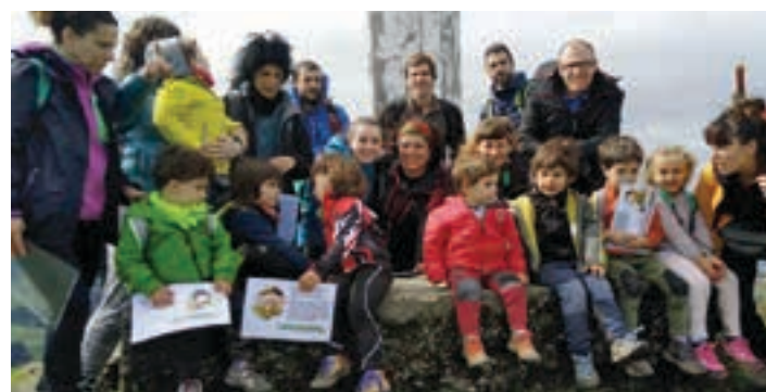
Txikitxoak Buruntzako tontorreraino iritsi ziren. ZANPATUZ

Iratxoek ipinitako pistei jarraiki, gaztetxoek ibilbide luzeagoa osatu zuten. Txikiarekin zuzenean tontorreraino igo ziren. Etxera itzuli aurretik, mendizaleek Buruntzako San Roke ermitaren arkupeetan hamaiketako ederra egin zuten. Zanpatuz mendi elkartek igandean parte hartu zuten guztiei esker ona adierazi nahi die.