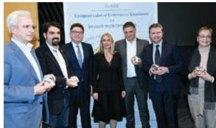
Aitorpena jaso zuten alkateek, asteartean Donostian.