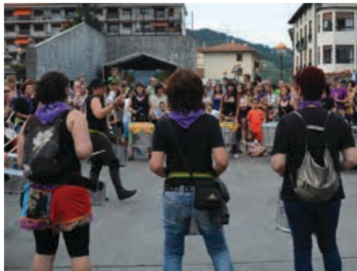
Batukada feminista ikastaroa abiatu da. AIURRI

Jaioterri ezberdinetako emakumeak, astero bildu eta euren bizipenak partekatzeko espazioa.