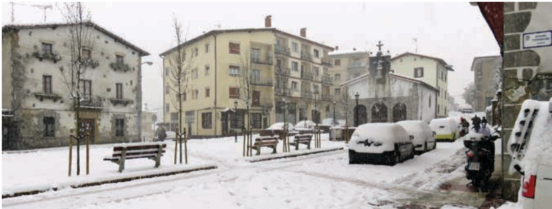
Urnietako San Juan plaza, otsailaren 28ko elurtean. AIURRI