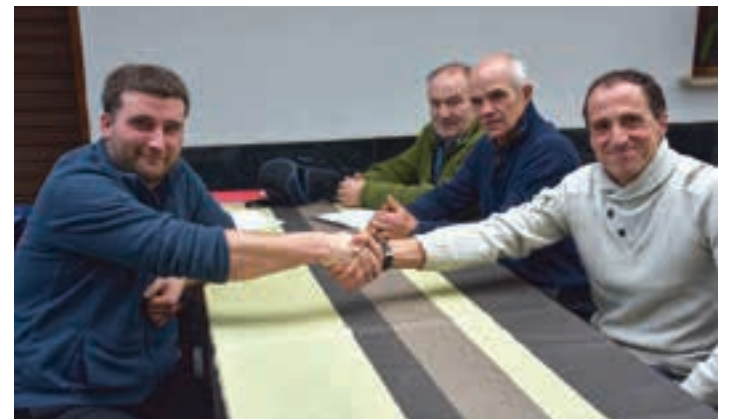
Apustua eskua emanda hitzartu zuten, Federazioko epaileen aurrean. AIURRI

Arizmendik dionez, "emozioa izango dela iruditzen zait eta ikusleak lehia polita ikusiko du. Ea Buruntzaldeko zaletuak animatzen diren! Pertsonalki, nahi nuke lehendik ere Santakruztetan lanean ikusi nauten andoaindarrak mugituko balira".