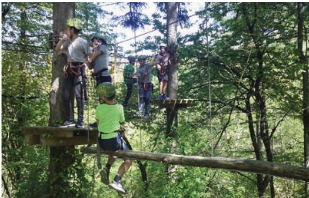
Irrisarriland abentura parkera irteera, iaz. URNIETAKO GAZTELEKUA