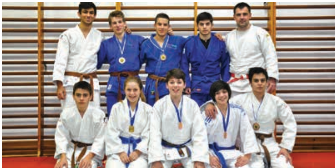
Urnietako Adarra judo taldeko infantil eta kadete mailako ikasleak, lortutako dominak jantzita.

JUDO Pasa den larunbaten ospatu zen Urnietan Gipuzkoako judo txapelketa, infantil eta kadete mailan. 9 urnietar eta 5 andoaindar lehiatu ziren txapelketan, eta domina ugari eskuratu zituzten