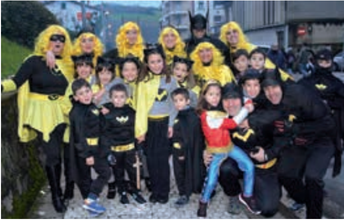
Kaleberrian harrapatutako batman-zale amorratuak. AIURRI