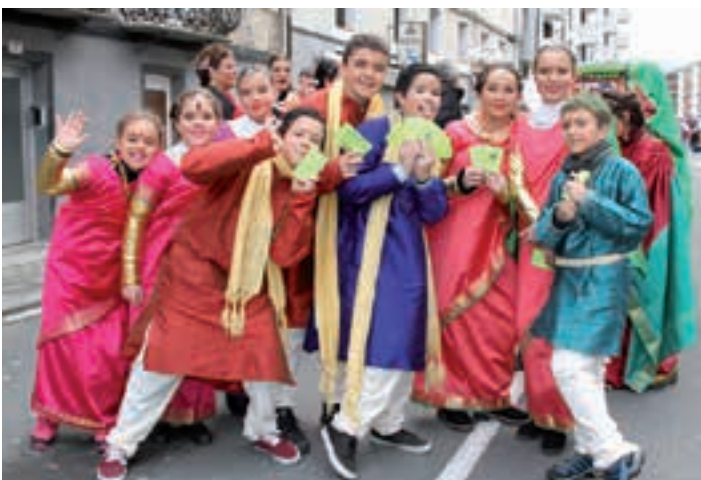
Andoahindu Gu taldeko gaztetxo kuadrilla konpartsan. AIURRI