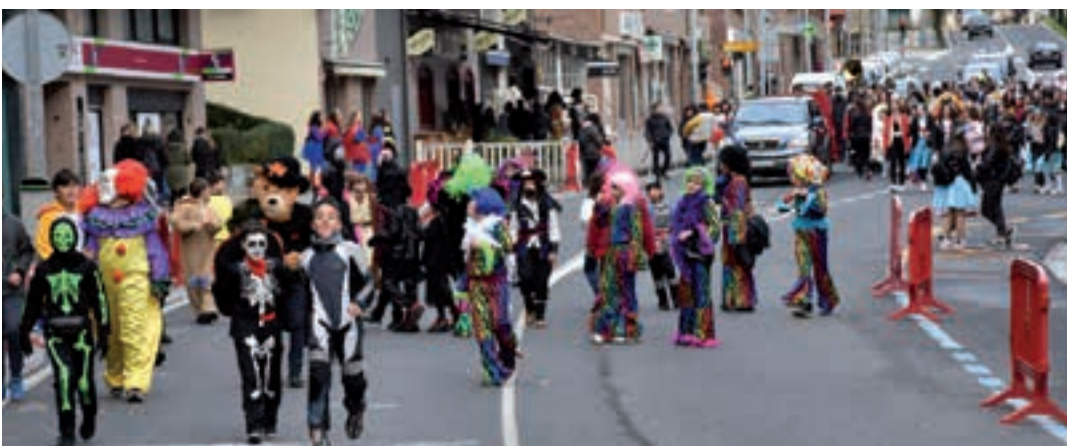
Haurrak eta gaztetxoak izan ziren mozerro festa Idiazabal kalera eramaten zuten lehenak. AIURRI