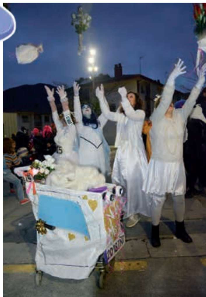
Andregai zoriotsuak lore-sortak airera jaurtiz. AIURRI