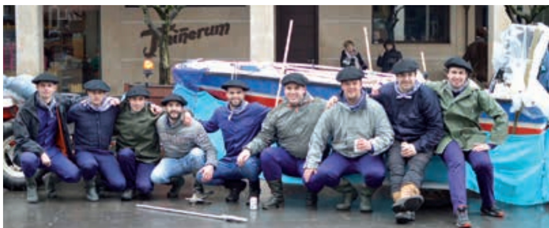
Eguraldiari erreparatuta, argazkiko gazte taldeak mozerro egokia aukeratu zuen. AIURRI