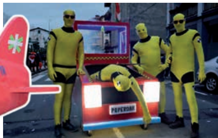
Poperoak diseinu berriko autoak probatzen. AIURRI