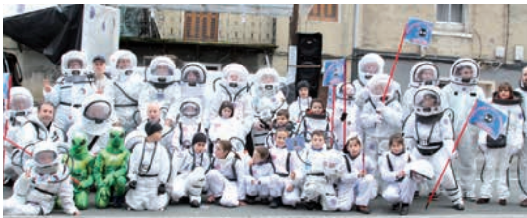
M. G. konpartsako astronauta taldea. AIURRI