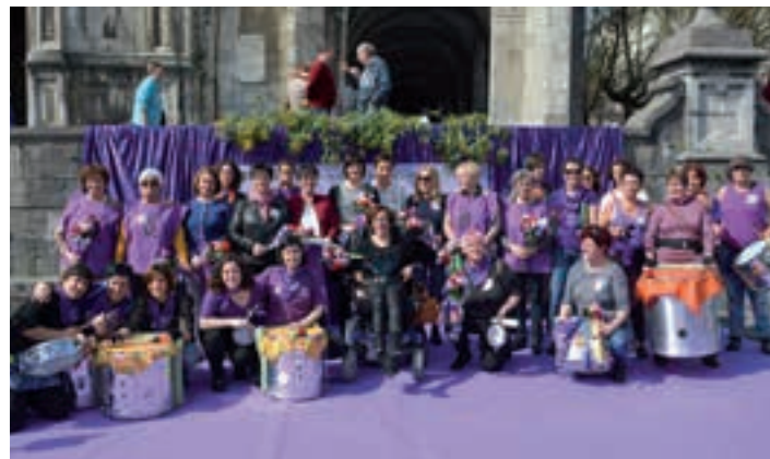
'Martxoak 8, 8 emakume' ekitaldia, iaz. AIURRI

Info: 943 591 704 | andoain@ae.com | andoainarraeuskaraz.com