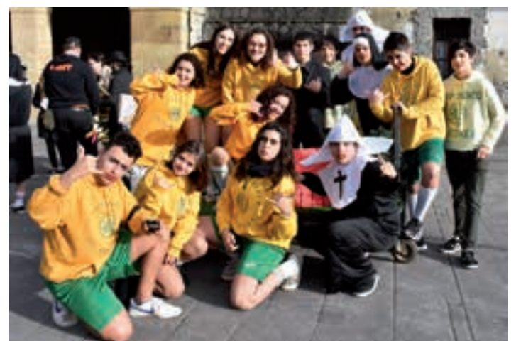
La llamada musikala, Salesiar ikastetxearen eskutik. AIURRI