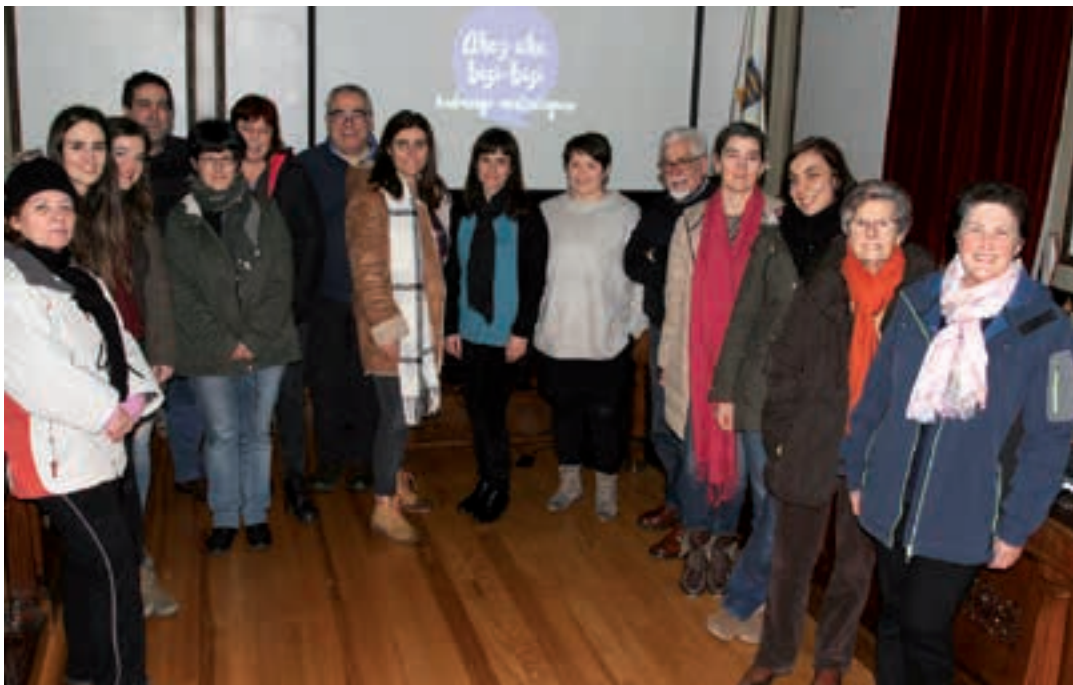
Mintzalaguna egitasmoa kideak joan zen otsailaren 7an Udaletxean egindako aurkezpenean. AIURRI