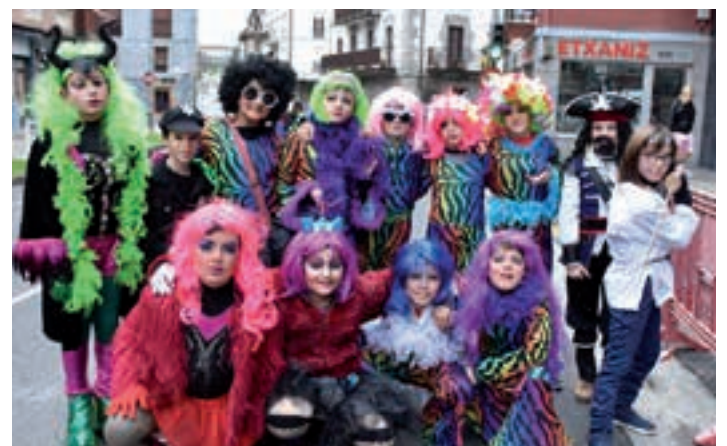
Txarangaren aurretik festarako prest zegoen gaztetxo taldea. AIURRI