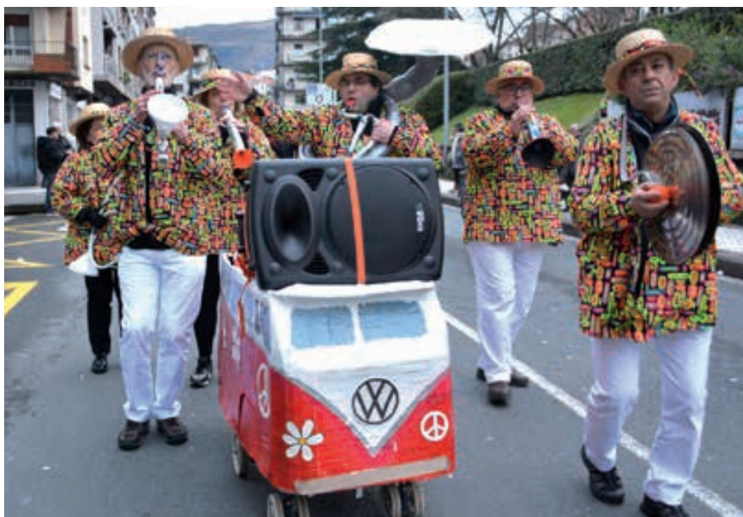
Urtero bezala, kuadrila ezagun hau jaia alaitzen aritzen dira goizez eta arratsaldez. AIURRI