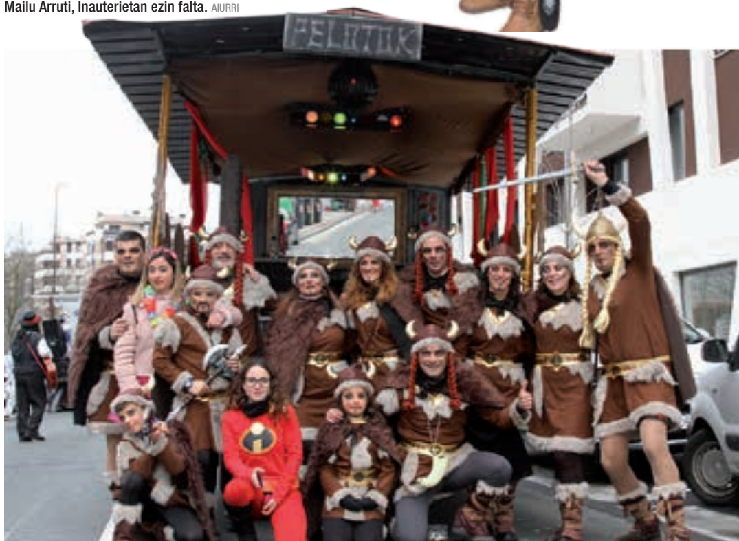
Pelotok konpartsako bikingoak. AIURRI