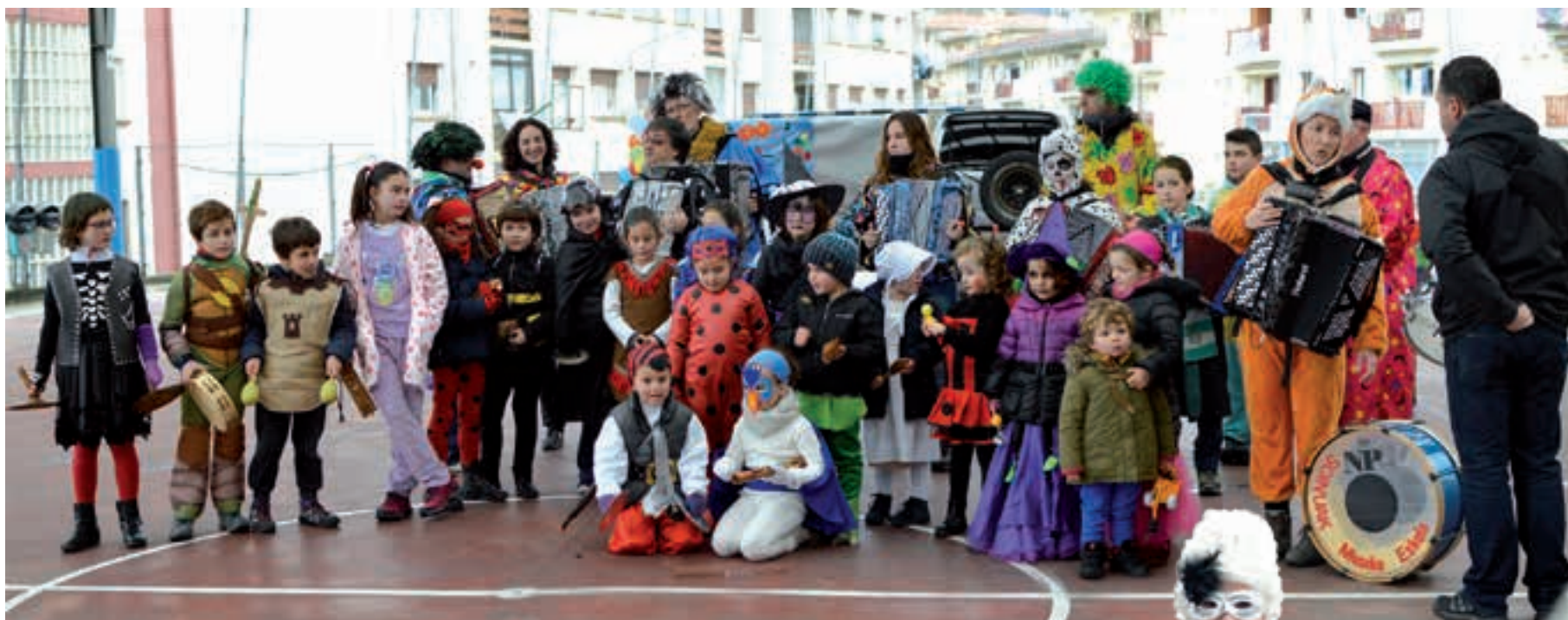
Soinuak musika eskolako taldeak larunbat eguerdiko emanaldia Ondarreta ikastetxeko jolastoki estalian eskaini zuen. AIURRI