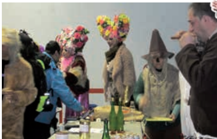
Igande arratsaldean Etxeberri plaza auzo elkarteak ospakizuna antolatu zuen.