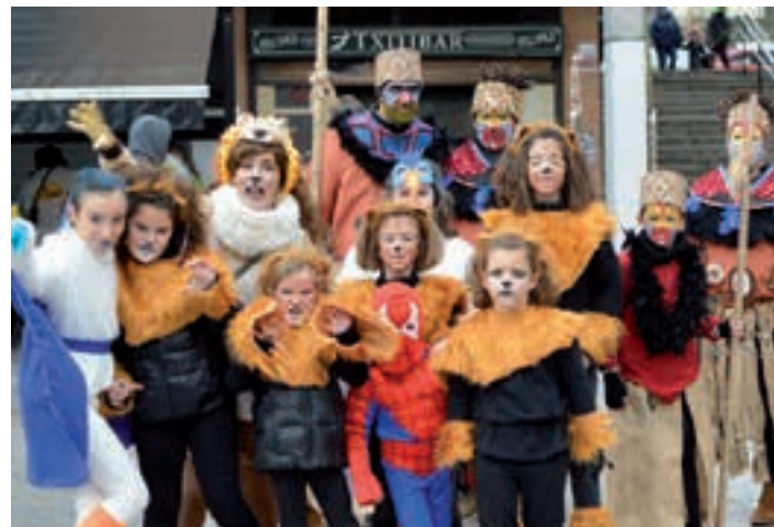
El Rey Leon ikuskizuneko hainbat kide, Zumea plazan. AIURRI