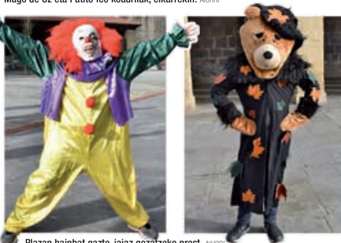
Plazan hainbat gazte, jaiaz gozatzeko prest. AIURRI