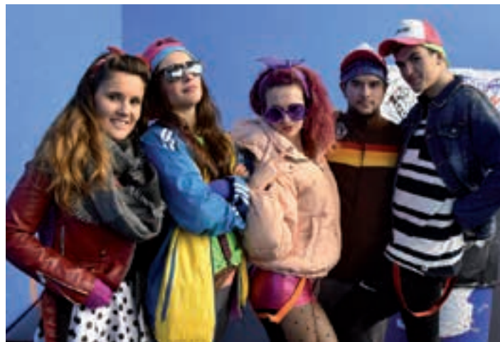
Fama, flash dance..., koadrila batek baino gehiagok aukeratutako mozorroa. AIURRI