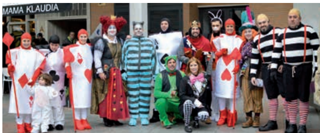
Alizia ipuin miresgarriaren Andoaingo bertsioa. AIURRI