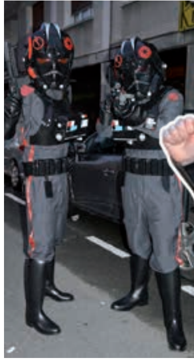
Beste mundu batetik etorritako bi "satelite".