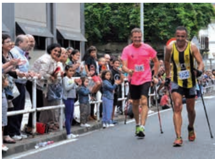
2015eko Herri Biran Nordic Walking jarduerako kideek parte hartu zuten. AJURRI

Igandean, otsailak 18, On Bosko krosaren laugarren edizioa antolatuko du Salesiar ikasketxeak. Goizeko 11:00etan hasiko da, ikastetxetik bertatik. Aurtengoan, gainera, lasterketa bi modutara egin ahal izango da. Lehen, zazpi kilometrokoa, lasterka. Bigarrena, sei kilometrokoa, Nordic walking parte hartzaileentzat. Aurretik izena eman daiteke herrikrosa.eus webgunean eta ikastetxean, 10 euro ordainduta. Eta baita, nola ez, egun berean ere. Antolatzaileek dutxa beroa eta salda ziurtatu dituzte, parte hartzaile guztientzat. Baita sarien zozketa ere.