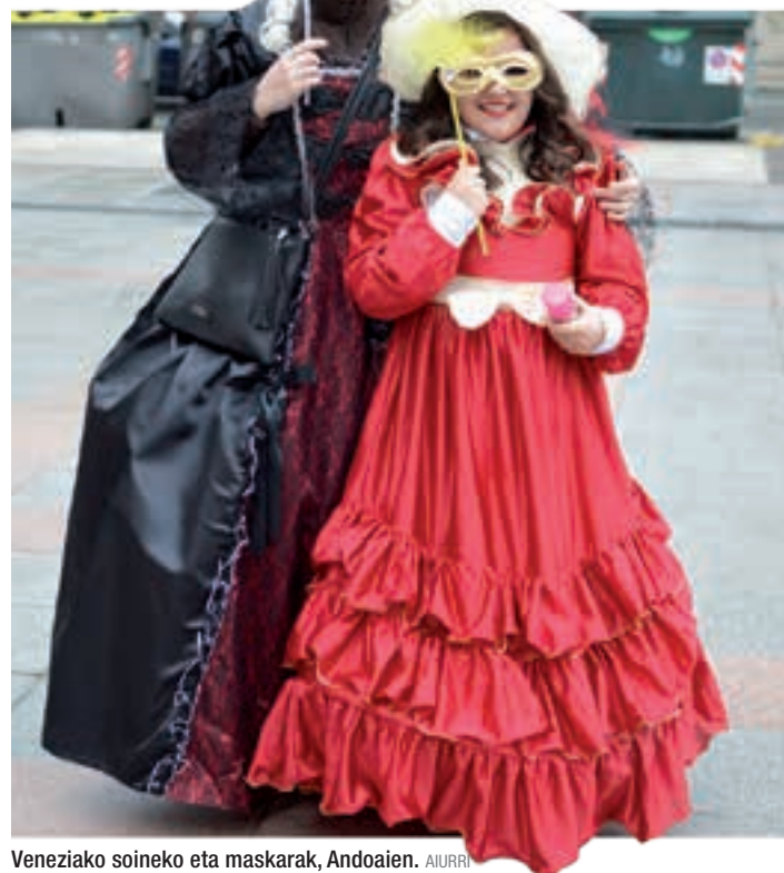
Veneziako soineko eta maskarak, Andoaian. AIURRI