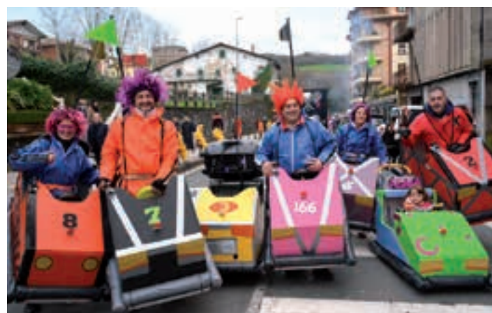
Autoekin irri eta jolas ibili zen koadrilla. AIURRI