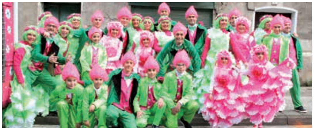
Somos la hostia konpartsako kideak desfilea hasi aurretik. AIURRI