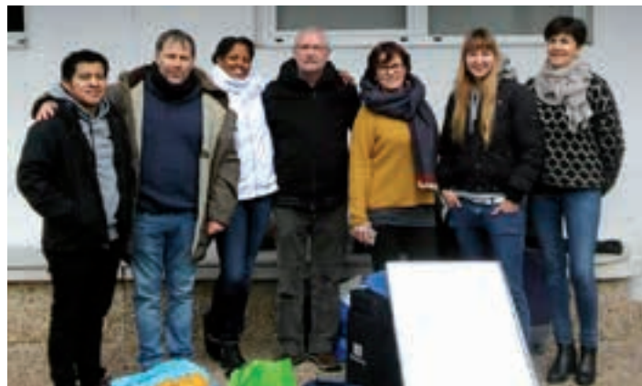
Lipus, Fachado edota Andonegi aktore profesionalak parte hartzen ari dira.

Marraskilaritzarako joera ere eduki zuen, eta ehunka quadro egiteaz gain, haurrei margotzen irakatsi izan zien.