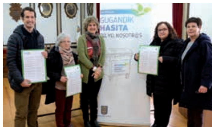
Hiru ikastetxeetako zuzendariak, jangelako arduradunak eta alkatea. ANDOAINGO UDALA

Ostegun honetan aukeratu dituzte, aurtengo protagonistak. 18:00tan hasita, Urigainen deitu dute bilera.