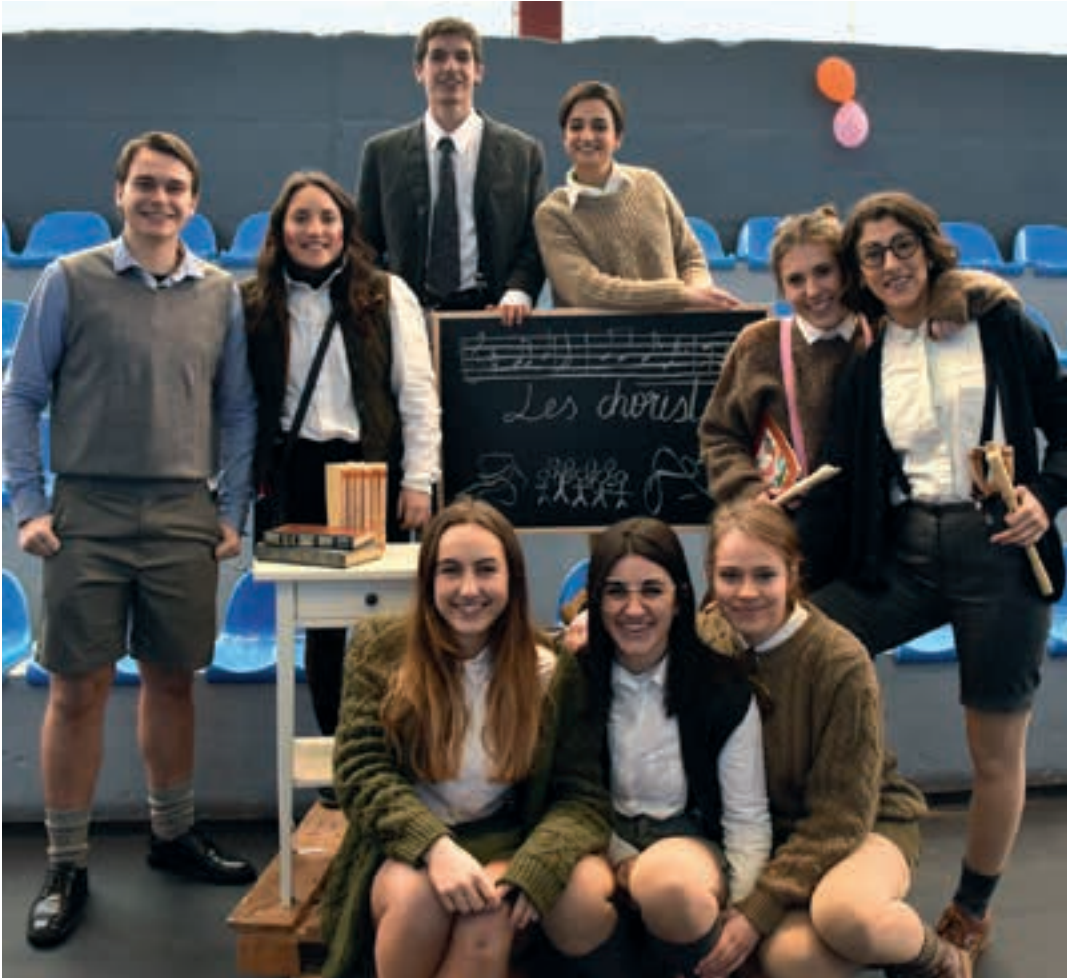
Los Chicos del coro abesbatza gaztea Urnietako inauterietan 'kantari' aritu zen. AIURRI