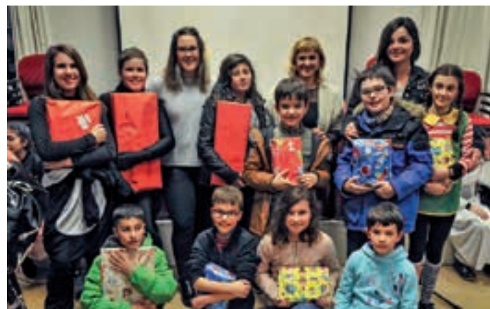
Maskara lehiaketako irabazleak, Urigain etxean, sari banaketa ekitaldian. J.I. UNANUE