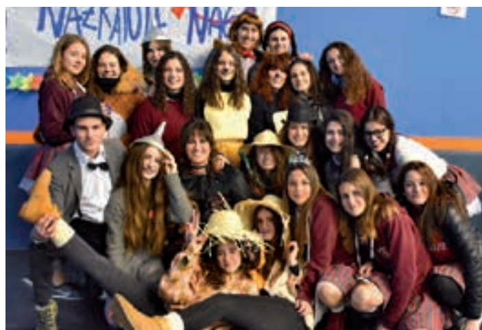
Mago de Oz eta Patito feo koadrilak, elkarrekin. AIURRI