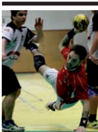
Larunbatean partida, 17:45etan. UKE

Senior mailako pala motzeko partidaren Urnietako bi taldeak