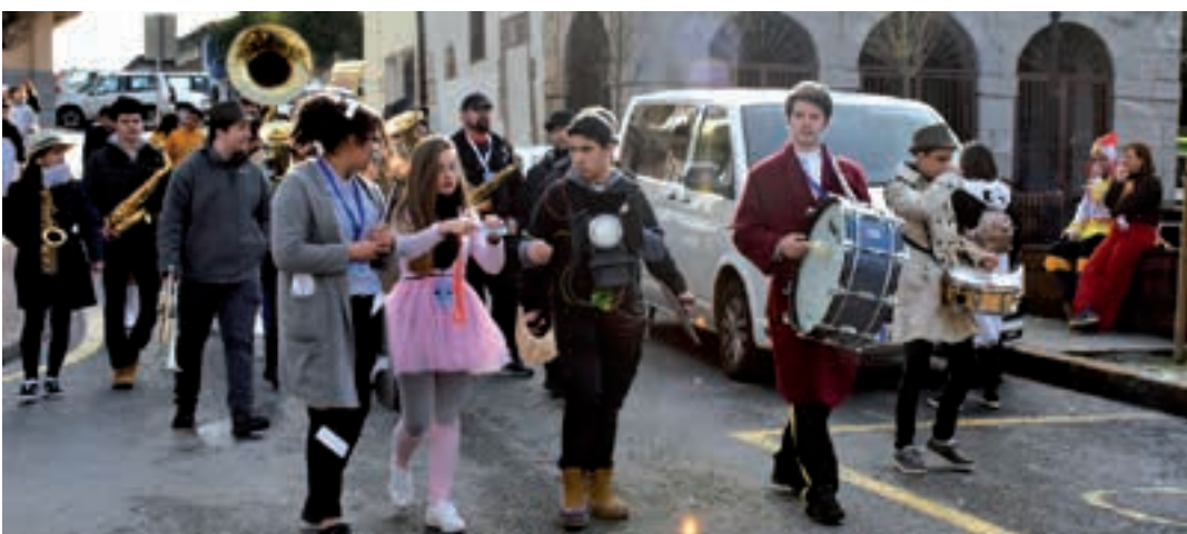
Bosko Anitz txarangak Salesiar ikastetxetik San Juan plazara kalejira egin zuen. Idiazabal kalean gora igo ziren, berriro. AIURRI