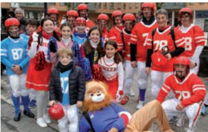
Futbol amerikarreko jokalariek Andoainen. AIURRI