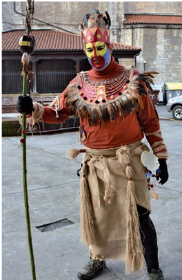
El Rey Leon filmetako protagonistatakoa, Labakak aukeratutako mozorroa. AIURRI

Festa bakarra izan arren, ospakizun ezberdinak izan diren irudipena nagusitu da aurtun.