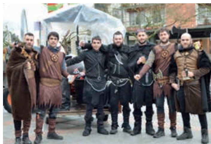
Antzinako garaia biziberritu zuen hainbatek, bere proposamenarekin. AIURRI