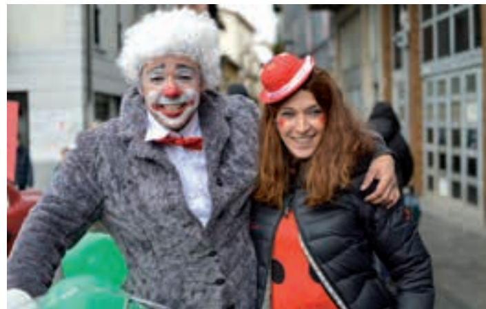
Pailazo familia Kale Nagusian, larunbat goizean.