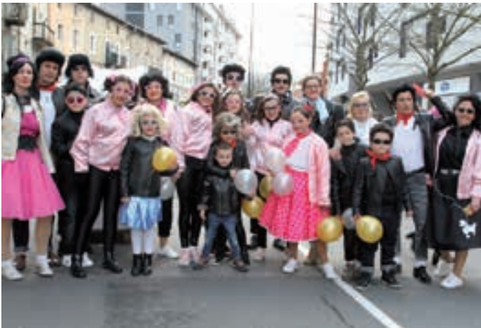
Kutxipandikoak desfilea hasi aurretik motorrak berotzen.