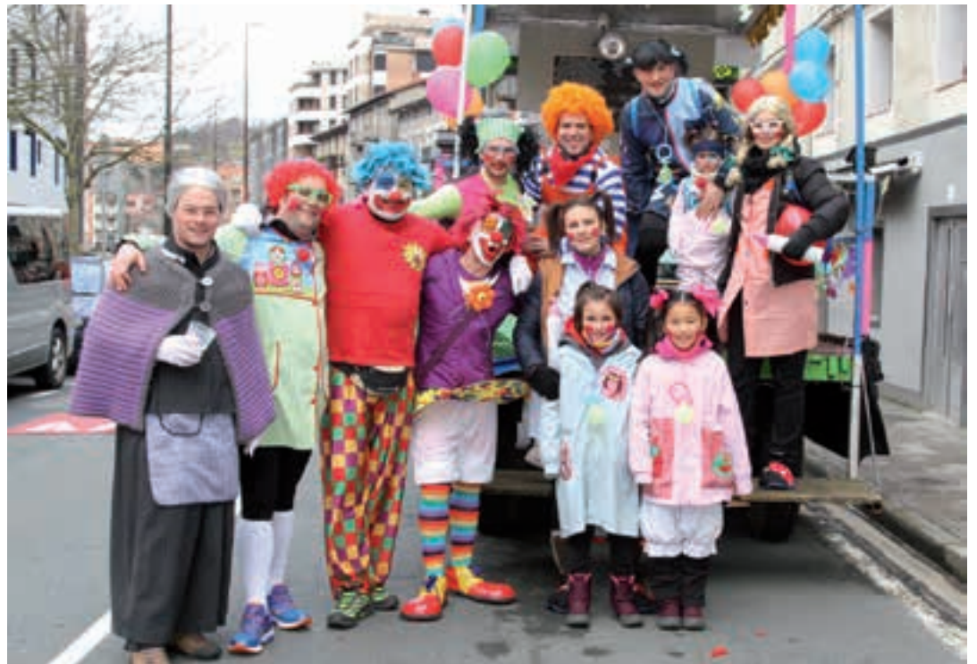
Batukada taldeko pailazoak. AIURRI