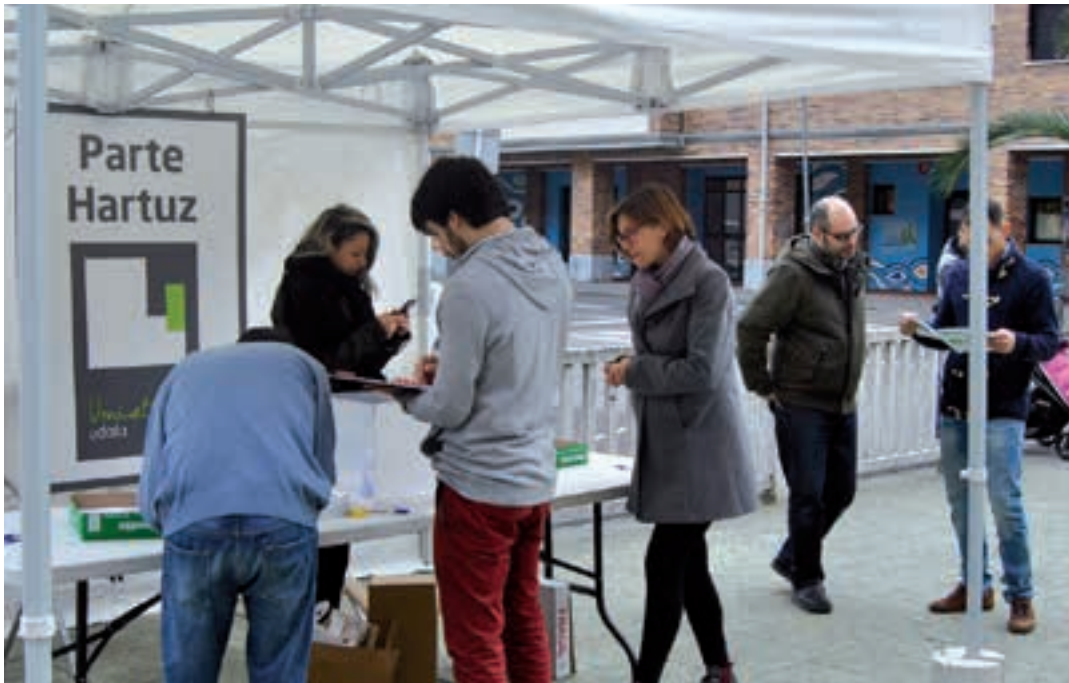
Parte hartze prozesu bat baino gehiago egin dira, agintaldi honetan. AIURRI