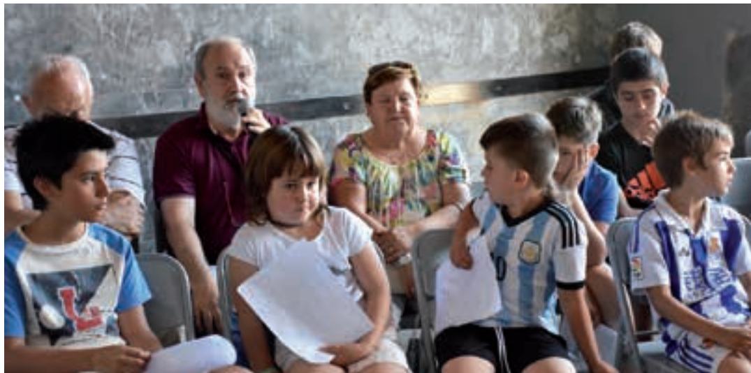
"Ibili Andoain" egitasmoa otsailean abiatuko da, iazko Agenda 21 ekimenean aztergai izan eta gero. AIURRI

IBILALDI NEURTUAK "Ibili Andoain" jarduera fisikoa maiztasunez egiteko ekimen berritzailea da. Adinekoei begira, herrigunean lau ibilbide ezberdin zehaztu dituzte. Lehen zeharkaldia datorren otsailaren 21ean egingo dute, Goikoplazatik abiatuta