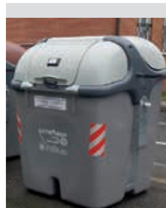
Edukiontzi grisa. AJURRI