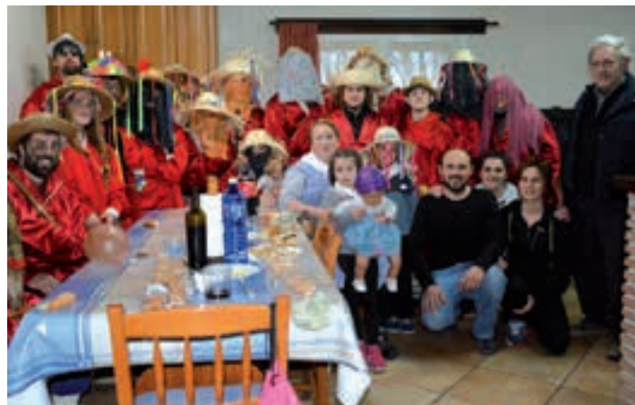
Allurralde Goiko baserrian atsedena hartu zuten axerriek. AIURRI