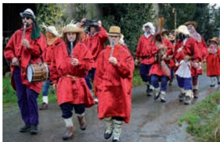
Intusain baserri inguruan kalejiran zihoaztela. Behean, Koskaran baserrian.