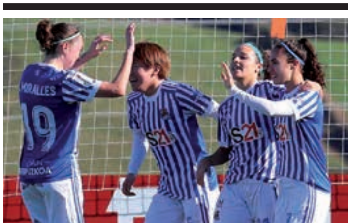
Realak gol bakarra lortu zuen Zubietan, nola ez, Nahikarik sartutakoa. REAL SOCIEDAD