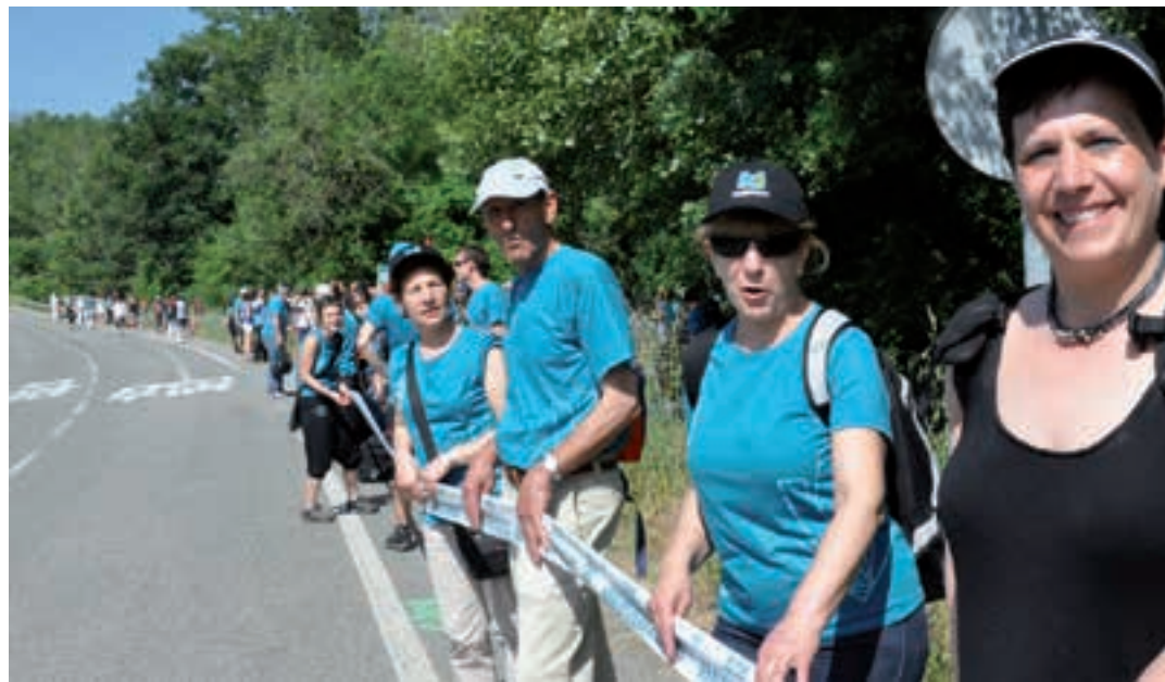
Urnietarrak 2014ko giza-kate erraldoian, Nafarroako Sakana aldean.