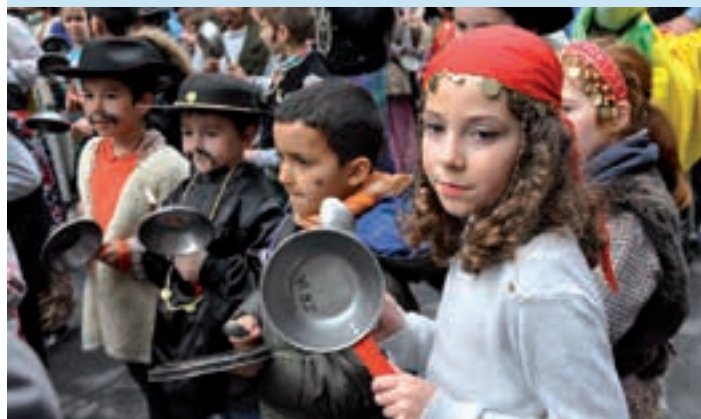
Kalderero txikien ospakizuna, ostiral honetan. AIURRI

Ospakizun bikoitza Ondarreta ikastetxeko txikienek ekingo diote Kaldereroen ospakizunari, kalejirarekin. Ibilbidea honakoa izango da: Kale Nagusia, Santa Krutz zubia (Zubiaurre Etxea) eta Ondarreta Ikastetxea.