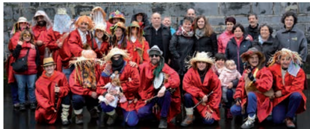
Sorabillan, auzotarrek batera, plazan egindako saioaren ondoren. AIURRI