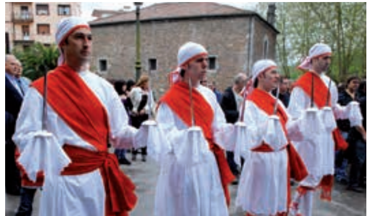
Ezkerrean, Araolaza 2009ko Santakruzetan ezpata-dantza berreskuratu zuteneko.

Balorazio bilera, otsailaren 19an. Eta argazki-lehiaketa, zeinean parte hartzeko azken eguna otsailaren 22a izango den.