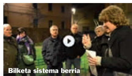
Bilketa sistema berria