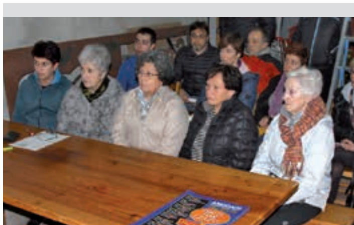
Lehen bilera Sorabillako auzo elkartearen egoitzan egin zuten. AJURRI

Egun, %42 inguru birziklatzen da Andoainen. Europar Batasunak adierazitakoaren arabera, 2020. urterako gutxienez hondakinen %50 birziklatu beharko da Europako herrialde bako-