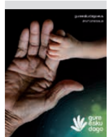
Kartela eta logo berria. GED

Beroketa modura, "Herritarren Ituna" mahai-inguru zikloa abiatu dute. Erabakitze 2019 arrazo jaso nahi dituzte.