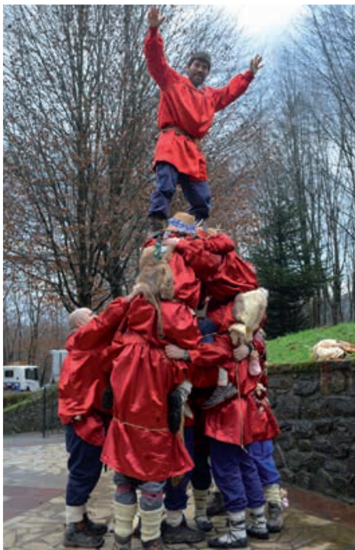
Borda etxean dorrea osatu zuten axerriek. AIURRI

Andoain inauteri giroan murgiltzen ari da. Ohitura zaharrak beste ohitura bati pasako dio lekukoa, asteburu honetan. Kaldereroek herria girotuko dute, soinu eta doinu.