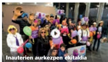
Inauterien aurkezpen ekitaldia