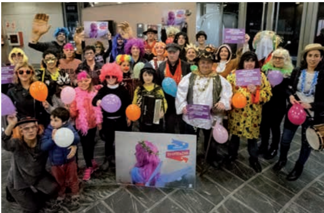
Agerraldi jendetsua egin zuten aurreko astean, Bastero kulturgunearan atarian. AIURRI

Erraldoi eta buruhandiak, Kaldereroetako eta Puska biltzeko ordezkariak, musikariak eta beste hainbat eragile hedabideen aurrean elkarrekin agertu ziren, herrikideei datozen egunetako ospakizunetan parte hartzeko gonbitea luzatzeko