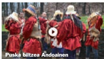
Puská biltzea Andoain