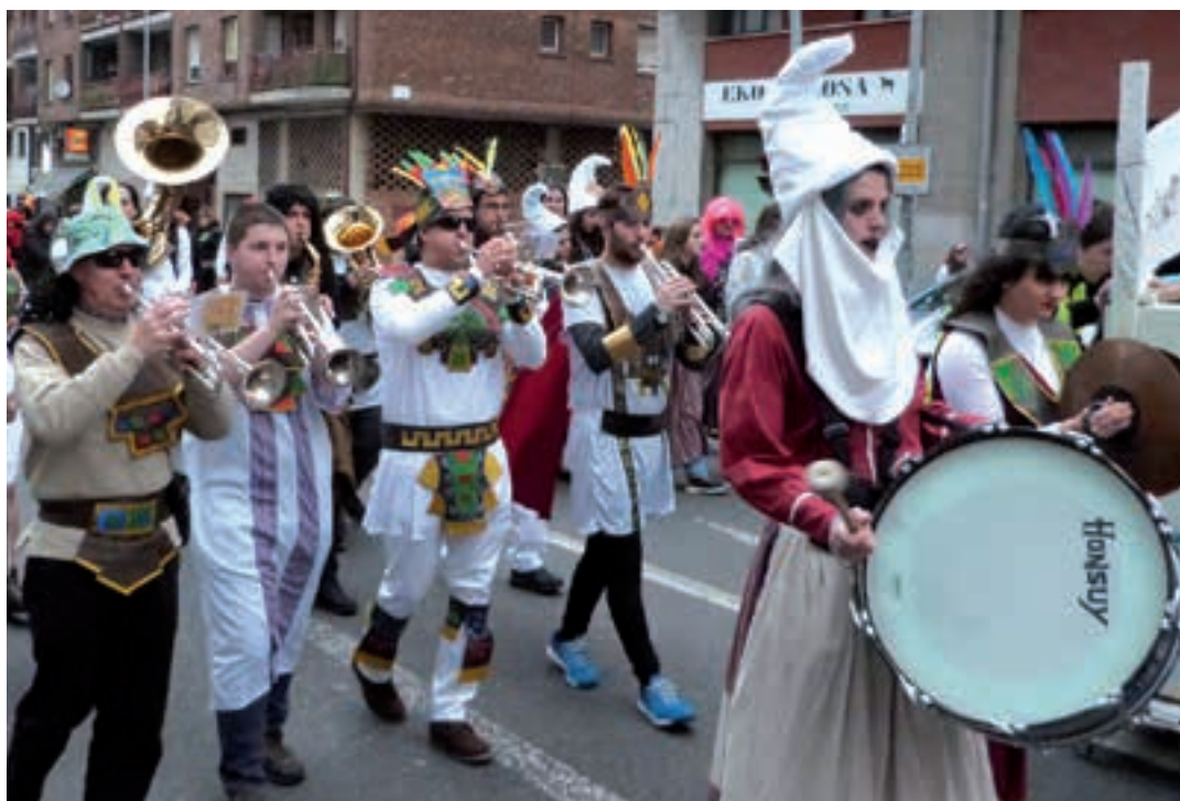
Bosko Anitz txaranga kideak, iazko mozorro desfilean, Idiazabal kalean ibili eta gero ikastetxeko bidean zihoazela. AIURRI

Salesiar ikastetxeko txarangaren jardunaldia egun osora zabaltzen da. Goizean prestaketa lanak, arratsaldean kalejira herrian zehar eta iluntzean mozorro desfilea eta jaia ikastetxean bertan. Egun bakarra izan arren, ospakizun handia da eurentzat