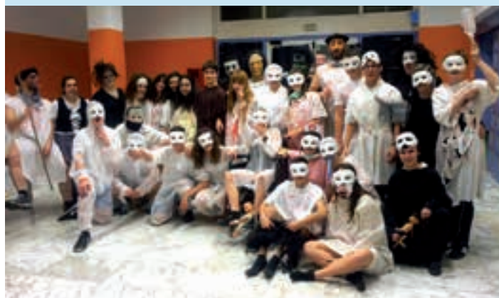
Inauteria Gazte Lokalean, ostegunean eta ostiralean. AIURRI

Ospakizun bikoitza Ondarreta ikastetxeko txikienek ekingo diote Kaldereroen ospakizunari, kalejirarekin. Ibilbidea honakoa izango da: Kale Nagusia, Santa Krutz zubia (Zubiaurre Etxea) eta Ondarreta Ikastetxea.