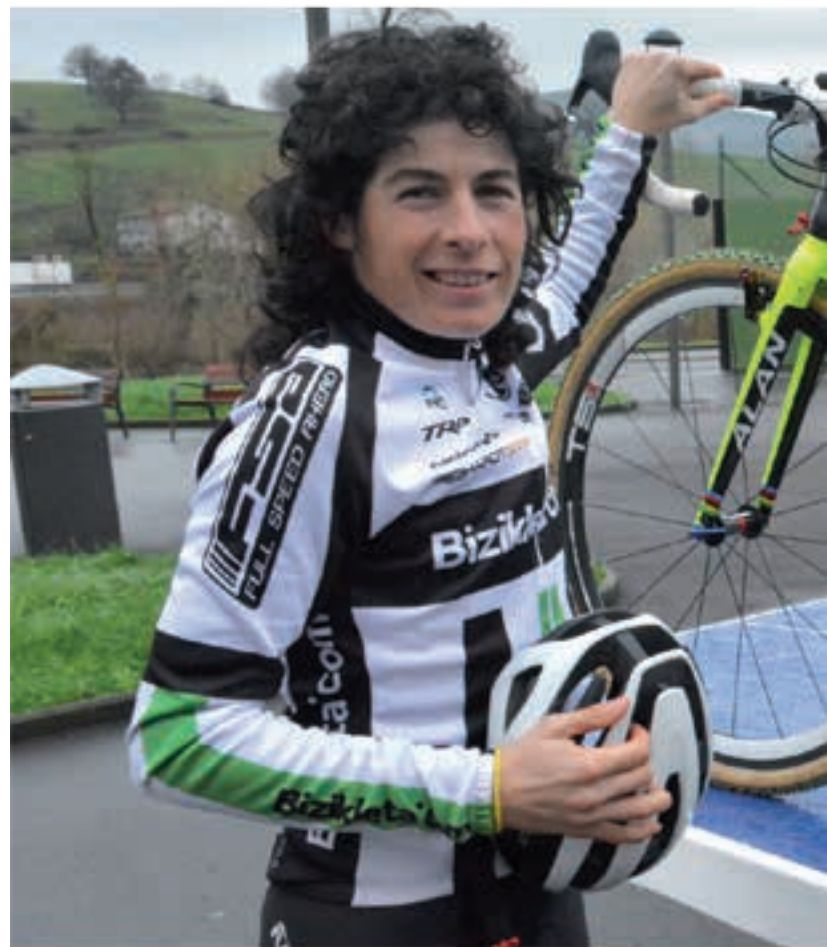
Odriozola Munduko ziklo-kros txapelketan arituko da, etzi, Herbeeretako Valkenburg hirian. AJURRI

Abenduaren 7an eman zioten alta. 5 hilabete luze, ordu eta egun asko geldirik, "eta txintxotxintxo" medikuen aginduak zorrotz betetzen. Kirolari izateak, sufritzen jakiteak asko lagundu dio egoera ondo eramaten. Eta ausart izaten. 7an alta jaso, eta egun bat geroago, Ametzagako proba korritu zuen. Eta bi egun geroago, Igorren. Batere entrenatu gabe! "Banekien margen handirik ez neukala, baina nire buruari erakutsi nahi nion Ametzaga eta Igorreko lasterketak