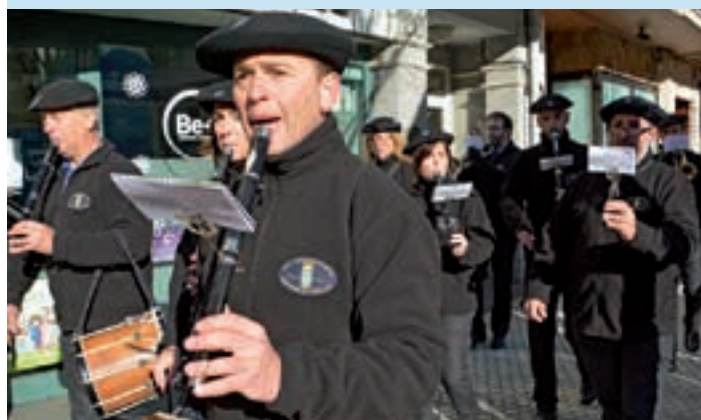
Olagain txistulari taldekoak kalez kale ibiliko dira, ostegun gizenean. AIURRI

Beldurrezko etxea Ostegun gizeneko arratsaldea emozioz eta beldurrez beterikoa izango da, Gazte Lokalean. Ospakizunak 17:15etatik 20:00ak arte iraungo du. Biharamunean, mozorro festa eta askaria antolatu dute Gazte Lokalean bertan.