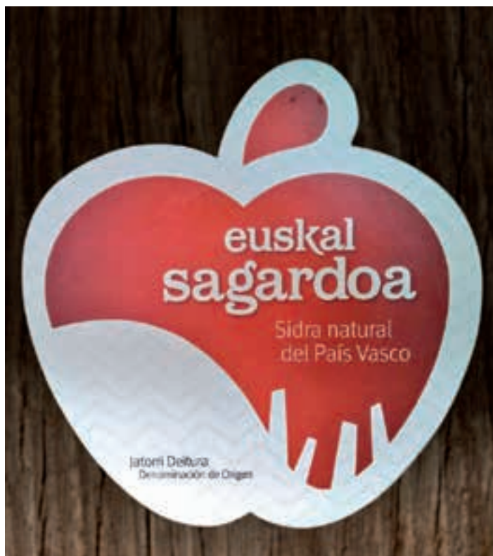
Euskal Sagardoaren identifikazio marka.

Aurreko urteekin alderatuta, ordea, geroz eta gehiago dira ekoizpenean sartzen ari direnak. Urrats garrantzitsua da, Euskal Sagardoa jatorri deitura indartzeko bidean.