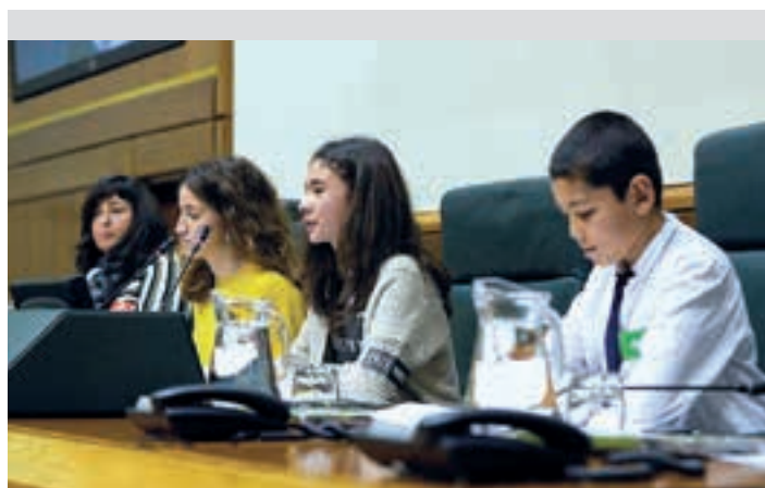
Urnietako ikasle bat aritu zen lehendakari lanetan. EUSKO LEGEBILTZARRA

Lan horietan guztietan hezkuntza sisteman txertatzeko proposamen zehatzak egin di-