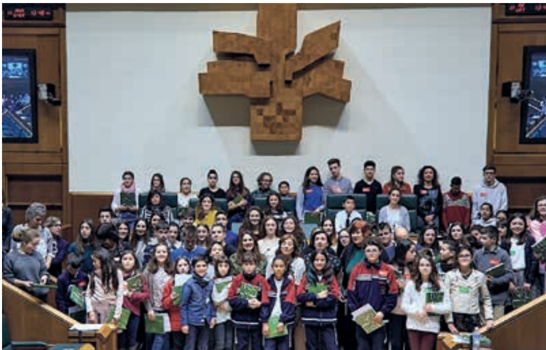
Hezkuntzari lotutako egitasmoa Eusko Legebiltzarrera eraman zuten, joan zen urtarrilaren 23an. EUSKO LEGEBILTZARRA