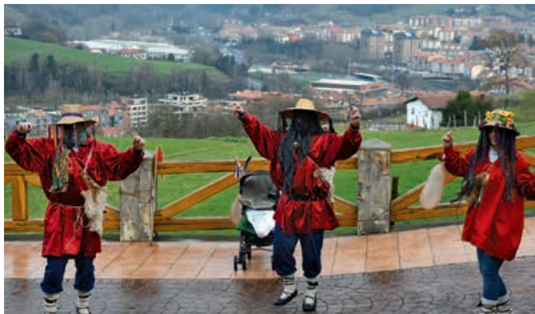
laz axeriak Goiburu aldeko etxe eta baserrietan ibili ziren. Aurten, berriz, Sorabilla aldean. AIURRI