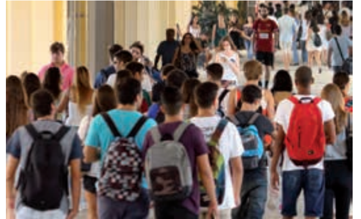
Gurasoei zuzendutako tailerra izango da, otsailean abiatuko dena. UPO

Egunerokoan seme-alabekin erabili ditzaketen heziketarako erremintak eskaini nahi zaizkie