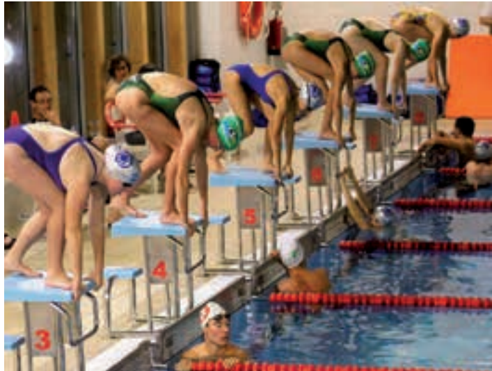
Larunbatean infantil, junior eta seniorrak Hernanin arituko dira.