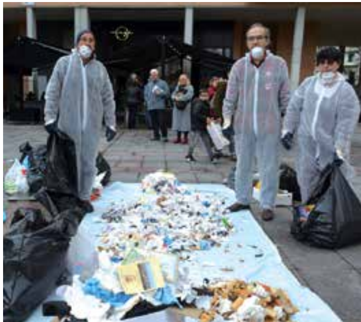
Ipar haizeako kideek errefusarako poltsa batzuk ireki eta denetik topatu zuten. AIURRI

Udalari eta biztanlegoari oro har, nahiz eta hobekuntzak izan, hondakinak sailkatzeko garaian zer hobetua badagoela erakutsi nahi diegu. Errefusako edukiontzitik gaur