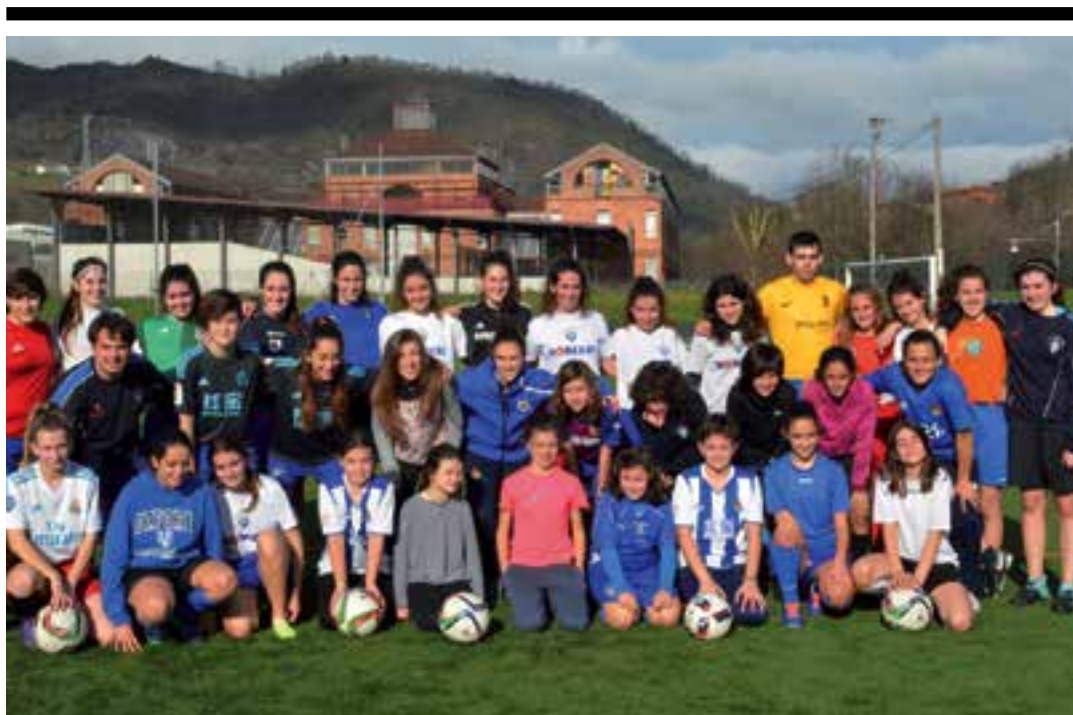
Urtarrilaren 3ko jardunaldian parte hartu zuten jokalariek eta prestatzaileek, taldeko argazkian. AIURRI