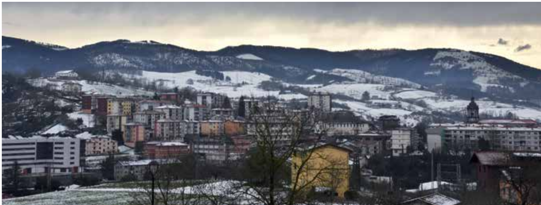
Buruntzako San Martin aztarnategitik Andoaingo herrigunean paisaia zuritua ikus zitekeen urtarrilaren 7an. AJURRI