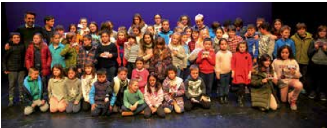
Santomas egunean, Udalak Urnietako ikasleen artean egindako Zorion-txartelen, Olentzeroen eta Jaiotzen lehiaketako sari banaketa ekitaldia antolatu zuen. Olentzero eta Jaiotza ezberdinak ikusgai izan dira Eguberrietan, merkatalguneetan.