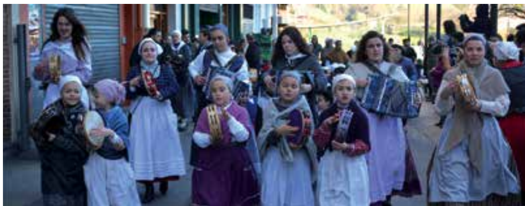
Aita Larramendi Ikastolako trikitilari taldea, Gabon kantarien aurretik, Nafarroa plazan. Iluntzean, helduenek Olentzero eta Mari Domingiri harrera egin eta eurekin batera herrian barrena kalejira egin zuten.