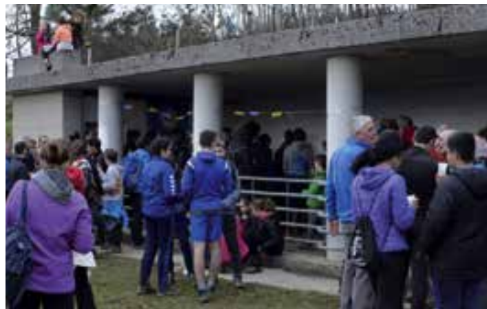
San Roke ermitaren inguruan hamaiketakoa, abenduaren 31n. TXINTXARRI

tzeko oharra zabaldu zuten. Zentuz jokatzeko deiaren aurrean, bat baino gehiago etxean geratu zen, ezustekoak saihestuz. Beste batzuk, ordea, ezin etxean geratu eta bezperan igo ziren. Urtarrilaren 1ean hutsik egin ez zutenak Leitz BTT taldekoak izan ziren. Selfie polita partekatu zuten sare sozialetan, Adarramenditik bertatik.