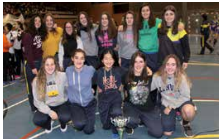
Leizaran Urdina taldea garaile kadete mailan. JOXE MARI IGERATEGI

ESKUBALOIA Hitzordu klasiko bilakatuta, ikasturteko erritmoari eusteko partida baliagarriak izaten dira