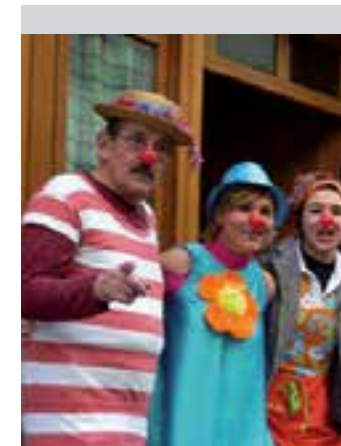
Katramilako kidea zen. AIURRI

zituzten emanaldietan zein kalleko ikuskizunetan. Jubilatua eta pentsiodunen Duintasuna elkarreko bultzatzaileetako izan zen. 2010ean Aiurriri eskainitako elkarrizketan, honako hausnarketa utzi zuen: "Erakundeetarik ezinduak etxean zaintzea bultzatu nahi dutela dirudi. Familiaren ardurapean utzi, diru pixka bat eman eta gero. Familia lan baldintza eskaseko enpresa bihurtu nahi dute".