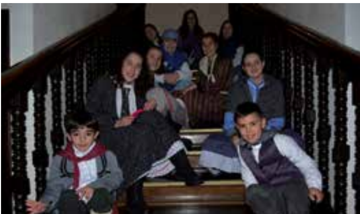
Errege Magoei ere harrera jendetsua egin ohi diete Andoainen. Hitzalditxoa eskaintzera zihoazela, hainbat haurren agurra jaso zuten udaletxeko eskilaratan.