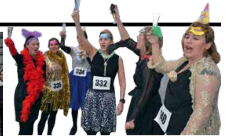
Pausokako kideek txalo zaparrada jaso zuten, baita mozorrotutako korrikalariak ere. AIURRI