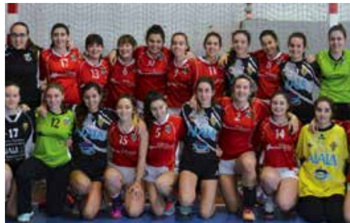
Urnietako jokalariek, pozarren, herrian bertan jokatzeko txapelketan. AIURRI

Urnietarrek ez zuten zorte handiegirik izan, maila guztietan gonbidatutako taldeak izan baitziren nagusi. Nesken kadete mailan Gasteizko Ehariak taldeak lortu zuen garaipena. Gainontzeko mailatan –infantil neska, infantil mutila eta kadete mutila– Zarauzko ordezkariek nagusitu ziren.