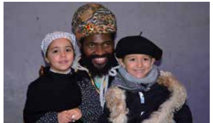
Baltasar erregeak, gainerako biek bezala, lana gogotik egin zuten. Kalejiran ibili eta gero, adierazpen bana egin zuten udaletxeko balkoitik. Haurrak zain zituzten.