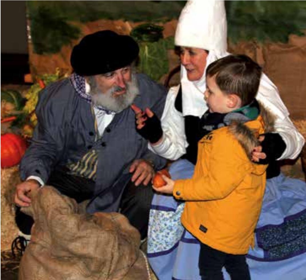
Egape dantza taldekoen eskutik, Olentzero eta Mari Domingi Urnietara iritsi ziren abenduaren 23an. Astoa lagun, eta musikariak eta dantzariak gertu zituztela, haurren eskutitzak jaso eta eurekin hizketan aritzeko patxada handia eduki zuten.