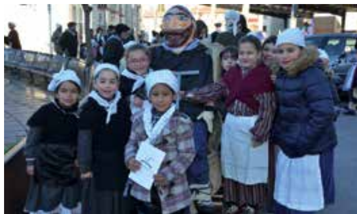
Ondarretako ikasleak Olentzeroren panpinarekin Bastero plazan, gabon kantari irten aurretik. Kantuz alaitu zituzten herriko kaleak.