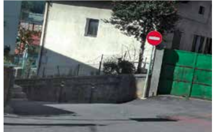
Aierbeko pasabidea Joakin Larreta eta Leizaran institutuaren artean dago.

Asteazken goizetik zabalik dago goizetik gaura bitarte. Asteburuetan itxita egongo da