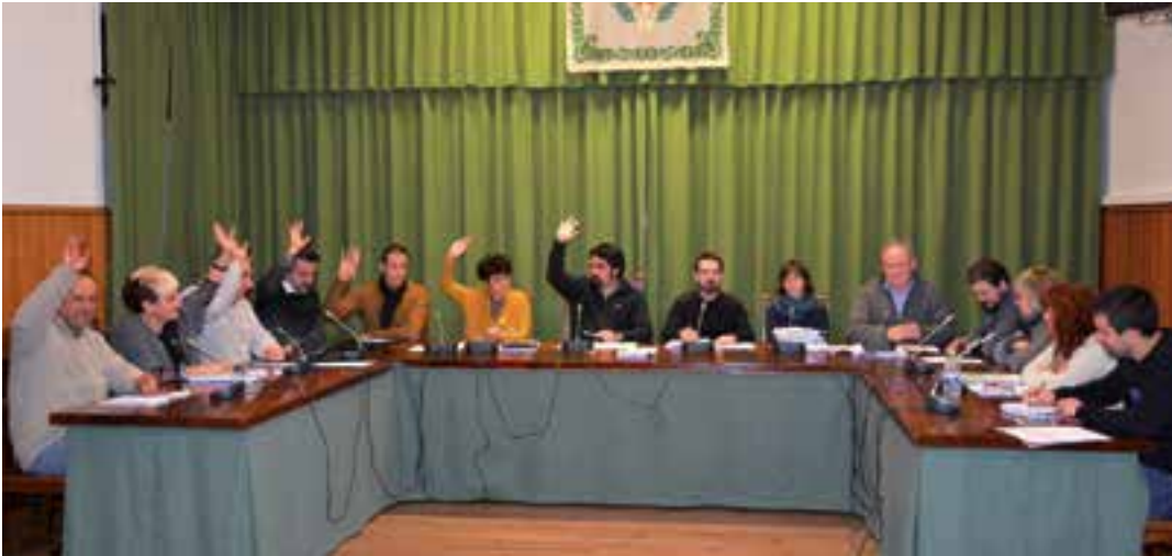
Abenduaren 21ean deitu zuten bilkuran onespina eman zioten 2018ko aurrekontuari. AIURRI