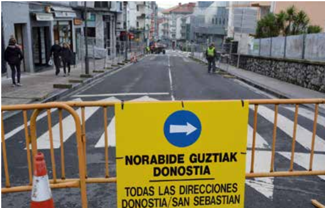
Urtarrilaren 8an, goizeko 08:00etan, ibilgailuen pasabidea galarazi zuten Kale Nagusian. AIURRI