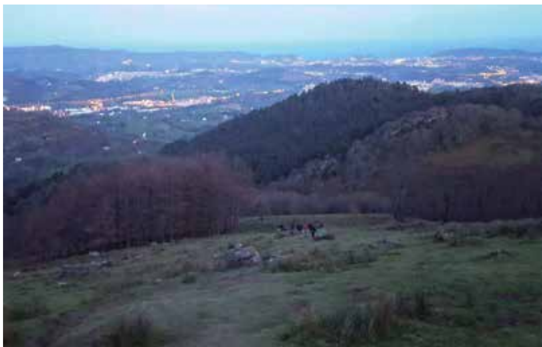
Adarramendira, aurtan, kontu handiarekin igo beharra izan zen haizetea oso bortitza baitzen. ANDONI URBISTONDO