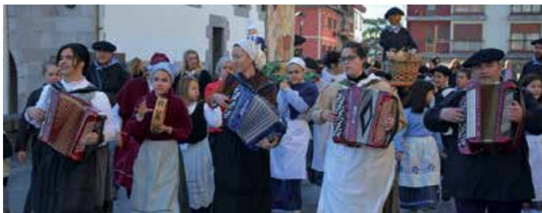
Musikariak lagun, La Salle Berrozpeko ikasle, irakasle eta gurasoak Gabon kantari irten ziren. Herrigunean zehar kalejiran ibili ziren, ohitura zaharrak berrituz. Talde handia batu zuten Goikoplazan.