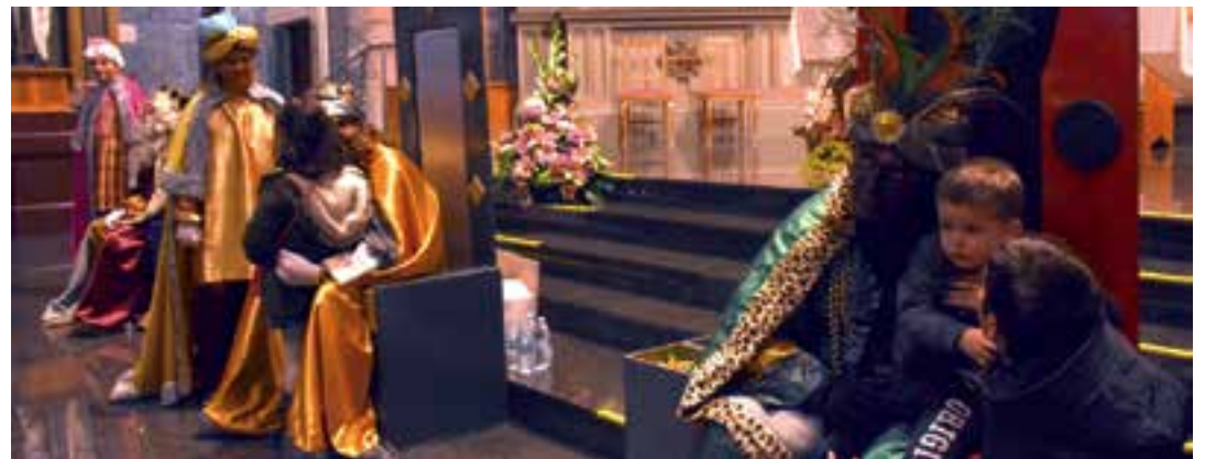
Eguraldiaren aurreikuspenak txarrak zirela eta, urtarrilaren 5eko kabalgata bertan behera geratu zen. Meltxorrek Olentzerok adina lan izan zuen Elizan haurrei egindako harreran, hark piztu baitzuen haur gehienen arreta.