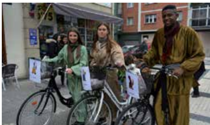
Gaspar, Meltxor eta Baltasarren pajeak Andoaingo haurren eskutitzak jasotzen aritu ziren kalean zehar, urte zahar egunean.