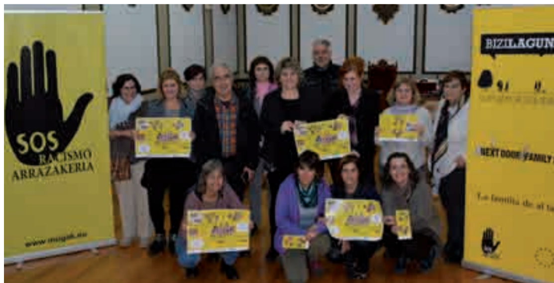
SOS Arrazakeriak eta Andoingo Udalak ekimena aurkeztu zuten, hainbat herrikiderekin batera.

Zurrumurruak Stop tailerra, hein handi batean, estereotipo- ak eta aurreiritziak gainditzeko antolatu dute. Hori ere Andoi- nen izango da, azaroaren 13an. Andoingo aurkezpen ekital- dian adierazi zuten, "emigra-