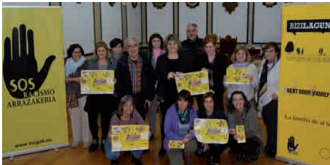
Aurkezpena Udal ordezkariak, ikastetxeetako gurasoen ordezkariak, eragile sozialak eta herritarrak hurbildu ziren.

Azaroaren 13ko tailerra zertan datzan adierazi zuen segidan: “Tailerrarekin dinamika parte hartzaile eta hezitzailea sortzen da, emigrazioaren gainean eduki ditzakegun iritziak auzitan jartzeko aproposa. Ha-