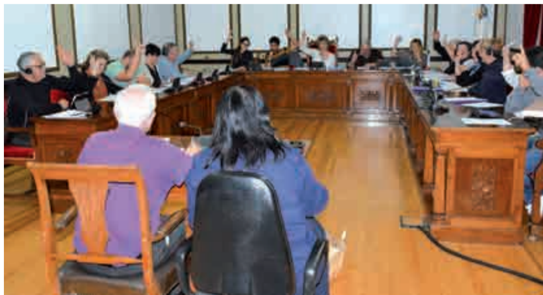
Joan zen osteguneko udal batzaraldiko irudia. Pleno osoa bideoan ikusgai dago, andoain.eus webgunean.

EAJ-PNVk hiru puntuko mozio alternatiboa aurkeztu zuen. Lehenik, Andoaingo Udalarri eskatzen zaio argitu dezala Gipuzkoako zarata mapari alegaziorik aurkeztu ote dion ala ez; bigarrenik, Udalak Aldundiari bidera diezaio la udalerrian egon daitezkeen zarata gune kritikoen zerren-