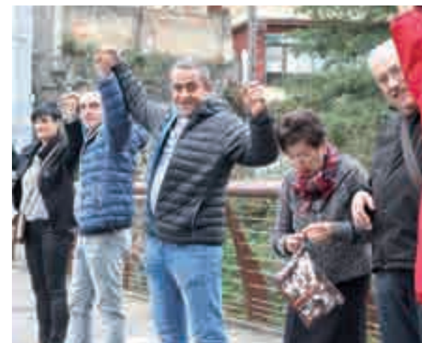
Joera politiko ezberdinetako ordezkariak hurbildu ziren giza-katera.