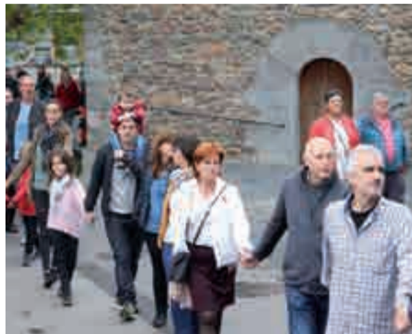
Partaideek Zumea kalea eta Kale Nagusia elkar lotu zituzten.