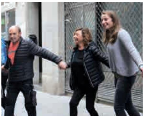
Adin ezberdinetako herrikideak elkartu ziren giza-katean.