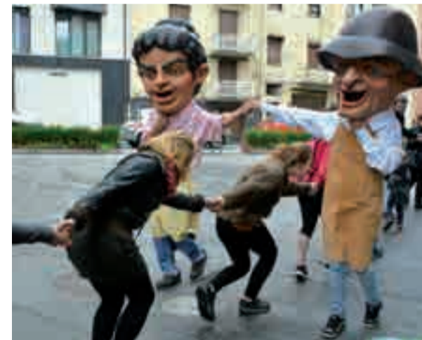
Erraldoi eta buruhandiei esker ekimena jai giroan igaro zen.