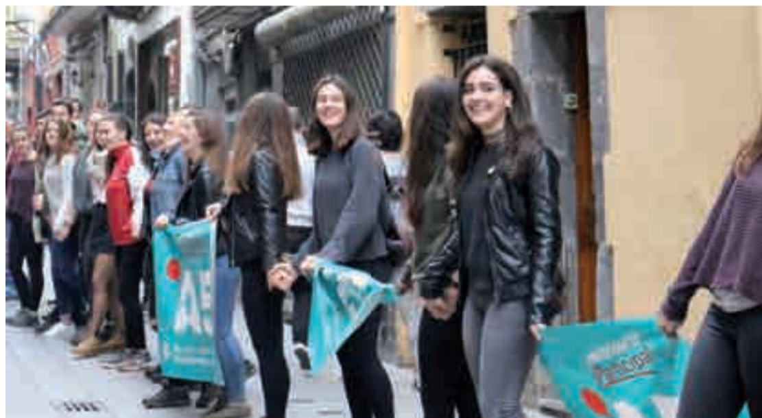
Andoain Esan ekimenak adin guztietako eta izaera ezberdineko herrikideak erakartzea lortu zuen, joan zen larunbatean.

Giza-katea azaroaren 5eko herri galdeketa azken txanpan sartzeko iragarpena izan zen, herrikideak mobilizatzeko aldera antolatutako ekitaldi publiko sortako lehena. Andoain Esan ekimenak, larunbat eguerdian, adin guztietako eta izaera ezberdineko herrikideak erakartzea lortu zuen. Ibilbidean Goikoplaza, Juanita Alkain plaza eta Zumea plaza zeharkatu zituzten. Sinbolikoki, gainera, herri kontsultan ipiniko dituzten bozkatzeko hiru erremuetatik igaro ziren. Jai giroan burutu zen, Erraldoi eta buruhandien konpartsaren parte hartzearekin. Giza-katea Kale Nagusia eta Zumea plazan geldirik egon zen minutuetan partaideak besoak altxata edota sigi-saga aurrera eta atzera ibili ziren.