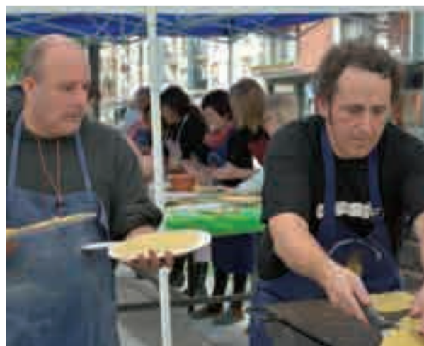
Giza-katea amaitzerako talogileak prest ziren.