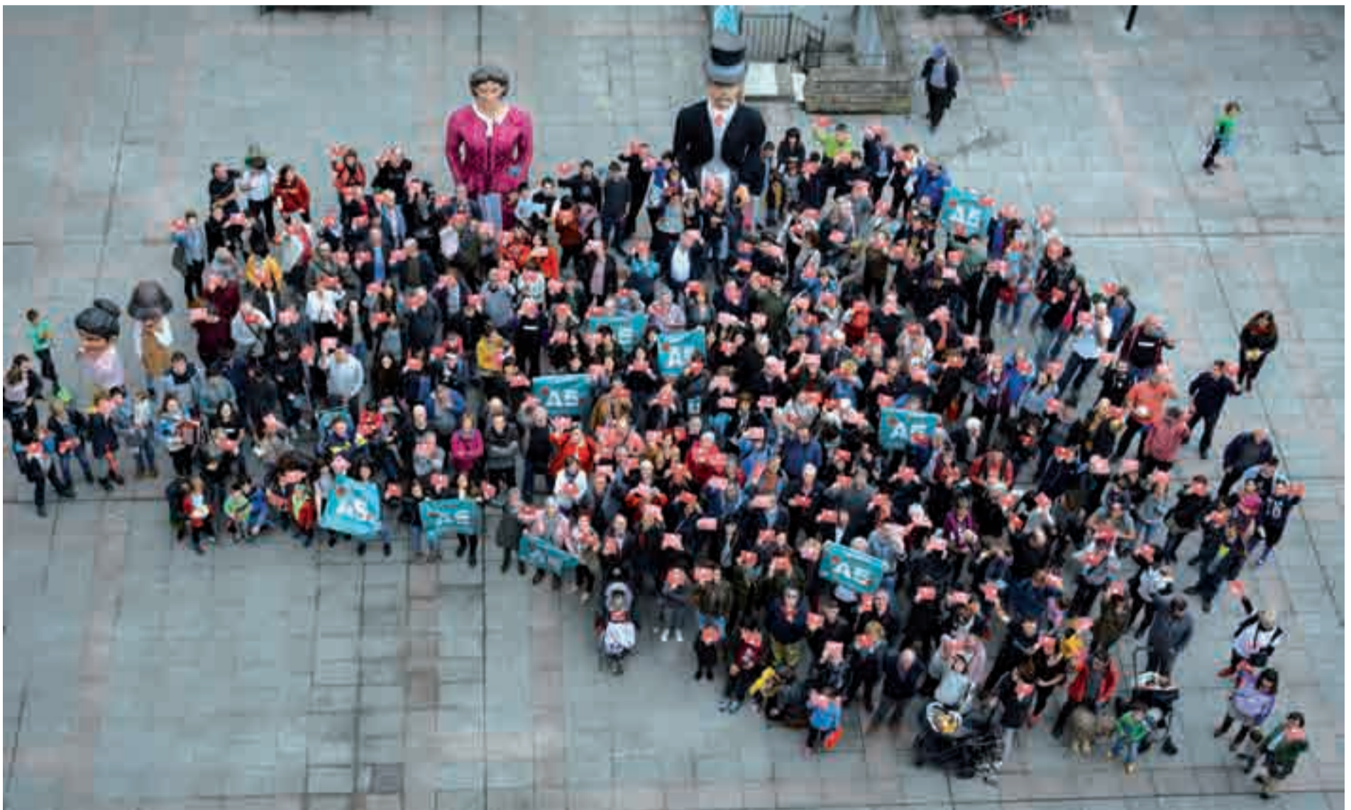
Dozenaka lagun bildu zen larunbat eguerdian, Goikoplazan hasi eta Zumea plazan amaitu zen ekitaldian.

tatu burujabe bateko herritarra izan?” galderari erantzuteko aukera eskaintzeko. Getxo, Galdakao, Leioa eta Bizkaiko herri gehiagotan ere herri kontsulta gehiago antolatuko dituzte igandean.