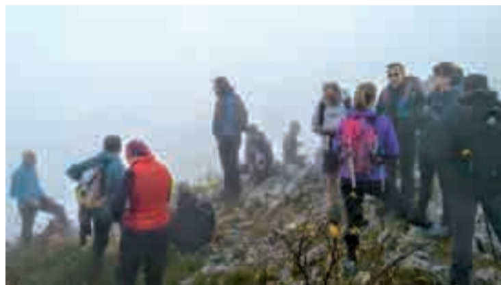
Etxekortea ganean lainoa sartuta zegoen, argazkian ikus daitekeenez.