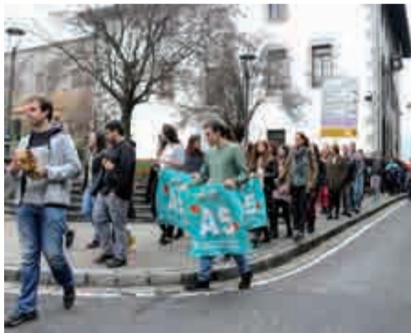
Trikitilarien doinupean abiatu zen kalejira, larunbat eguerdian.

Boluntario eta laguntzaile askoren lanari esker bikain irten zen urriaren 28ko kalejira eta giza-katea.