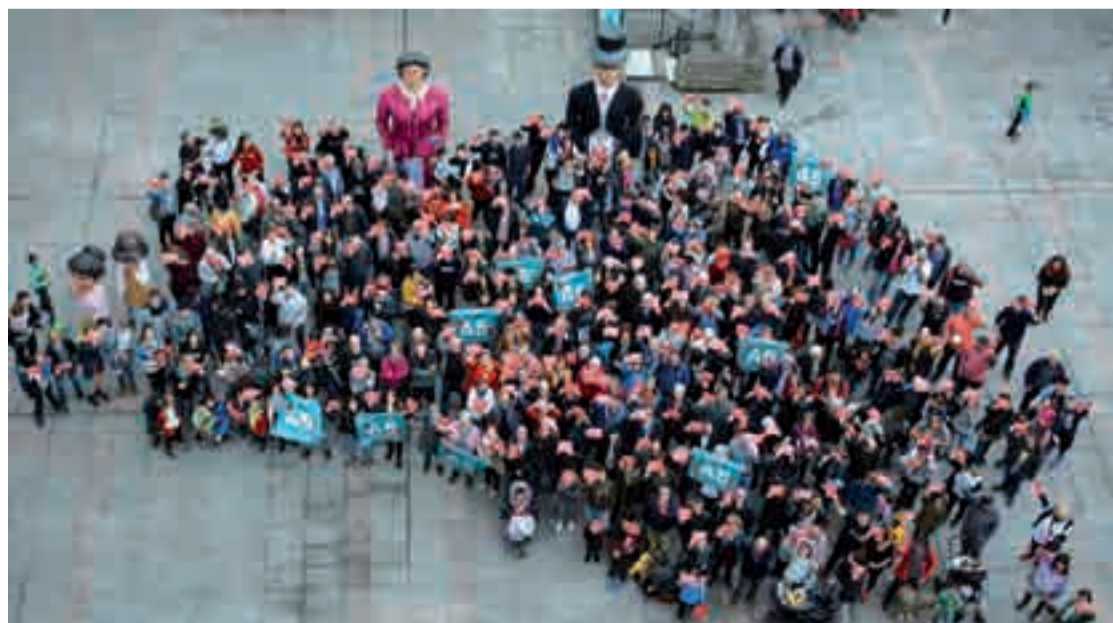
Giza-katea egin zuten joan zen larunbatean.