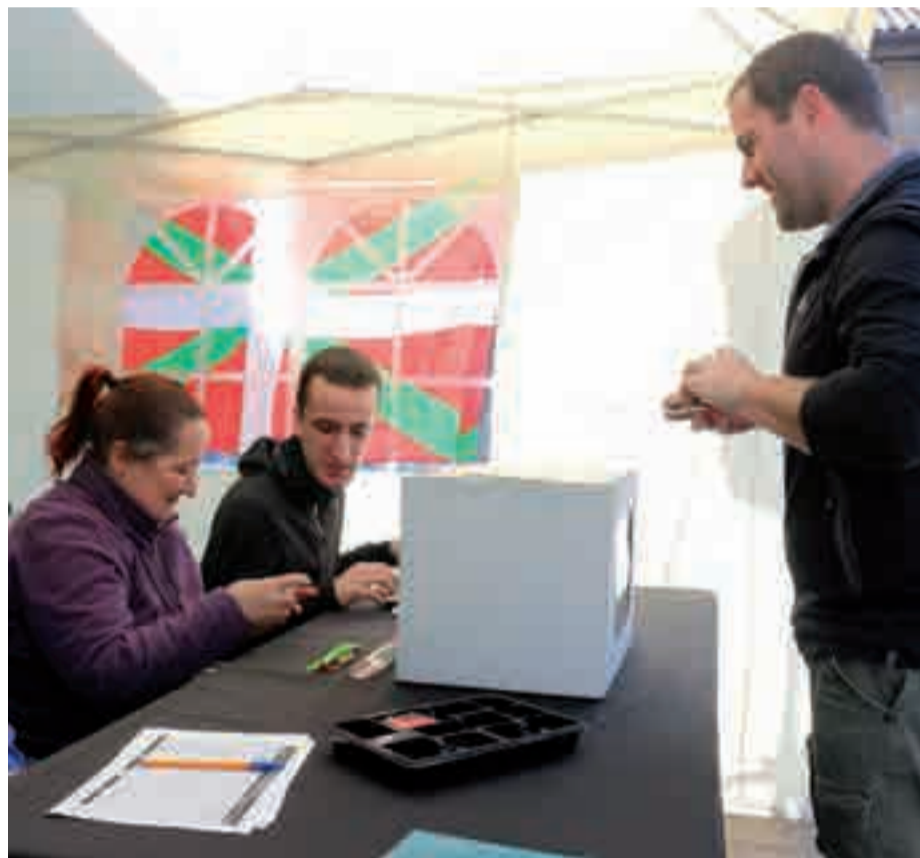
Martxoaren 19an Buruntzaldeko eta Tolosaldeko hainbat herritan galdeketak egin zituzten.

“Inoiz ez delako galdetu zein komunitateko kide izan nahi dugun, eta andoaindar guztioi dagokigun eskubidea delako erabakitzea”, diote sustatzaileek.