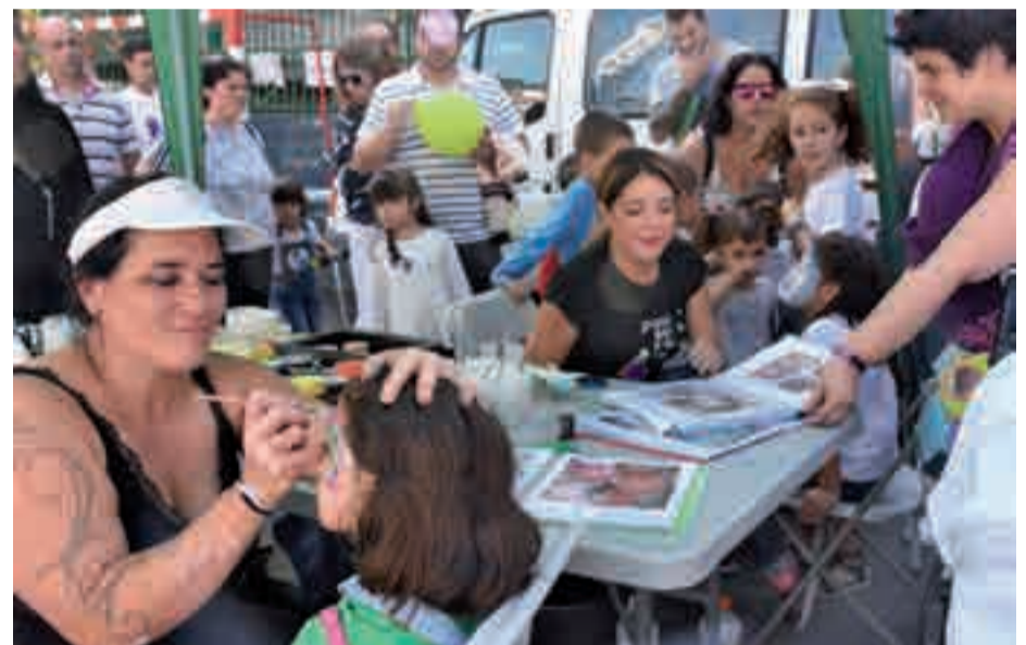
Margotzeko tallerrean, taberman edota janari postuetan urnietar ugari aritu zen lanean.