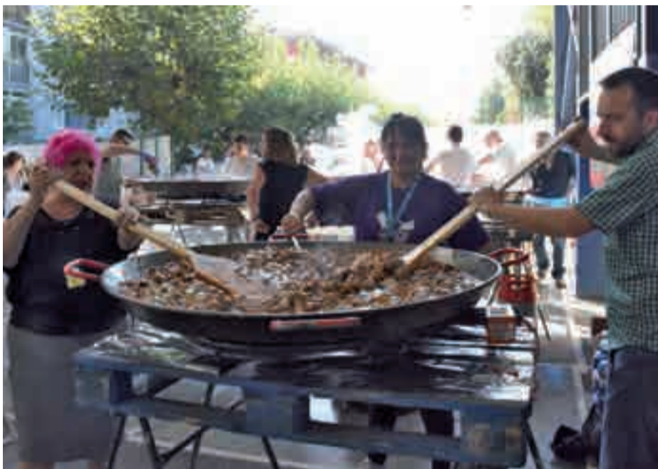
Hainbat paella erraldoi prestatu zituzten larunbatean, Pausoka egunean.

aritzera eta gainerakoak aisialdiaz edota jatekoetz gozatzera. Eguraldia lagun, egun ederra izan zen. Iluntzean, puxikak airera botatz eman zioten jaiari amaiera.