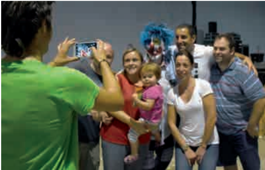
Porrotx pailazoak dantza, kanta eta alaitasuna ekarri zuen Urnietara egindako bisitaldian.