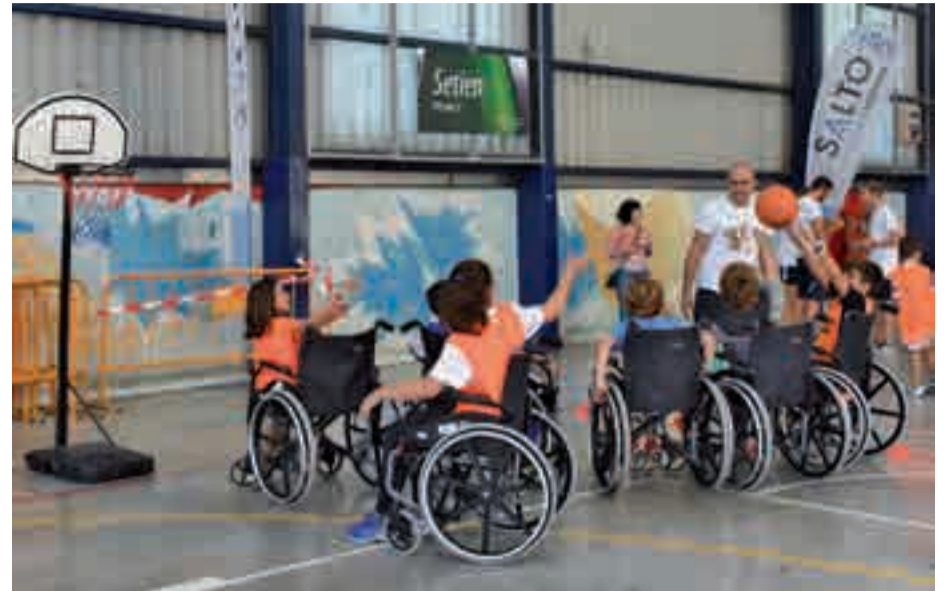
Haurrak saskibaloian aritu ziren, egokitutako saskibaloijokalarien antzera.