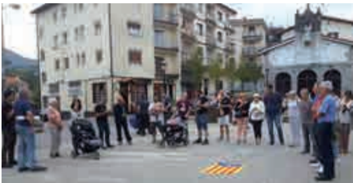
San Juan plazan elkarretaratzea egin zuten, joan zen asteartean.