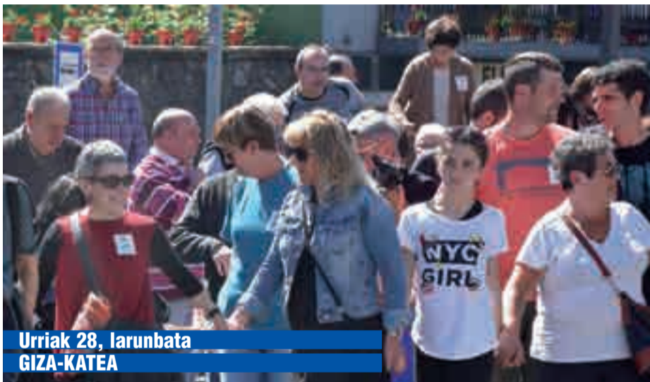
Urriak 28, larunbata GIZA-KATEA

leen premia izango da, eta bitartean herri mailan kontsultarekiko sentsibilizazioa areagotzeko datozen egunetarako ekitaldi sorta antolatu dute.