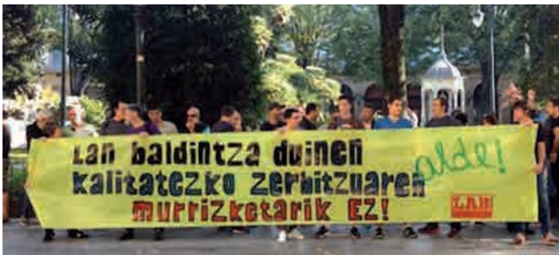
LAB sindikatuak agerraldia egin zuen joan zen asteartean Donostian, Gipuzkoako Foru Aldundiaren parean.