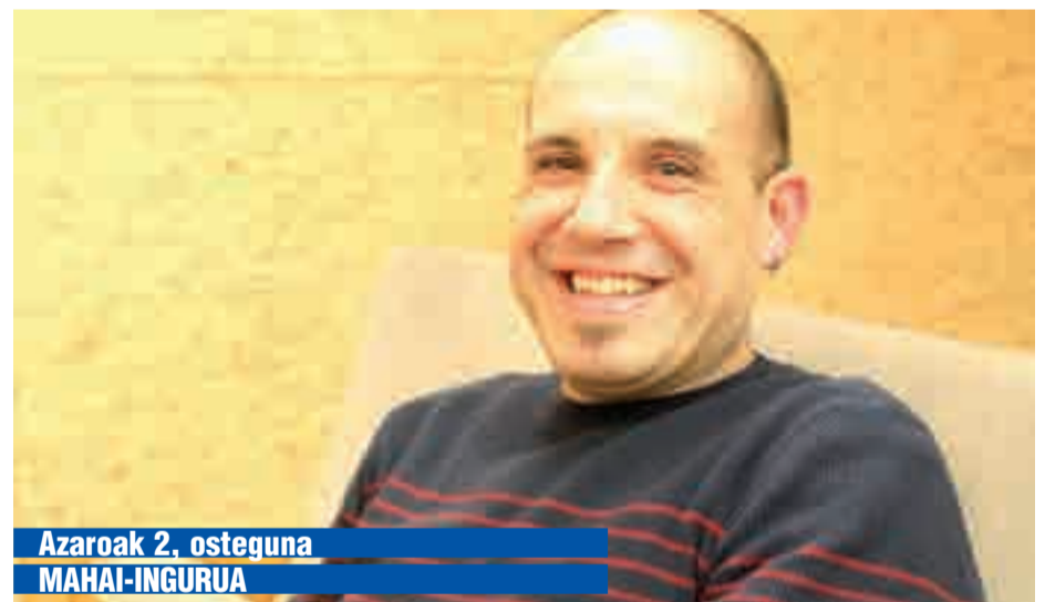
Azaroak 2, osteguna MAHAI-INGURUA