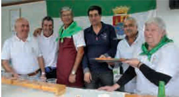
Hogar Extremeñoeko hainbat kide, idazko edizioan.

Herrien jaia Zumea plazan ospatuko da aurten, urtetan eta urtetan Nafarroa Plazan egin ostean. Iñaki Gomez Hogar Ex-