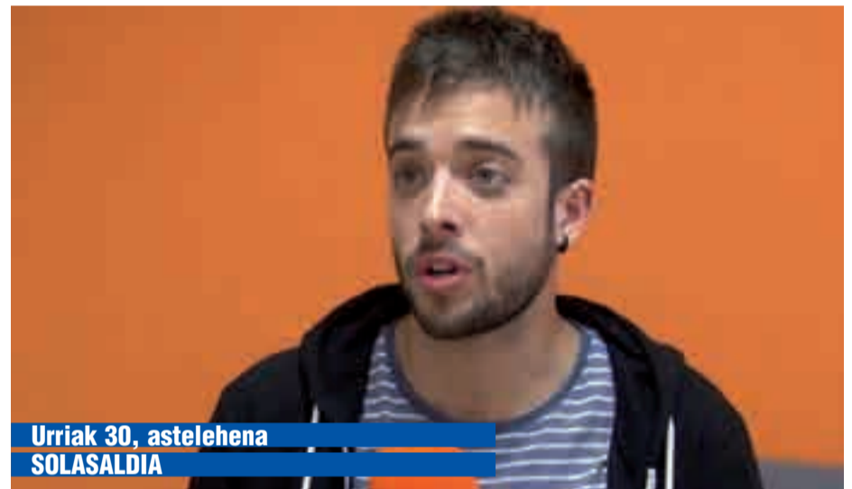
Urriak 30, astelehena SOLASALDIA

Eguerdiko 12:00etan abiatuko da Goikoplazatik Santa Krutz zubiraino.