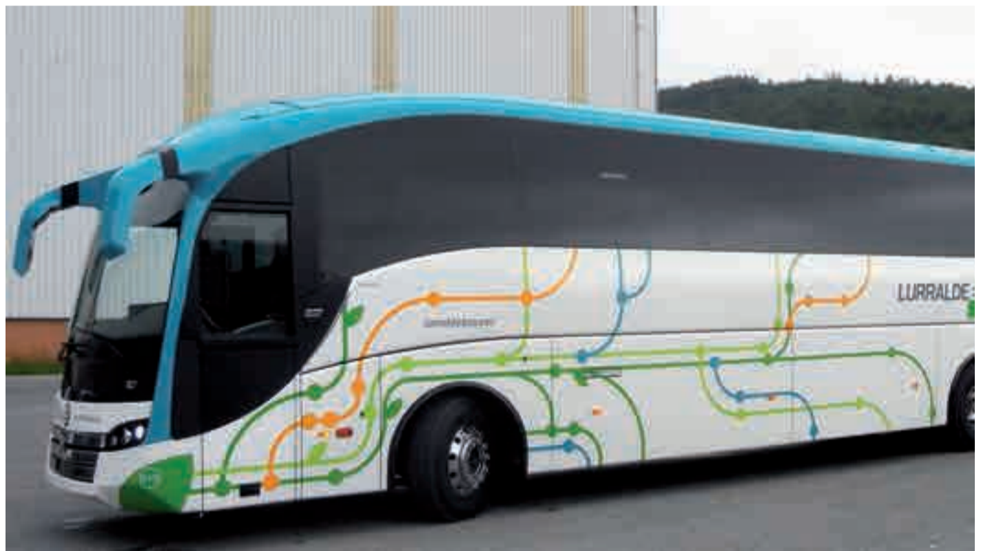
G2, G3 eta G4 autobus ibilbideak Andoaindik eta Urnietatik igarotzen dira.

“Gipuzkoako Foru Aldundiko Mugikortasun eta Lurralde Antolaketako Departamentuak autobus zerbitzuaren berrantolaketa plana aurkeztu du. 2017ko irailaren 7an Gipuzkoako Aldizkari Ofizialean argitaratu zuen aurreproiektua, eta han ikus daitekeena-