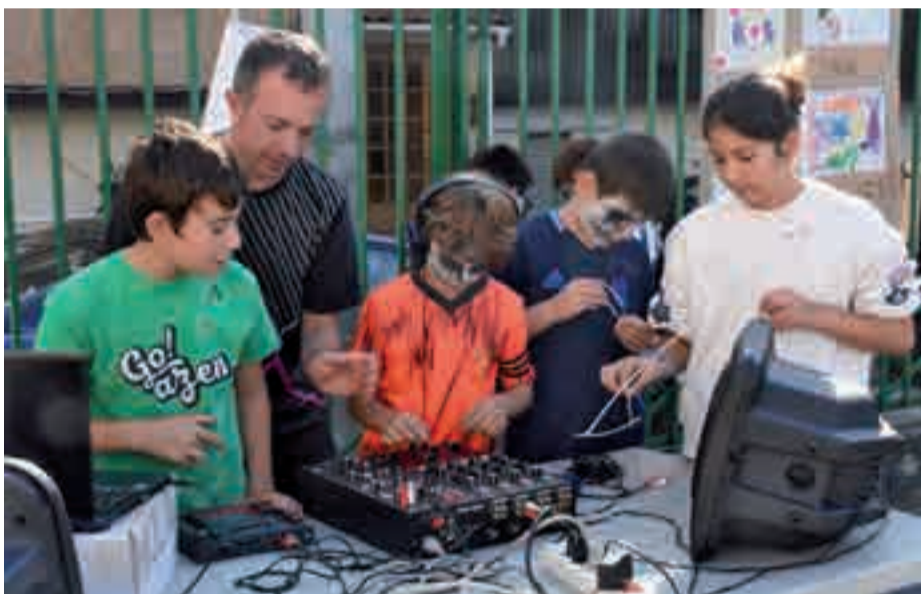
DJ tailerra egin zuten Egape ikastolako jolastokian.