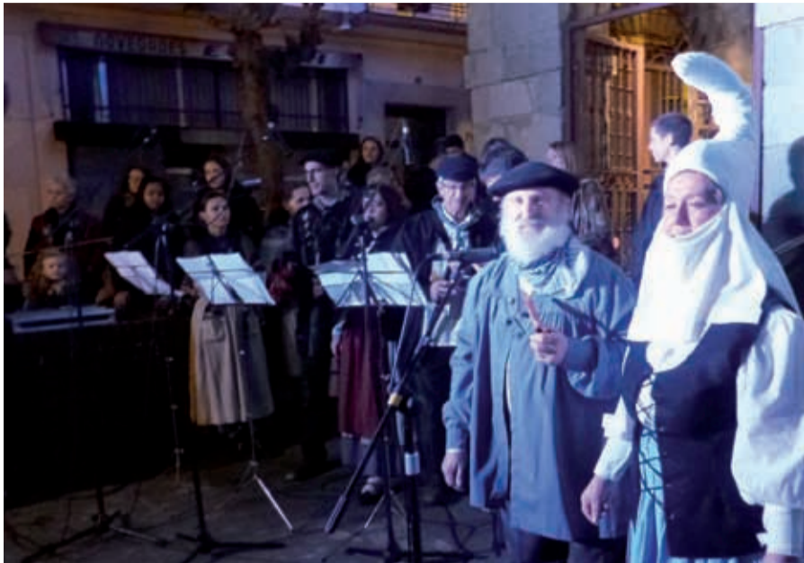
Abenduaren 23an Olentzero eta Mari Domingi datoz