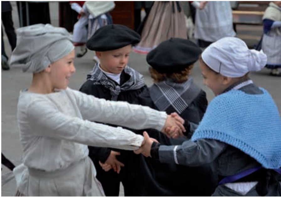
Eguberrietako ospakizunen hasiera bikaina