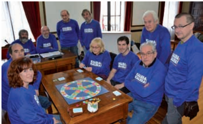
Herritar taldea pleno aretoko itxialdian.

"Kalera kalera" kanpainaren baitan ekimenak egiten dira Euskal Herria osoan zehar.