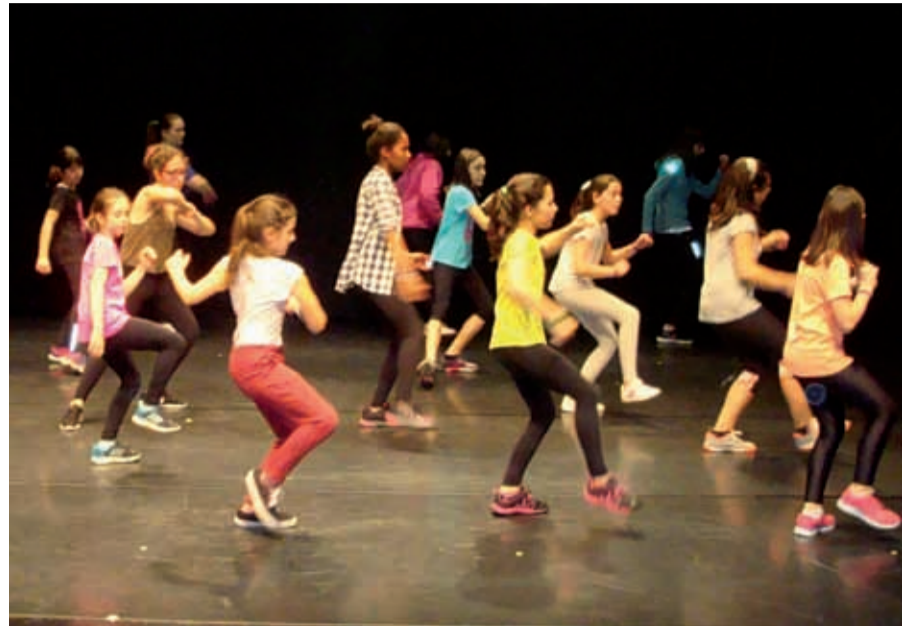
Garaikidea eta Hip hop dantza estiloak

Lasterketa doakoa da, gainera. Parte hartzaileek ez dute ordaindu behar izango.