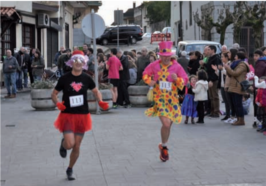
Abenduaren 31n, San Juan plazan hasita