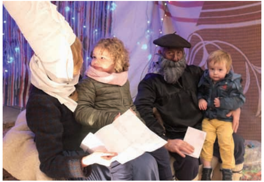
Mari Domingik eta Olentzerok gutunak jaso zituzten