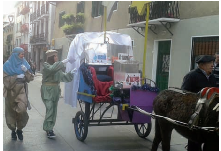
Pajeek gutunak jasoko dituzte abenduaren 30ean