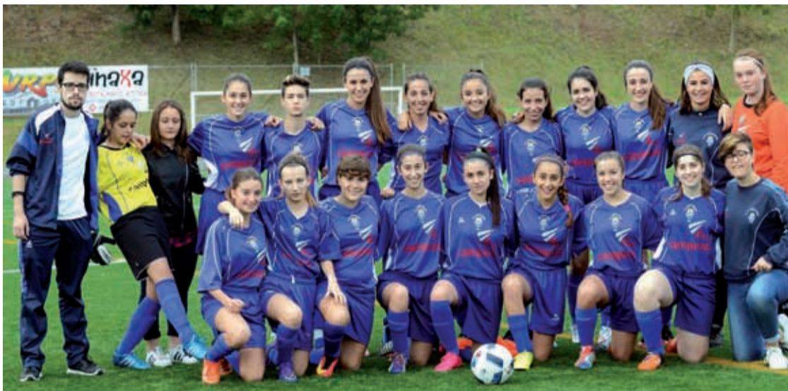
Euskaldunako kadete mailako neskak.