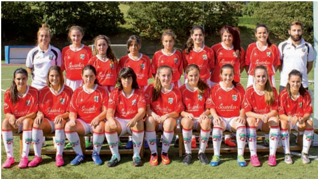
Urnieta Kirol Elkarteko kadete mailako neskak, denboraldi hasieran ateratako argazkian.

Harrobia indartsu dator, eta hori etorkizunera begira seinale ona da. Bigarren multzoko ligaskan andoaindarrak eta urnietarrak lehen postuetan daude Zarautz taldeari 6 puntu ateraz.