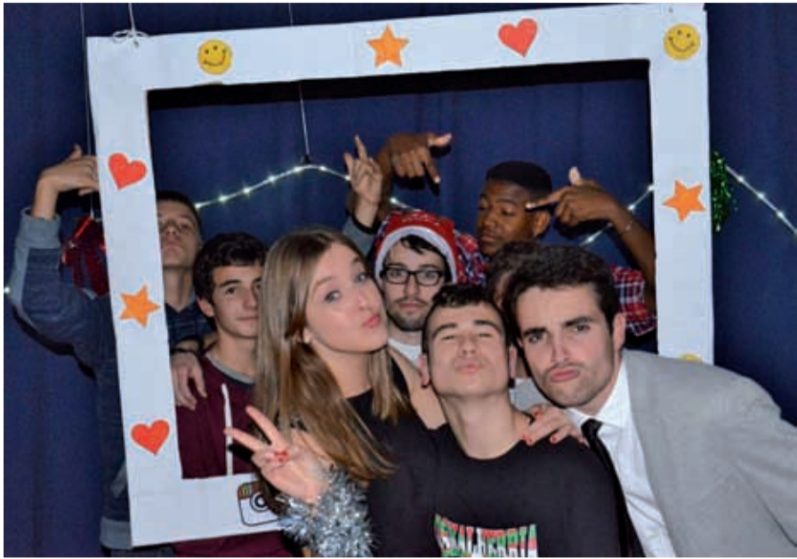
Joan zen larunbatean ospakizuna egin zuten