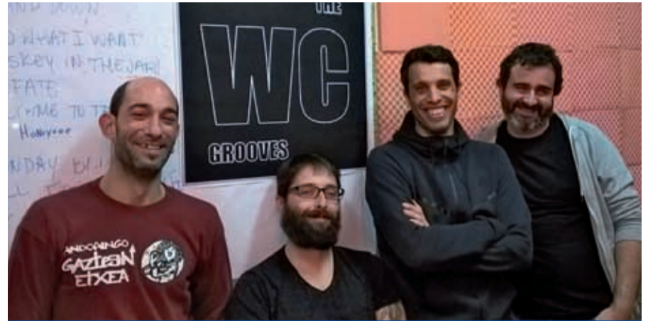
The WC Grooves