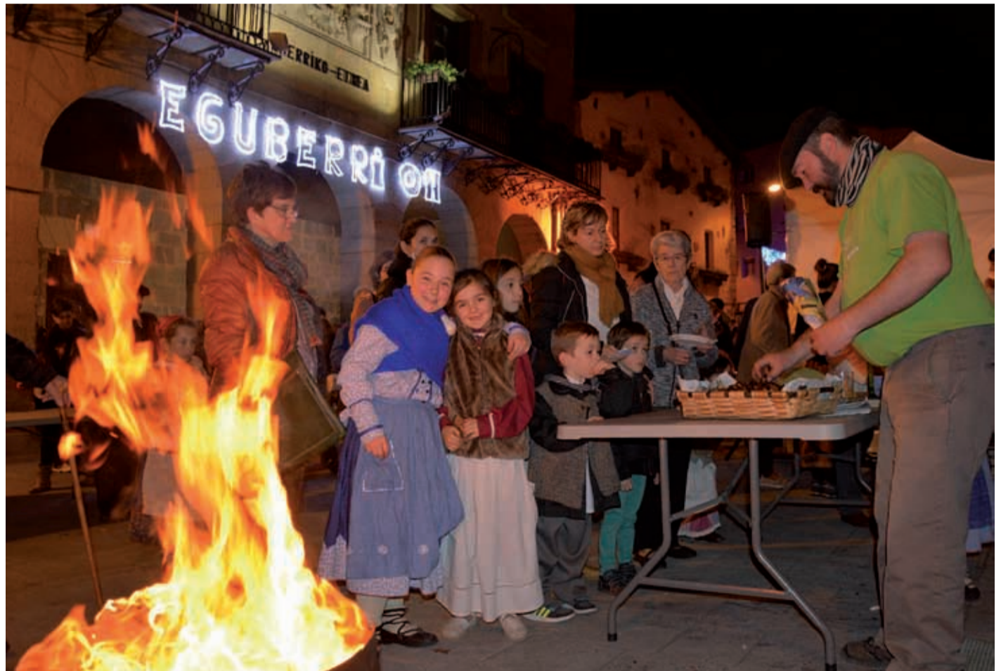
Eguberrietako magia berezia biltzen duen argazkia, iazko San Tomas ospakizunear.

Haur eta gaztetzontzat aisialdia ziurtatuta dago Eguberri hauetan. Urnietatik atera gabe, aukera zabala izango da.