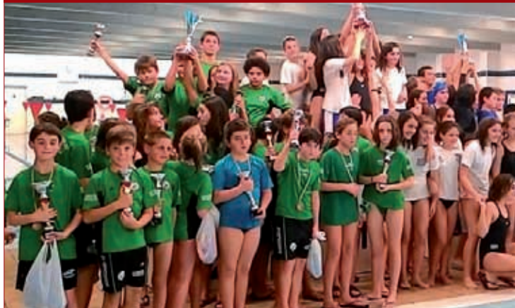
Buruntxikiak Oartzungo San Esteban sarian txapelkun-orde izan ziren.