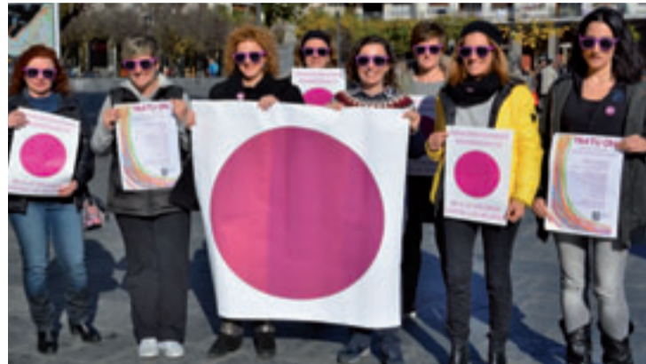
Udal ordezkariak eta teknikariak, aurtengo kanpainaren aurkezpenean.

Lanketa egiten jarraitzeko beharra defendatu zuen, eta Udal zerbitzu ezberdinak ho-