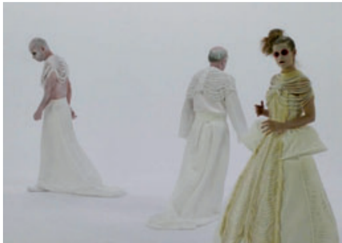
Urnietako Saroben egin zuten aurre estreinaldia, eta laster Donostian.

Azaroaren 16an egin zuten Saroben “Lu eta Le” antzezlanaren aurre estreinaldia. Donostia 2016 Kultur Hiriburutzatik Bernardo Atxagari enkargatu zioten lan hau, Xabier Letek idatzitako “ Gabon Txirrita ” antzezlanetik abiatuta idazteko. Baina, Atxaga Lurdes Iriondo eta Xabier Lete ren gan zentratu da (“Lu eta Le”), eta beraien bizipenentan oinarritutako da antzezlan idatzitako du, Txirrita alde batera utzita.