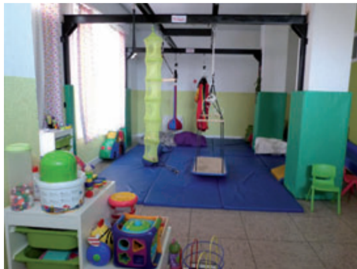
Urnietakoa Hernaniko Floridan dagoen instalakuntzen oso antzekoa izango da.