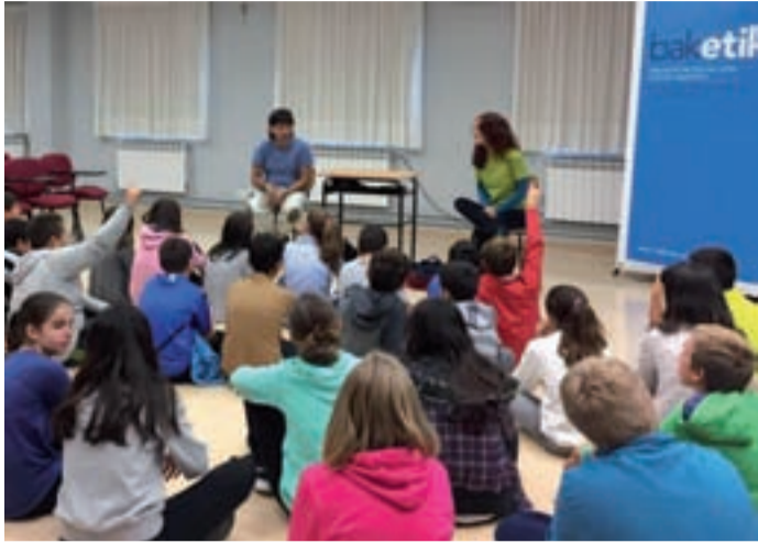
Tailerra antolatu zuten Baketik-en eskutik, Salesiar ikastetxean.

DBHko ikasleek bullying-a hizpide izan zuten, Baketik-en eskutik. Tailerrak hiru zati zituen: antzerkia, foruma eta tailerra. Ikastetxeko arabera, "azpimarratze-