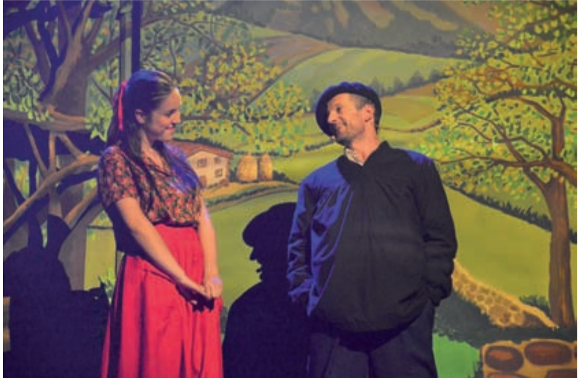
Arratsaldeko 19:30ean hasita, "Gabon Txirrita" ikuskizuna Ereñotzuko frontoian.

"Gabon Txirrita" ikuskizunaren itzala luzatzen ari da, duen arrakastaren seinale. Donostian eta Urnietan sarrerak agortu eta gero, Xabier Letek idatzi eta zuzendutako ikuskizunaz gozatzeko aukera berria izango da larunbat honetan Ereñotzuko frontoian.