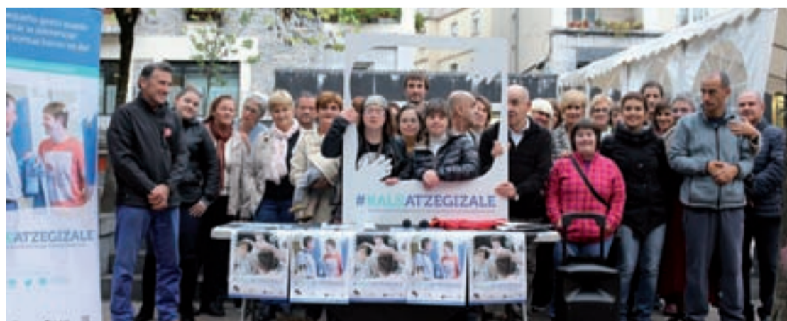
Beterrri-Buruntzako kanpainaren aurkezpen agerraldia egin zuten aurreko astean.