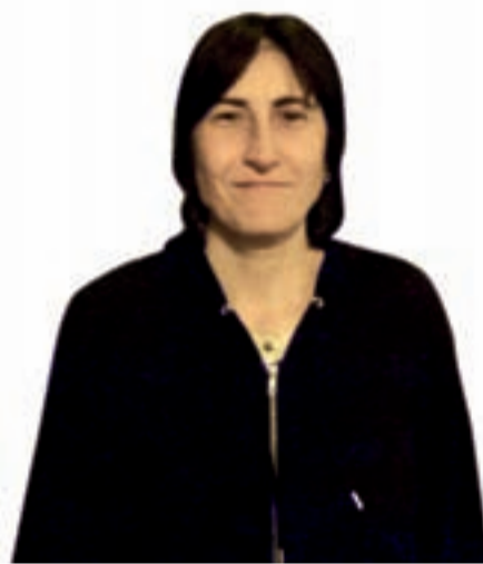
GURASO ESKOLA PILI SARRIEGI

“Haurra ikastetxean dagoen arratsaldeko tarte hori egokia da niretzat”