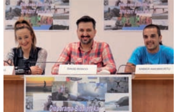
Bidaia eta esperientziak hizpide izango dituzte Urrietako ziklo berria.