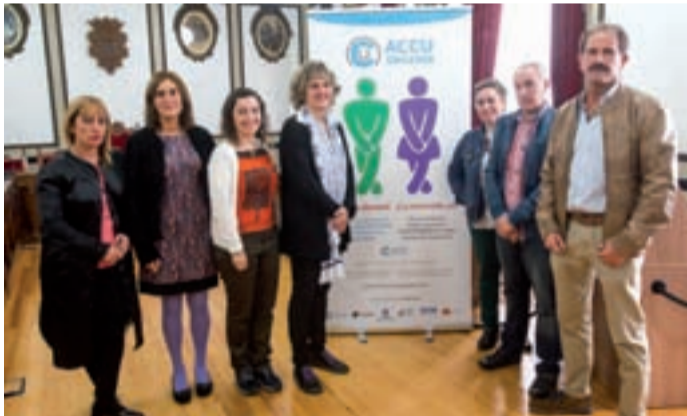
Aurkezpen ekitaldia egin zuten Andoaingo batzar aretoan.

Urriaren 20an Andoaingo udaletxeko pleno aretoan, osasun-arazo bat dela eta komuna joateko premiaren aurrean komuna uzteko kanpaina aurkeztu zuten.