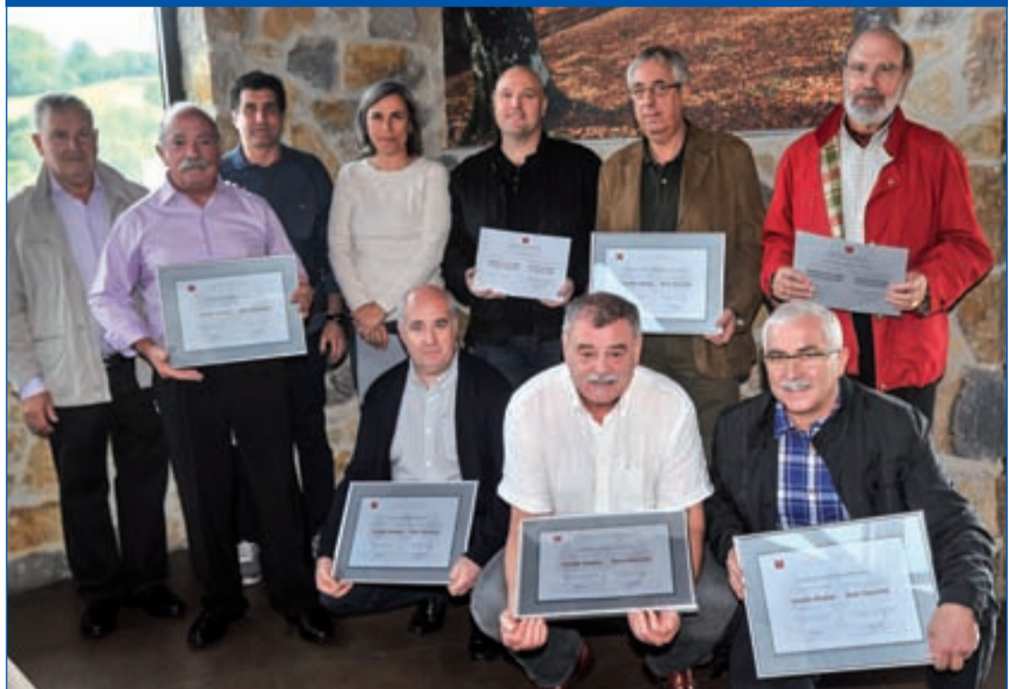
Odol emaleen elkarteak Oianumen bildu zituen Beterri-Buruntza eta Beterri-Aiztondoko odol emaleak, haien lana eskertu eta omentzeko. Argazkian, aurtengo bazkarian omentu zituzten andoaindarrak.