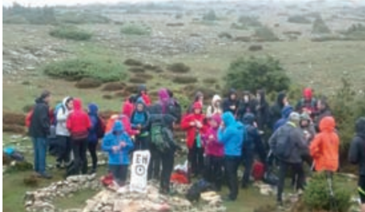
Beriain aldera abiatu ziren urrian Zanpatuz elkarteko kideak.

Izena emateko zerrendak Kanto, Xauxar eta Ikasmin akademian jarriko dira. Epea azaroaren 10a izango da.