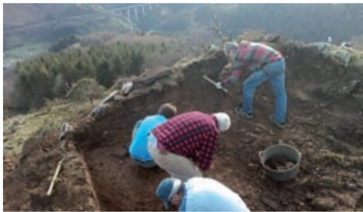
Nafarroako Areson Santa Krutz ermita zaharrean indusketa lanak egiten.

Igande honetan eguerdiko 12:00etan hasita karea egiten hasiko dira Goiburuko Ortzaika baserriko karobian. Ekitaldia irekia da.