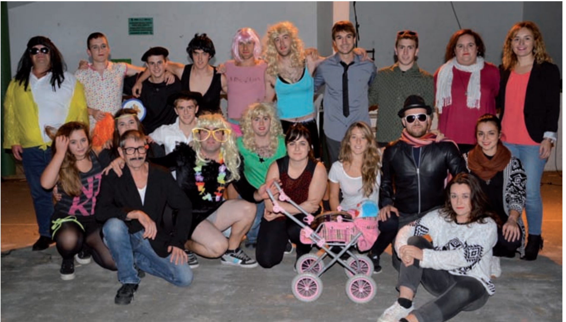
Badute meritua Xoxokako gazteek urtero antzerkia antolatuz, nahiz eta antzezleriak ez izan. Gaztea irratia eta bogan dabilzan musika taldeen arteko lehiaketa parodiatu dituzte aurtengoan.