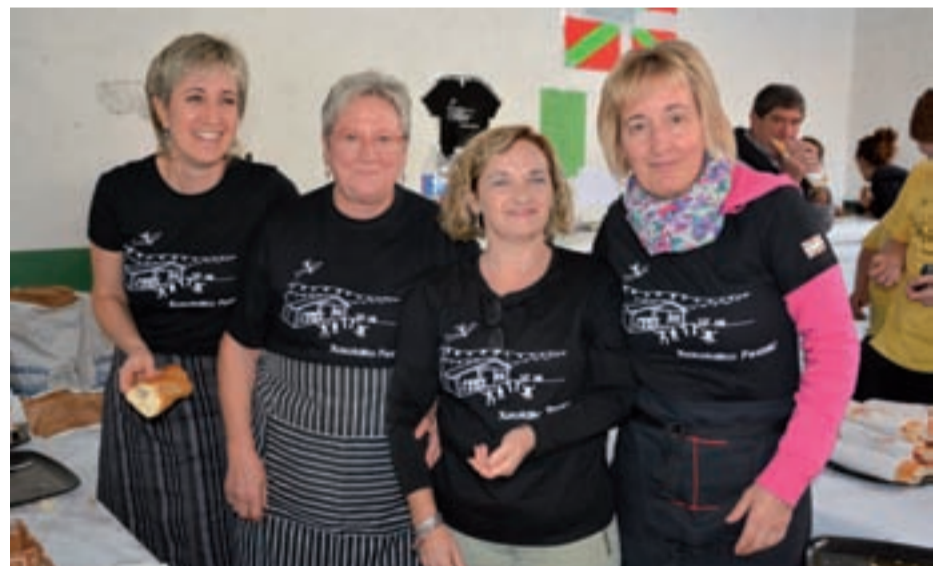
Herri kirolen ostean, sukaldean jo eta ke aritu zen emakume laukotea.