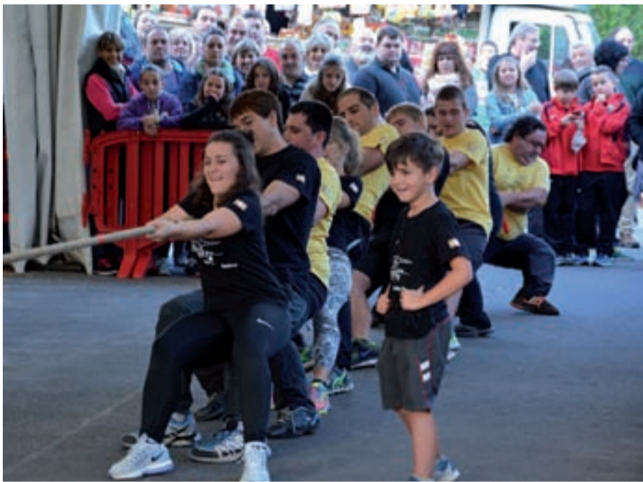
Sokatiran bi taldeetako partaideak nahastu behar izan ziren, pisuan berdintzeko.

Jai giro ederrean ospatu dira ekitaldi guztiak, eguraldia paregabea izan baita. Igande arratsaldean ohiko sagardo dastaketarekin eman zieten amaiera jaiiei.