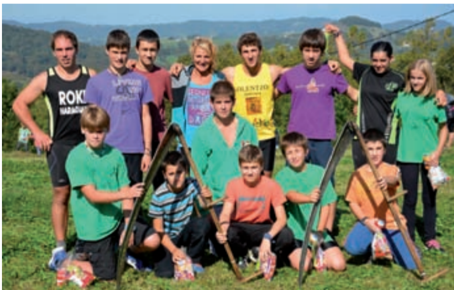
Apustuko lau segalariez gain, gaztetxoek ere erakustaldia egin zuten belar mozketan.