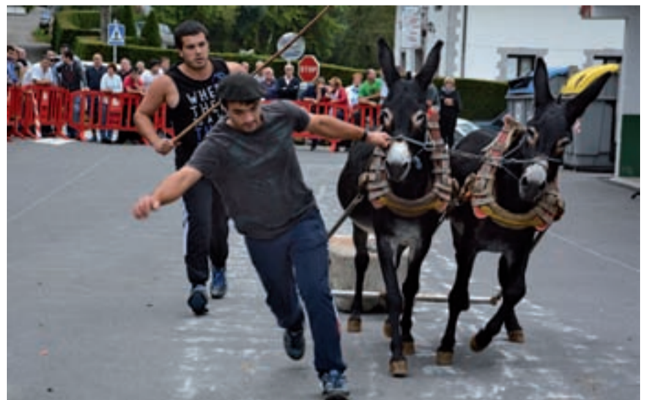
Eneko Seinen astoek gogor jardun zuten, baina ezin izan zituzten idien plazak bikoiztu.