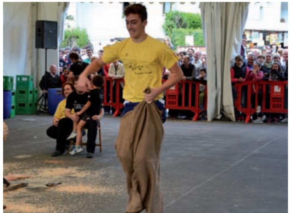
Zaku saltoan eta beste makina bat jokotan jardun zuten gazteek.