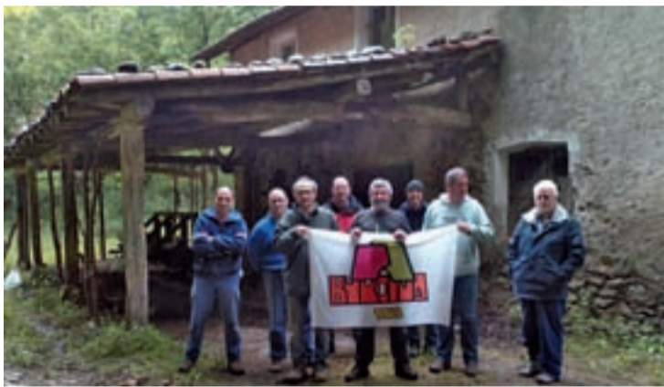
Burdinako kideak Orexako errota eta zerrategia txukundu ostean.