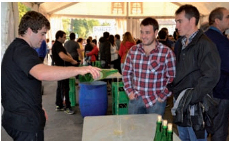
Urnietako sagardotegietako sagardoa edan zen Xoxokan.