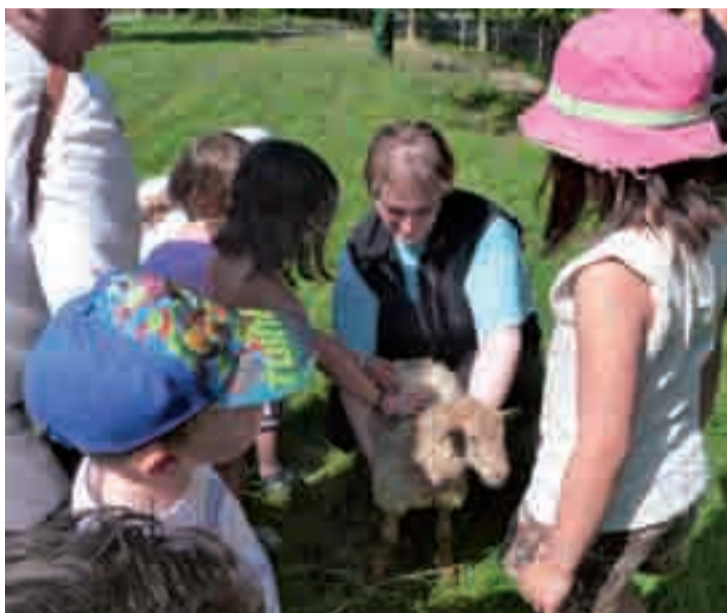
Iriondok baserriko atea ireki zizkien bisitariari. Artaldea ezagutu zuten lehenik.