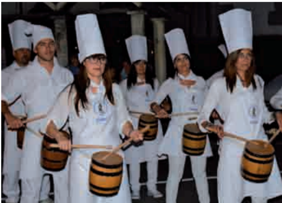
Larunbat gauean Ontza elkartearen kanpoaldean lehen saioa egin eta gero, zaharren egoitzara abiatu ziren.

ri dagokionez mesedegarria izan dela esan daiteke. Auzokideez gain, herritar asko hurbildu ziren asteburu osoan zehar. Bereziki, igande arratsaldeko auzotarren arteko desafiara.