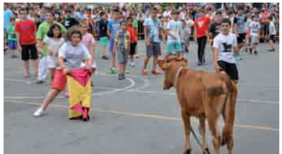
Gorritiren animallekin ikuskizuna ziurtatuta dago.