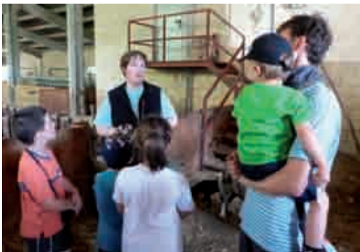
Ardiak ukitu eta gaztak ikusteko aukera izan zuten Adarrazpi baserrian.