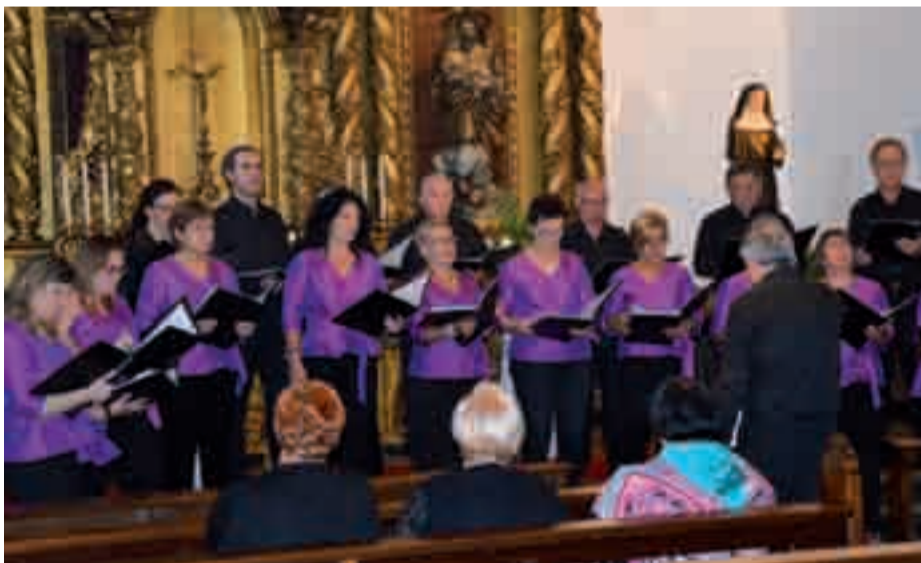
Amasa-Villabonako Eresargi abesbatzaren emanaldia, ostiral iluntzean.