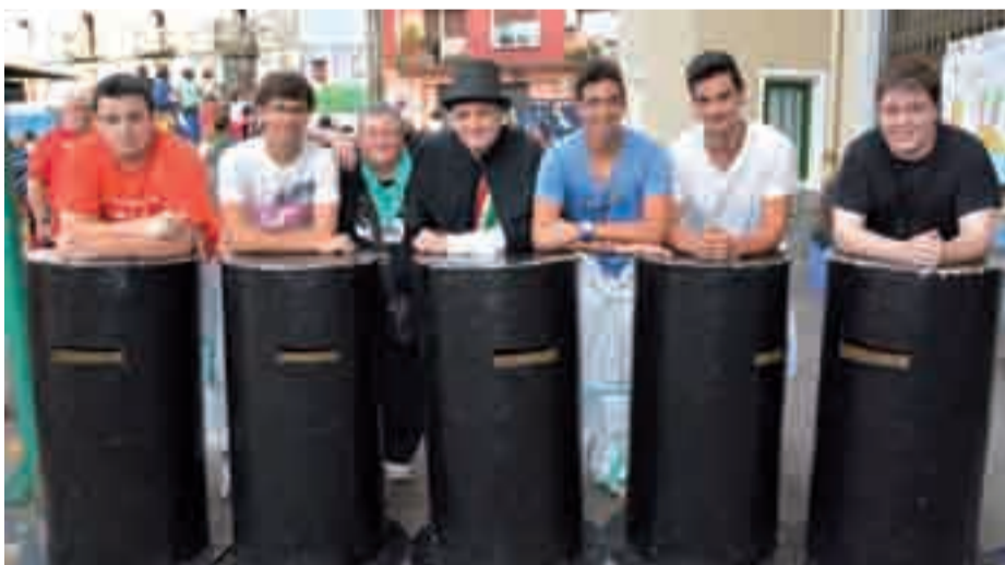
Kandido eta txikitxoak, Kaletxikiko protagonista nagusietakoak.