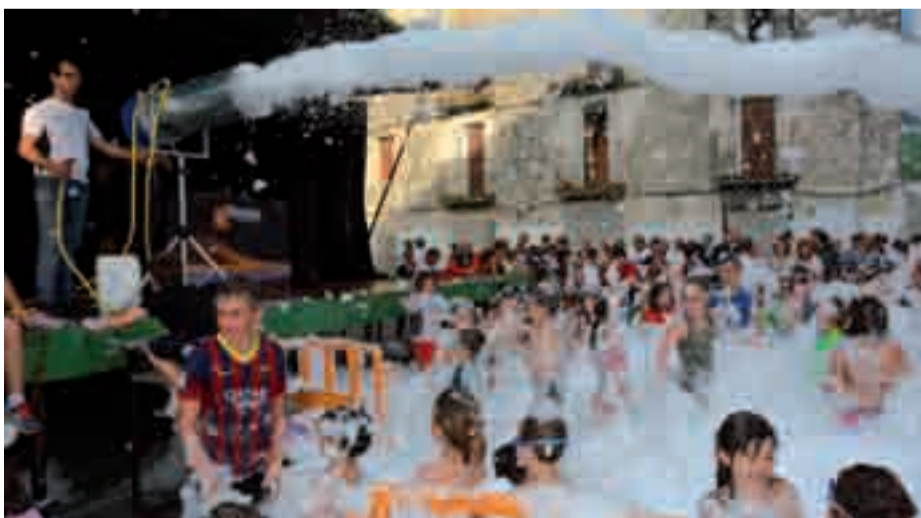
San Juan jaietan gertatu bezala, apar festa ekitaldi gogoangarrietakoa izan zen haurrentzat.