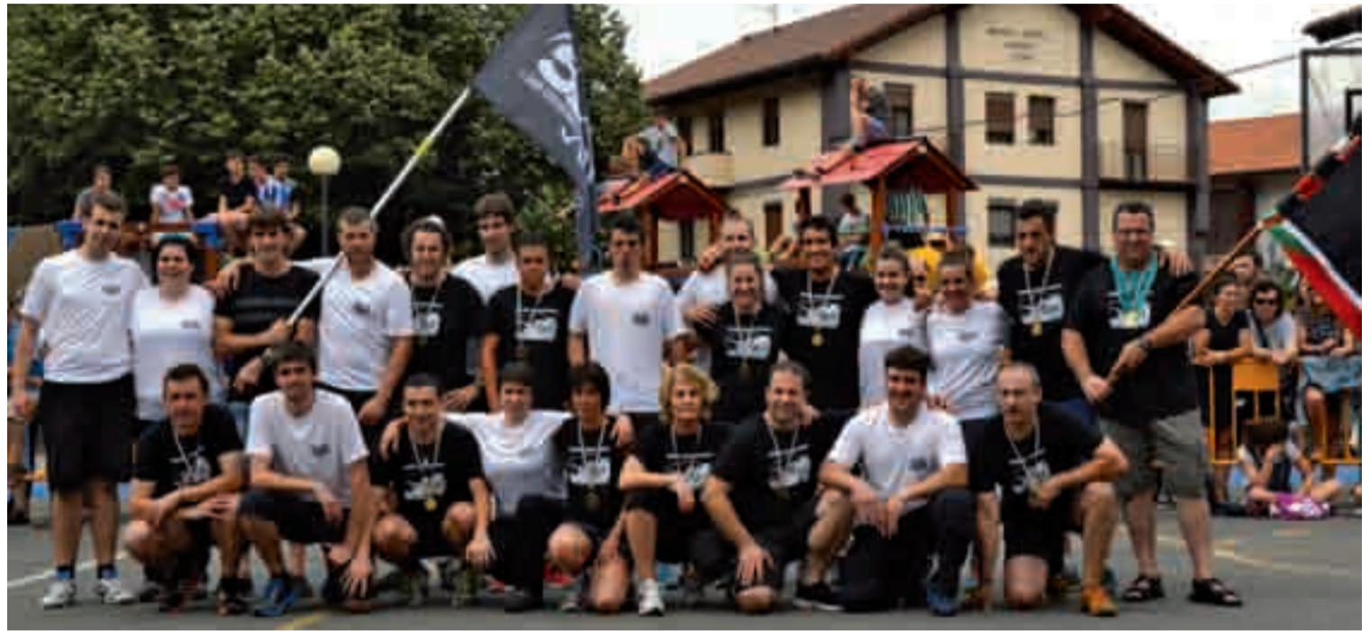
Auzoen arteko herri kirol desafioan parte hartu zuten kideak. Nor baino nor aritu ziren Kaletxikiko eta San Esteban auzoko kideak.

Azken segunduak ere kontutan hartu behar izan zituzten desafioaren garailea erabakitzeko. Estu-estu ibili ziren Kaletxikiko eta San Esteban auzoko kideak, proba ezberdinetan. Emozio hori ikusleengana iritsi zen eta hainbat unetan gogo biziz entzun ziren baten eta bestearen aldeko animoak. Auzoan bertan geratu zen txapela, oraingoan. Ikusi behar abuztuko errebantxan nor gailentzen den. Goiburuko jaietan esperientzia errepikatuko dute. Proba batzuk aldatuko badira ere, emozioa ziurtatuta izango da. Desafioan adiskidetasun giro ona nagusitu zen, Ontza elkartearen partaide guztien arteko afariarekin amaitu zena.