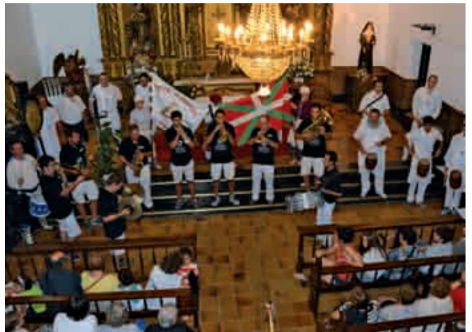
Danborrada ederki entzuten zen Berrozpeko kaperan.