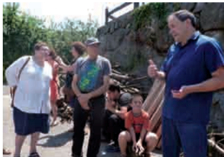
Sagastiak eta sagardoa ekoizpena gertutik ezagutu zuten Eula baserrian.

Baserritarrak eta kontsumitzaileak gerturatzeko asmoz, ate irekiera jardunaldiak antolatu zituen ENBA sindikatuak.