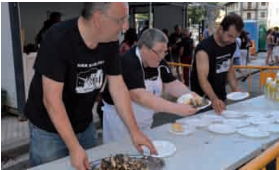
Sardin jatea, jaien hasierako hitzordu klasikoa Kaletxikiko jaietan.