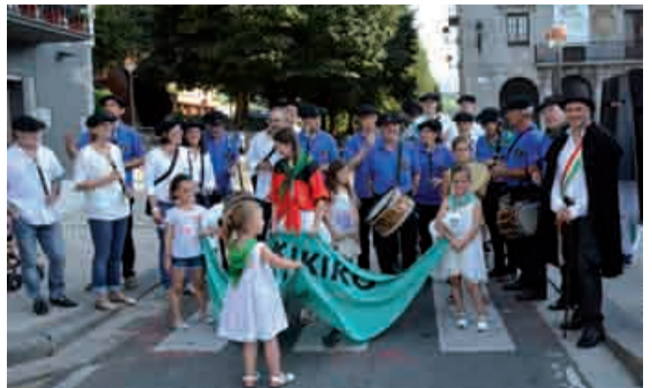
Txistulariak, Kandido, Txikitxuak eta auzoko gaztetxoak jaiari hasiera emateko prest.