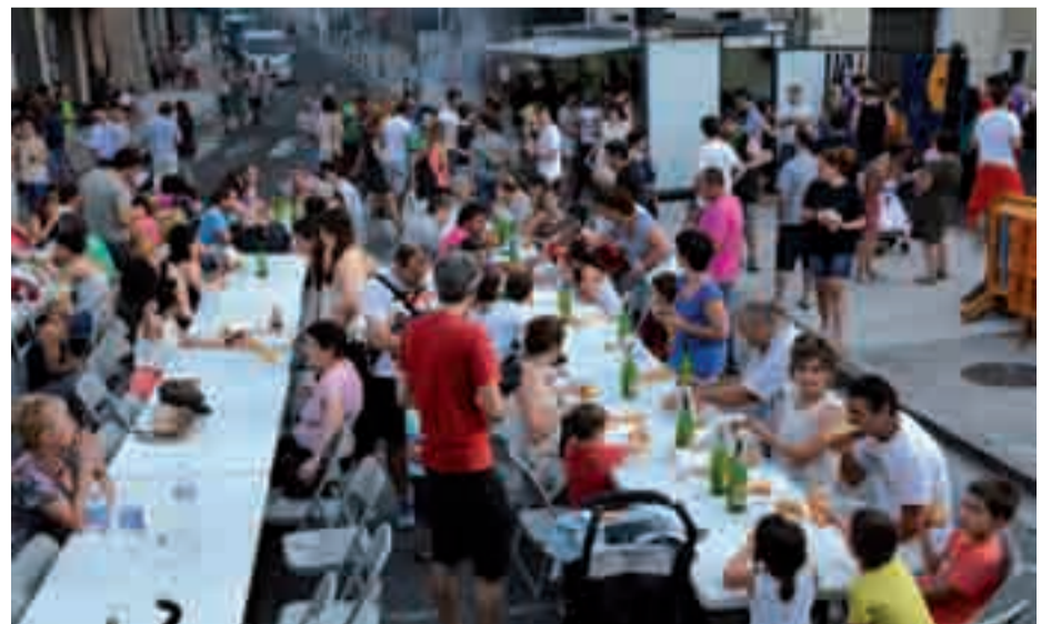
Dozenaka auzotar eta herrikide bildu ziren ostiral iluntzean, jaien hasieran.