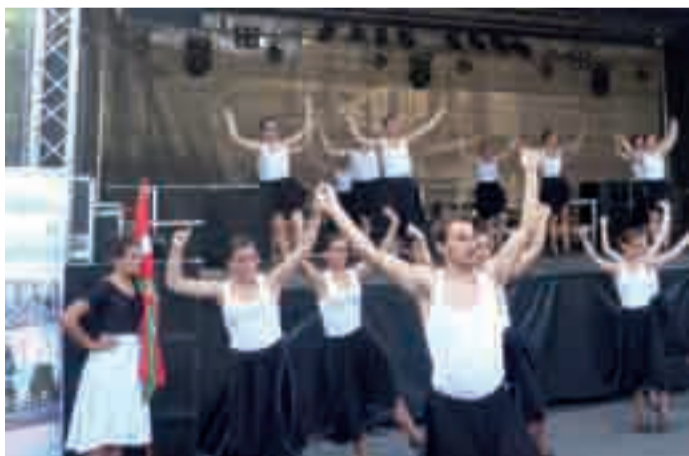
Vilafranca del Penedes herrian dantzan aritu ziren, aurreko asteburuan.

Egape dantza taldeko hogeita lau dantzari Vilafranca del Penedes herrian euskal dantza erakustaldia eskaini zuten, bertako Falcons de Vilafranca taldeak gonbidatuta. Hangoakiazko udahasieran Urnietara etorri ziren eta San Juan plazan giza dorre ikusgarriak egin zituzten. Oraingo honetan urnietarrek Mediterraneo aldera egin dute bidaia,