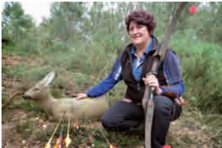
Andoaindarra Gipuzkoako eta Euskadiko txapelketa ugari irabazitakoa da.

A.C. Fisikoki ez dauka esijentzia handiegirik; izatekotan ere, besoetako muskuluak indartzea komeni da. Funtsean, teknika da garrantzitsua; teknikarik gabe, jai duzu. Zenbait alderdi koordinatu egin