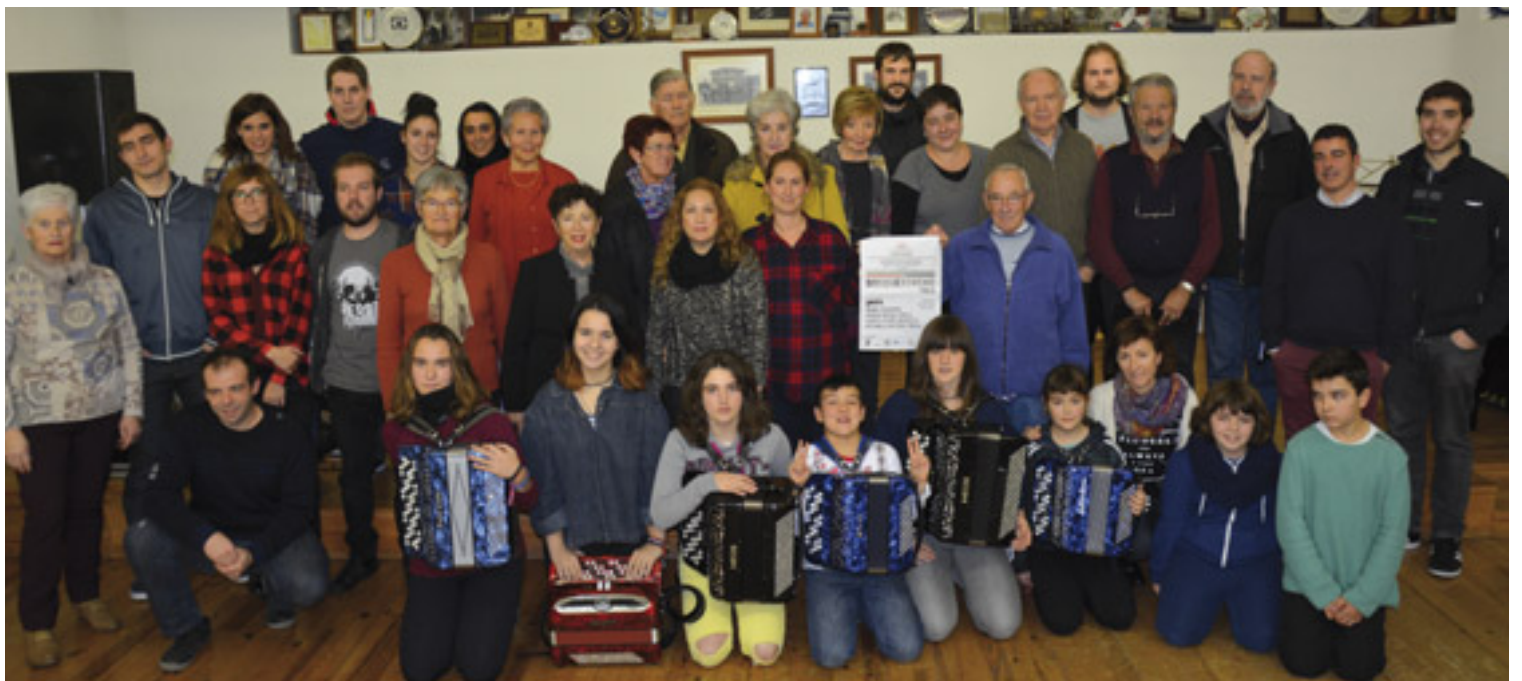
Entseguko argazkian ikus daitekeenez, partaide ugari bilduko dira Basteroko taula gainean.