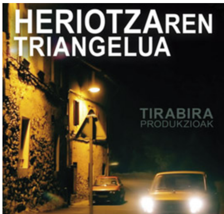
Dokumentalaren kartela. Datorren asteartean Saroben eskainiko dute.