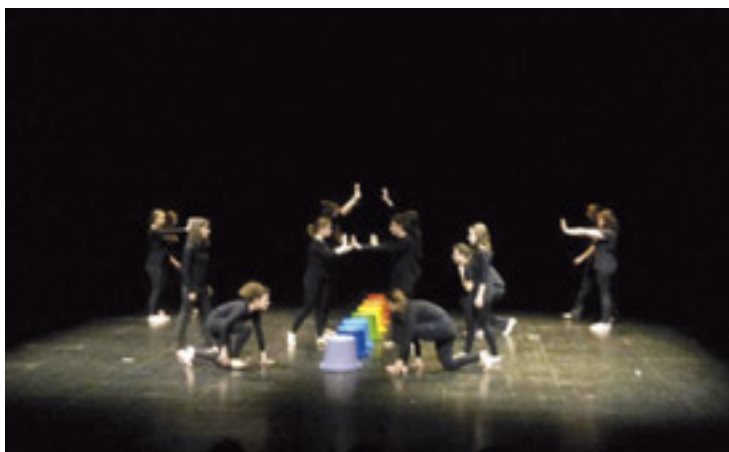
Abenduaren 18an “Hil eta Bizi” antzezlanaren Tolosan eskainiko dute.

Moldaketa horixe izan da prozesu osoaren atalik zailena; heriotzari beste zentzu simboliko bat emanez, Hil eta Bizi eraikitzea. “Bizitzan zehar hain-