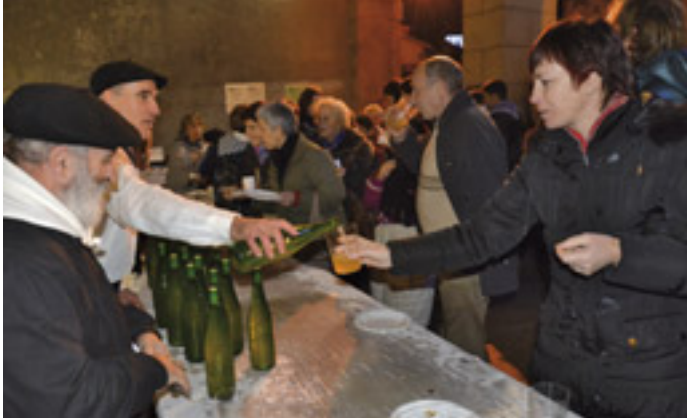
Usadiozko sagardo lehiaketa, Urnietako San Tomas eguneko bereizgarrietakoa.

San Juan plaza eta Kontzejupea herritarren bilgune bilakatuko dira datorren abenduaren 21eko arratsaldean, Iñistorra elkarteak antolatuta egingo den festa dela eta. 17:00etatik, 20:30era luza-tuko da jaia.