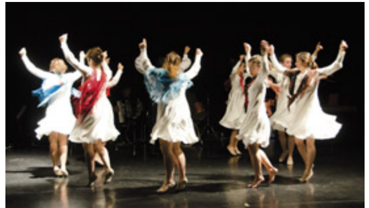
Urtarrilean arrakasta handiarekin taularatu zuten Urnietako Saroben.

Donostiako emanaldia Kutxa Fundazioari esker gauzatuko da “Urnietako emanaldia ikusi ondoren, Donostiara eramateko interesa erakutsi ziguten. Hasieratik gure asmoa izan zen ikuski-