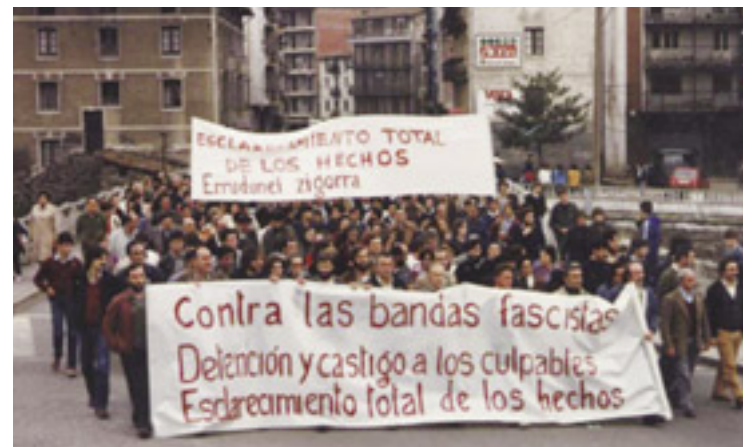
Andoainen heriotzak salatzeke egin zen manifestaziotako bat.

Bi ultraeskuindar horien heriotza eza-gutu bezain pronto, antzeko pentsamen-dua eduki dute garai beltz haiek eza-gutu eta pairatu zituzten herritar askok: estatu sekretu ugari eraman zituztela beraiekin.