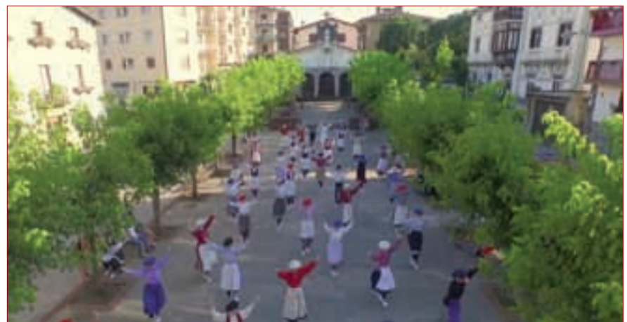
"Urnietta Hegapean" izenburu horrekin Vimeo atarian ikusgai dago mendeurrena gogoan duen bideoa.