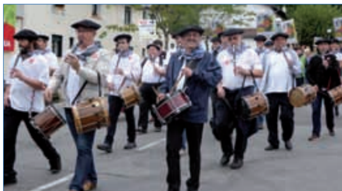
Txistulariak Udaregi ikastola inguruan, tartean Andoaingoak zeuden.