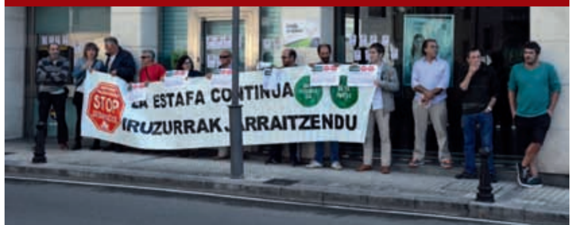
Stop Desahucios elkartek deituta, “Iruzurrak jarraitzen du” lelopean elkarretaratea deitu zuten aurreko larunbat goizean.