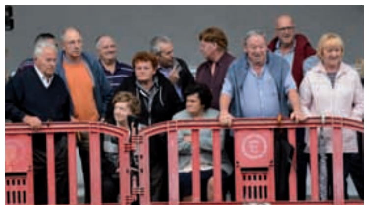
Auzotar eta inguruko jende ugari bildu zen asteartean, arratsalde zein gaueko ekitaldietan.

Benetan badute meritua auzoko gazteek, urtero-urtero ohitura horri eutsiz. Antzerkian batere trebatu gabeak izan arren, lotsak zokoratu, eta ederki animatzen dira jendaurrean antzeztera.