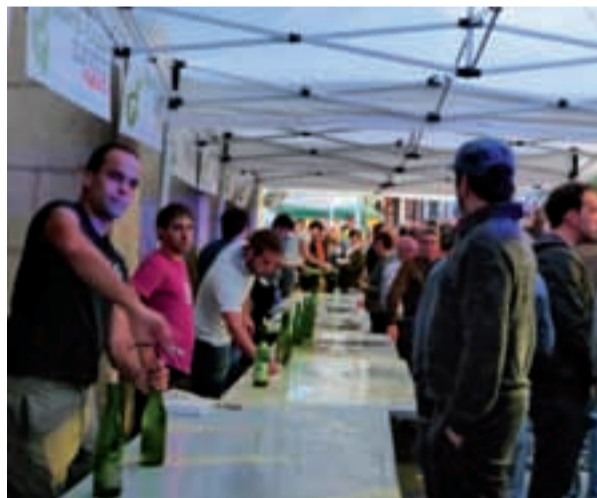
Kontsejupekoa sagardo dastaketarako gune bilakatzen da jaietan.