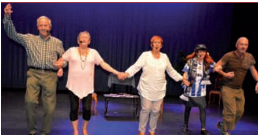
Aurreko ostiral arratsaldean "Ongi etorri Pottoki" antzeziana aurkeztu zuten, harrera beroarekin.