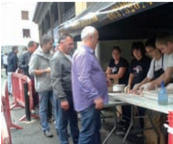
Txekor jatea, ohikoa Errosarioko amabirjinaren ospakizunean.