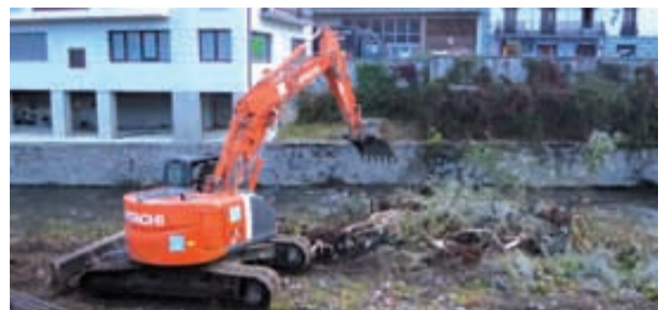
Aste honetan hondeamakinak lanean aritu dira.

Espigoian ondoan, Leitzaran eta Oria ibaiak elkartzen diren gunean garbiketa lanak egiten ari dira. Ibaien ertzak garbitu eta onbideratzeko lanak egin ondoren, dragatzeari ekingo diote. Udalak ohar bidez adierazi duenez, “dragatzearen beharra Andoaingo Udalaren eta herritarren aspaldiko eskaera da”. Urigoeren ondorioz kalteak saihestea premiazkoa da.