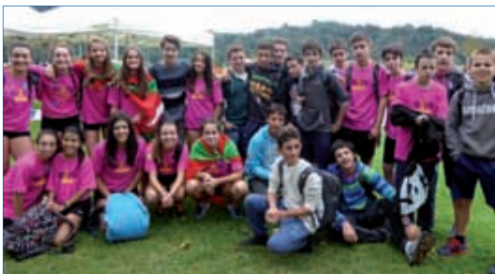
Aita Larramendi ikastolako kide hauek erronkan parte hartu zuten.