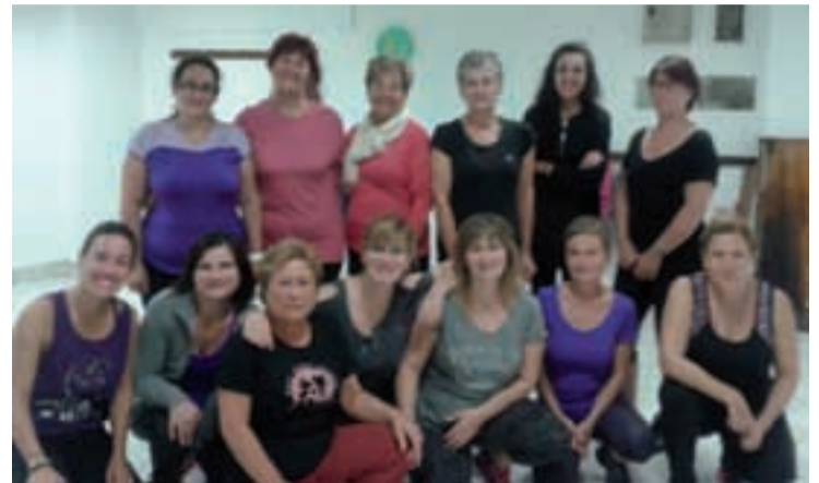
Zumba ikastaroko ikasleak.

Hala ere, atek denontzat irekita daudela eta gazteak ere