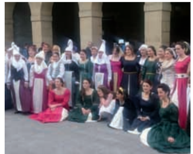
Igandean ere ertaroko giroko dantzariak aritu ziren plazan.