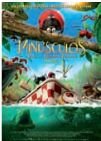
Urriaren 18an zinema saioa eskainiko dute, 16:00tan eta 18:30tan.

Bonoa 2016ko ekainaren 1era arte baliagarria izango da. Sarrera arruntaren prezioa 4 eurokoa da.