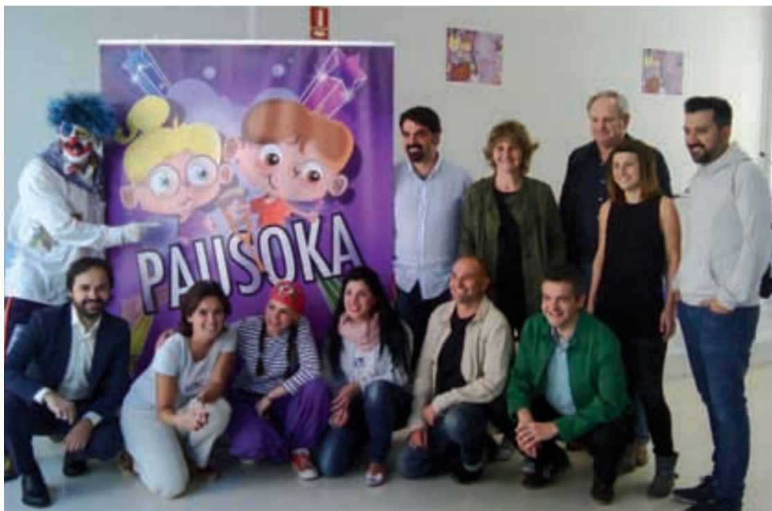
Pausoka elkarteko kideek ospakizunaren xehetasunak eskaini zituzten Urnietan aurreko astean, eskualdeko alkate eta Udal ordezkarien parte hartzearekin.

Ehunka lagun espero dituzte aurtengo Pausoka egunean, Urnietan igande honetan ospatuko dena.