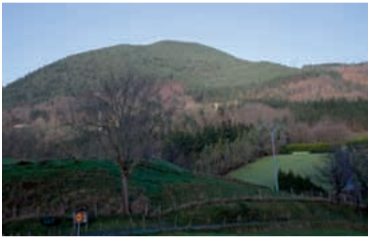
Belkoain, Andoaindik Usurbilerako bidean.

F amilia eta lagun giroan egiteko moduko ibilbideak daude eskualdean, eta horiek sustatzeko Udalek urtean behin ibilbideetan barrena ibiltzeko eguna antolatzen dute. Aurten goa zortzigarren edizioa izango da, eta aurkezpenean adierazi zuten bezala, ibilbideen bitartez "Buruntzaldea eskualdea eta bere landa-ingurune naturala ezagutzeko aukera dugu. Bidezidor eta bide ezberdinak ditugu, landako paisaiatik barrena paseoz gozatzeko, belardiak eta basoak zeharkatuz eta baserri, baseliza, karobi eta, natura nahiz kultura aldetik, interesgarriak diren beste leku batzuetara hurbilduz". Ibilbideak ondoko hauek dira: