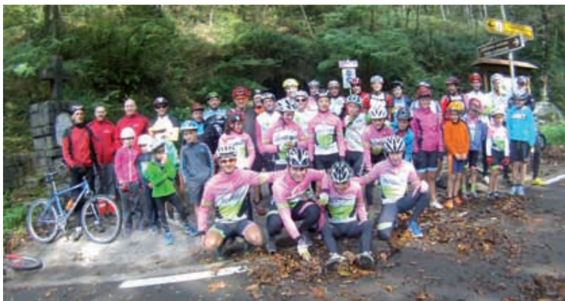
Andoingo txirrindulari eskolako kideak eta lagunak Otietan, aurreko larunbatean egin zuten irteeran.

Udazkenaren iritsierarekin txirrindulariek denboraldiari amaiera ematen diote, eta Andoingo txirrindulari eskolako amierako ospakizun modura lagun arteko irteera antolatu ohi du Olloki aldera. Goikoplazatik irten ziren, eta hamaiketako egin ondoren, herrigunera itzuli ziren. Bertan egin zuten taldeko argazkia, denboraldiari amaiera ematen diona. Merezitako atsedena hartu eta gero, datorren urteko martxoan ekingo diote errepideko denboraldi berriari.