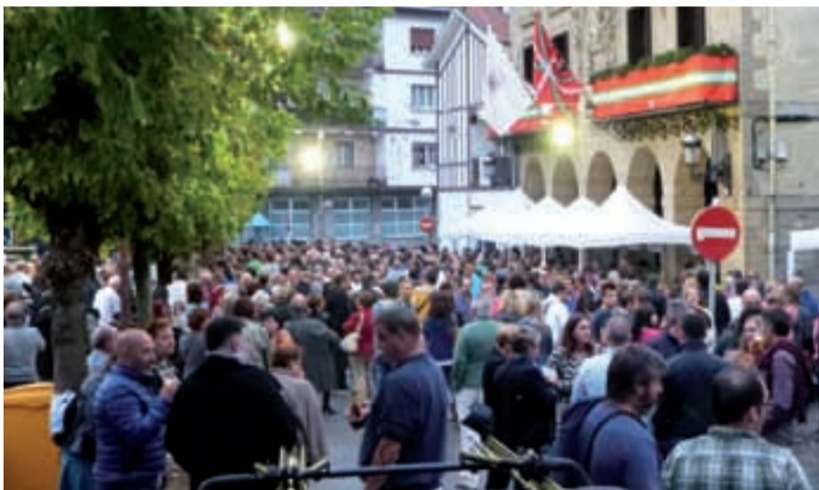
San Juan plazan sagardozale eta festazale ugari bildu zen.

tzaldia izan ziren jaietako azken eguneko osagai nagusiak. Bi aste-burutan dozenaka ekitaldi antolatu dituzte Urnietan; aurtengo jaiak ere oparoak izan dira.