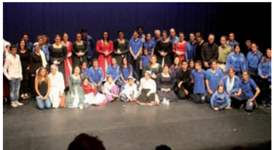
Aurreko larunbat arratsaldean dantza saioa eskaini zuen Aurrera Gure Ametsa taldeak, Saroben. Euskal dantzak, asturiar folklorea eta errenazimenduko dantzak eskaini zituzten.