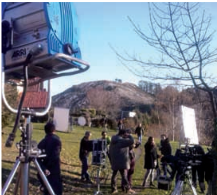
Profesionala ez den eta Andoainen bizi, ikasi edo lan egiten dutenek izango dute parte hartzeko aukera.