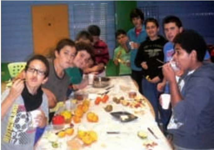
Gazteak aurreko ostiralean, mazedonia tailerlean.

Udazkenarekin batera, tailer berriak jarri dituzte abian Gazte Lokaleko kideek. Urriaren lehen egunetan, mazedonia tailerra egin zuten. Hala, merienda goxoa izan zuten bertara hurbildutako gazteek. Bufanda tailerra aurrerago egingo dute, negu giroa hasten denean.