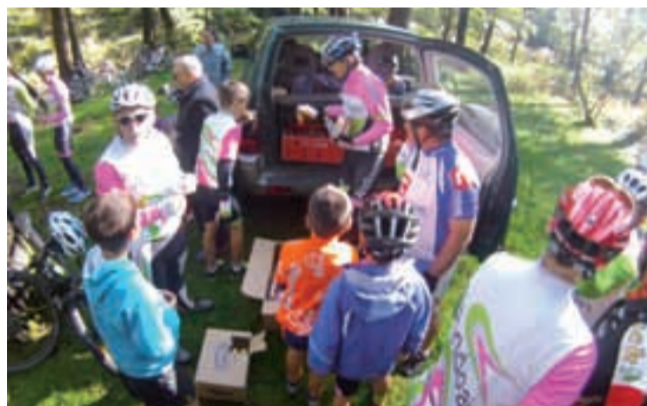
Hamaiketako egin ondoren Goikoplazarako bidea hartu zuten.

Udazkenaren iritsierarekin txirrindulariek denboraldiari amaiera ematen diote, eta Andoingo txirrindulari eskolako amierako ospakizun modura lagun arteko irteera antolatu ohi du Olloki aldera. Goikoplazatik irten ziren, eta hamaiketako egin ondoren, herrigunera itzuli ziren. Bertan egin zuten taldeko argazkia, denboraldiari amaiera ematen diona. Merezitako atsedena hartu eta gero, datorren urteko martxoan ekingo diote errepideko denboraldi berriari.