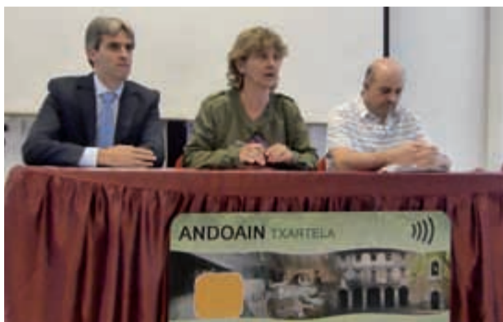
Rural Kutxako, udaletxeko eta Salkineko kideek aurkeztu zuten ekimen berria.