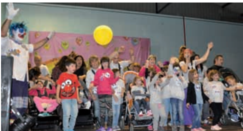
Pausoka elkarteko kideak pailazoaren ikuskizunaren azken kantuan igo ziren taula gainera.