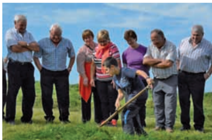
Beizama, Gaztelu, Lizartza eta Beteluko segalari gaztetxoek ikusleen harridura piztu zuten, belarra mozteko orduan erakutsi zuten trebeziagatik.