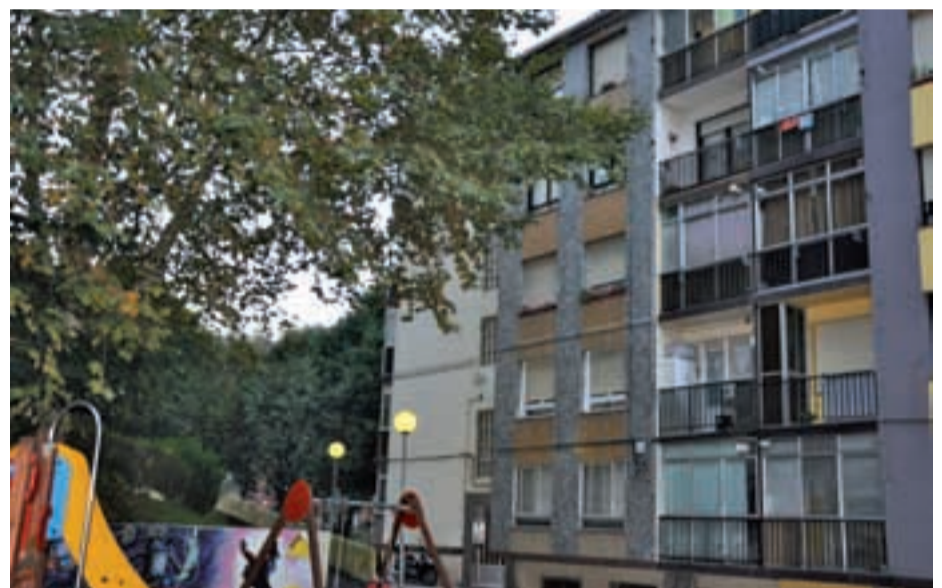
Bazkardo plazan zuhaitz horren adarrak leihoetara iristen dira. Plazan beheara, N1 errepediruntz joanda, tamaina handiko zuhaitz gehiago dago etxebizitzetatik oso gertu.