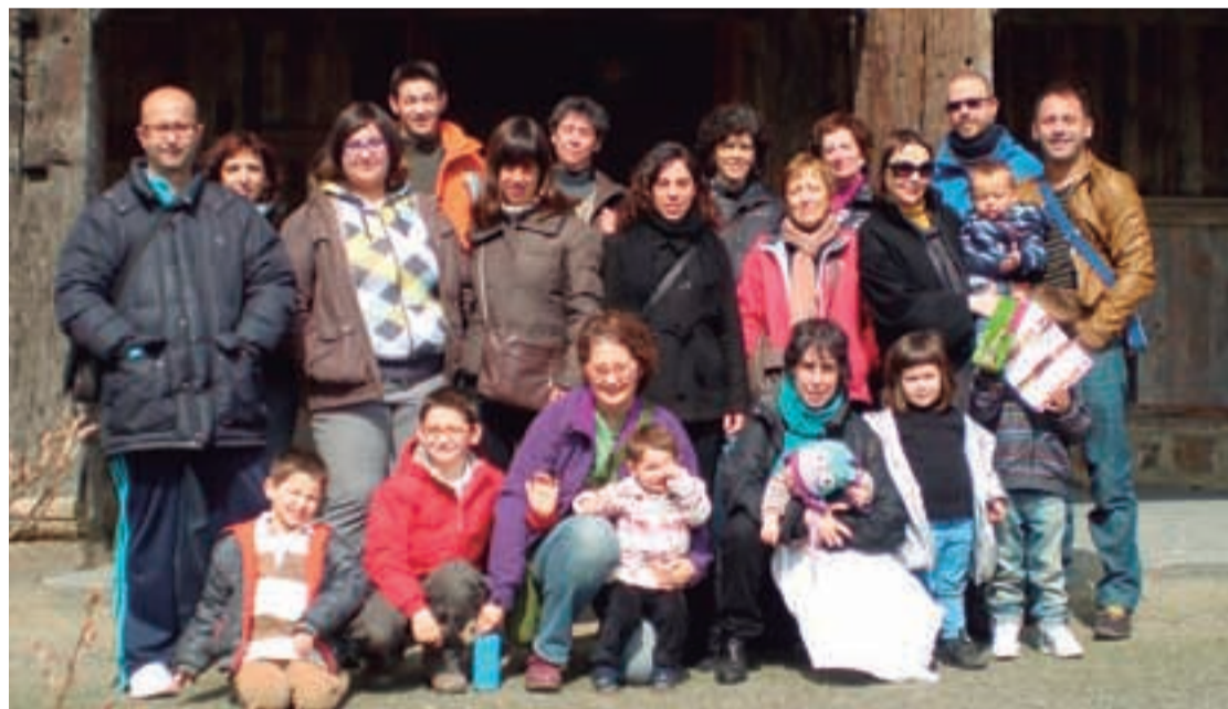
Mintzalagun talde bat, Igartubeiti baserriari eginiko bistan. "Aipamen berezia merezi dute bolondres lanetan jarduten duten lagunek edo euskaldun zaharrek".

Talde txikiak izaten dira, guztira 3-6 bidelari eta bidelagunez osaturikoak. Bai, bidelari eta bidelagunez ari gara. Termino hauek argitze aldera; bidelariak, euskara ikasi edo hobetzen ari direnak izendatzeko baliatzen da egun. Eta