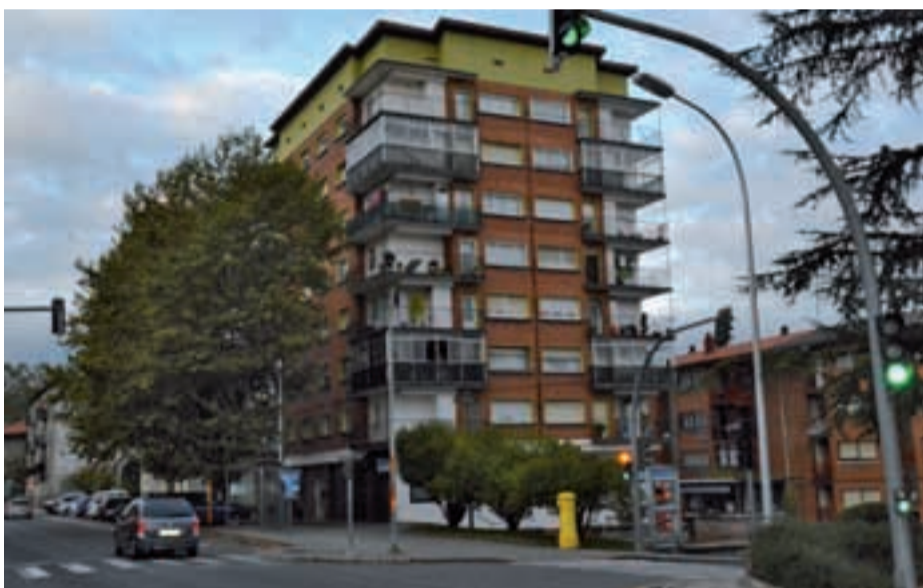
Karrika kaleko seigarren zenbakiaren pareko zuhaitzak tamaina handia hartu du. Leihoetara gerturatzeko dira dagoeneko zuhaitzaren adarrak.

kaz gain, bilera ezberdinetan herritar batzuk zuhaitzen tamainarekin edota zuhaitzek botatzen duten erretxinarekin kezka agertu dute. Irtenbideak eskatu dizkiote Udalari.