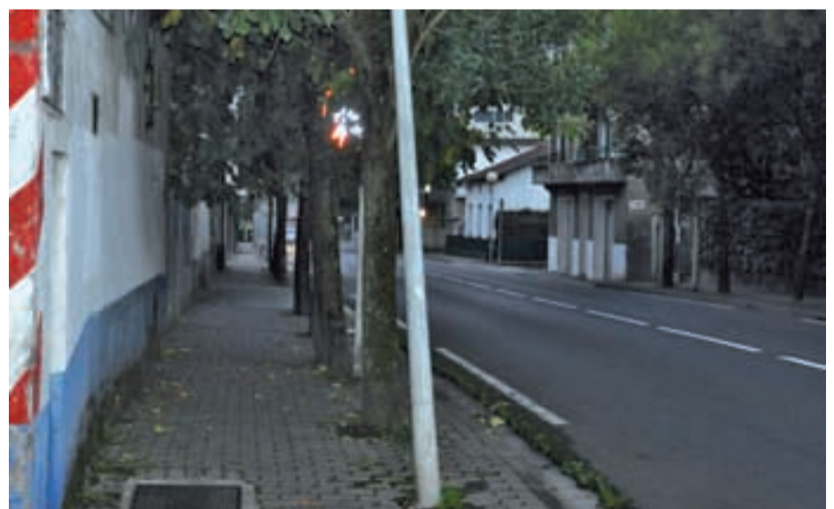
Ama Kandida etorbidean eta Bazkardo inguruan oinezkoen pasabidean zuhaitz ugari dago. Irudiko zuhaitzaren adarrak behearantz joera hartu dute, oinezkoengana geroz eta gehiago hurbiltzen ari direlarik.