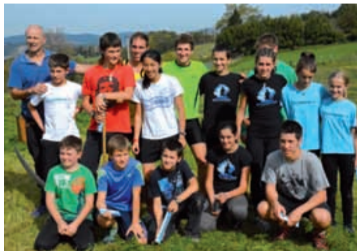
Sega desafioan eta ondorengo erakustaldian parte hartu zuten segalariak.

sieratik hartu zuen aurrea mutilek osatutako bikoteak, eta abantailari eutsi zioten amaierara arte. Emozioa piztu zen azken minutuetan.