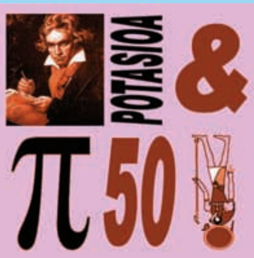
Ikasgelako ikasle onenen izenak