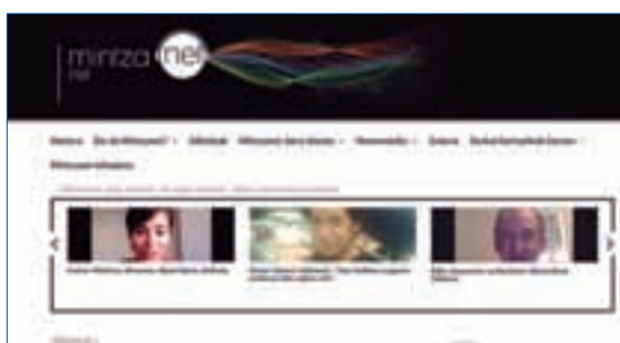
"Munduko edozein txokotan egonda ere, euskaraz hitz egiteko aukera eskaintzen du".

Gugandik gertu edo urrun, edozein lekutan euskaraz aritu nahi dutenen artean elkar komunikatzeko beste tresna bat; hainbat erakunde eta eragileek sustaturiko Mintzanet proiektua. "Munduko edozein txokotan egonda ere euskaraz hitz egiteko aukera eskaintzen duen proposamen berritzailea. Internet bidez, noiznahi, euskaraz mintzatzen diren lagunak topatuko dituzu. Oso erraza da! Zeuk aukeratuko duzu ordua edo zer gairi buruz hitz egin". Aurrez aurreko mintzapraktika saioetan bezala, bidelagun eta bidelariak arituko dira euskaraz. B1 maila beharko du bidelari edo "euskaldun berriak". Informazio gehiago: mintzanet.net .