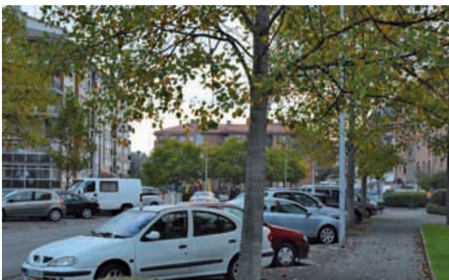
Zuhaitzen erretxinak ibilgailuen kristala eta karrozeria kaltetzen du. Baita espaloiak zikindu ere. Irtenbidea emateko eskatu zioten Udalari, Karrikan egindako auzo bileran.