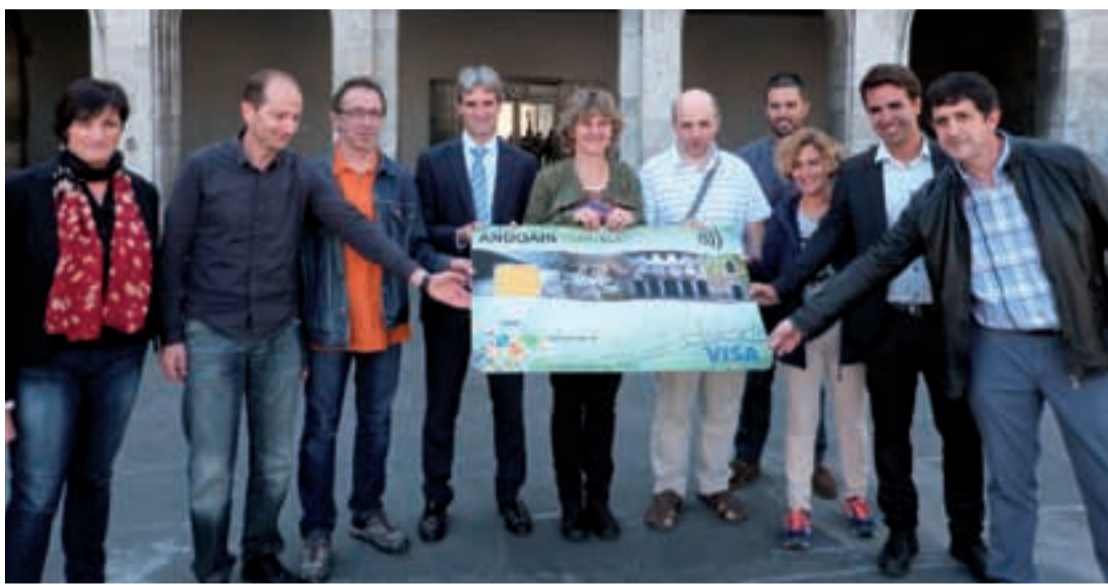
Udal ordezkariak, Udal teknikariak, Salkineko ordezkariak eta Rural Kutxako arduradunak "Andoaingo hiri txartelaren" aurkezpen ekitaldian. Aurkezpen ekitaldia bideoz ikusgai dago, aiurri.com webgunean.

Hitza beste eragileei eman aurretik, elkarlanaren garrantzia azpimarratu zuen, "txartela martxan jartzeko prozesu guztia elkarlanean egin da eta hori nabarmentzea garrantzitsua da. Egitasmoa aurreko agintaldian Merkataritza mahian abiatu zen merkatariak, Udal teknikariak eta alderdi guztiak bertan ordezkaturik zeudela".